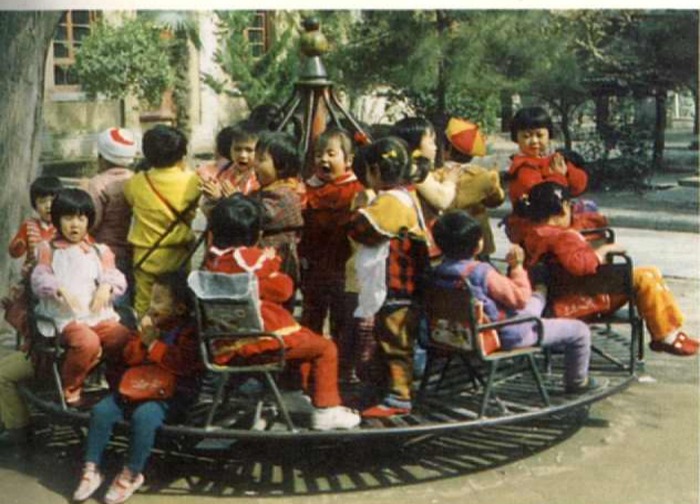
↑ 耀县城关镇南街幼儿园