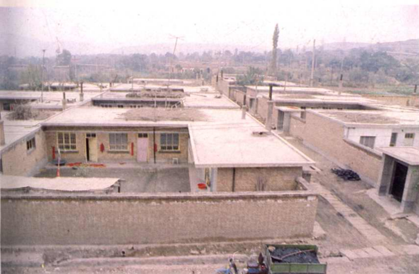
←城区黄堡镇五星村农民住宅(局部)