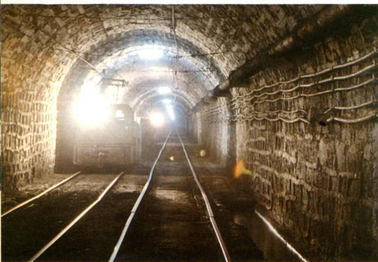
←铜川矿务局陈家山煤矿 平硐运输大巷。