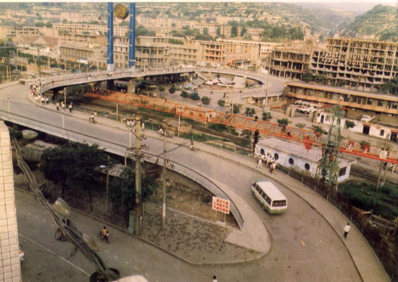
↓ 位于市区中部的大同立交桥