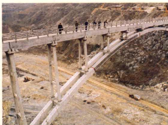
↑ 市沮河取水工程(局部):长达 98 米的沮水渡槽,系陕西省最大的单渡槽