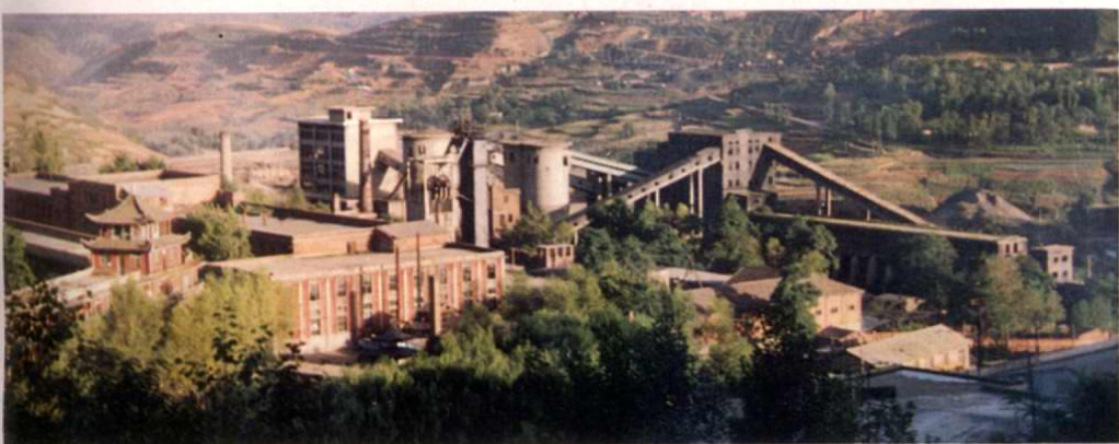
←铜川矿务局 王石凹煤矿