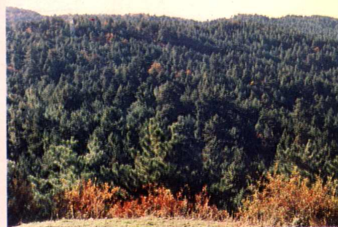
↑ 郊区焦坪林场水海子林区