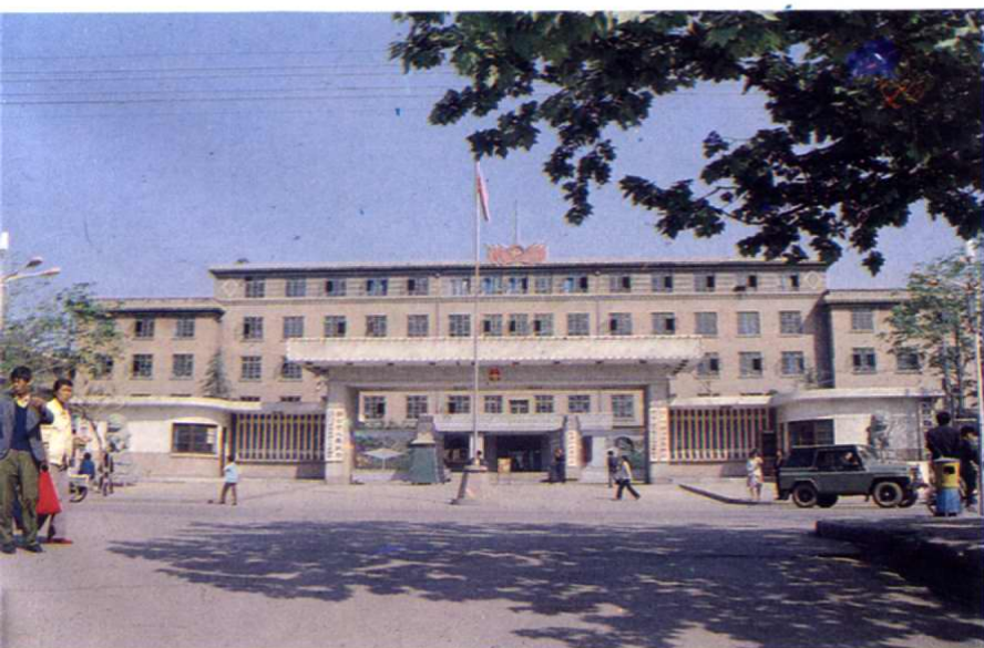
← 中共铜川市委、 铜川市人民代表大会 常务委员会、 铜川市人民政府、 政协铜川市委员 会办公大院