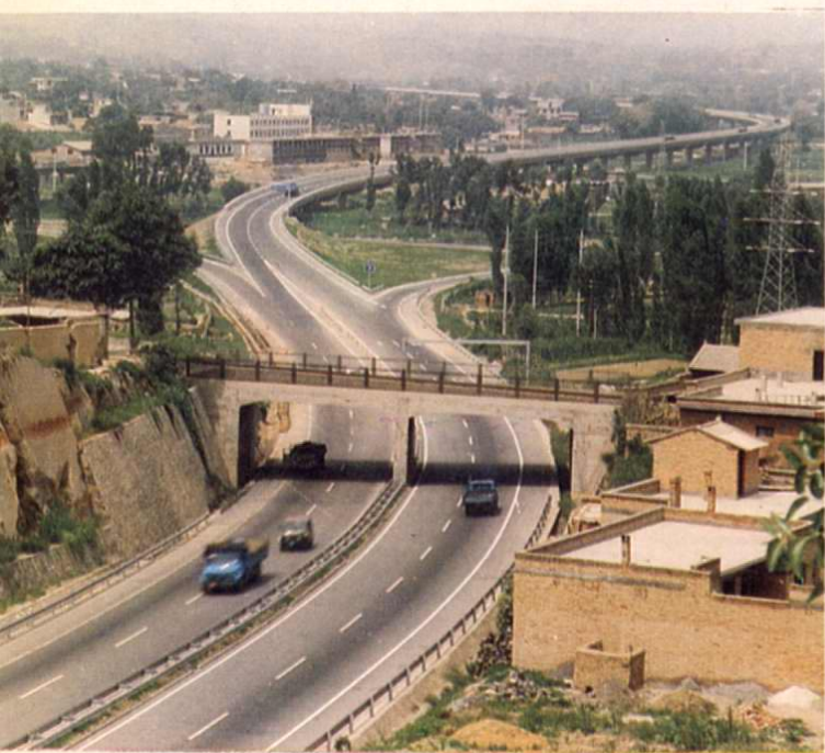
↓ 西安—铜川一级公路耀县县城外高架桥