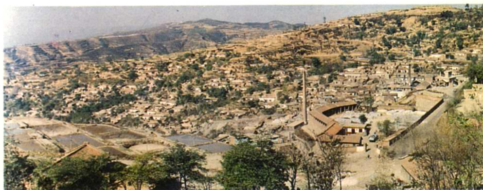
↑ 坐落于郊区陈炉镇的陈炉陶瓷厂