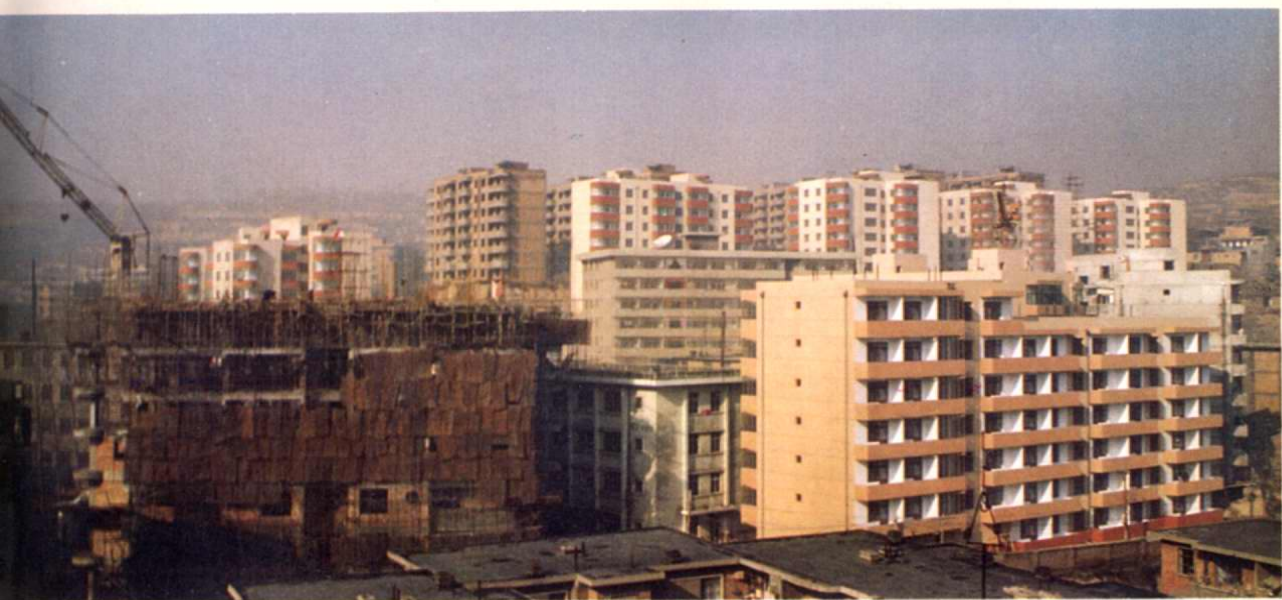
↓市安居工程(局部):红旗街育才花园小区