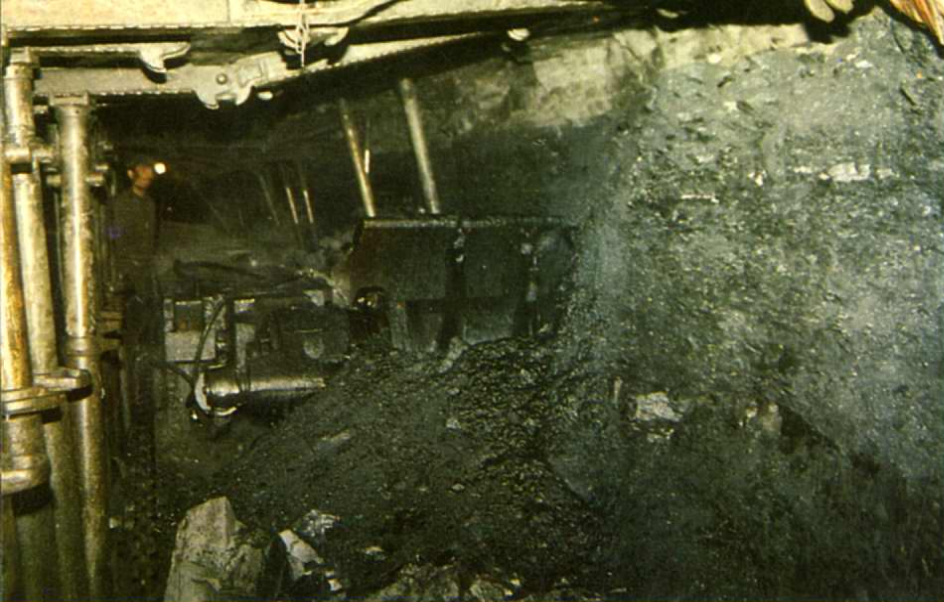
煤矿 ← 铜川矿务局 机械化采煤 工作面 王石凹