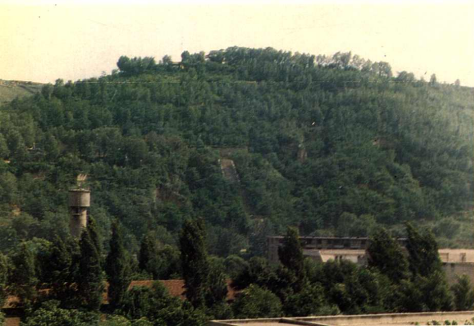
← 市翠屏工程(局部):绿市区川道两侧直观山坡