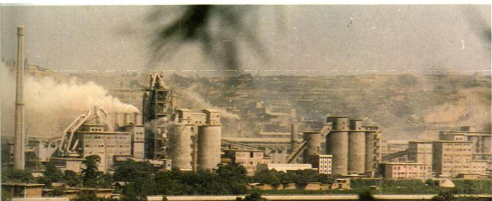
↑ 陕西省耀县水泥厂生产区