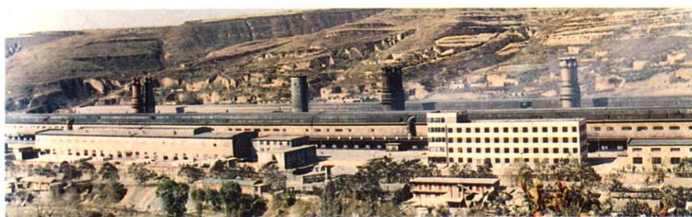
↑ 铜川市铝厂电解铝车间(局部)