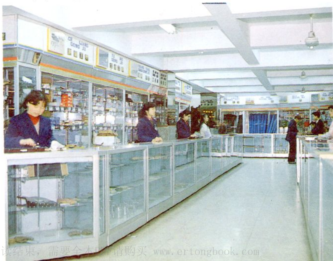
6. 金华市五金交电化工公司营业大楼商场