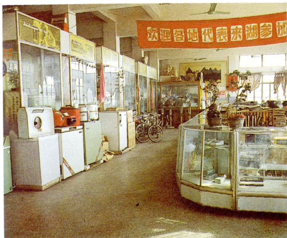
14. 湖州五金交电化工批发公司商场