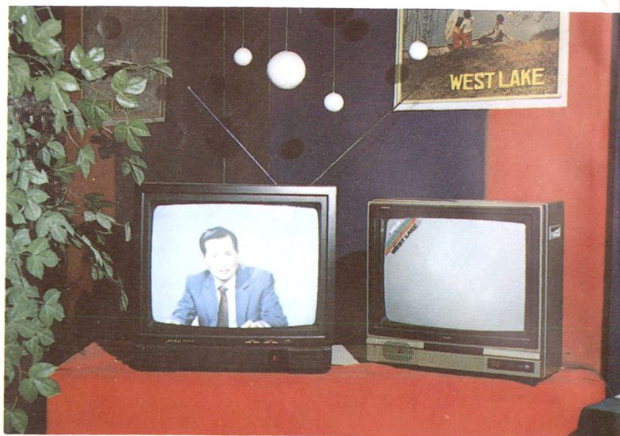
15. 杭州西湖牌彩色电视机