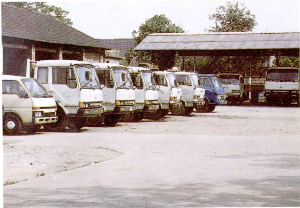
13. 杭州五金交电化工公司汽车队