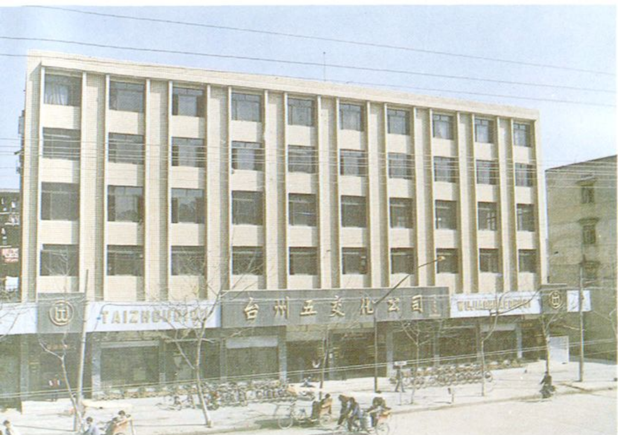
9. 台州五金交电化工公司营业大楼