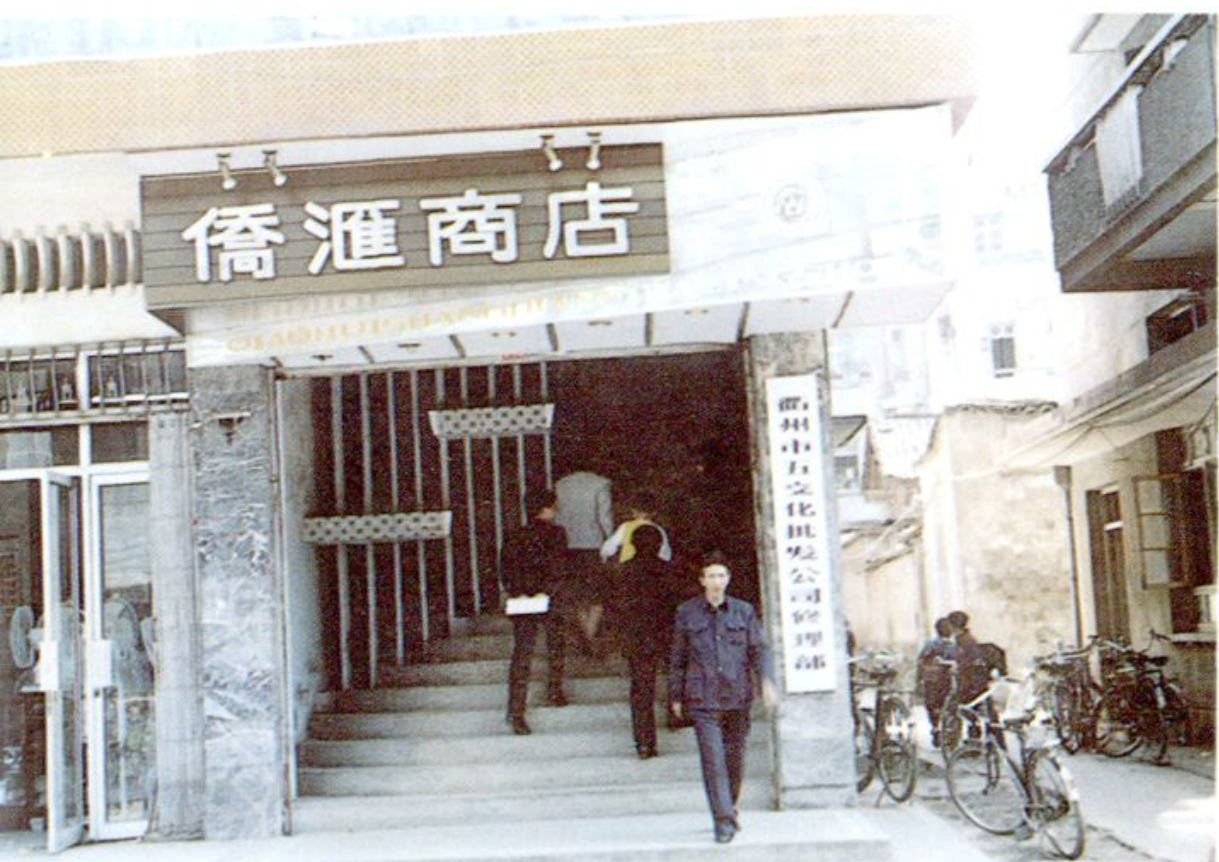
10. 衢州市五金交电化工公司侨汇商店