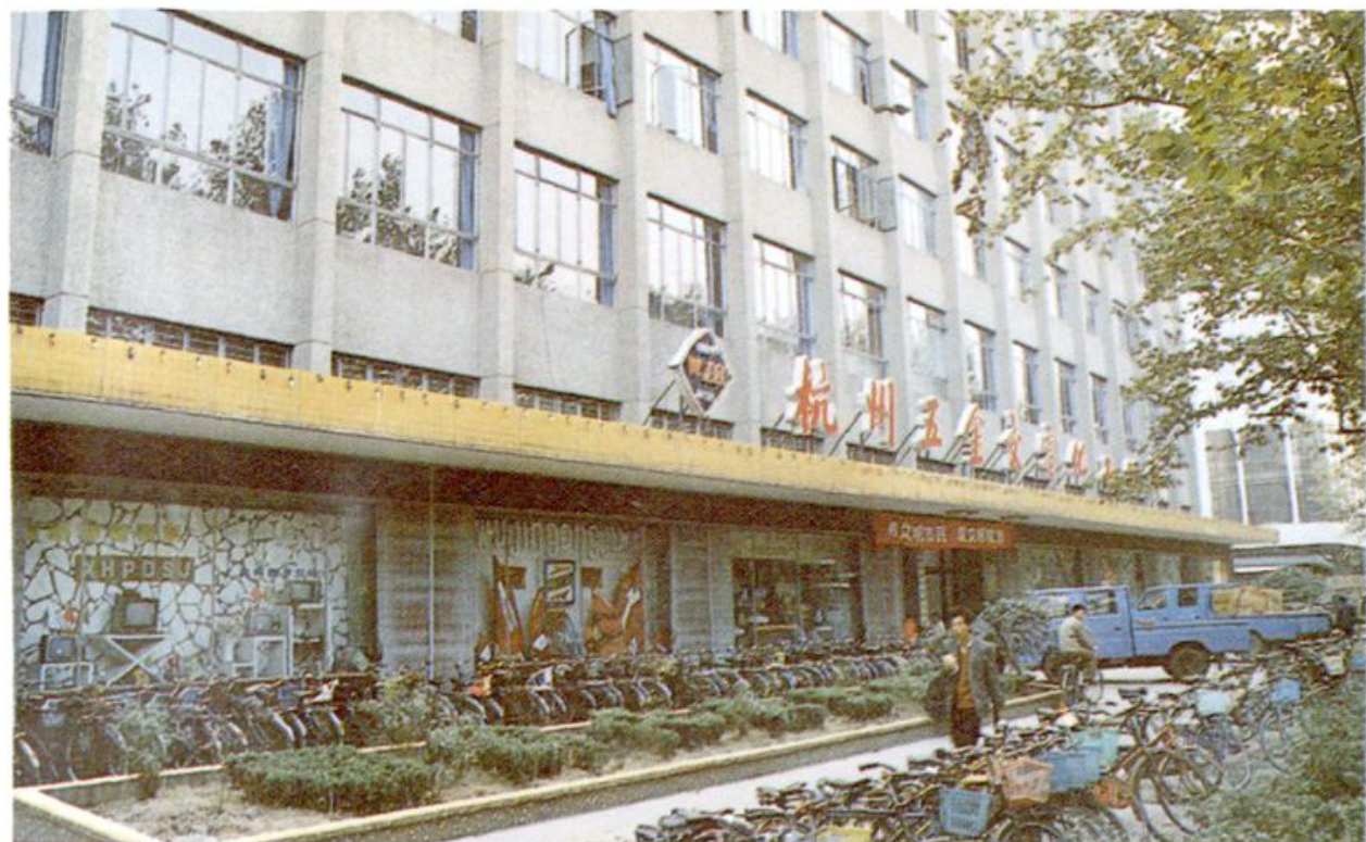
1. 杭州五金交电化工公司营业大楼