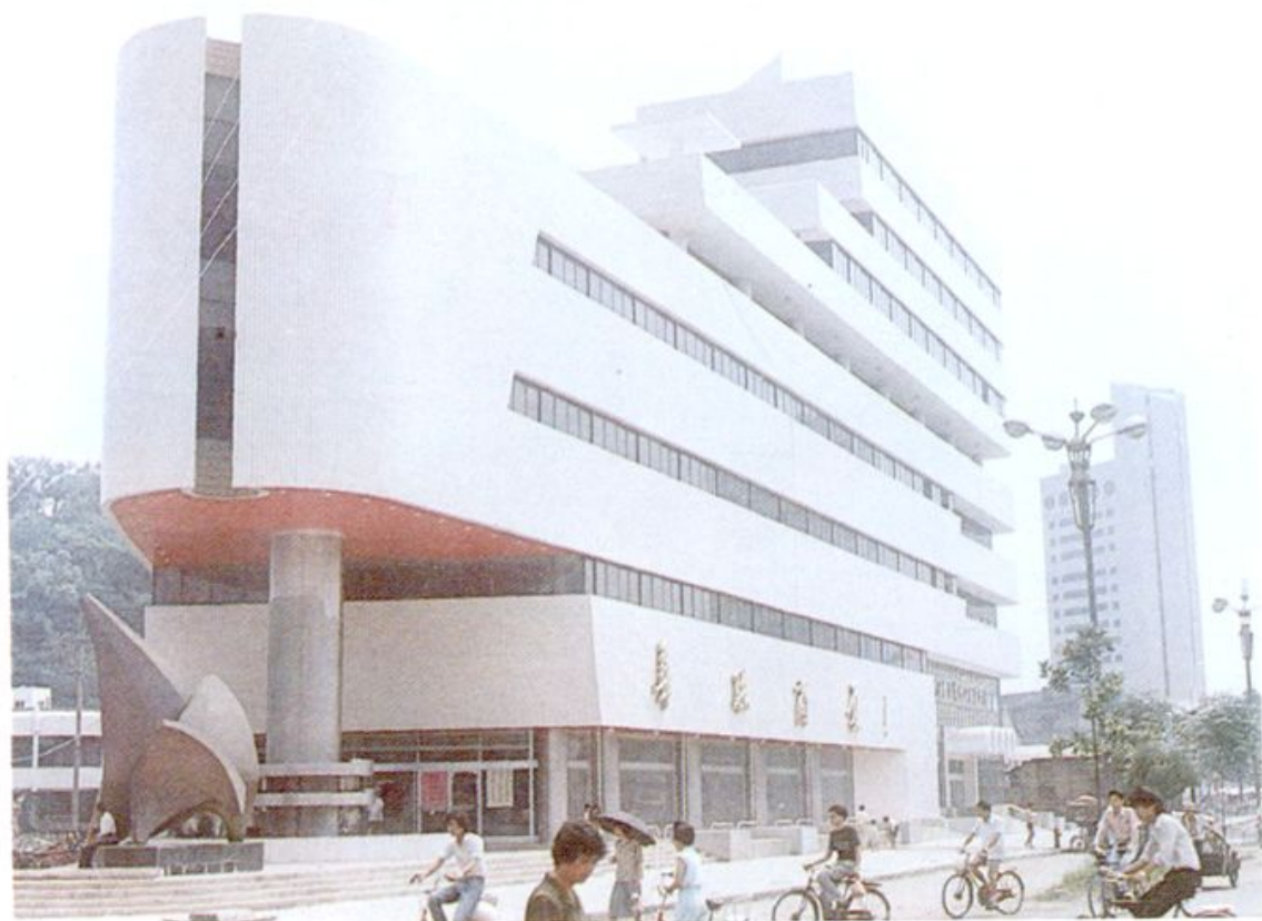
5. 温州市五金交电化工公司营业大楼