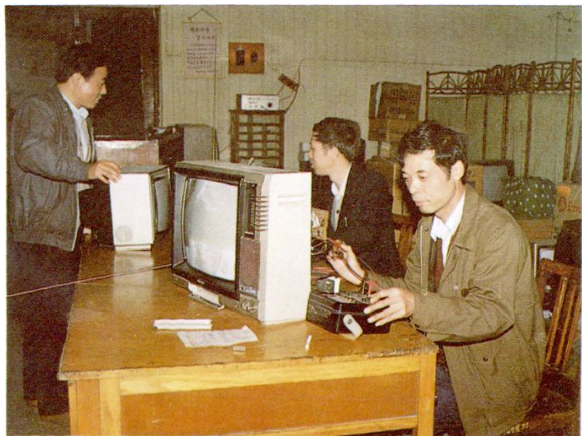
2. 杭州家用电器维修服务中心