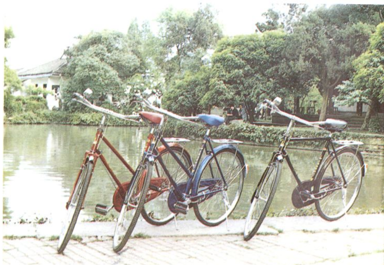
16. 绍兴凤凰牌自行车