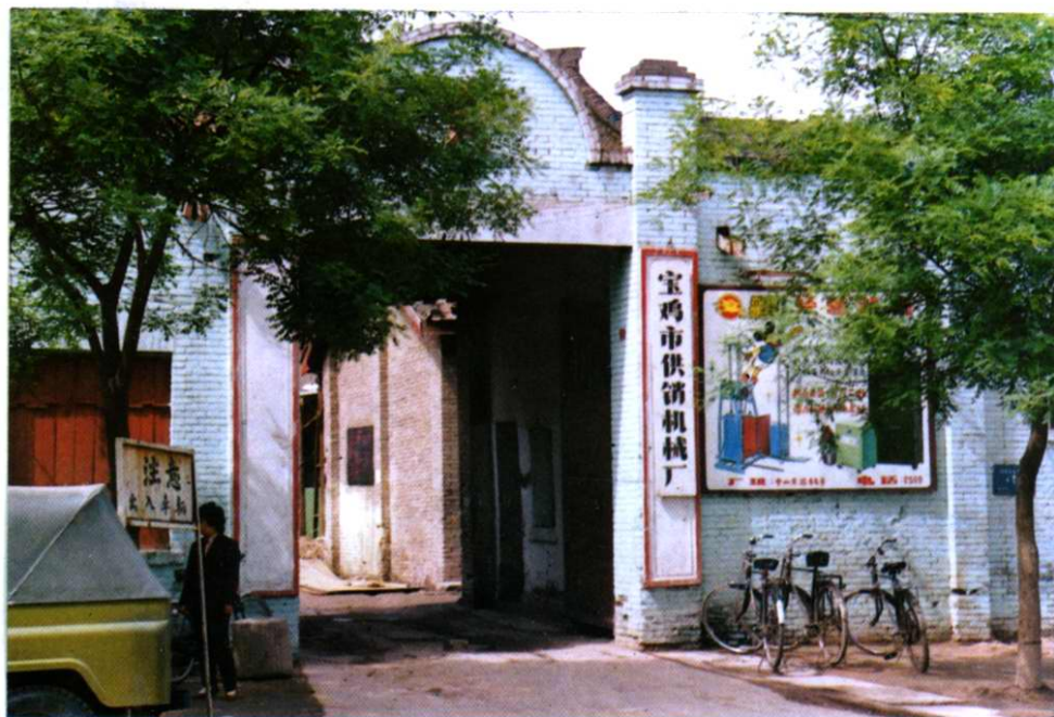
市供销机械厂厂址