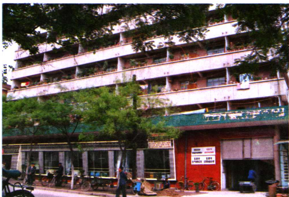
市生产资料公司办公楼