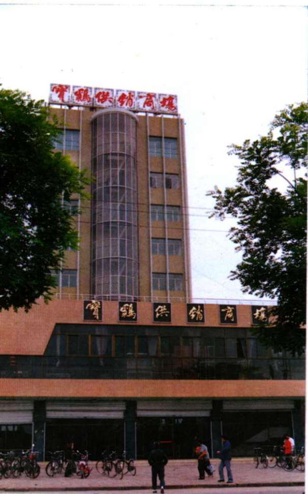
市物资回收公司办公楼