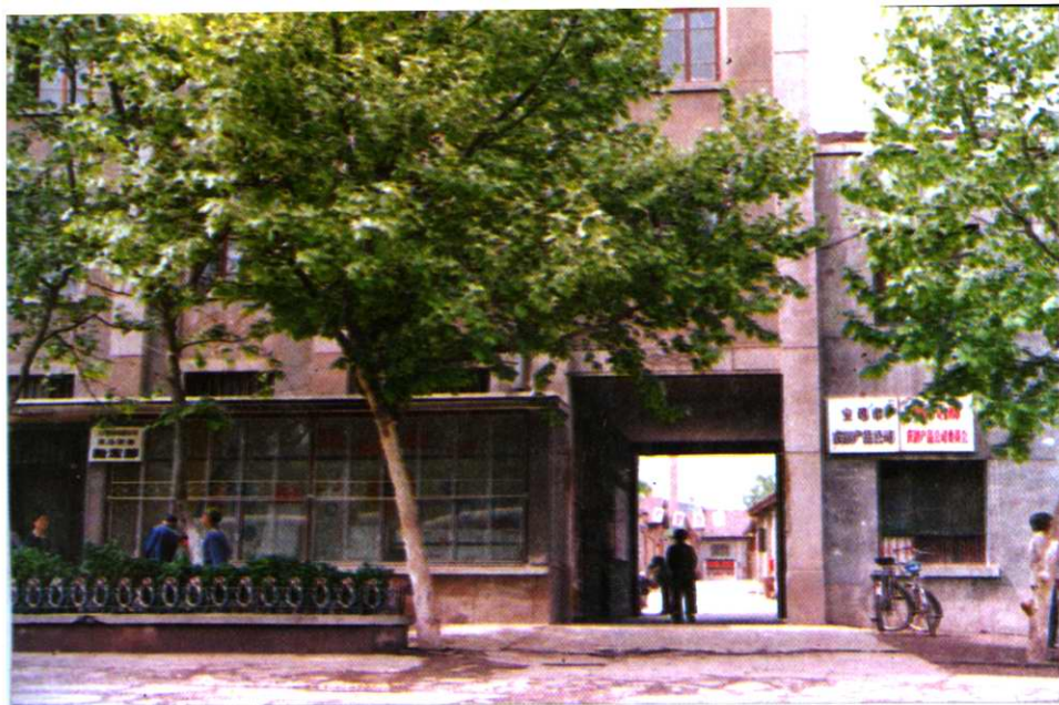
市农副产品公司办公楼