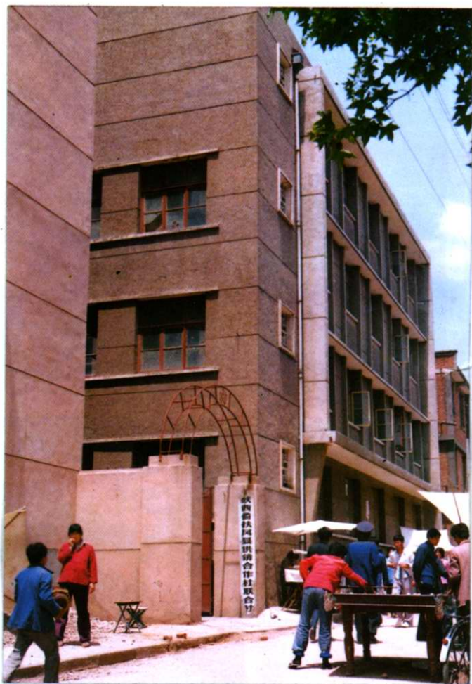
扶风县供销社办公楼