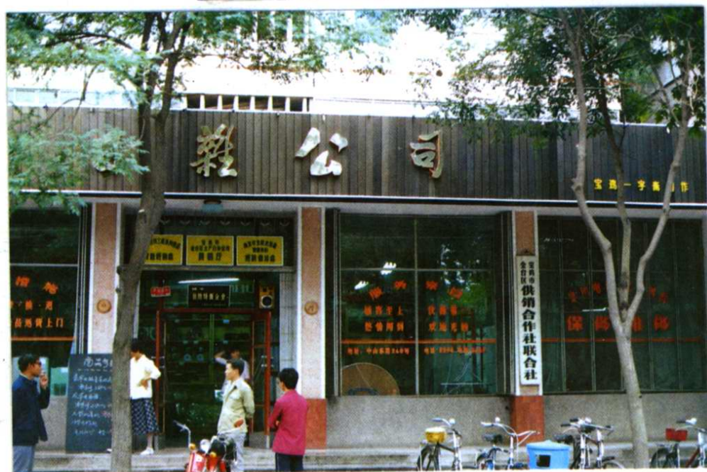
金台区供销社办公楼