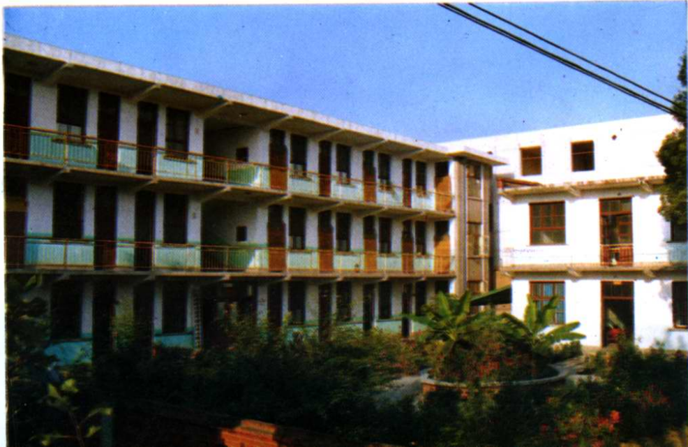
眉县供销社办公楼