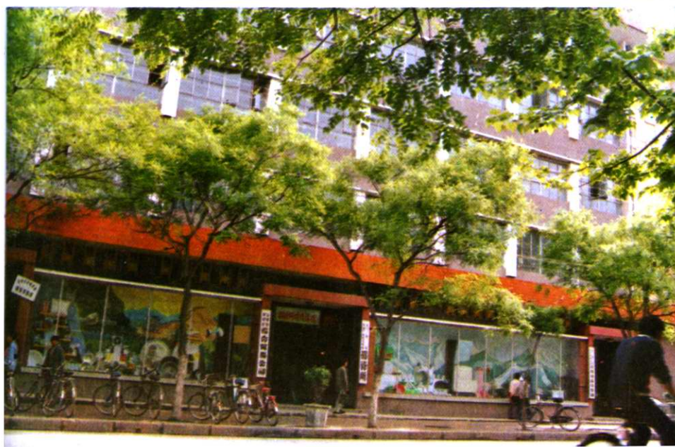
市供销社综合贸易公司办公楼