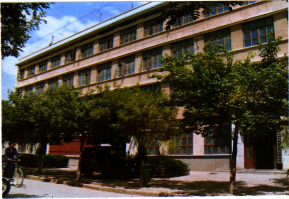
凤翔县供销社办公楼