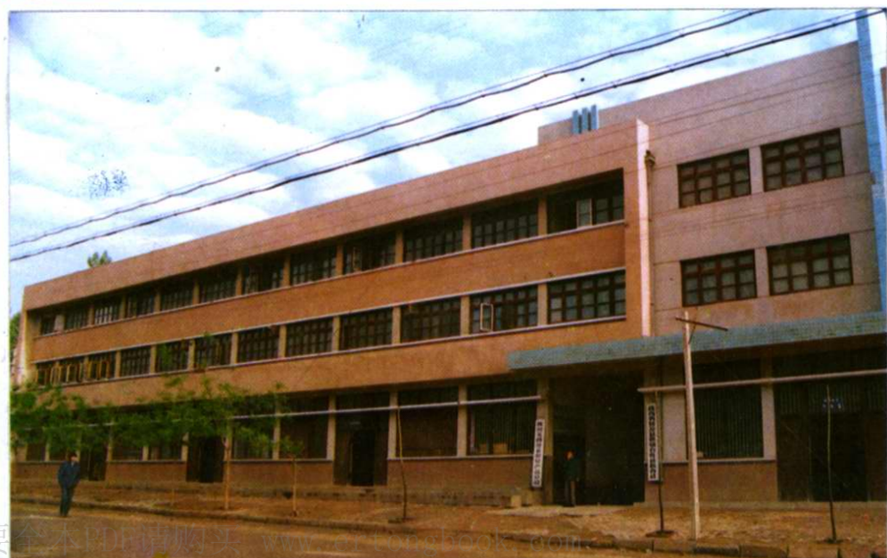
麟游县供销社办公楼