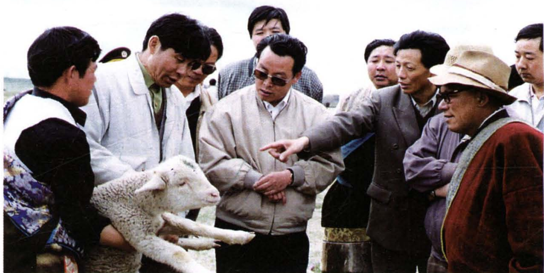
省委副书记、省长田成平视察绵羊改良工作情况