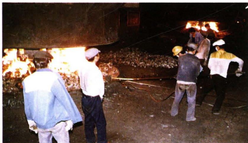
利用当地资源发展乡镇企业，图为民和县硅铁厂的生产情景。