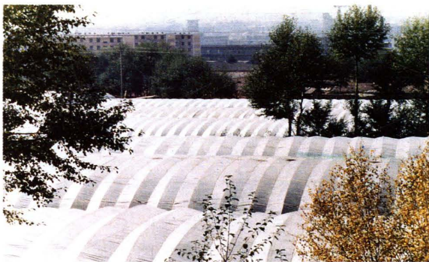
西宁市农村建设塑料大棚种植蔬菜