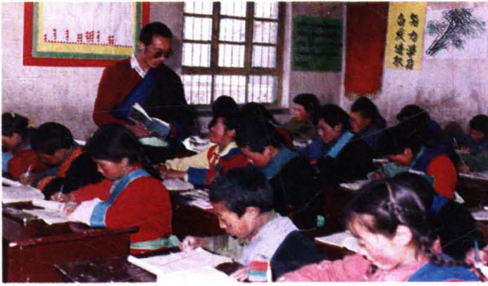
共和县英德乡中心寄宿学校，认真抓教育。图为学生上藏语文课。