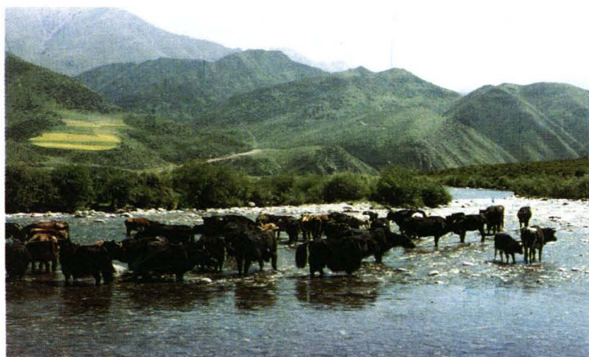
大通县宝库乡培育的改良牛群,宜放牧,好饲养,产出率高。