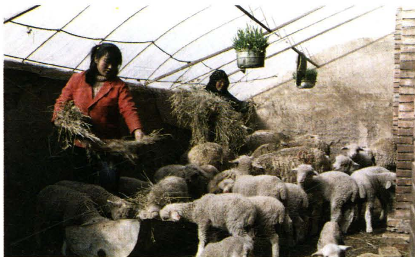
在高海拔的门源县开始实施塑料暖棚养羊