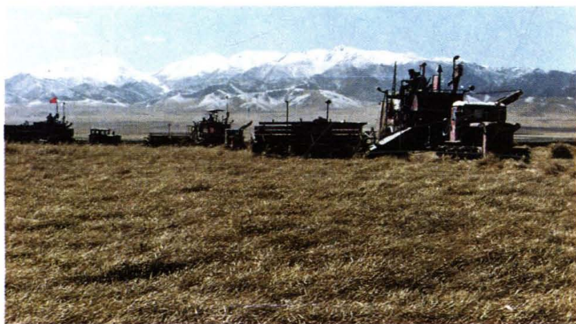
农业机械化水平不断提高，基地实行大面积机械收割