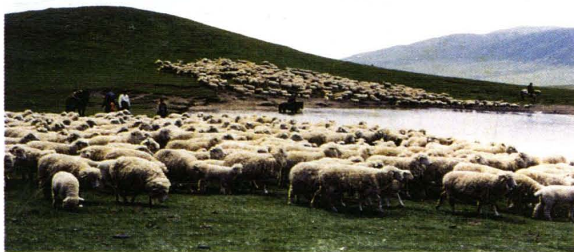
海晏县实施科技兴牧,效果显著。图为他们培育的毛肉羊兼细毛羊。