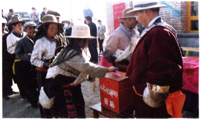
随着改革的深化农牧民的民主权利得到充分发挥，基层政权建设得到加强。图为换届选举中牧民投下庄重的一票。