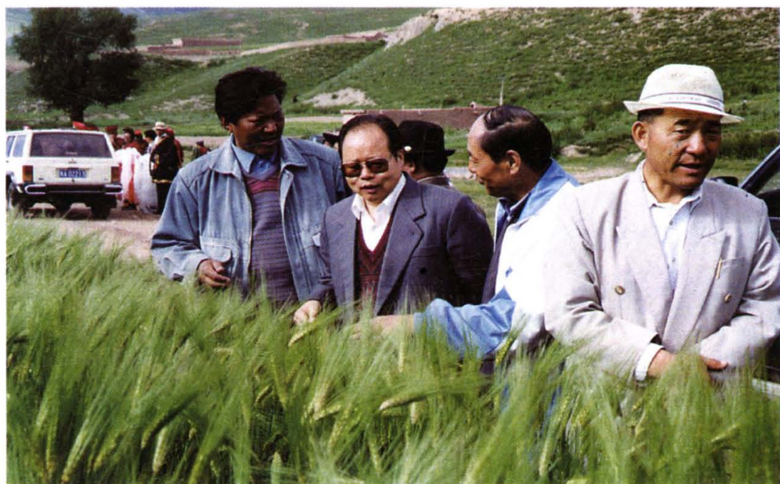
副省长刘光和在玉树州昂欠县视察农业生产