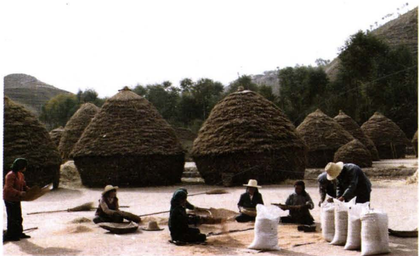
家庭联产承包后粮食连年丰收