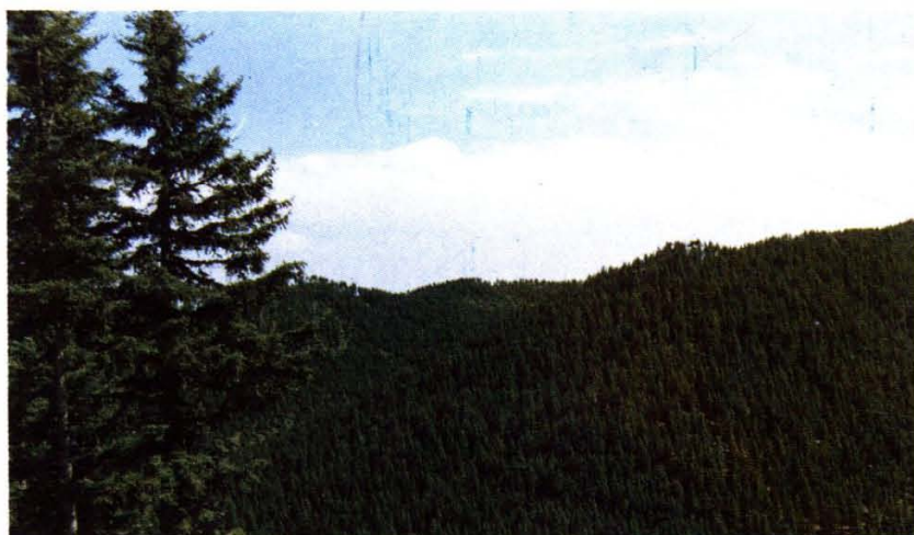
青海东部林业发展较快,效益极佳,图为乐都县下北林区