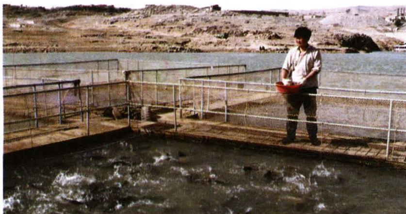
青海水资源丰富，适宜发展高原企业，图为在水库实施网箱饲养虹鳟，经济效益十分可观。