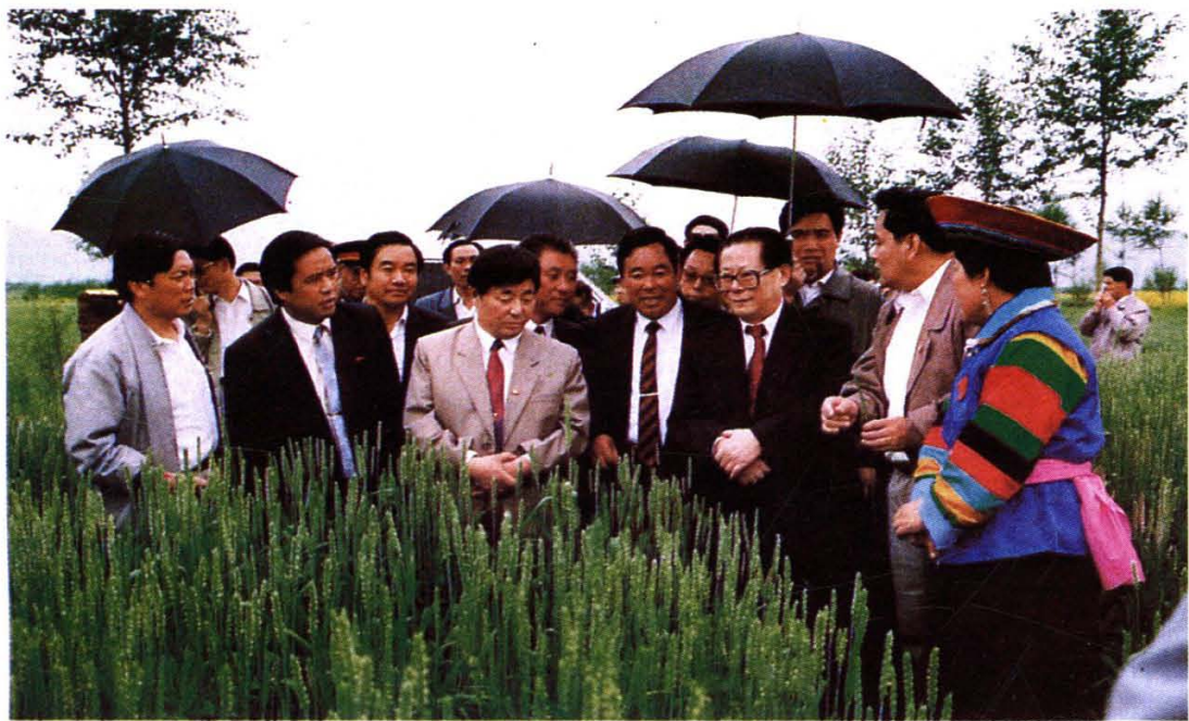
江泽民总书记在青海省互助土族自治县农村视察工作 1993年7月