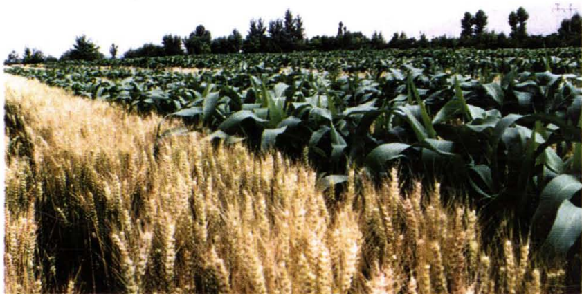
海东农村的间套复种吨粮田