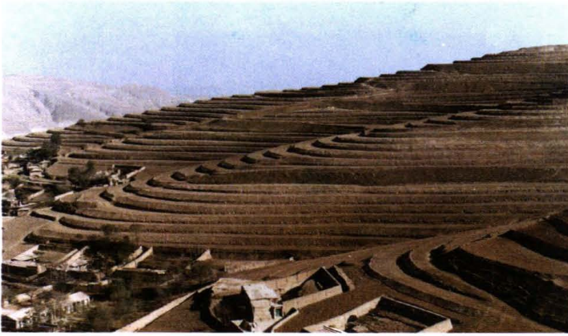
浅山地区开发水平梯田,促进农业稳产高产