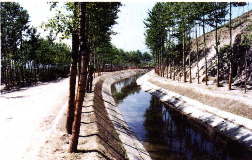
引水灌溉成绩显著,图为湟中县永谷川渠道