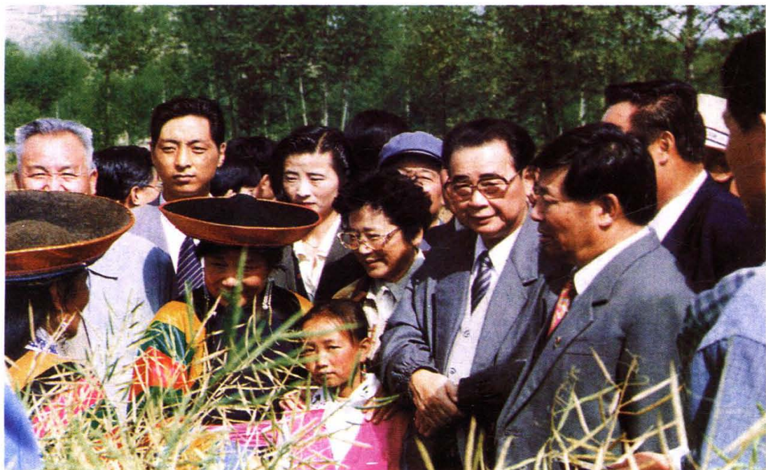
国务院总理李鹏在青海省互助土族自治县农村考察