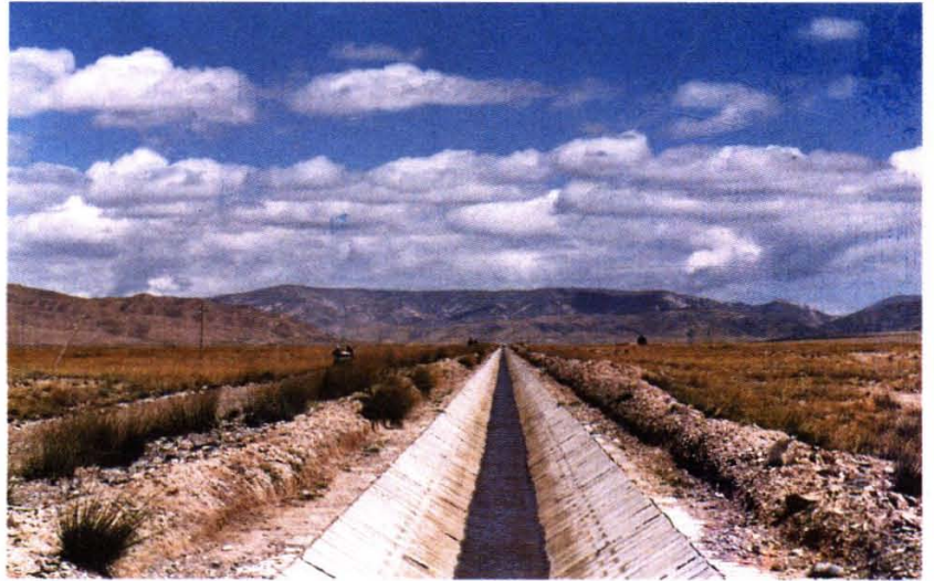
青海牧业区开发的草原灌渠