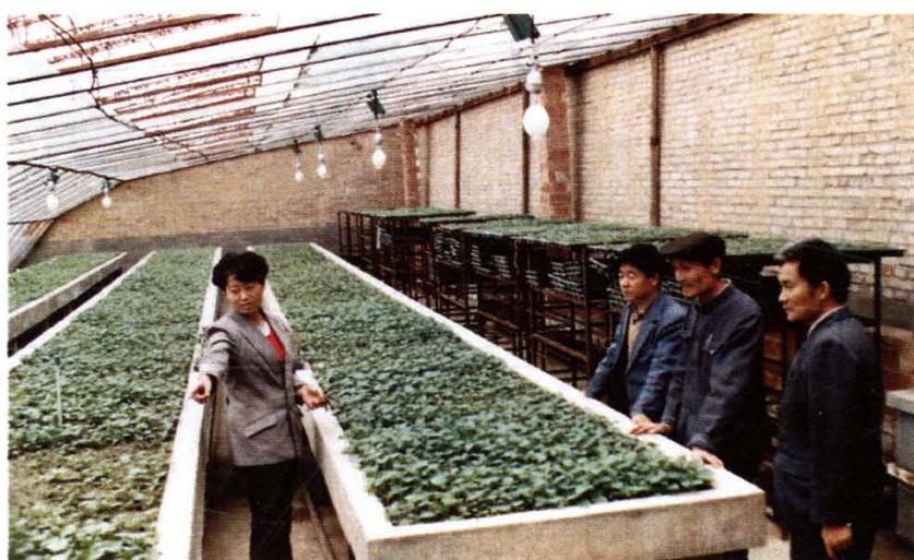
海东农村建起了温室培育脱毒洋芋种苗