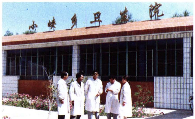
发展中的平安县小峡乡卫生院