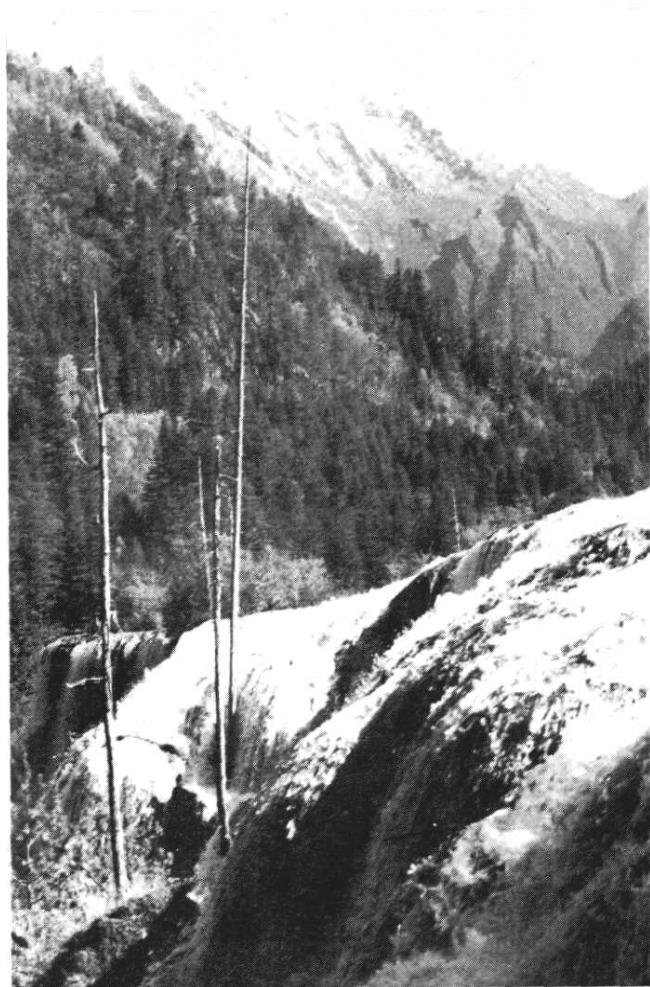
九寨珍珠滩