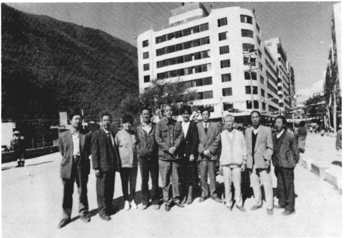
建州四十周年时部分老同志留影