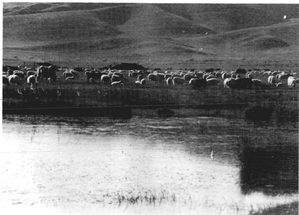
阿坝大草原