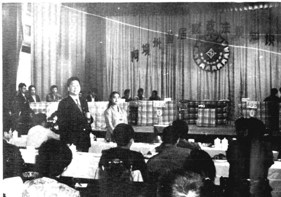
财政首届财政法规知识竞赛