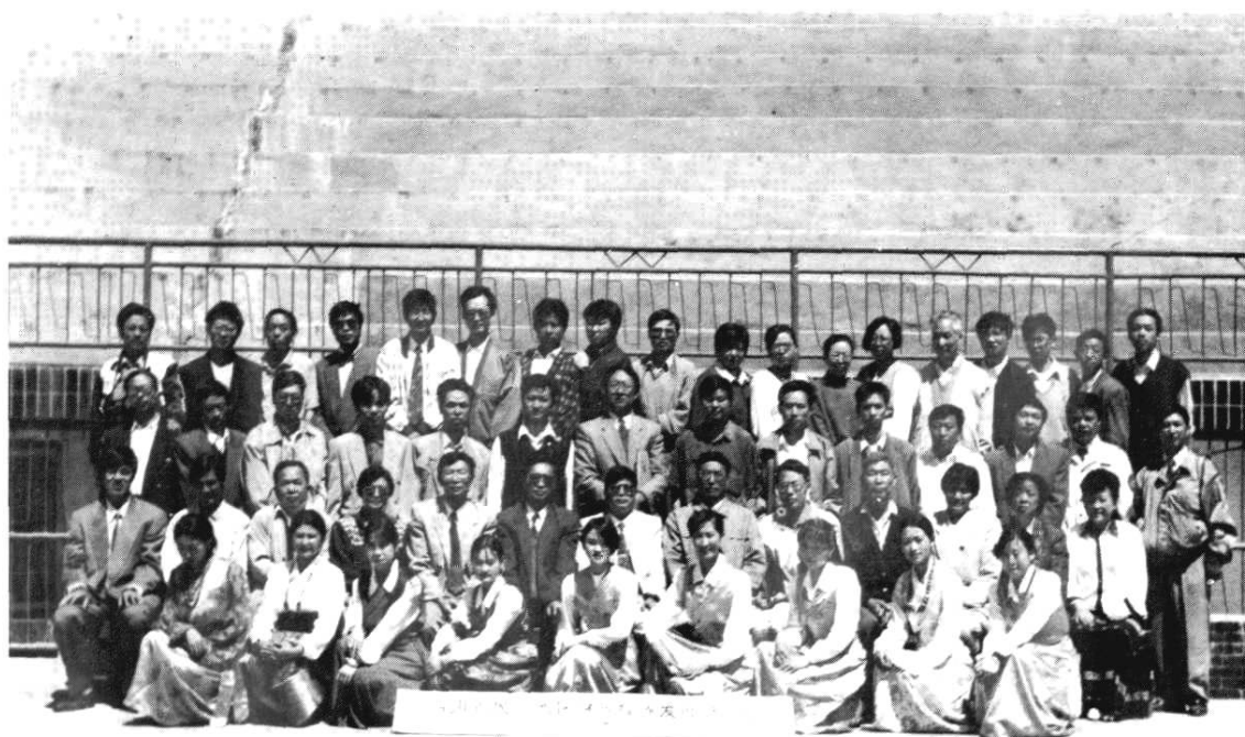
四川省民族地区财政经济发展研究会留影