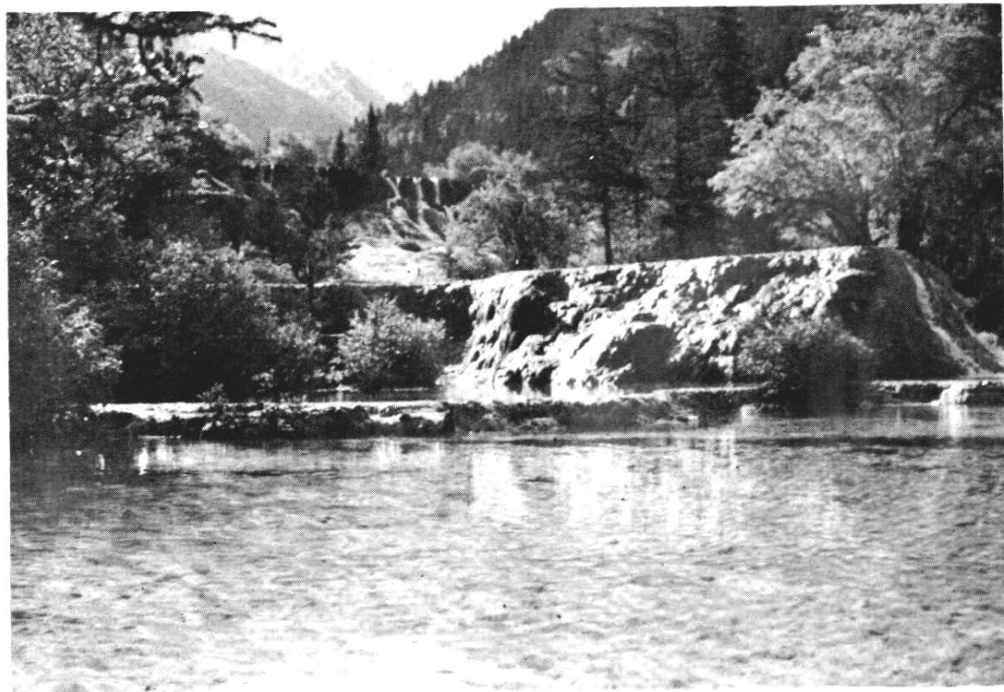
黄龙寺风光 桑正摄