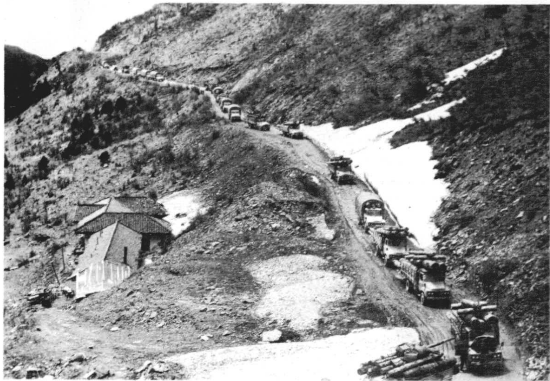
鹧鸪山车道