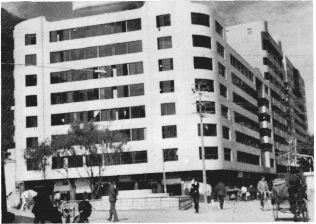
阿坝州财政局大楼