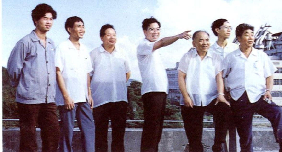
厂领导在规划台州发电厂 发展远景