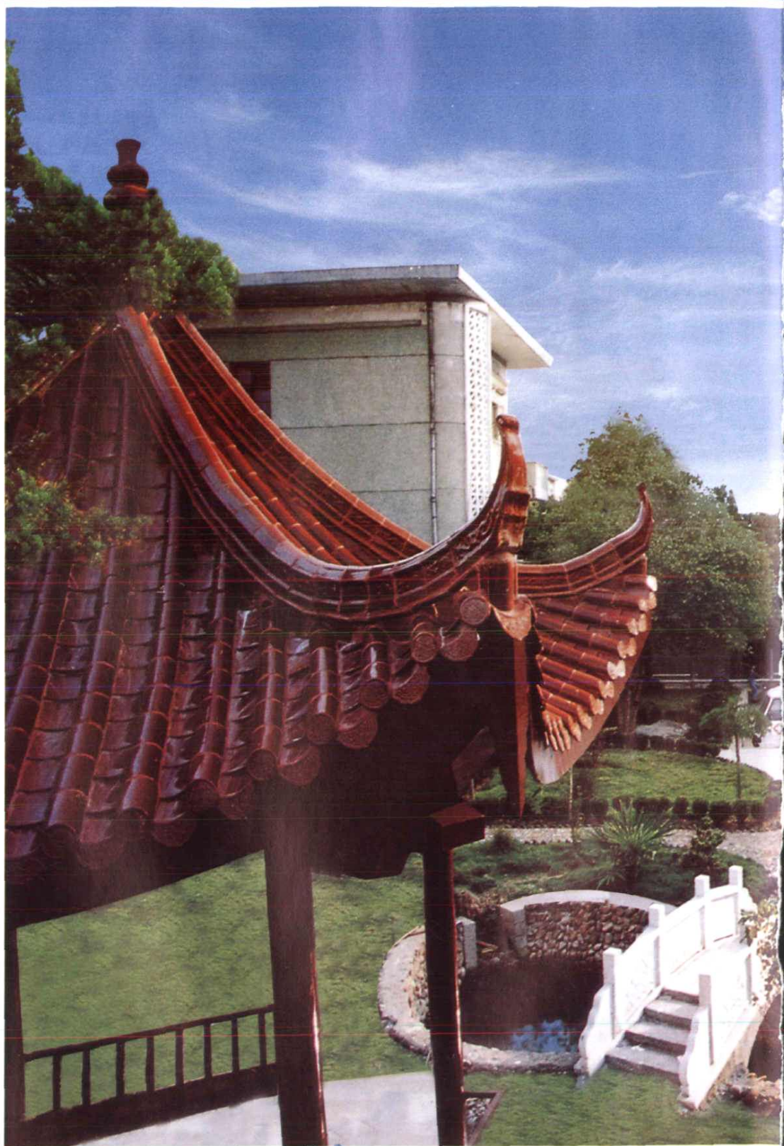
整洁幽雅的医院环境