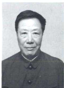
金玉堂 党支部书记