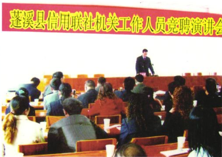
农村信用社进行劳动用工制度改革实行竞争上岗双向选择