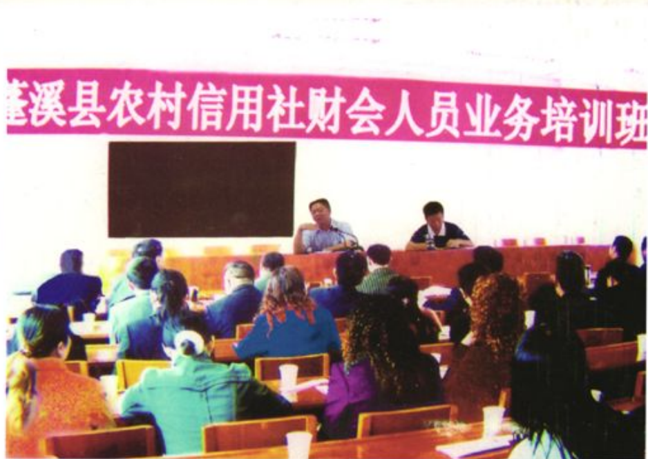
县联社举办职工业务知识培训班