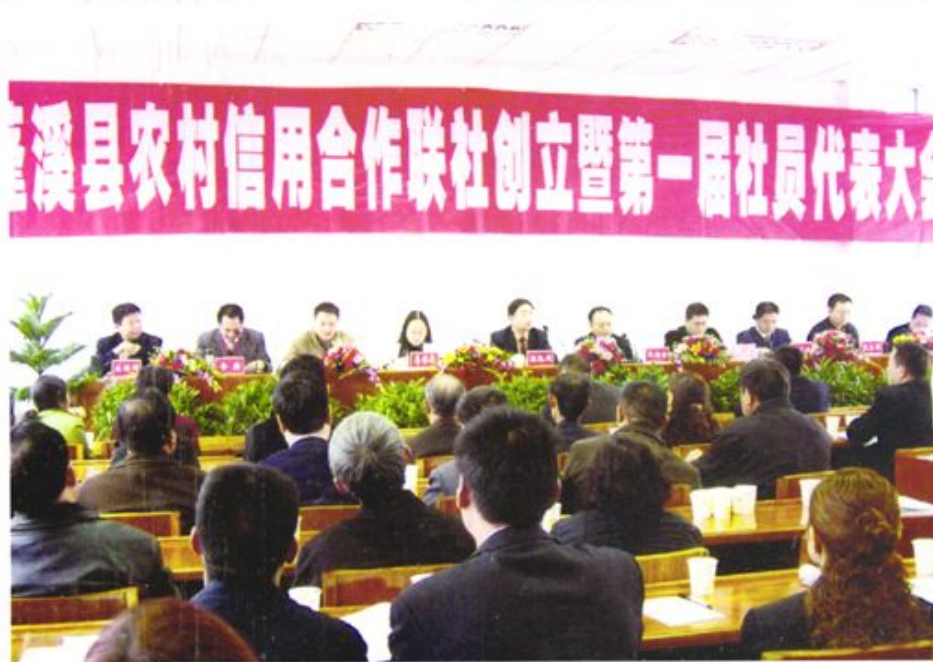
县联社召开社员代表大会会场