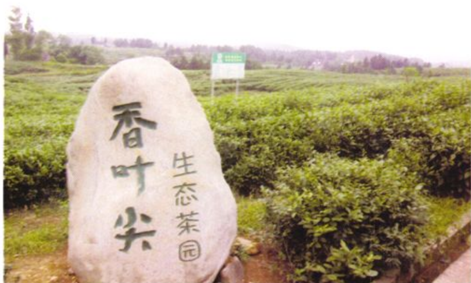
农村信用社支持发展的茶叶基地