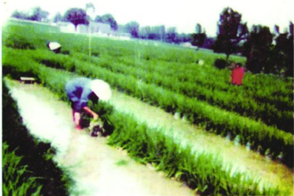
农村信用社支持发展的杂交水稻制种基地