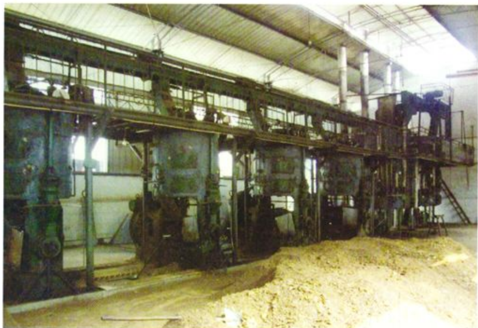
农村信用社支持发展的民营加工企业