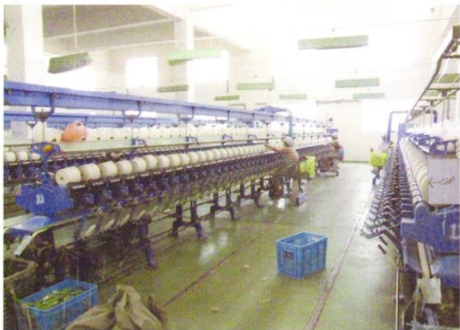
农村信用社支持发展的地方纺织工业