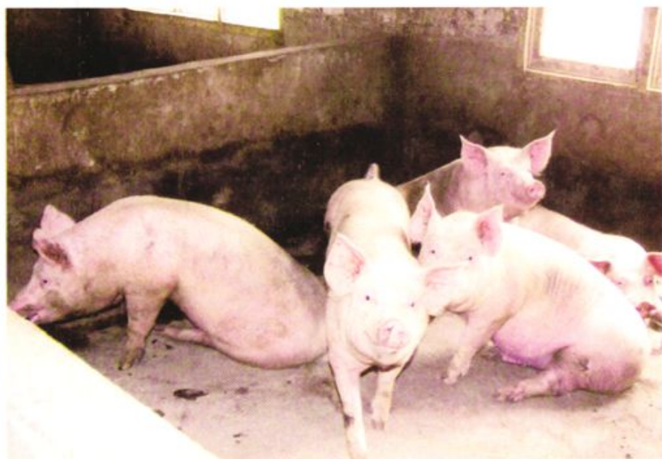
农村信用社积极支持农户发展生猪生产