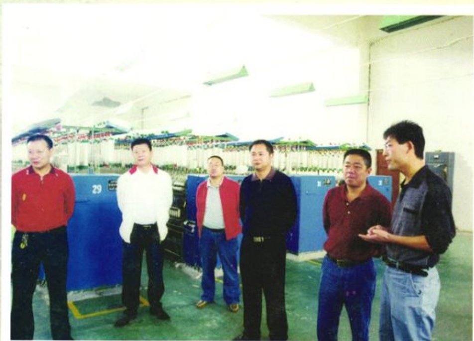
县联社领导深入企业帮助地方工业谋发展