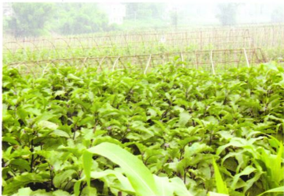
农村信用社支持发展的特色农业——菜篮子工程