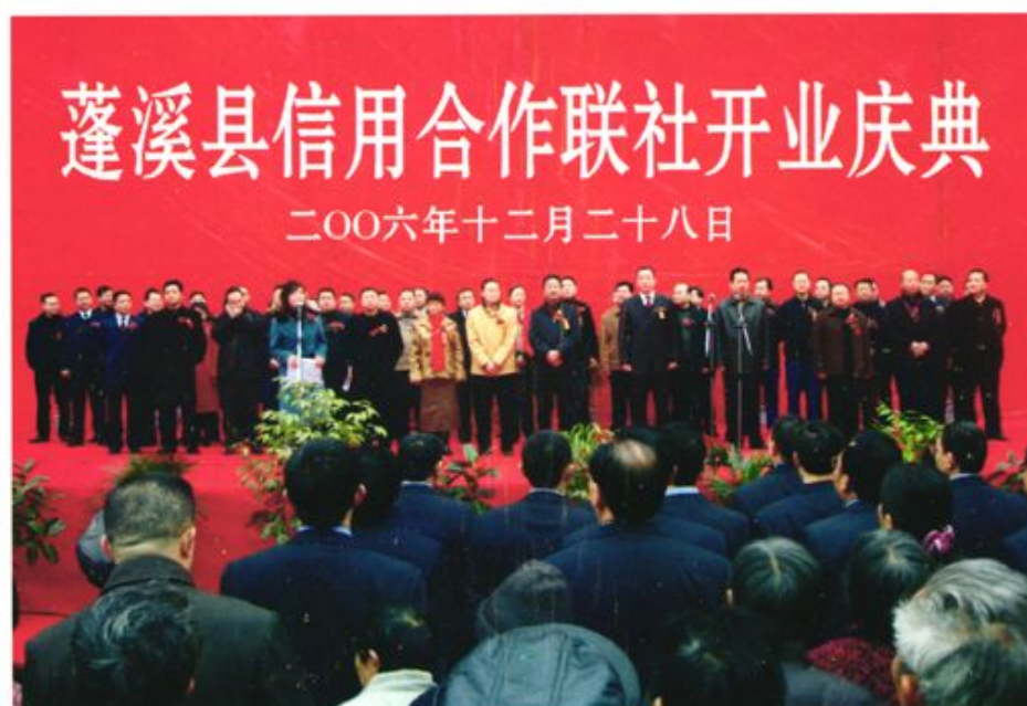
全省第七家、全市第一家以县为单位“统一法人”县联社开业庆典。省联社、市人行、市银监分局、省联社遂宁办事处、县委、县府、县人行和市内兄弟联社领导到会祝贺。