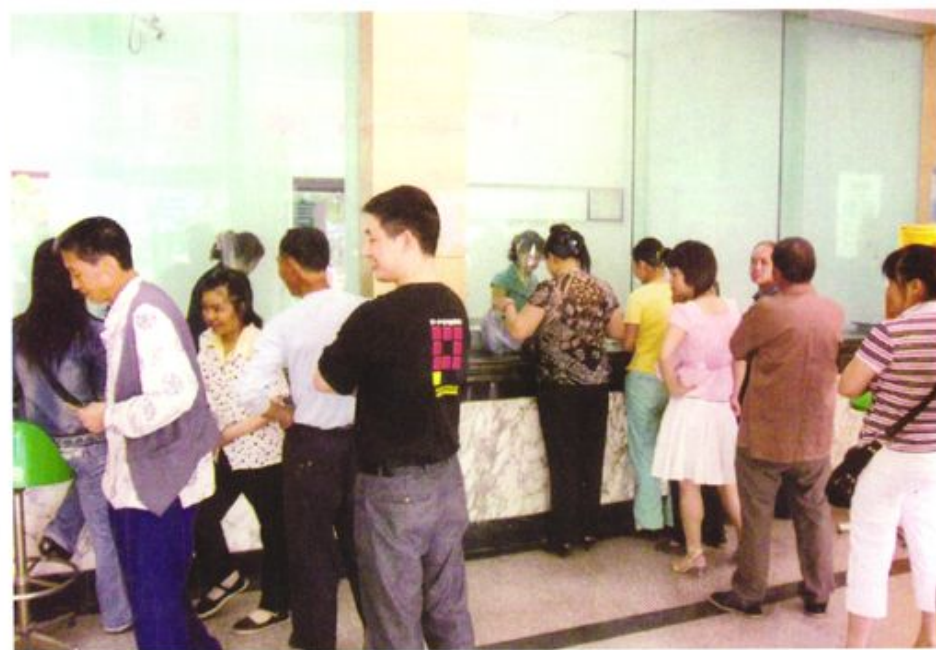
农村信用社机构网点业务兴旺顾客盈门