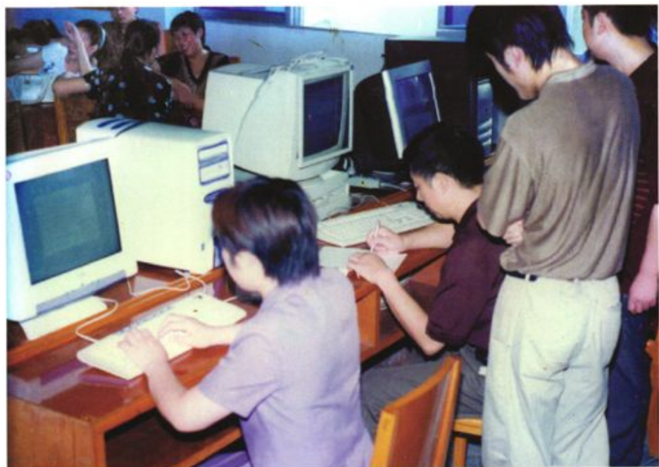
县联社组织开展业务技术比赛