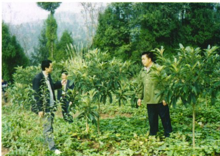
农村信用社员工深入农户调查信贷资金需求