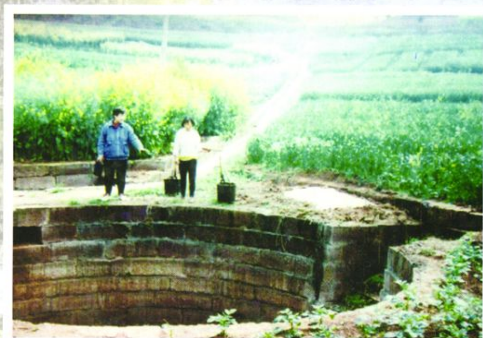
农村信用社积极支持农田水利建设