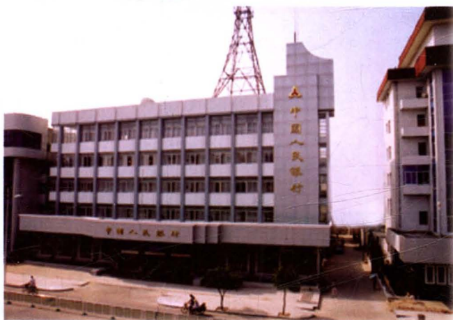
中国人民银行淮阴分行办公楼（健康东路69号）