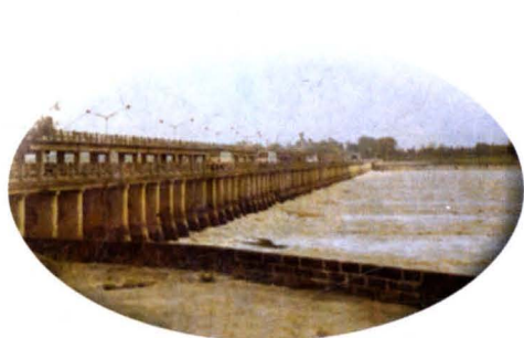
▲ 三河闸为治淮重点工程之一，1952年10月1日开工，1953年竣工，为当时全国第二大内河闸，最大流量12000立方米/秒。工程实际投资为2618万元，由中国人民建设银行淮阴支行特派工作组现场办公，完成拨款工作（摄于1989年8月）