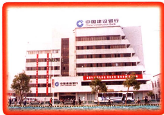
中国人民建设银行淮阴中心支 行办公楼（健康东路）