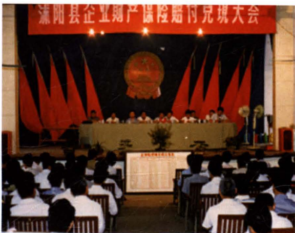
▶ 中国人民保险公司淮阴分公司泗阳、沐阳、涟水、灌南等县支公司对遭受暴雨灾害较重的458家参保企业、177821户参保农户进行理赔兑现，共支付赔款1200多万元。图为沐阳县企业财产保险理赔兑现大会 (摄于1990年7月29日)