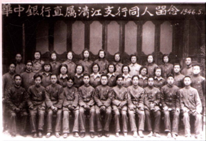
华中银行直属清江支行 同仁合影 (摄于1946年5月1日)