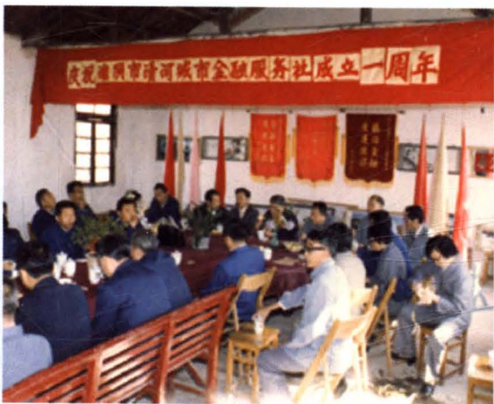
◀ 全省首家城市集体金融组织——清河城市金融服务社举行建社一周年庆祝活动 (摄于1985年10月1日)