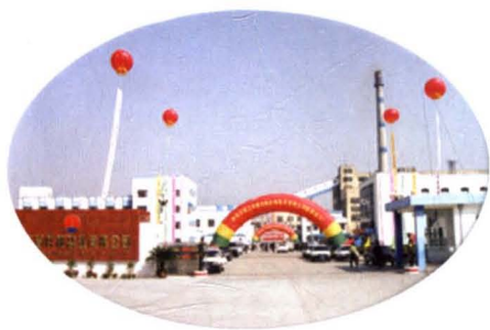
▲ 中国银行淮阴支行重点支持的江苏井神盐业公司于1989年投产。该公司通过开发本地丰富的岩盐资源已成为全国食盐定点生产企业，并跨入全国大中型井矿盐业行列（摄于2000年10月）