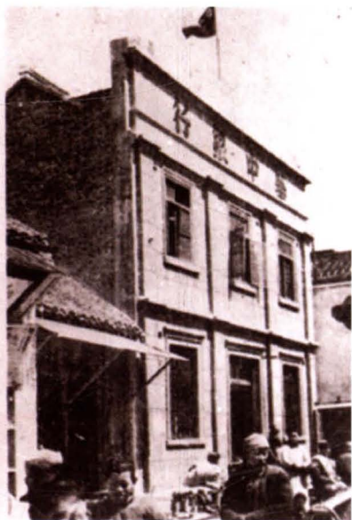
原华中银行总行办公楼旧址（现东大街内）