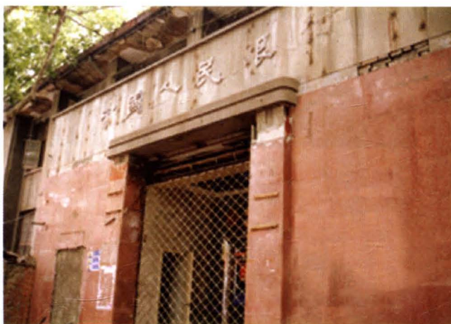
原中国人民银行淮阴中心支行及清江市支行旧址（现东大街内）