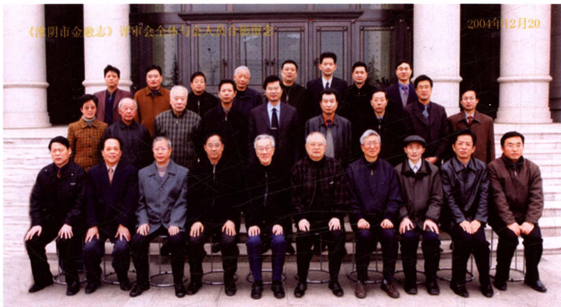
《淮阴市金融志》评审会全体人员合影留念