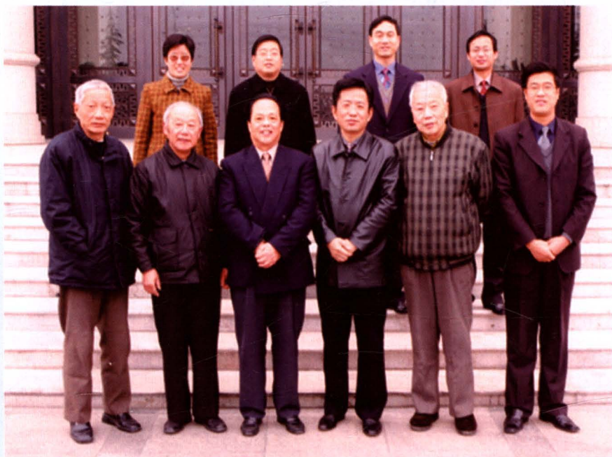
《淮阴市金融志》编纂人员合影