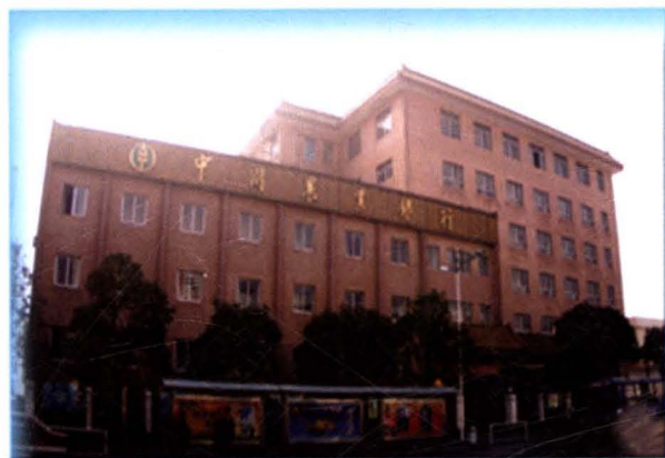
中国农业银行淮阴市 支行办公楼（健康西路）