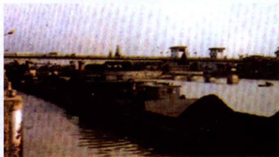
◀ 淮安水利枢纽工程，1972年12月动工，1980年完工，配有电机10台，装机总量16400千瓦，设计流量180立方米/秒，工程总投资3236万元，由中国人民建设银行淮阴地区中心支行提供一条龙金融服务