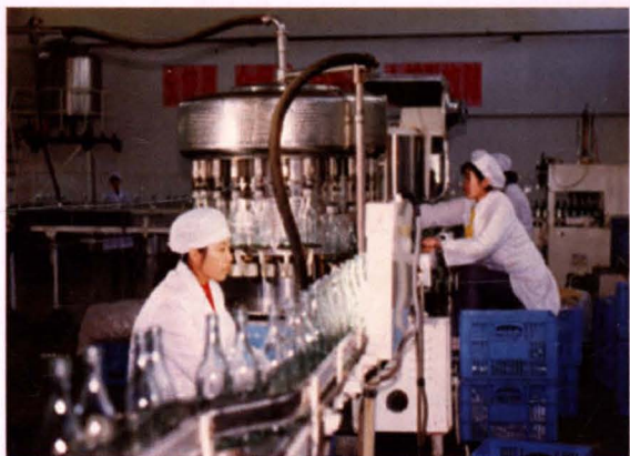
中国工商银行淮阴市支行积极支持大型企业技术改造，图为双沟酒厂技改项目投产后的灌装车间 (摄于1988年4月)