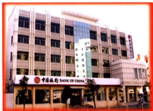
中国银行淮阴支行 办公楼（健康东路）