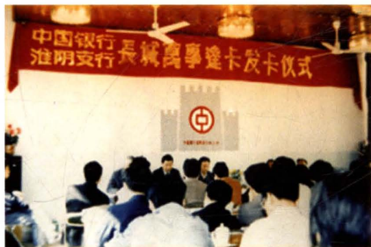
◀ 中国银行淮阴支行在全市首家发行银行信用卡——人民币长城万事达卡。图为首次发卡仪式（摄于1990年5月19日）