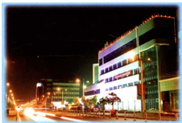
中国人民保险公司淮阴 分公司办公楼（健康东路）