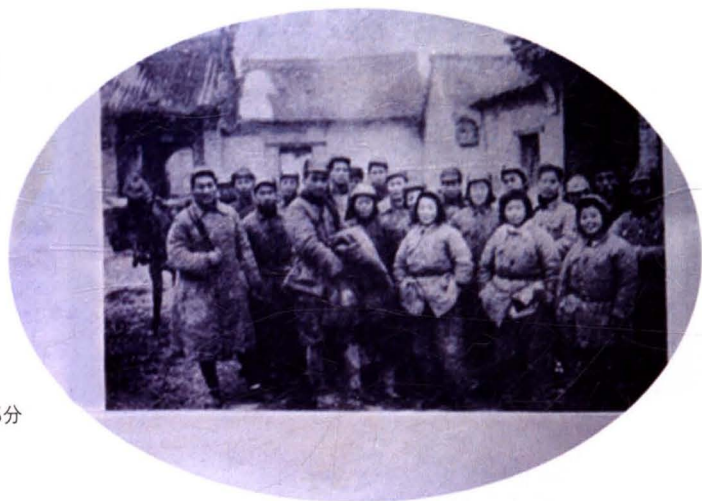
华中银行第二印钞厂部分 人员在淮安圆明寺合影 (摄于1946年1月)