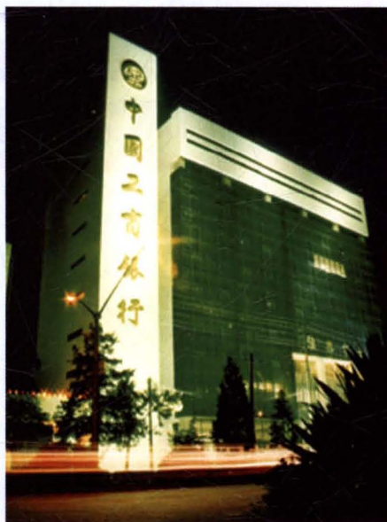
中国工商银行淮阴市支行办公楼（淮海西路）