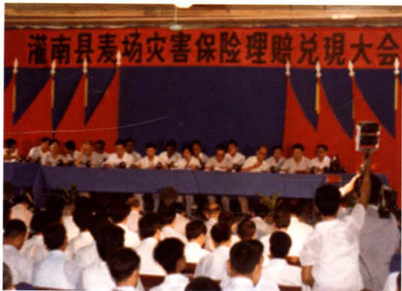
◀ 中国人民保险公司淮阴分公司在灌南召开麦场灾害理赔兑现大会，共对18530户受灾户支付赔款50.2万元 (摄于1986年9月6日)