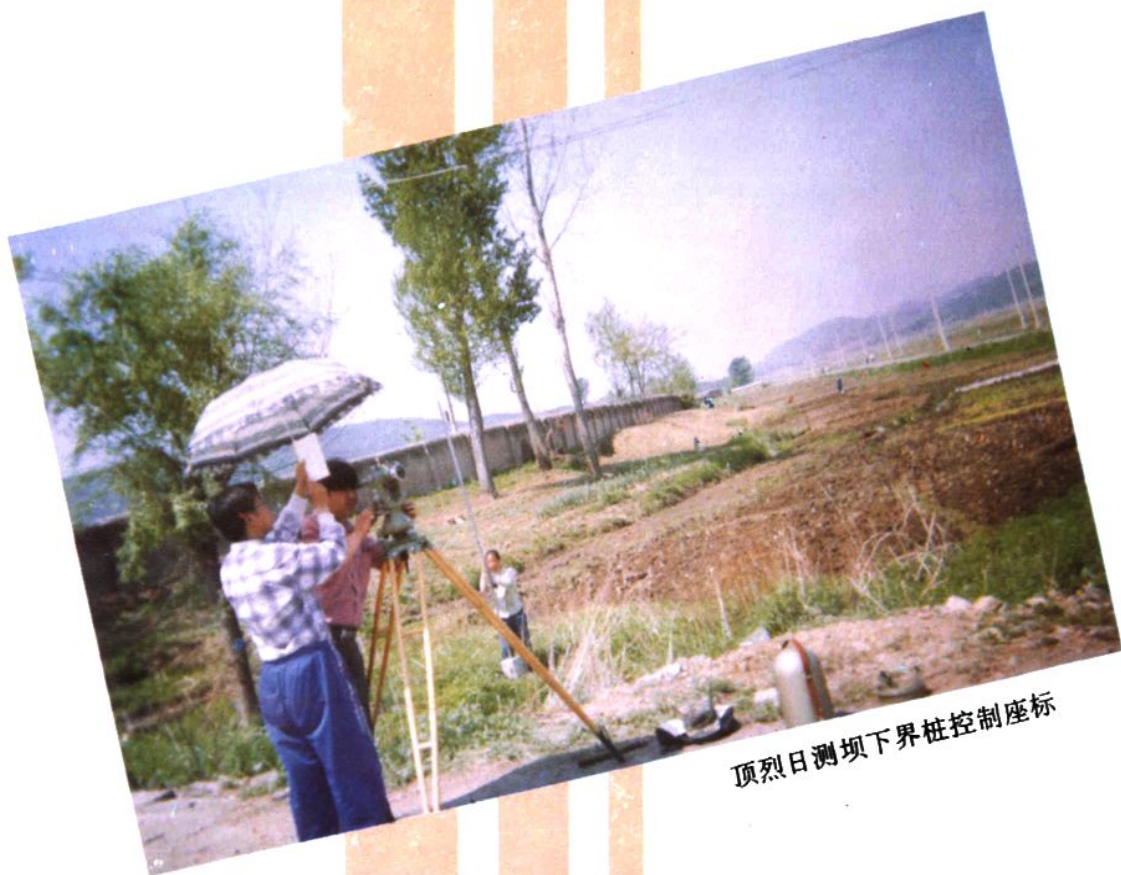
顶烈日测坝下界桩控制座标