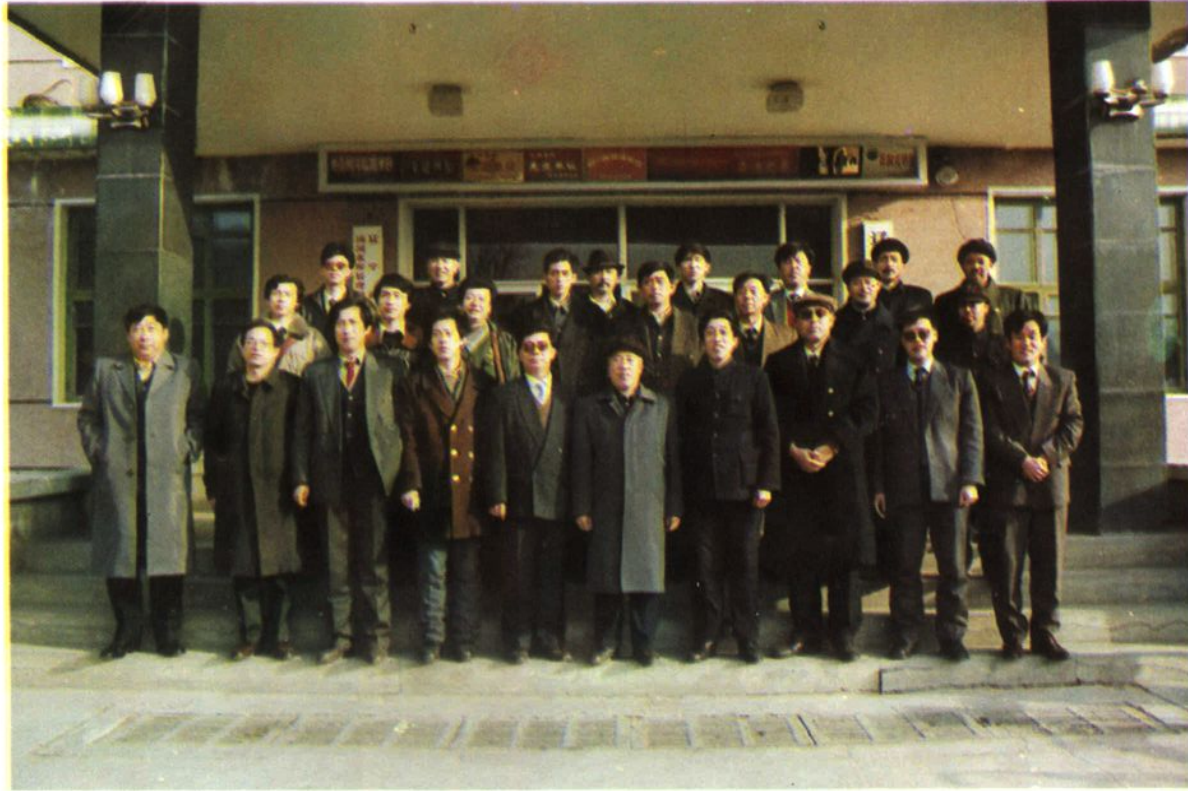
1993年3月6日,省水电厅供水局、水政处在汤河水库 召开六大库土地工作会议 合影