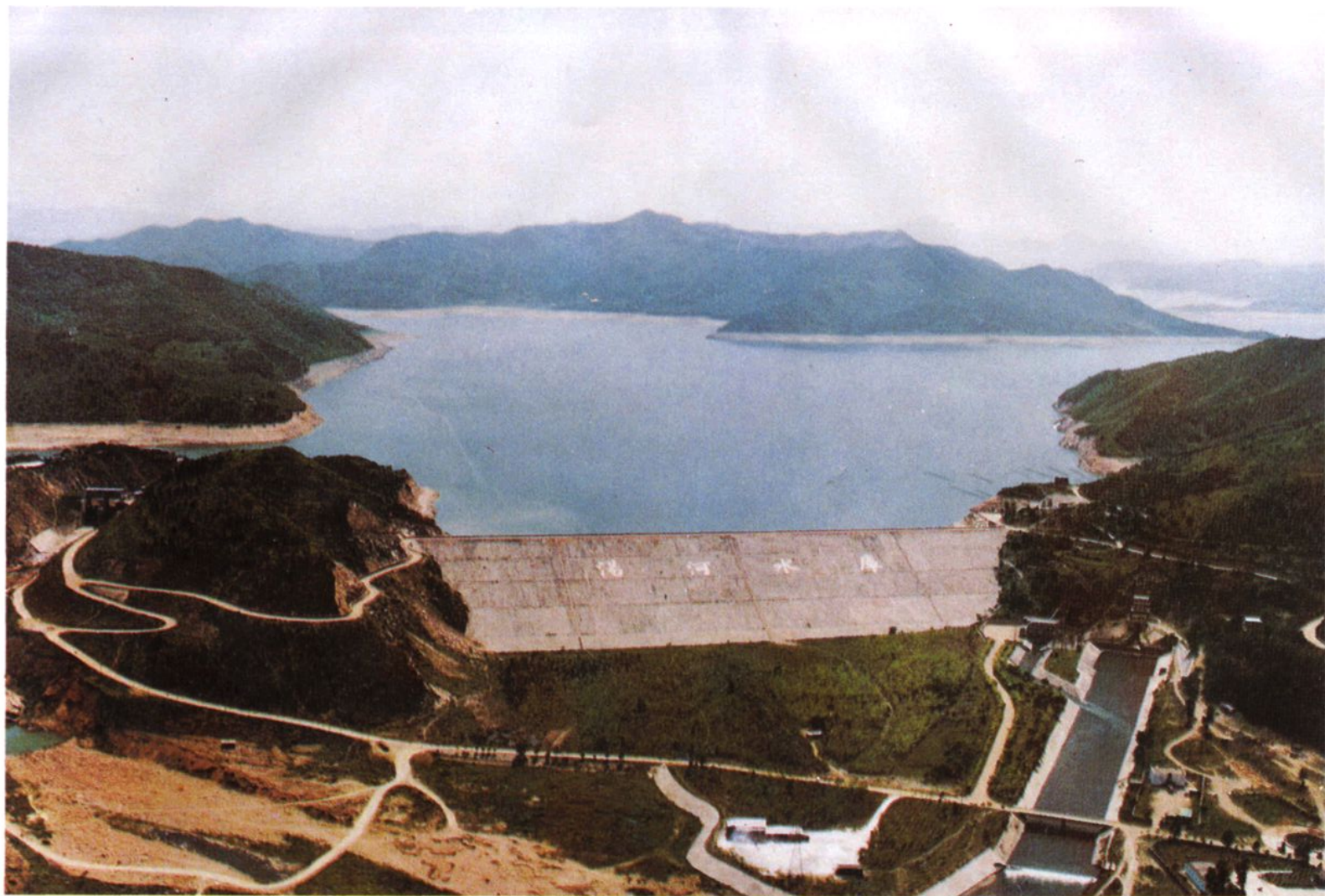
汤河水库枢纽全貌