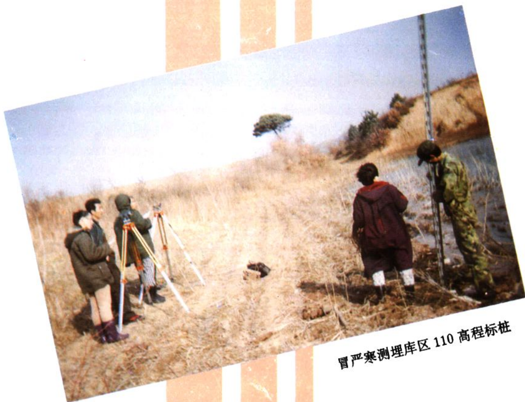
冒严寒测埋库区 110 高程标桩