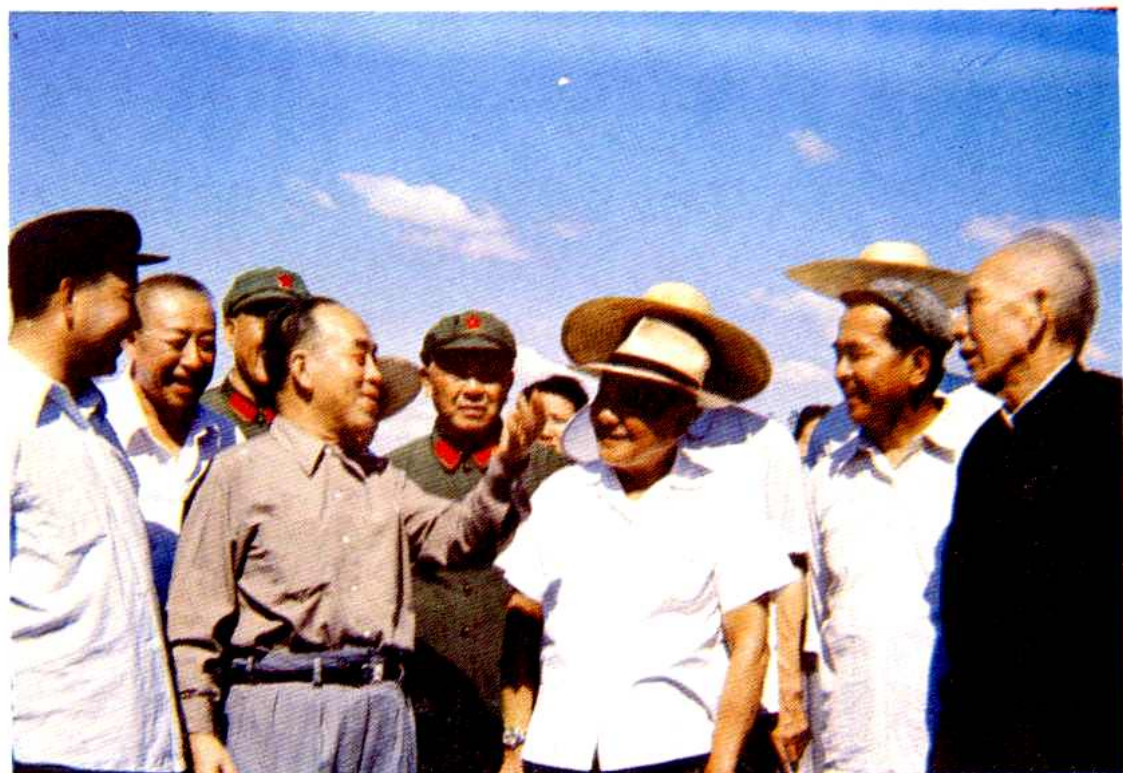
邓小平、王震等中央领导同志在新疆