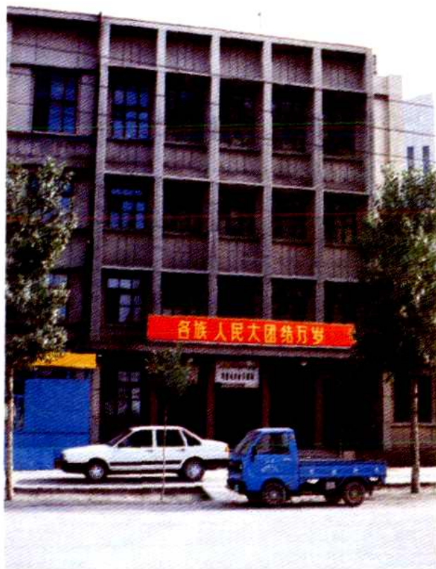
乌鲁木齐市交通局办公楼