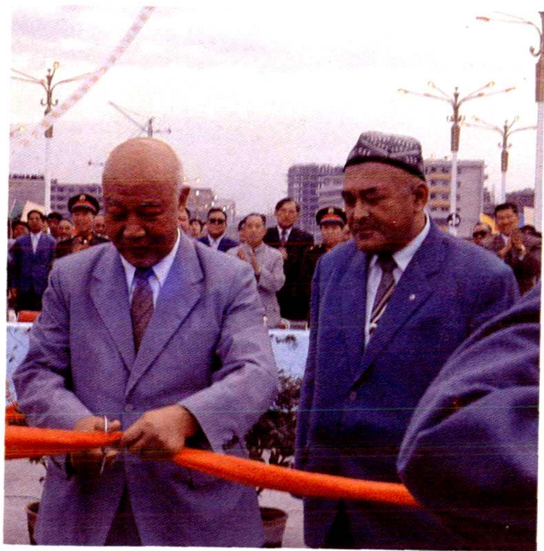
全国政协副主席、自治区顾委主任、王思茂为人民路 立交桥通车剪彩