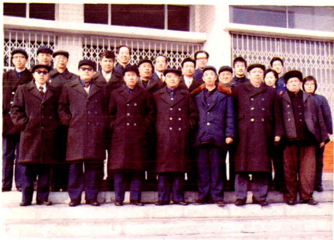
乌鲁木齐市交通局历届、现任领导和编志办公室工作人员合影