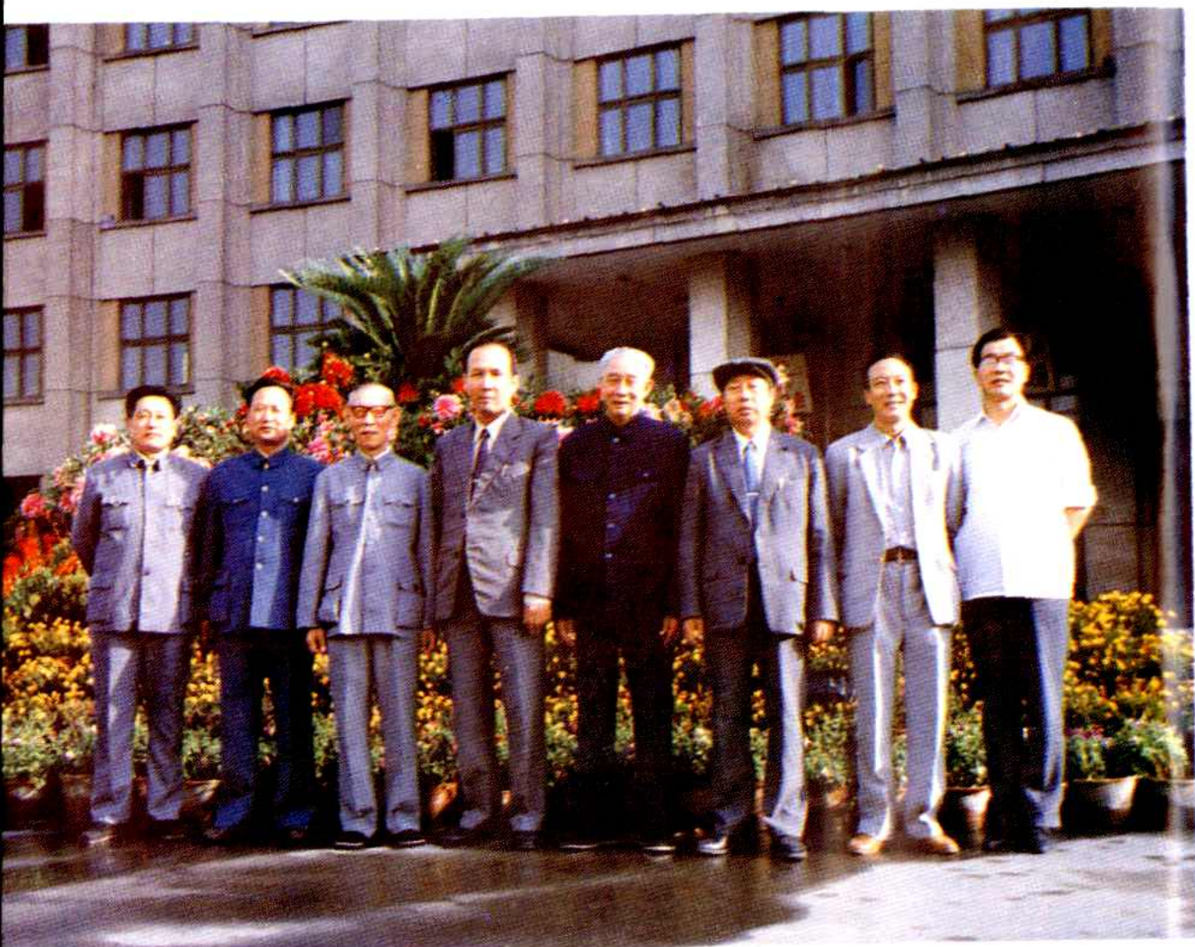
中共乌鲁木齐市委、市政府部分原领导、现领导等欢聚一堂