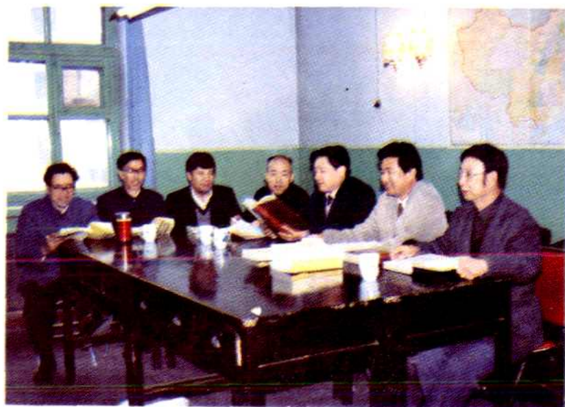
乌鲁木齐市交通局党政领导讨论公路交通行业管理工作