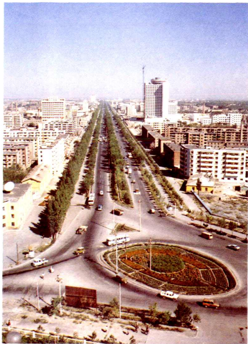
新建中的北京南路