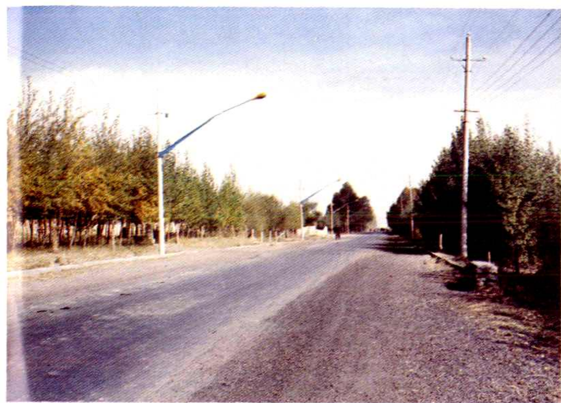
乌鲁木齐县乡村公路