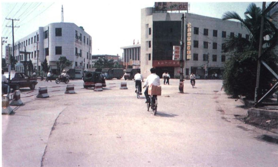
盖山镇机场路与福厦路交汇口