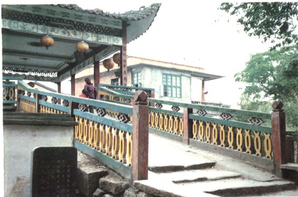
郭宅村的古桥——七星桥