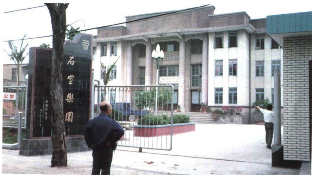
華僑捐資興建的北園村石室樂園