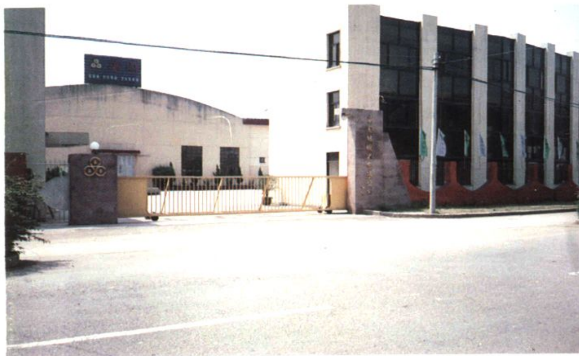
盖山镇的标准厂房之一