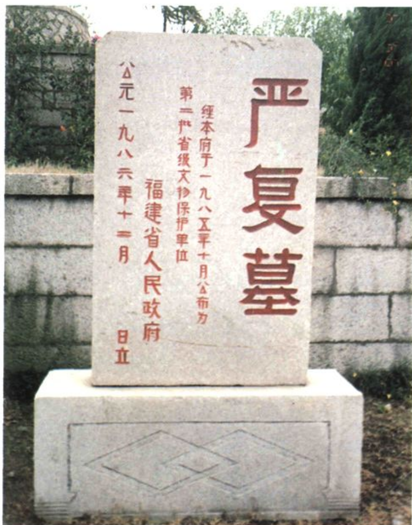
福建省人民政府立碑保护严复墓