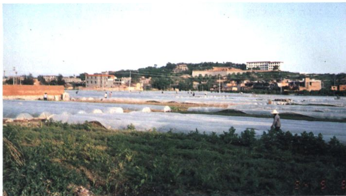
首山村的蔬菜基地