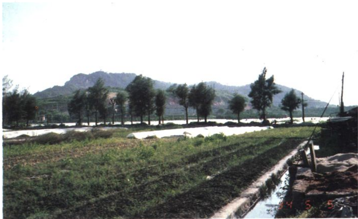
自北园远眺高盖山