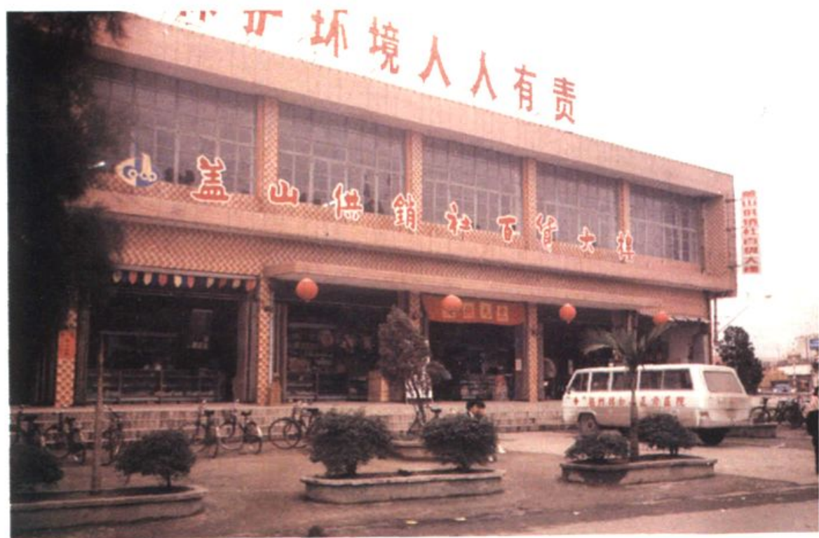
盖山供销社百货大楼