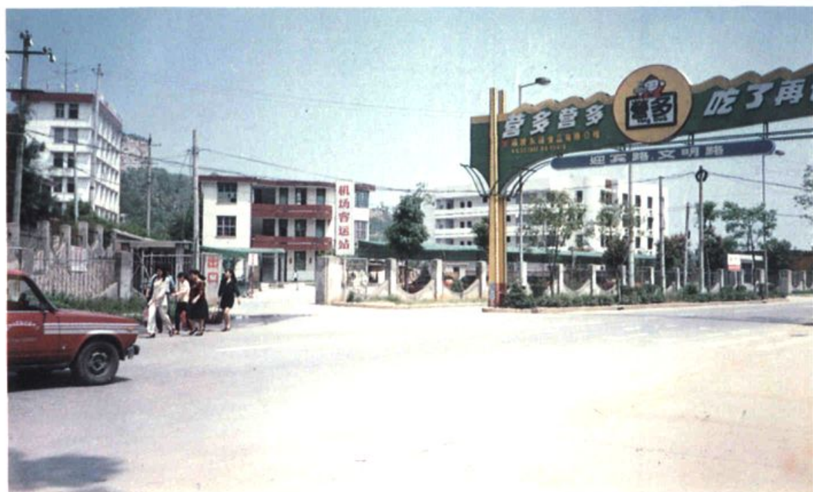
义序机场的汽车客运站