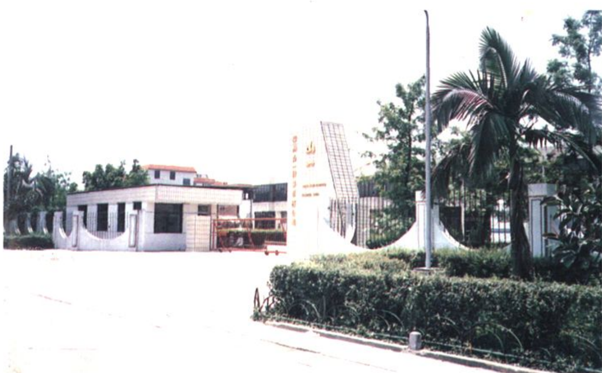
盖山镇第一家台商合资企业——“山一”鞋厂