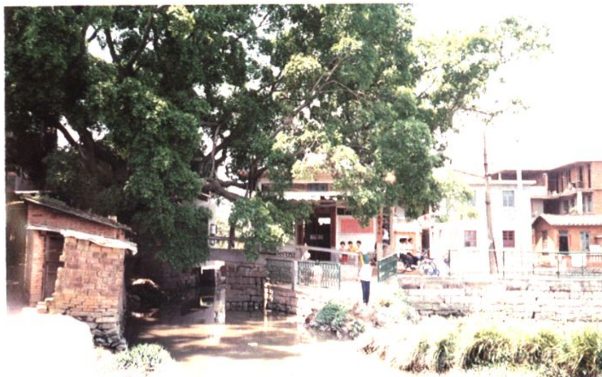
高湖村的古桥——龙桥