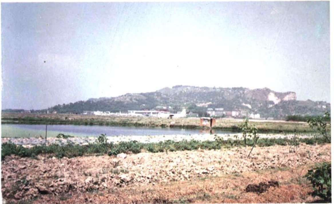
从尚保村远眺义序机场及高盖山