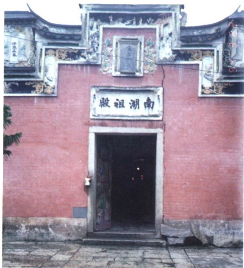
高湖村包孝肃祖殿