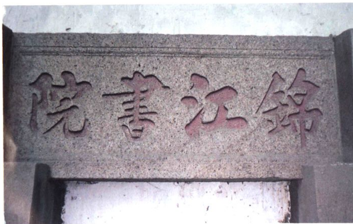
建于清乾隆年间江边村的锦江书院