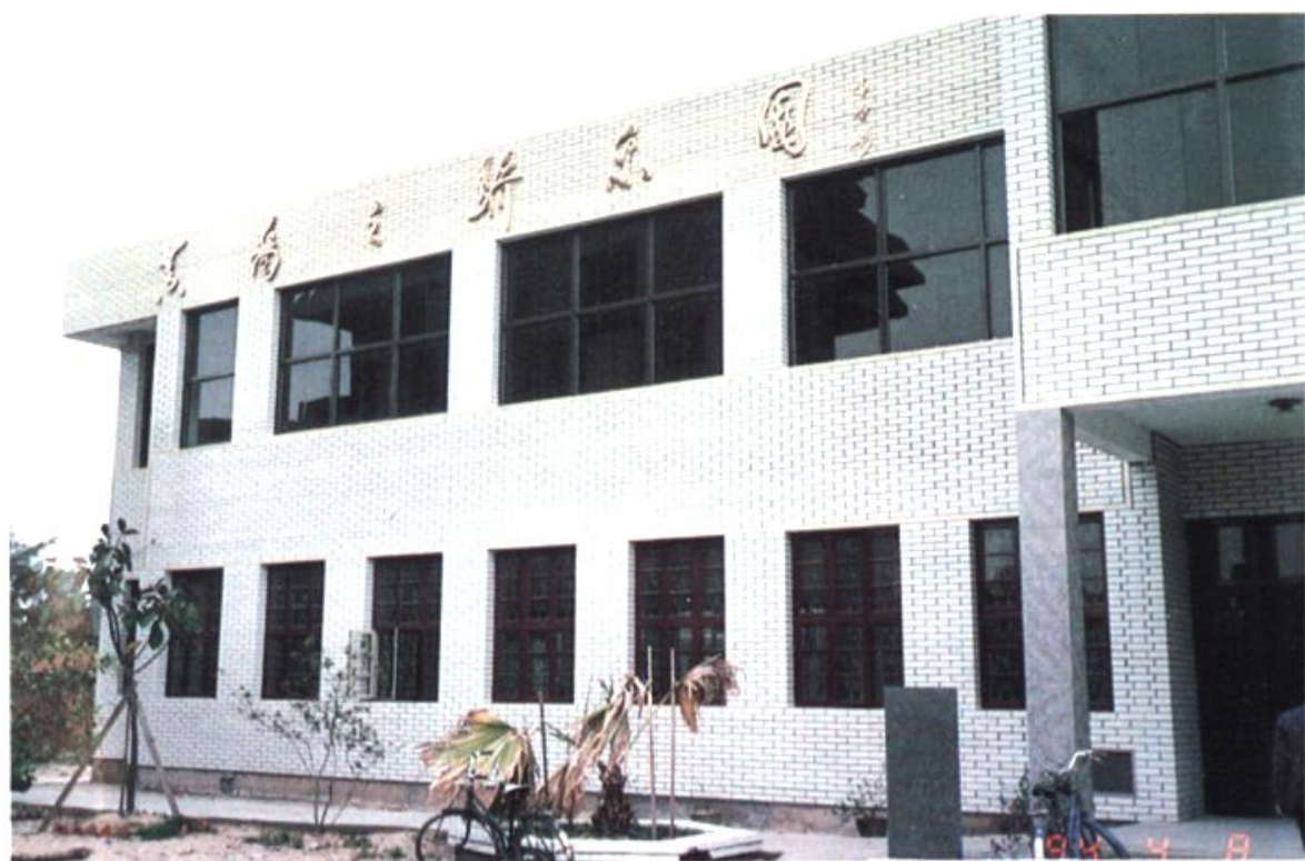
义序竹榄村档兜的黄裔之骄乐园