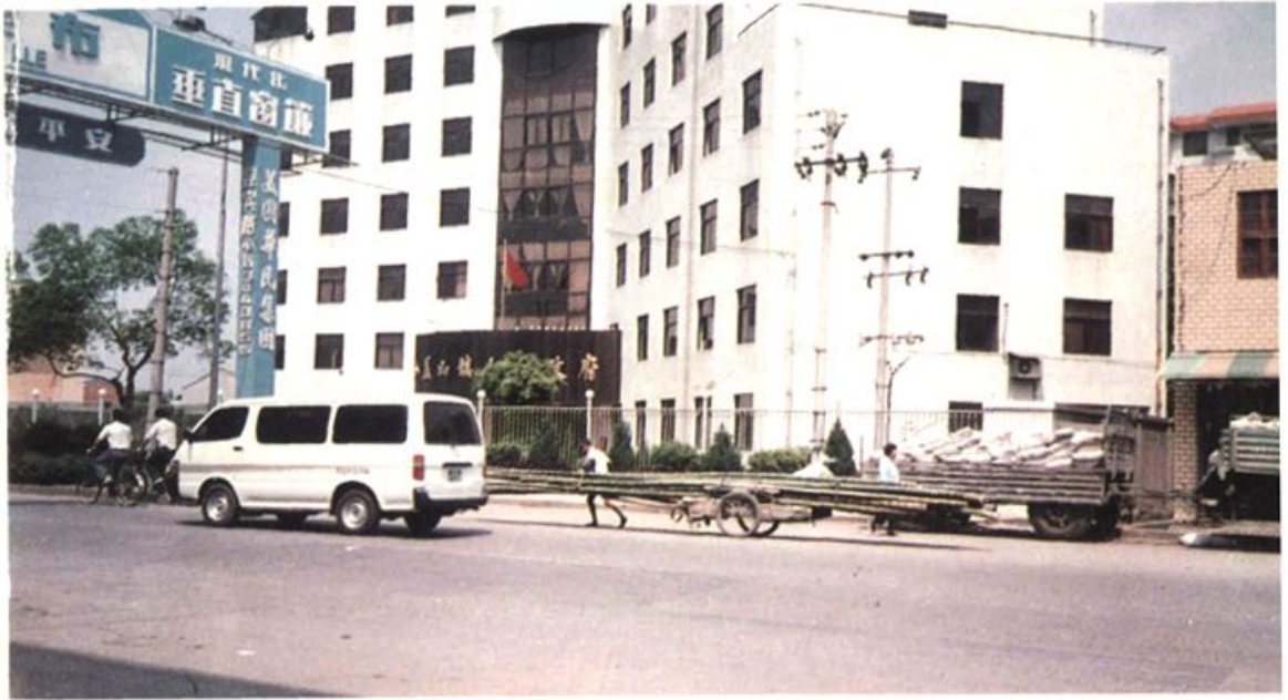
福州市盖山镇人民政府大楼(义序机场路口)