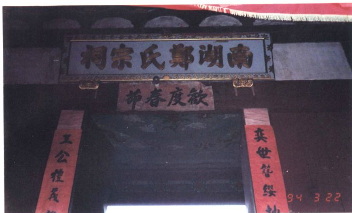
高湖村的南湖郑氏宗祠