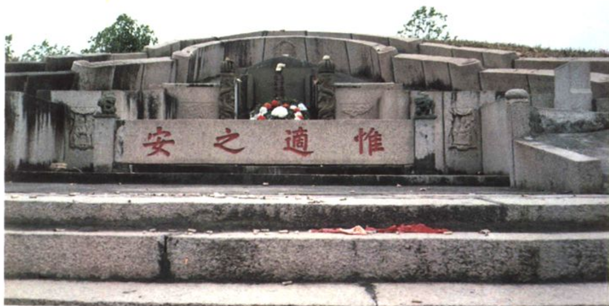
阳岐村鳌头山的严复墓