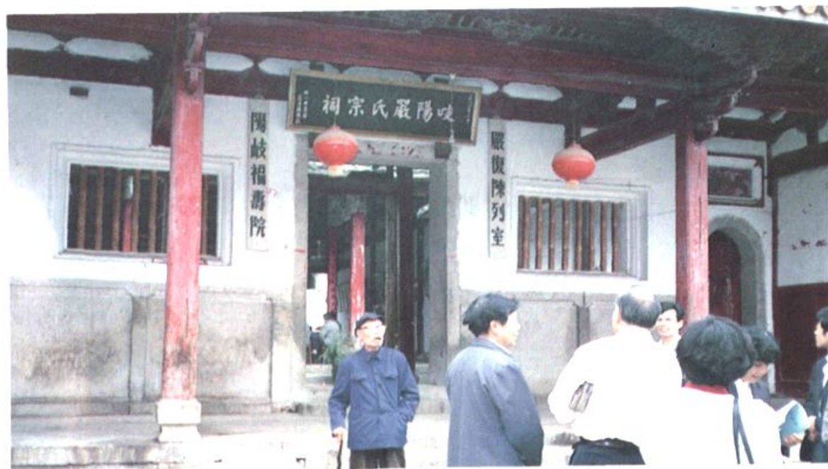
阳岐村严氏宗祠和严复事迹陈列室