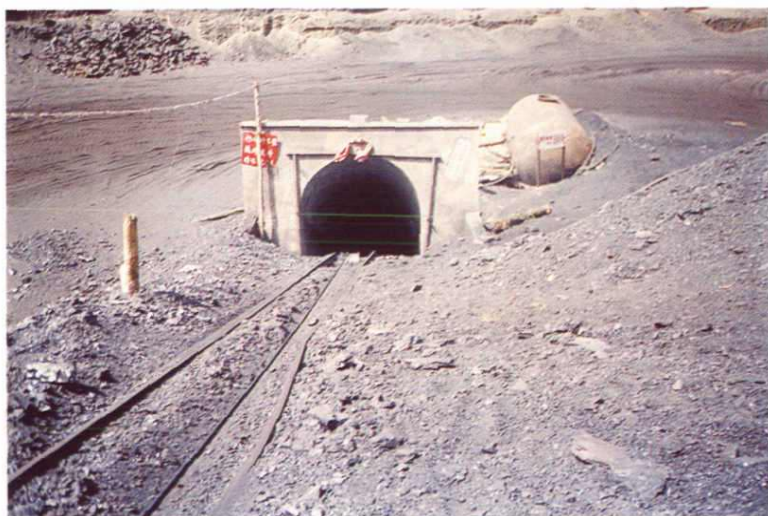
大头羊煤矿鱼卡 矿区西采区