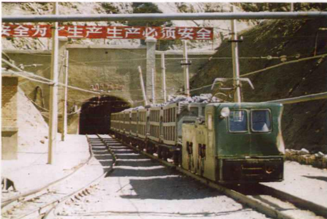
锡铁山铅锌矿 3055 采矿运输平硐