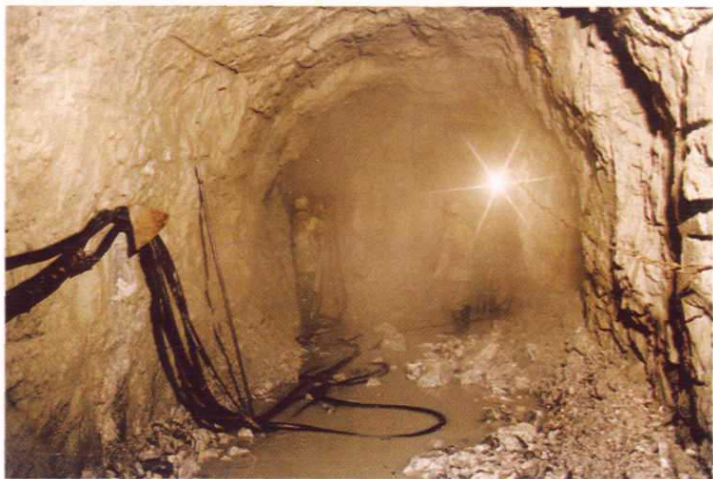
锡铁山铅锌矿掘 进掌子面