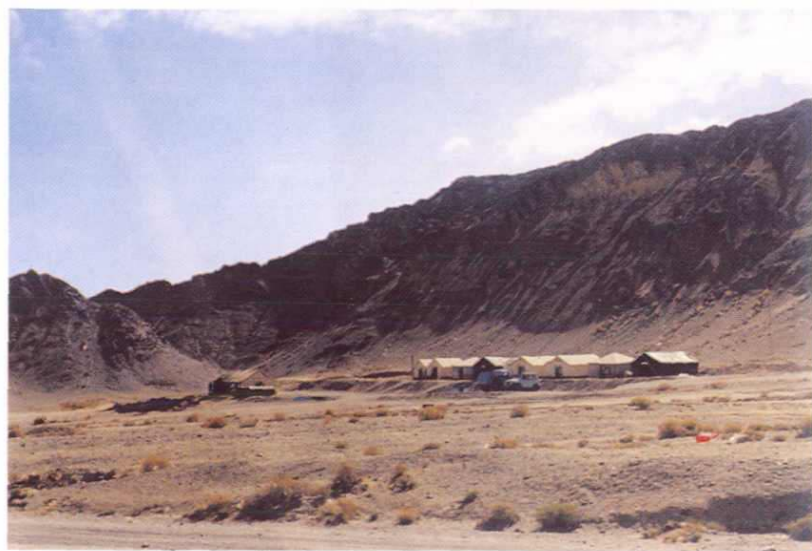
青龙山金矿野外工作区