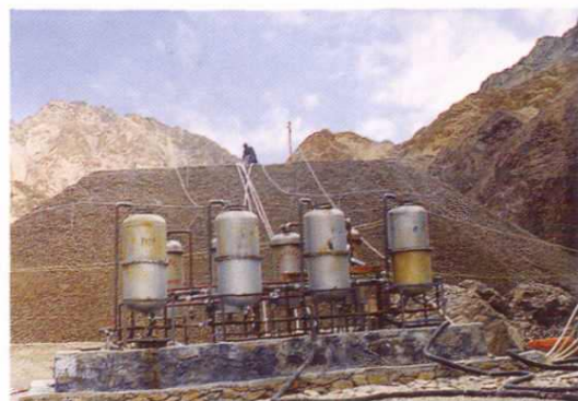
青龙山金矿喷淋生产线