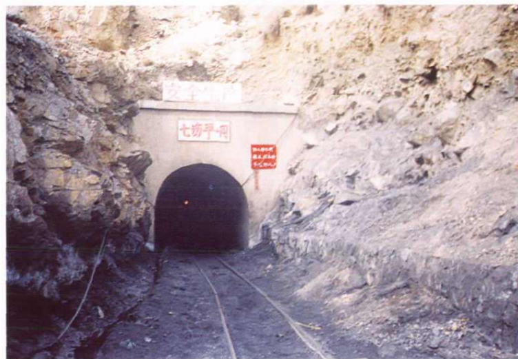
大头羊矿区 七场平硐