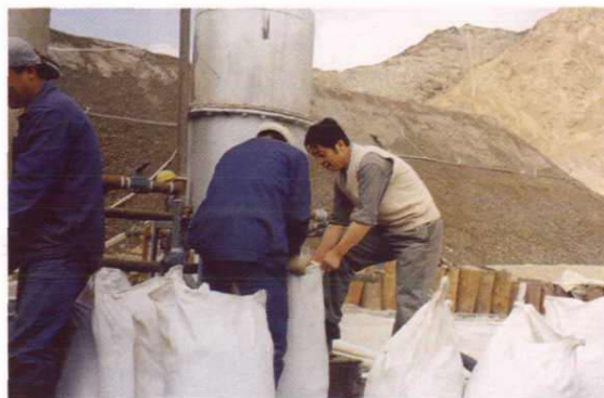
青龙山金矿载金碳——半成品金