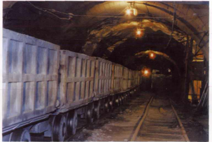
锡铁山铅锌矿井下运输巷