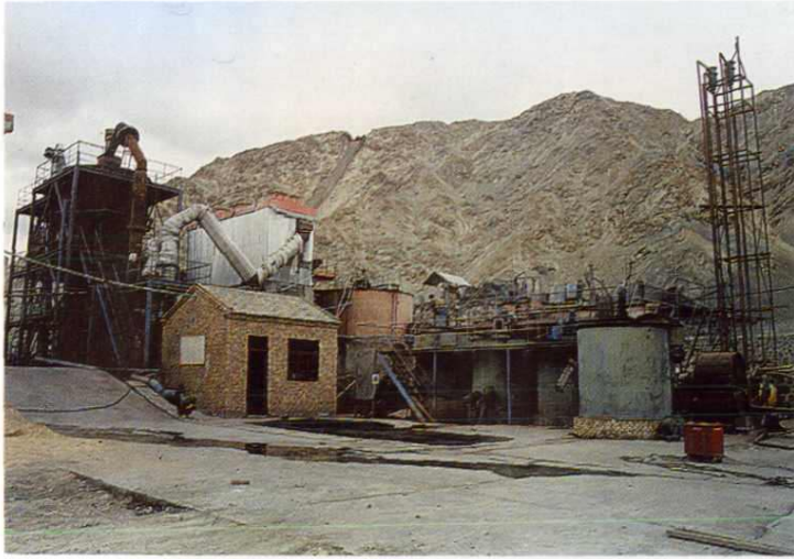
滩涧山金矿焙烧炉