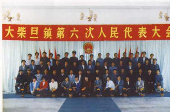
中共大柴旦镇第六次党代会