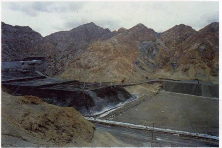
滩涧山金矿堆浸场