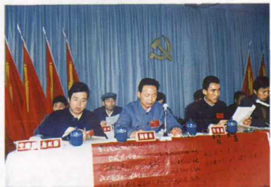
中共大柴旦镇第七次党代会