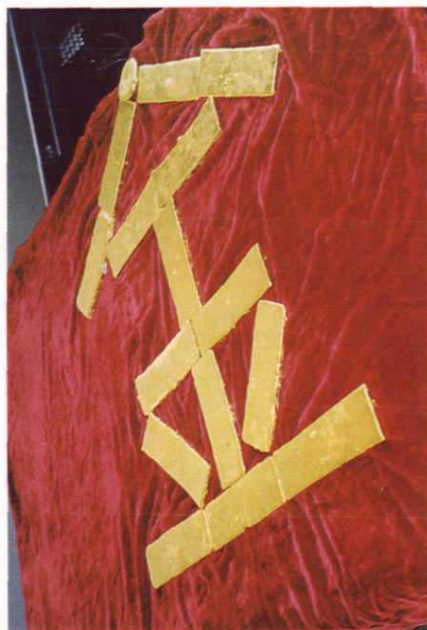
青龙山金矿成品金

大柴旦青龙山金矿是大柴旦行政委员会与青海省第一地质矿产勘查大队本着“对等投资，利益均享，风险共担”原则。于一九九七年五月联合组建的一个矿山企业。自建矿以来，矿领导始终以“团结，求实，拼搏，进取”作为谋求企业发展的方针。经过二十九名全矿干部职工的艰辛工作和不懈努力，取得了一个又一个骄人的成绩，特别是从