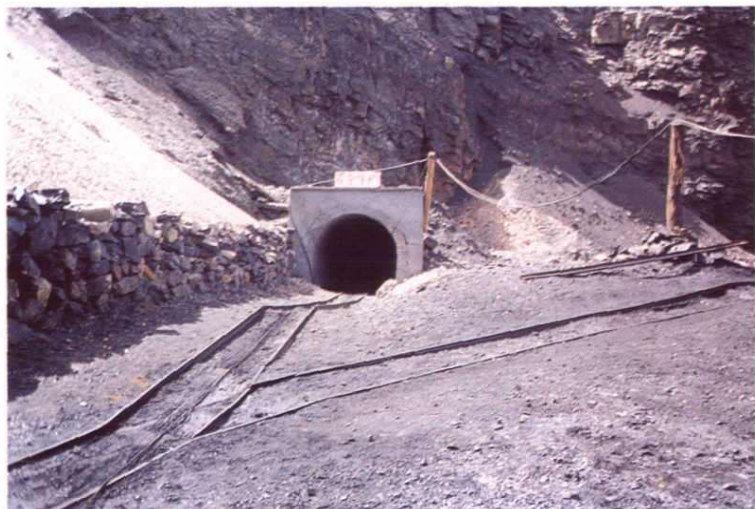
大头羊矿区二场四号井