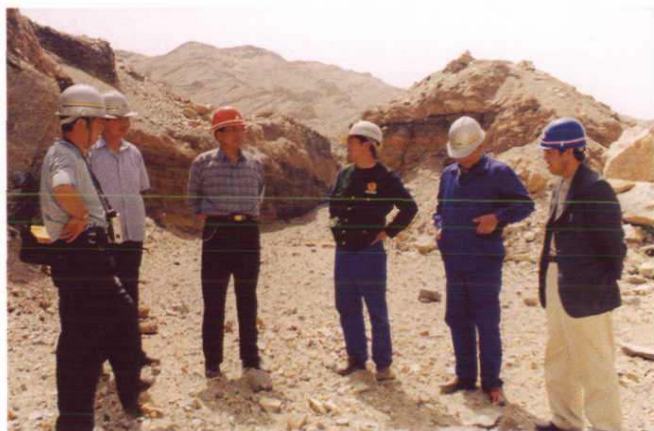
大柴旦工行委领导视察青龙山金矿