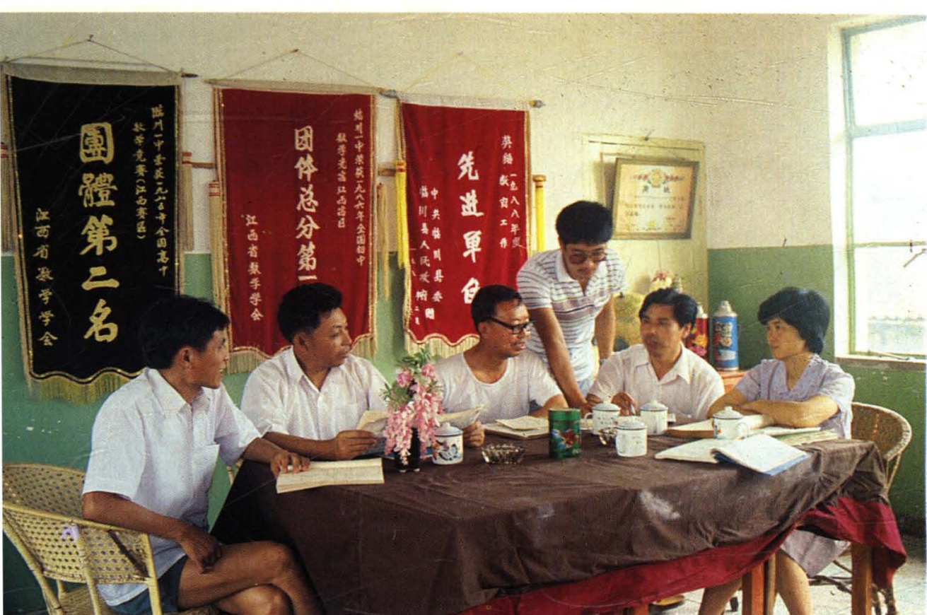
18. 全国输送少年大学生最多的临川县一中，教师们研究教学。