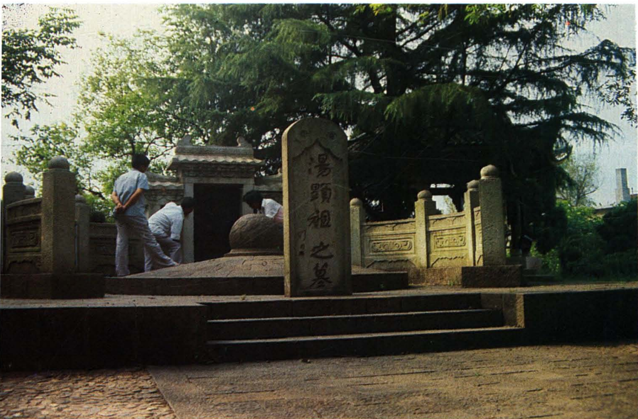
3. 明代大戏剧家汤显祖墓。