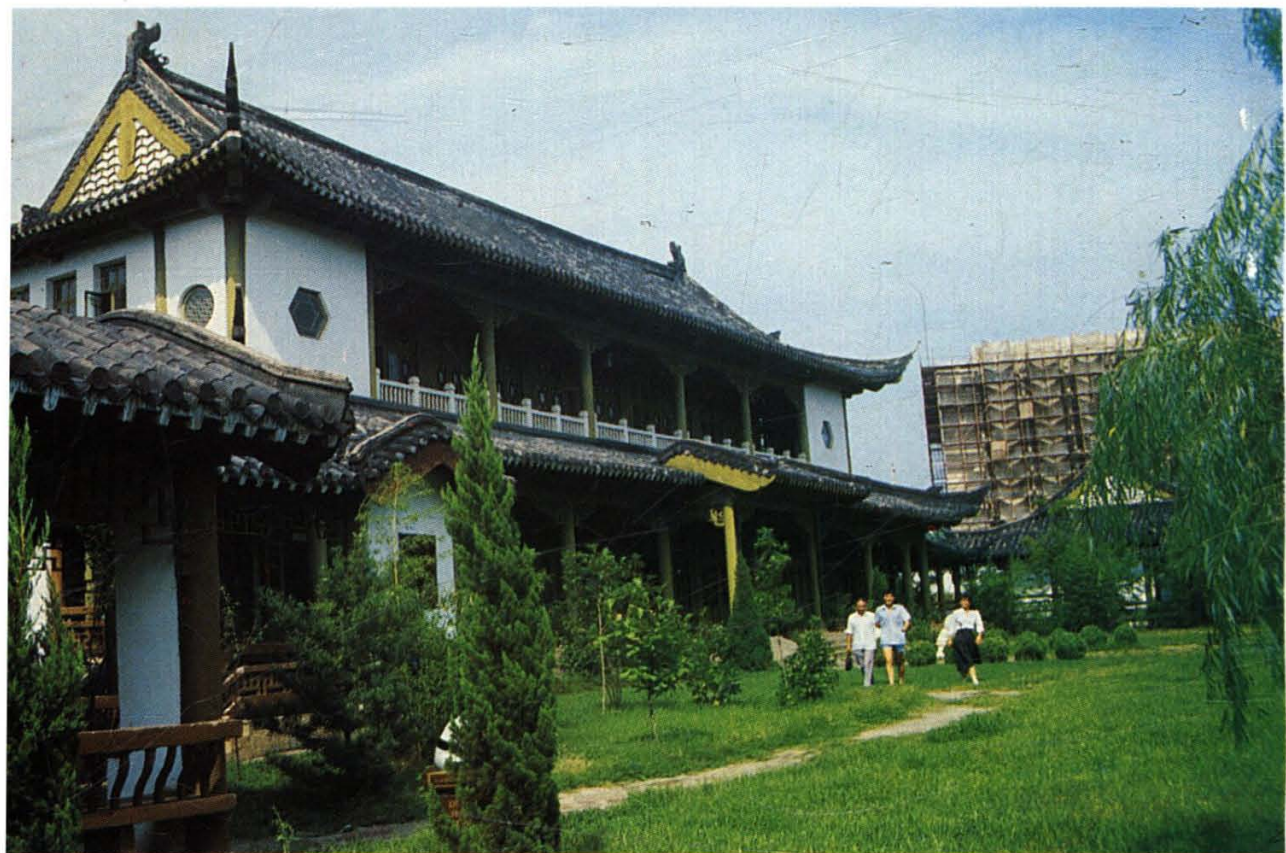
1. 北宋著名政治家、思想家、文学家王安石纪念馆。