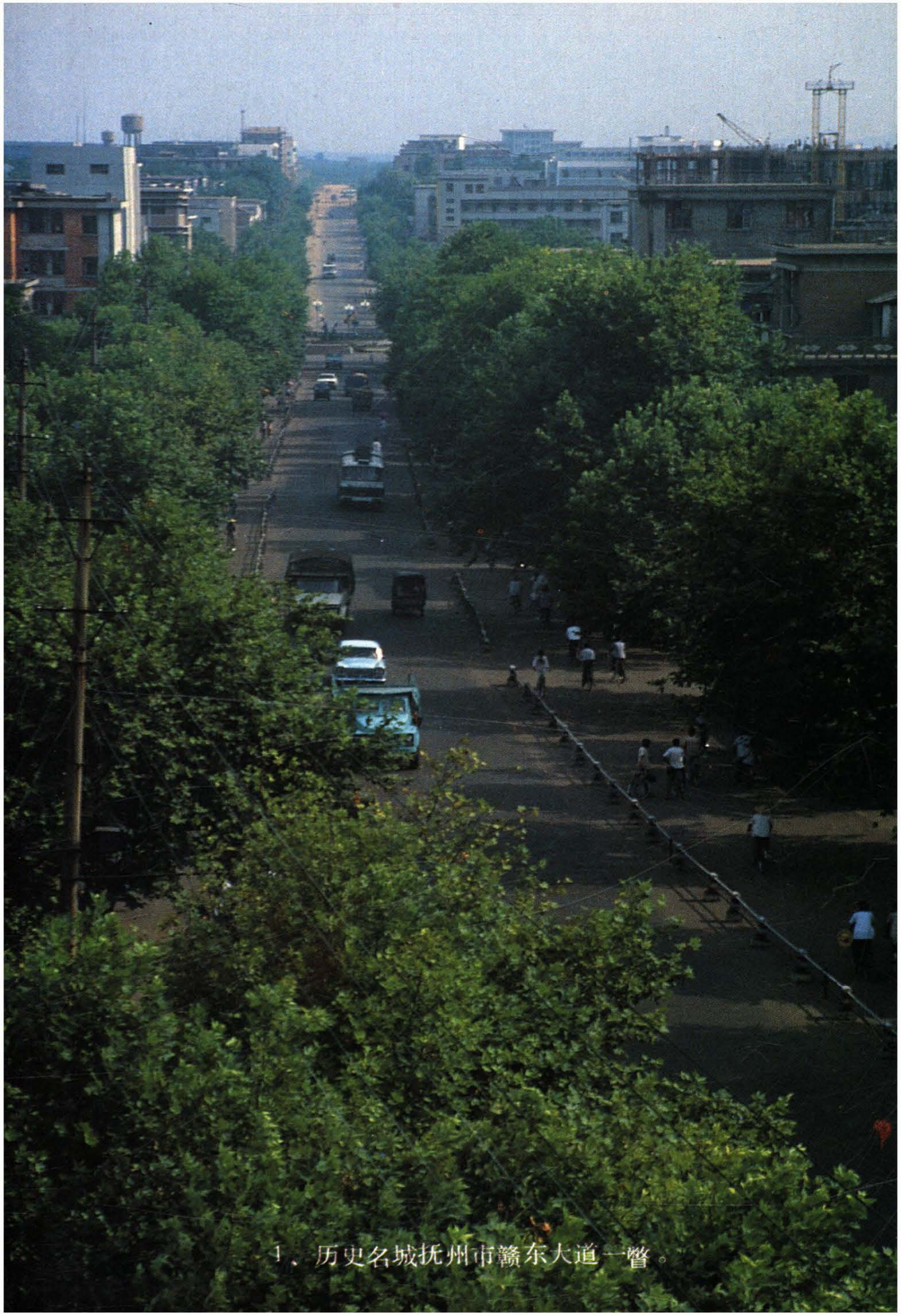
1、历史名城抚州市赣东大道一瞥。