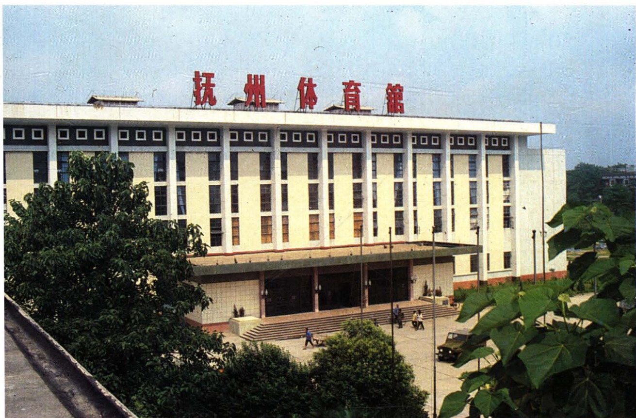
19. 全省第一流的体育馆。