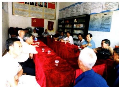
坪田镇村史座谈会