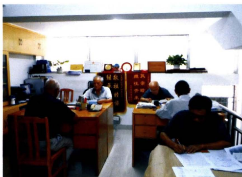
编纂在紧张中进行