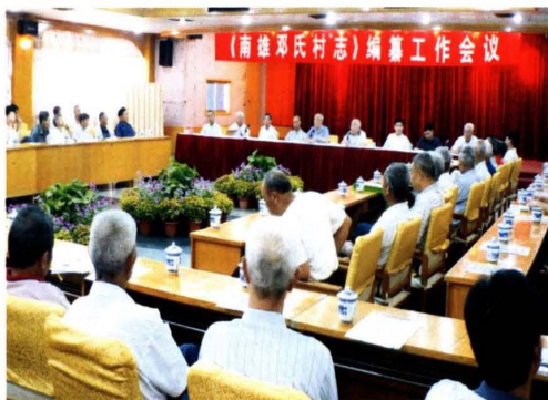
2011年8月25日编纂工作动员会