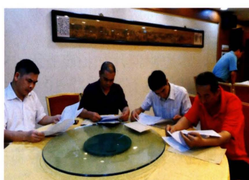
编委成员审核稿件