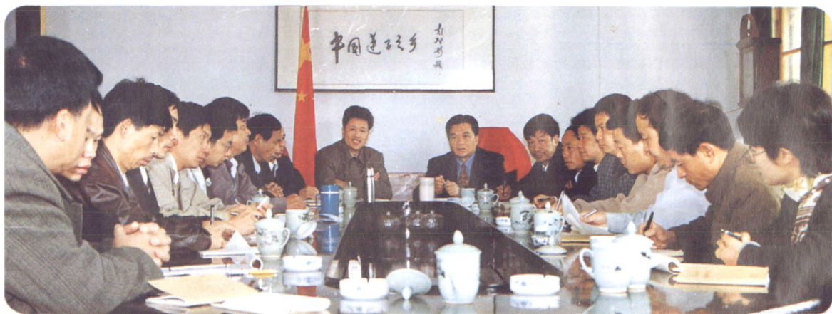
党政班子研究工作