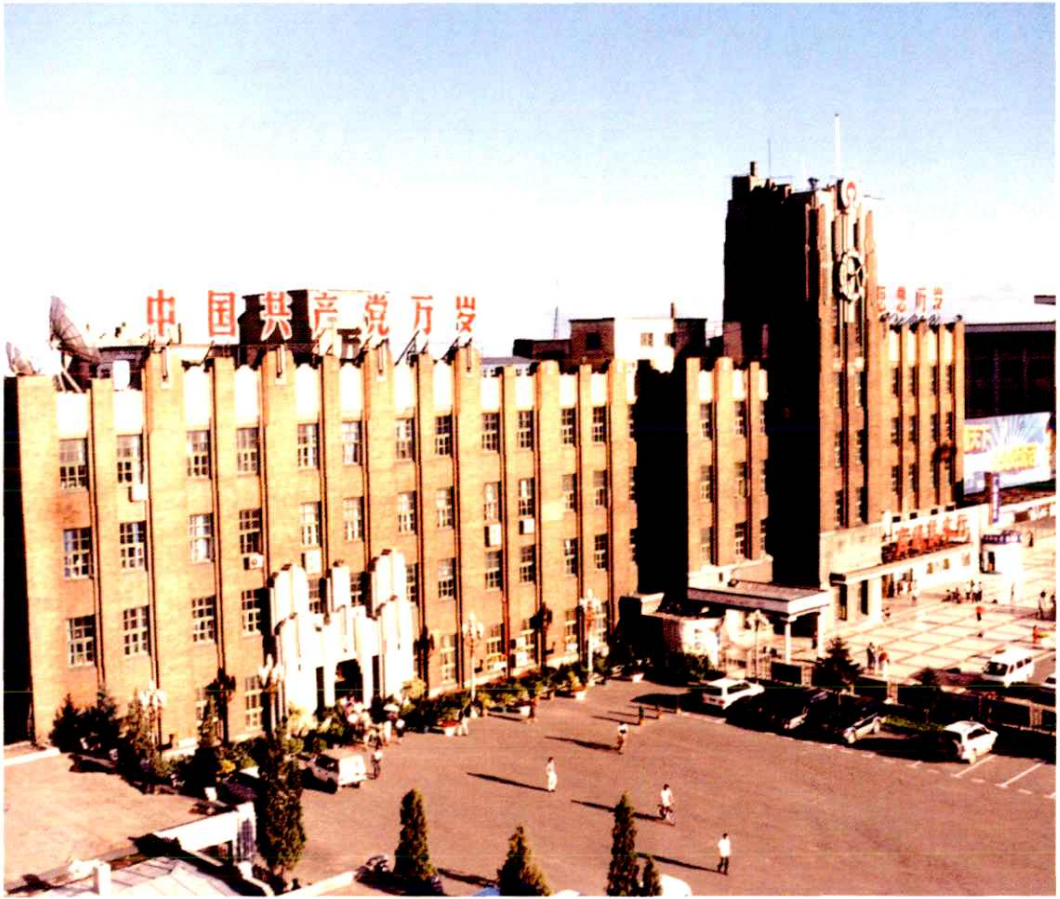
齐齐哈尔铁路分局办公楼