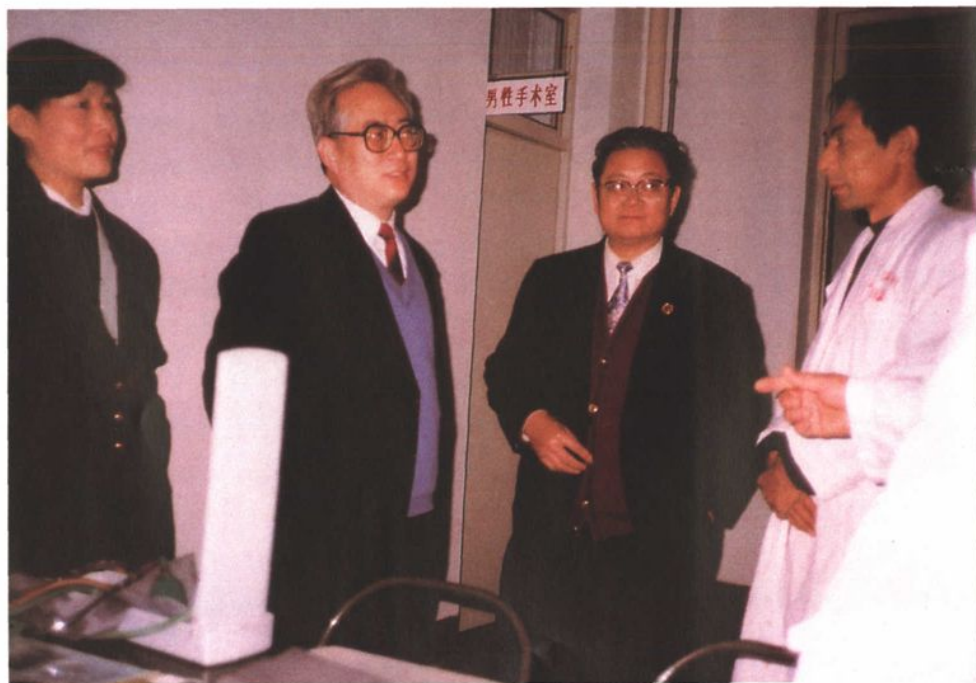
1994年11月，国家计生委副主任张维庆视察淄博市计划生育工作，图为张维庆副主任（左二）听取淄博市计划生育研究所所长吴继强（右一）的工作汇报。