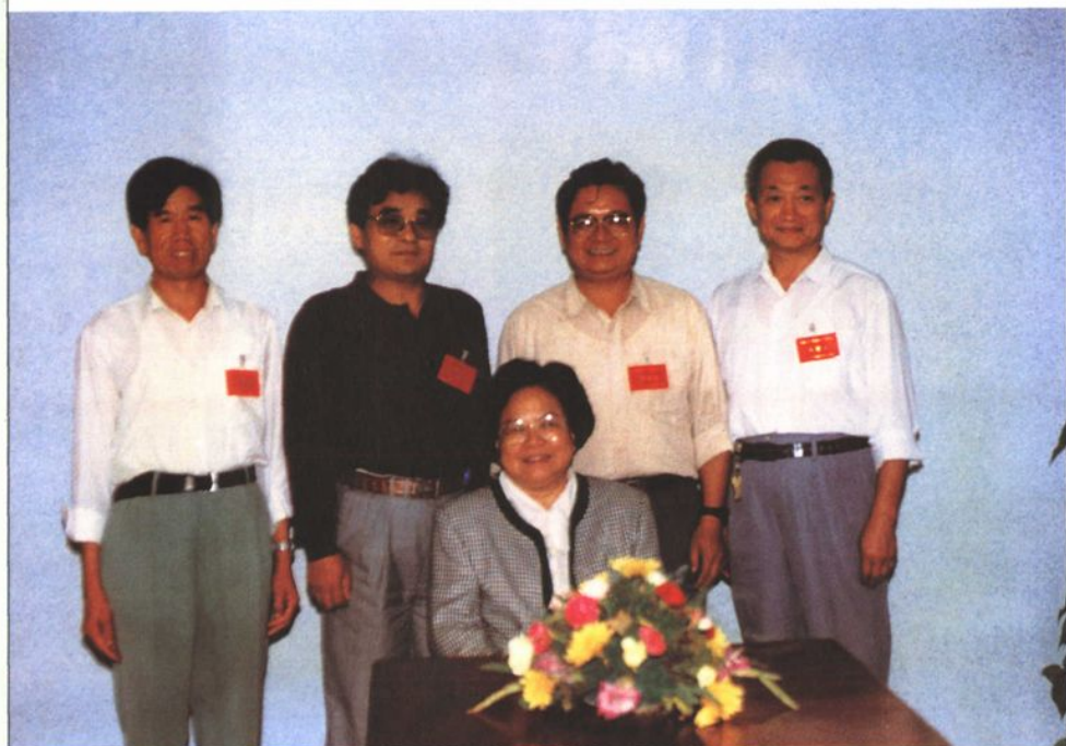
1996年9月，国务委员、国家计生委主任彭珮云（前一）在山东省计划生育“三结合”工作会议上接见淄博市与会代表。