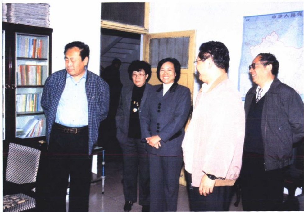
1999年11月8日，中共淄博市委书记阎启俊（左一）、市政府副市长关玛莉（左二）到市计生委现场办公，了解全市人口与计划生育工作情况。