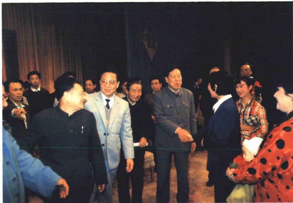
1984年4月，山东省人大副主任林萍（前排左四）在省计生委主任刘汉彬（前排左五）、淄博市委书记赵志浩（前排左三）等陪同下专程来淄博观看计划生育题材的现代京剧《四喜临门》。图为演出结束后接见剧组全体演职员。