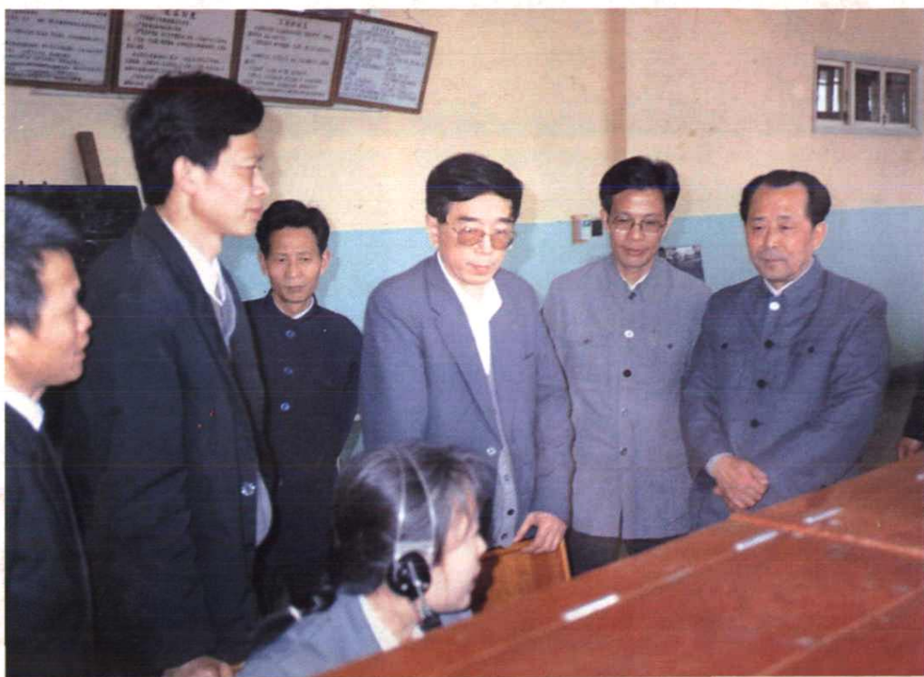
1989年4月7日至10日，邮电部副部长朱高峰（右三）在省局局长刘兆存（右一）、地委副书记王际贤（右二）的陪同下，视察吉安地区邮电工作。