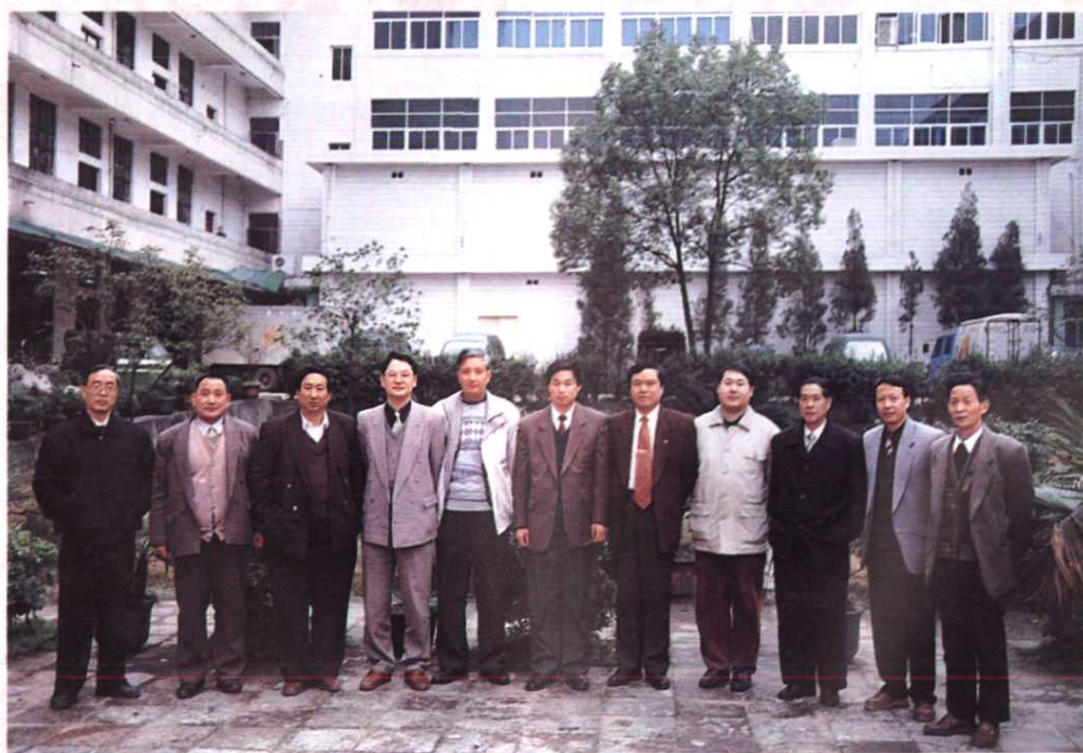
现任地区局领导成员合影。