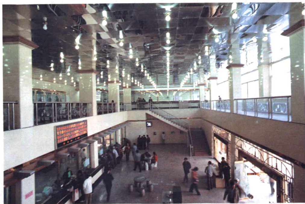
地区局邮电营业厅。