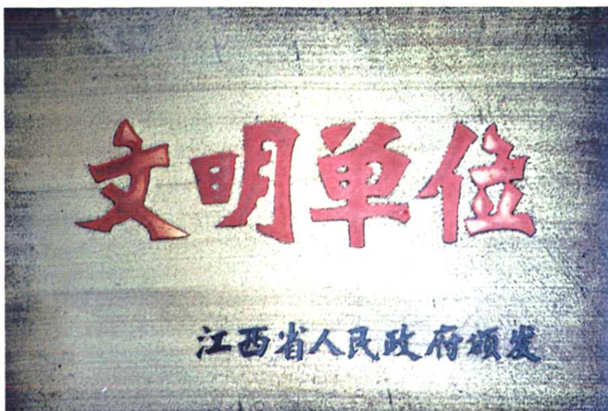
1992年7月，江西省人民政府授予吉安地区邮电局“文明单位”称号。