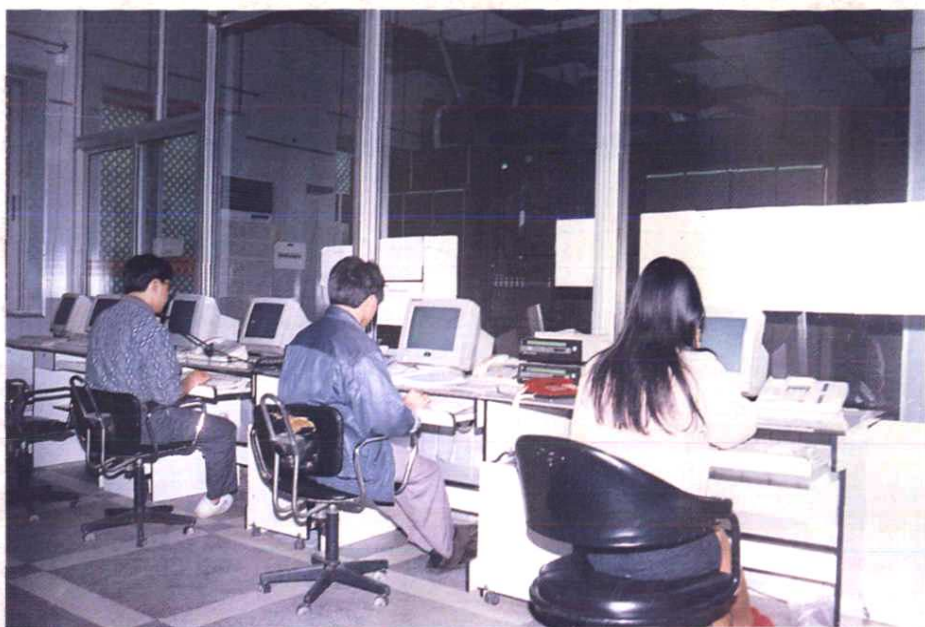
地区局程控电话交换机房。