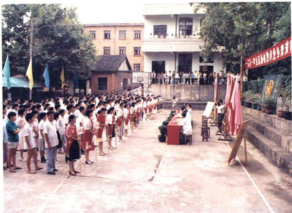
1991年，全区邮电职工技术表演赛在吉安隆重举行。