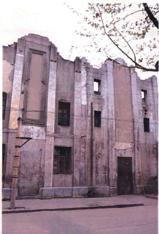
1941年吉安邮政局旧址（设吉安市上永叔路，即现市制药厂）。