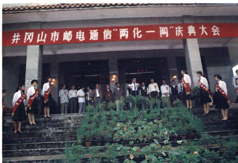
1994年5月18日， 井冈山市邮电局率先在 全区实现通信“两化一 网”，召开庆典大会。