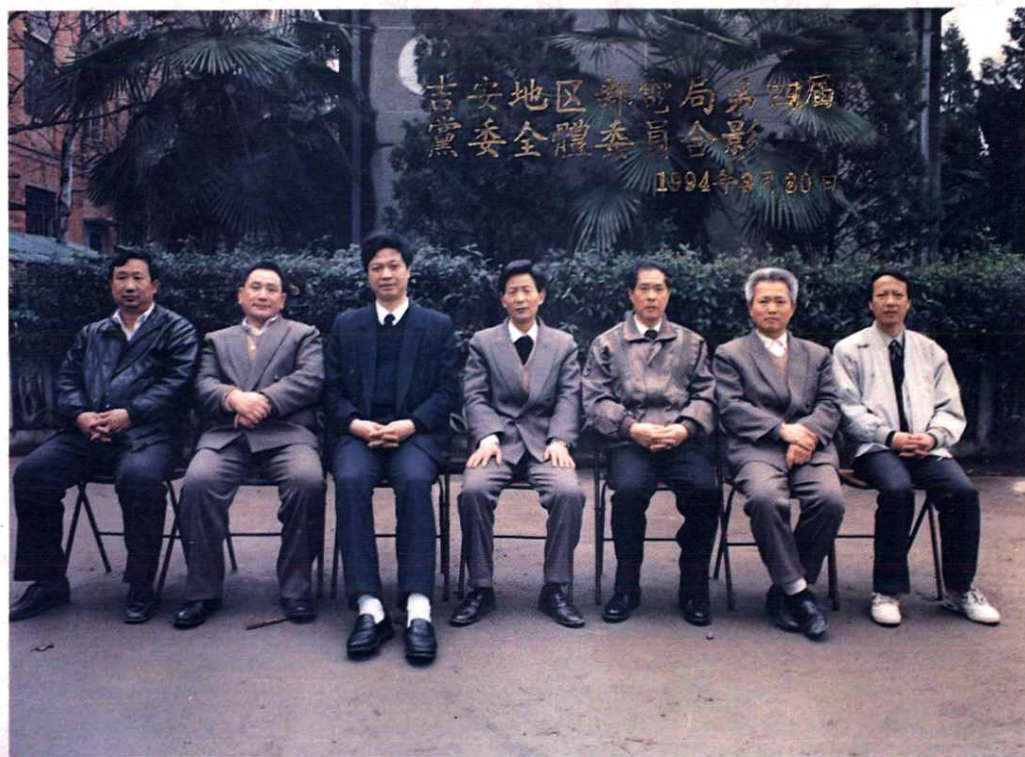
吉安地区邮电局第四届党委委员合影。