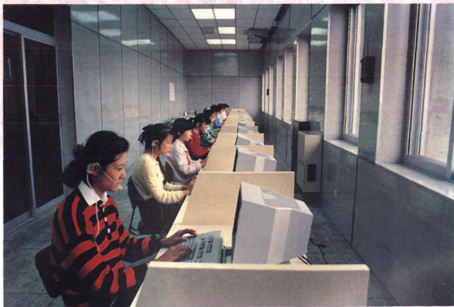
地区局程控电话无绳台。