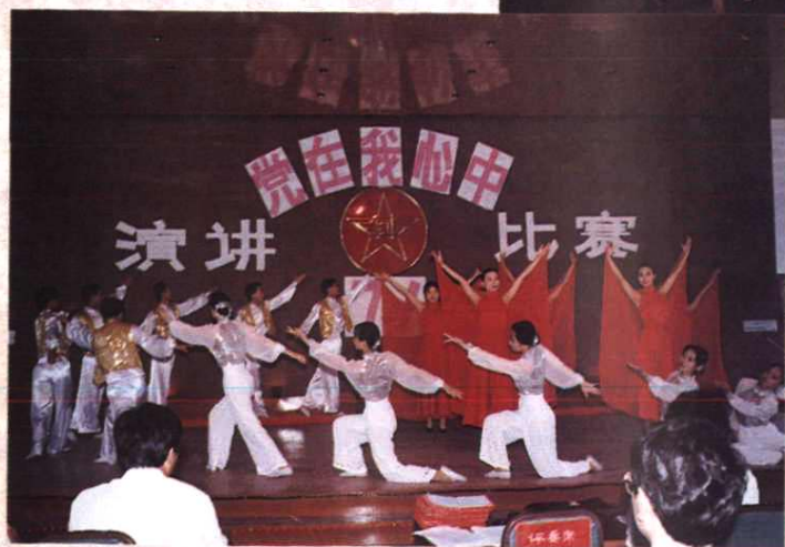
地区局举行“党在我心中”演讲比赛。