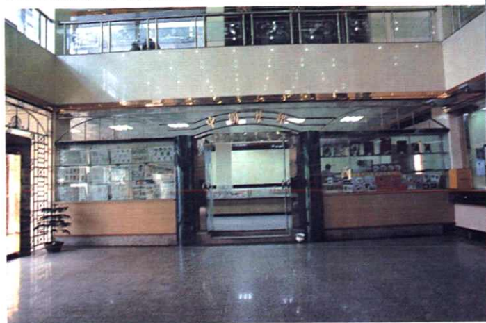
地区局邮票公司营业厅。