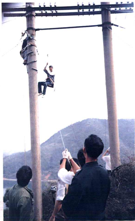
地区线务局职工架设峡江巴邱至水边横跨赣江的架空光缆。