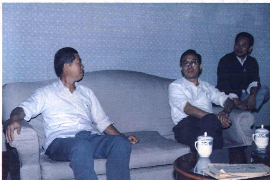
1986年5月26日，邮电部副部长吴基传（右二）在视察吉安地区邮电工作时，与井冈山市市长匡远伦（左一）进行交谈。