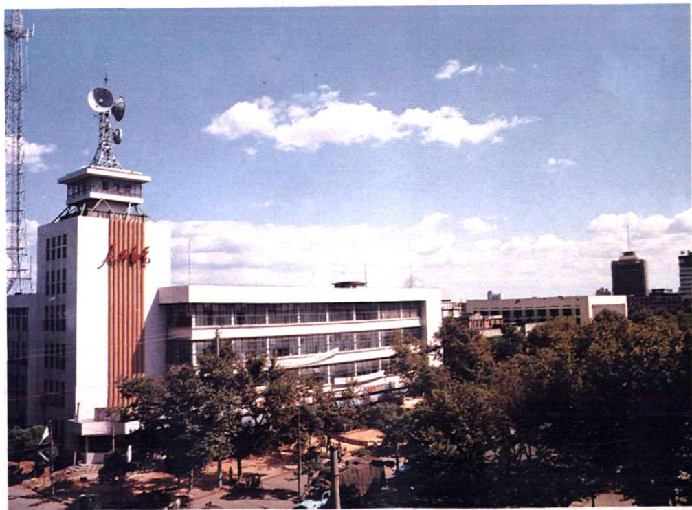
吉安地区邮电局邮电大楼。