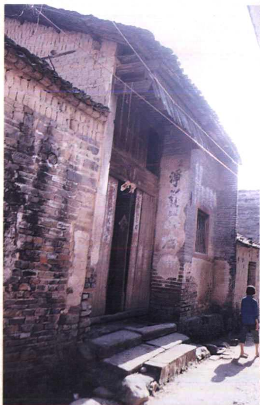
1930年赣西南赤色邮政总局旧址。