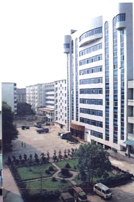
1995年新建的地区局邮电综合大楼。