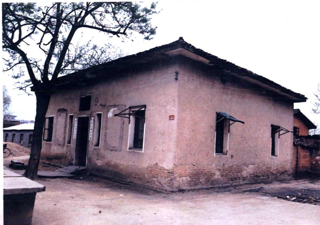
1939年吉安电报局局址(设吉安市皂角树,现阳明路小学内)。