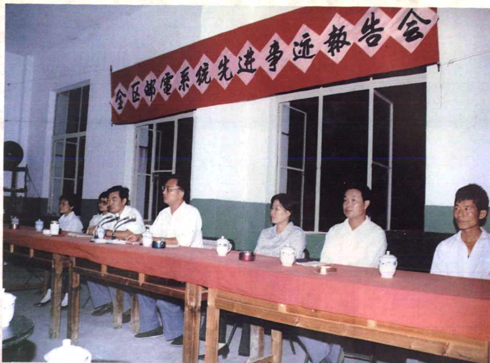
1991年4月10日，地区局组织全区邮电系统先进事迹报告团巡回报告。