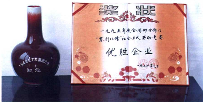
地区实现“两化”被评为该年十大新闻之一，授予奖杯(左)。1995年被评为全省“赛、创、比、增”社会主义劳动竞赛优胜企业称号，授予奖牌(右)。