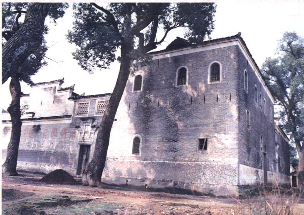
1938年吉安电报局旧址（设吉安县敦厚村）。