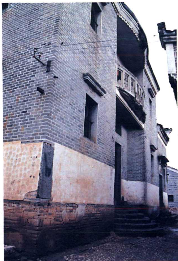
1938年吉安电报局搬到吉安县敦厚村(上图是电报局旧址,当时南昌电报局、省电政管理局亦迁在此处)。