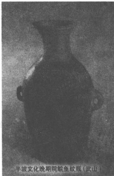
半坡文化晚期院鲟鱼纹瓶(武山)

“甘肃”作为一个名称词，出现于北宋西夏时期。西魏时始改张掖郡为甘州，以境内之甘峻(浚)山得名；隋时改酒泉郡为肃州。“甘肃”一名，乃合甘州、肃州首字而得。甘肃省的正式设置始于元代。但建置和行政区划的完成实在清代。新民主主义时期，地处甘肃省陇东的庆阳地区大部为中国共产党领导的“陕甘宁边区”(陕甘宁省，由地处三省边缘交界一带而得名)的一部分。1949年7月，中国人民解放军挺进甘肃境内。28日解放平凉，8月3日解放酒泉，12月29日解放武都。8月，即成立了甘肃行政公署，12月2日，中央人民政府根据《中国人民政治协商会议共同纲领》，决定建立甘肃省人民政府。1950年1月8日在兰州市隆重举行了甘肃省人民政府成立大会。