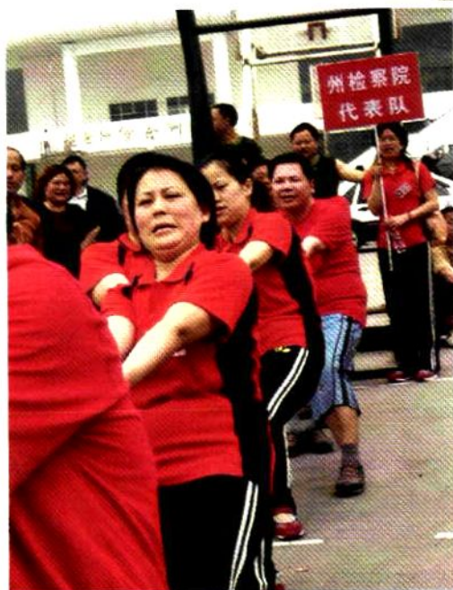
州检察院干警参加州工会组织的拔河比赛。