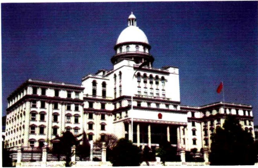
2007年 建成的湘西自 治州人民检察 院技侦大楼。