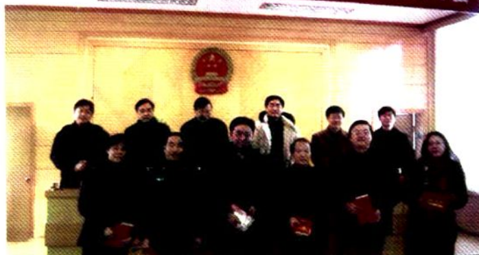
州检察院表彰先进