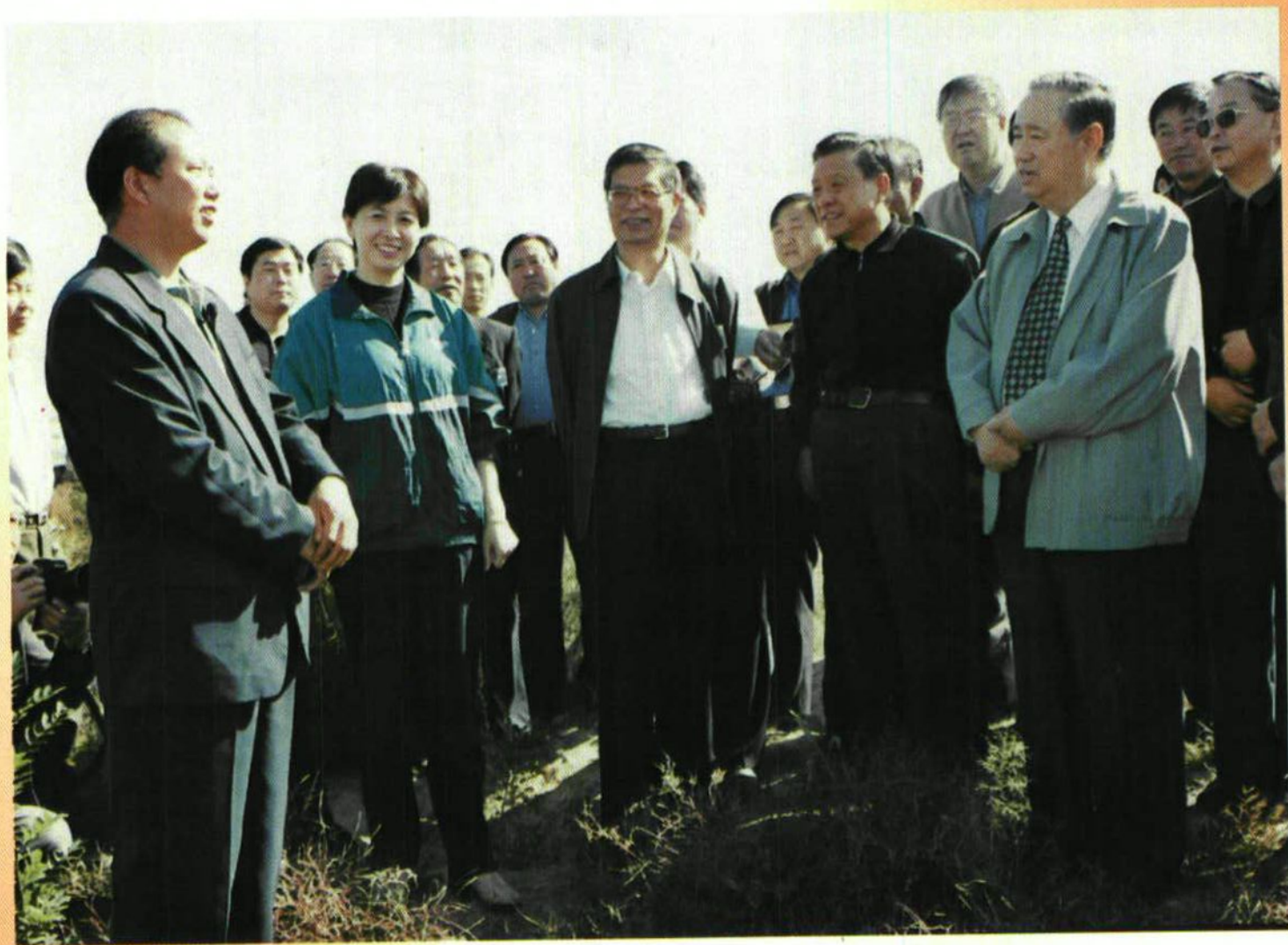
中共中央政治局委员、国务院副总理姜春云在柳林镇视察秀美山川建设情况