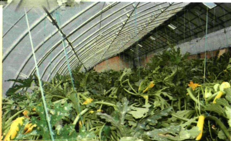
隆冬季节，大棚里却春意盎然，反季节蔬菜长势喜人