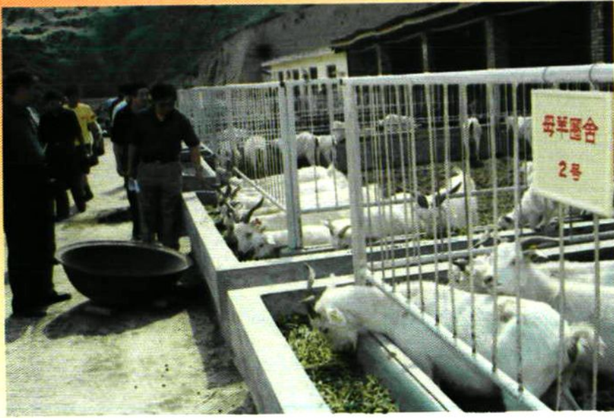
舍饲养羊成为农民 增收的有效途径