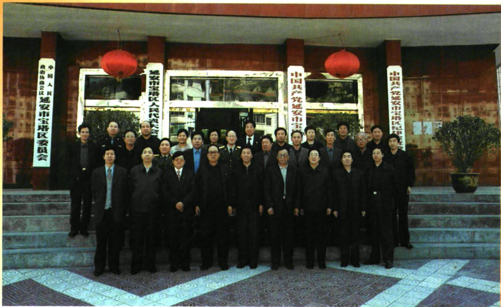
团结奋进的宝塔区四套班子领导成员