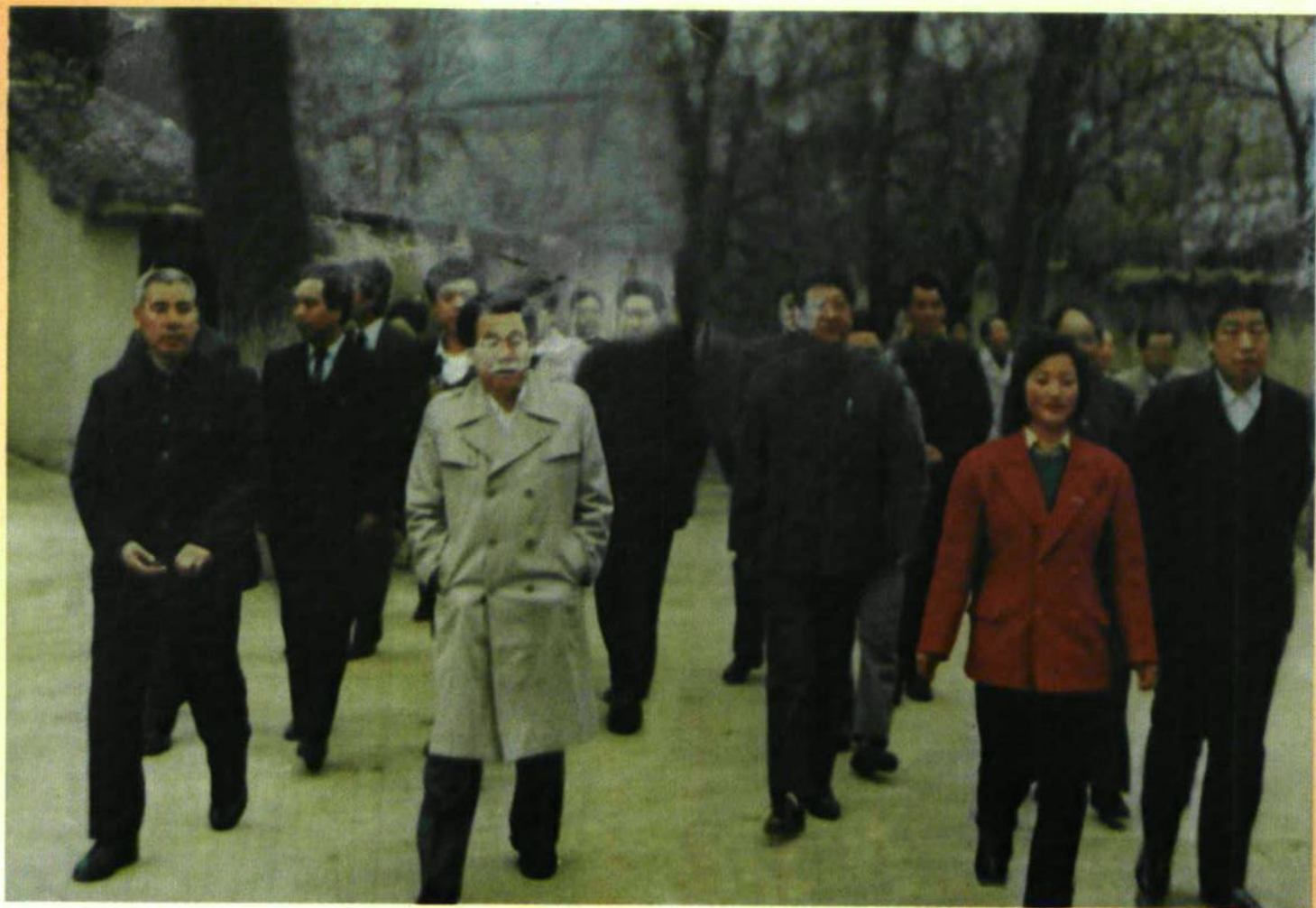
李瑞环同志视察延安