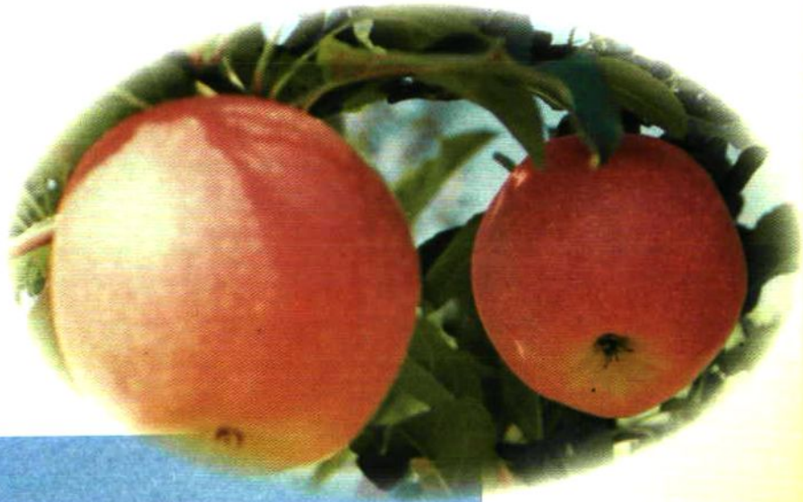
享誉国内外 红富士苹果，