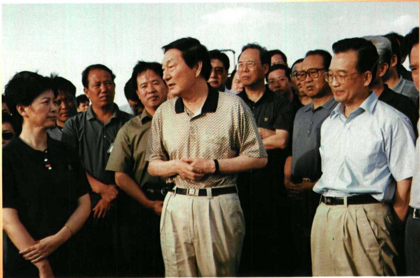
2002年7月16日至17日，朱镕基总理和温家宝副总理再次来延视察退耕还林草和生态农业建设情况