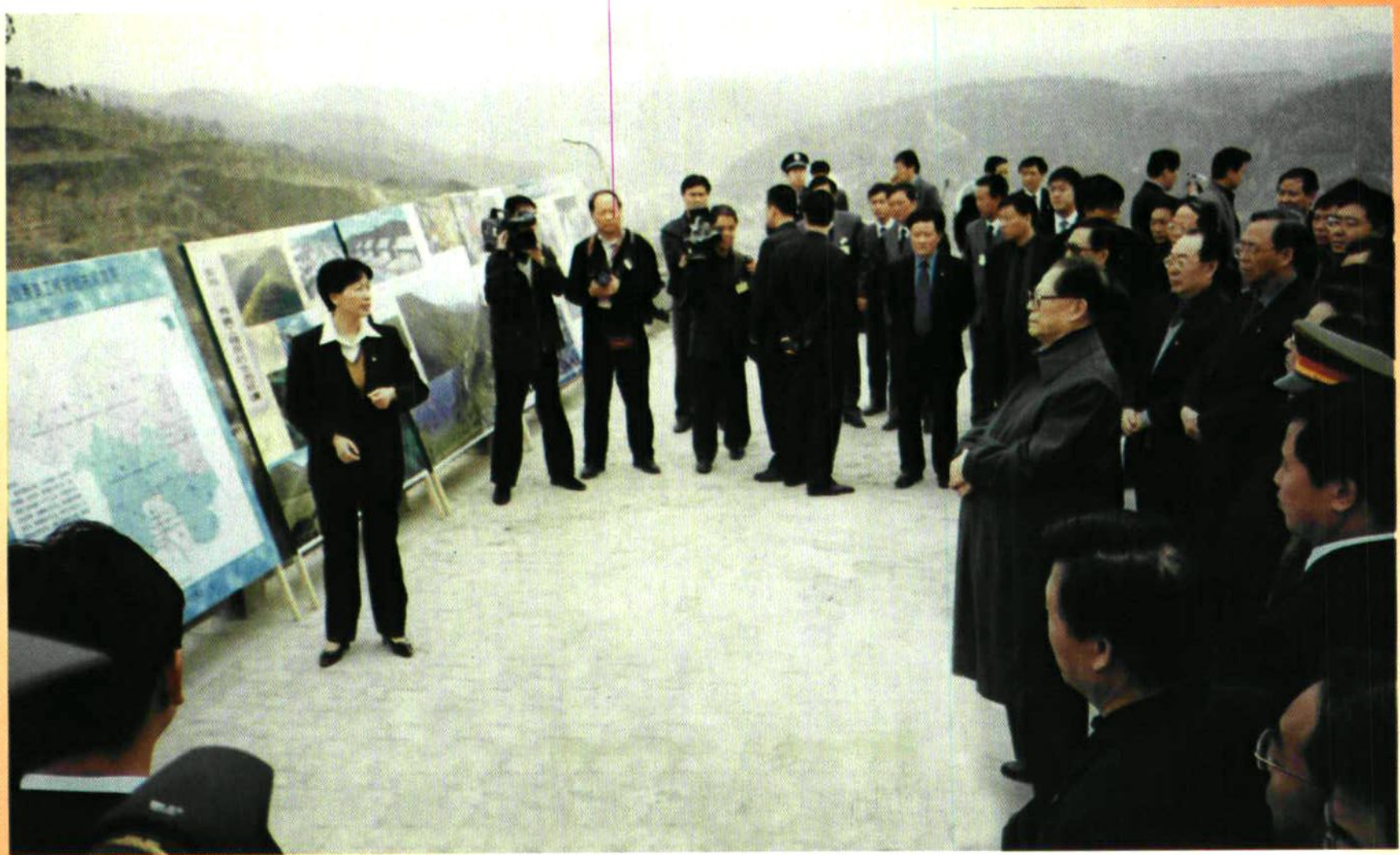
2002年3月29日，江总书记在省、市有关领导陪同下，来延安视察