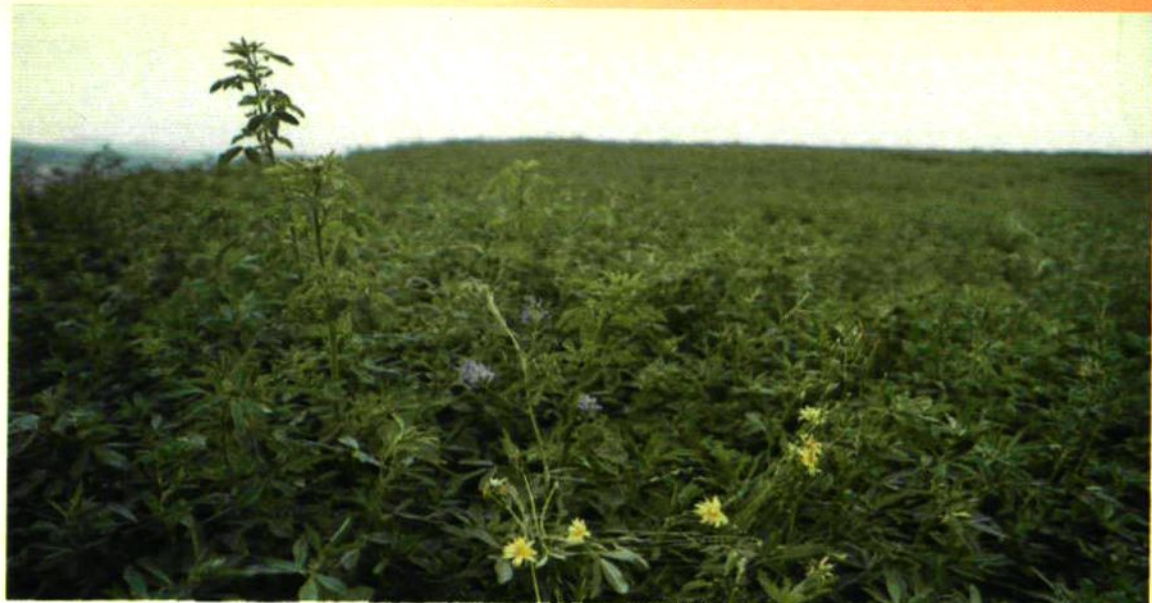
全区大面积种植优良牧草，为封山禁牧后发展养殖业创造了条件