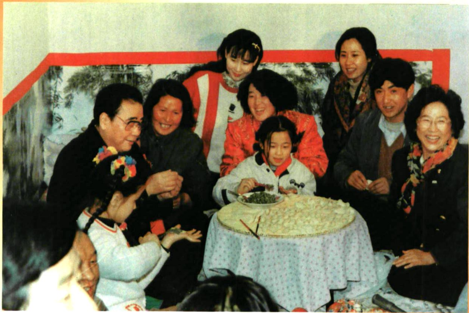
1995年春节，李鹏同志到延安看望老区人民、与枣园群众欢度春节