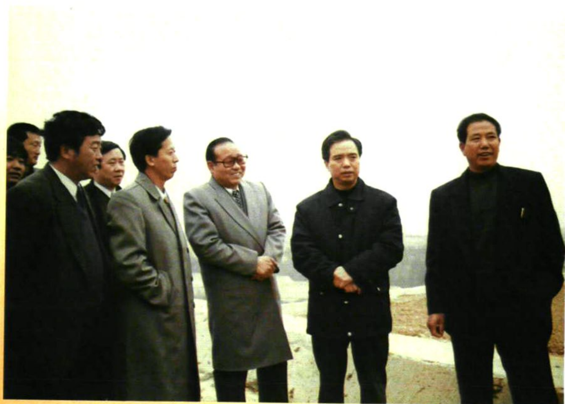
省委书记李建国视察宝塔区秀美山川建设