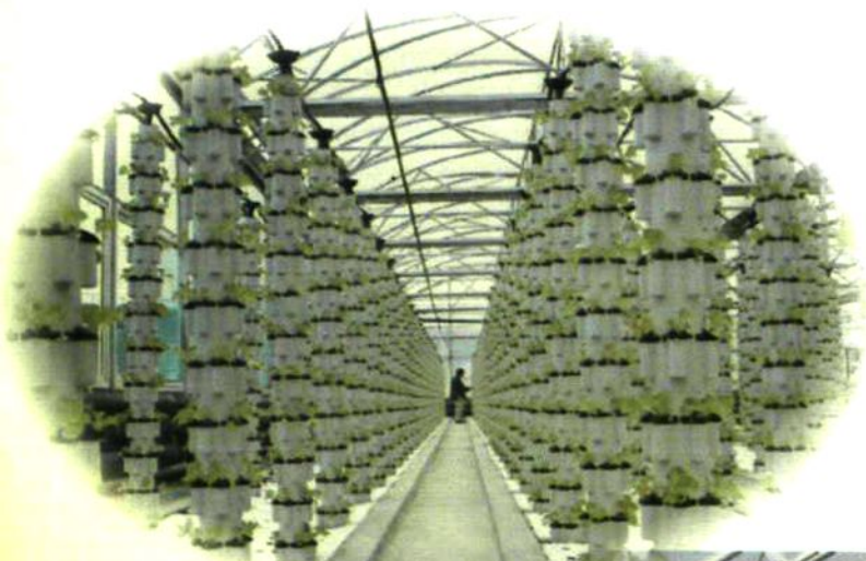
棚栽业已成为全区的支柱产业，图为高科技蔬菜大棚