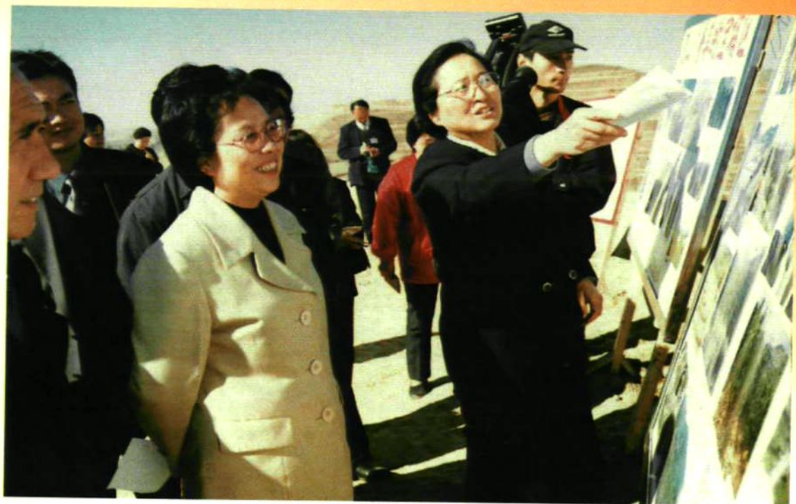
全国人大副委员长何鲁丽视察宝塔区枣河流域治理情况