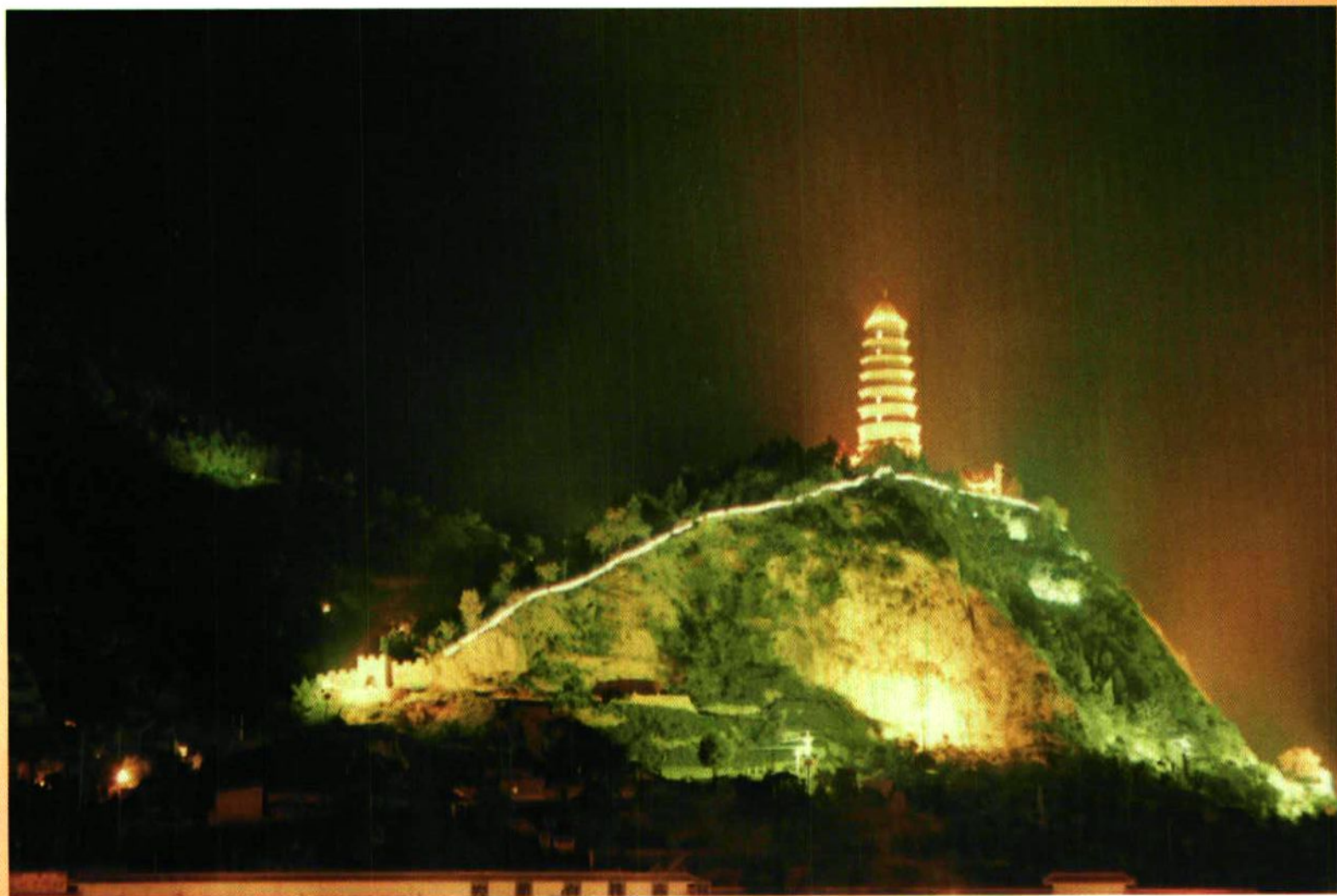
雄伟壮观的宝塔是革命圣地延安的标志