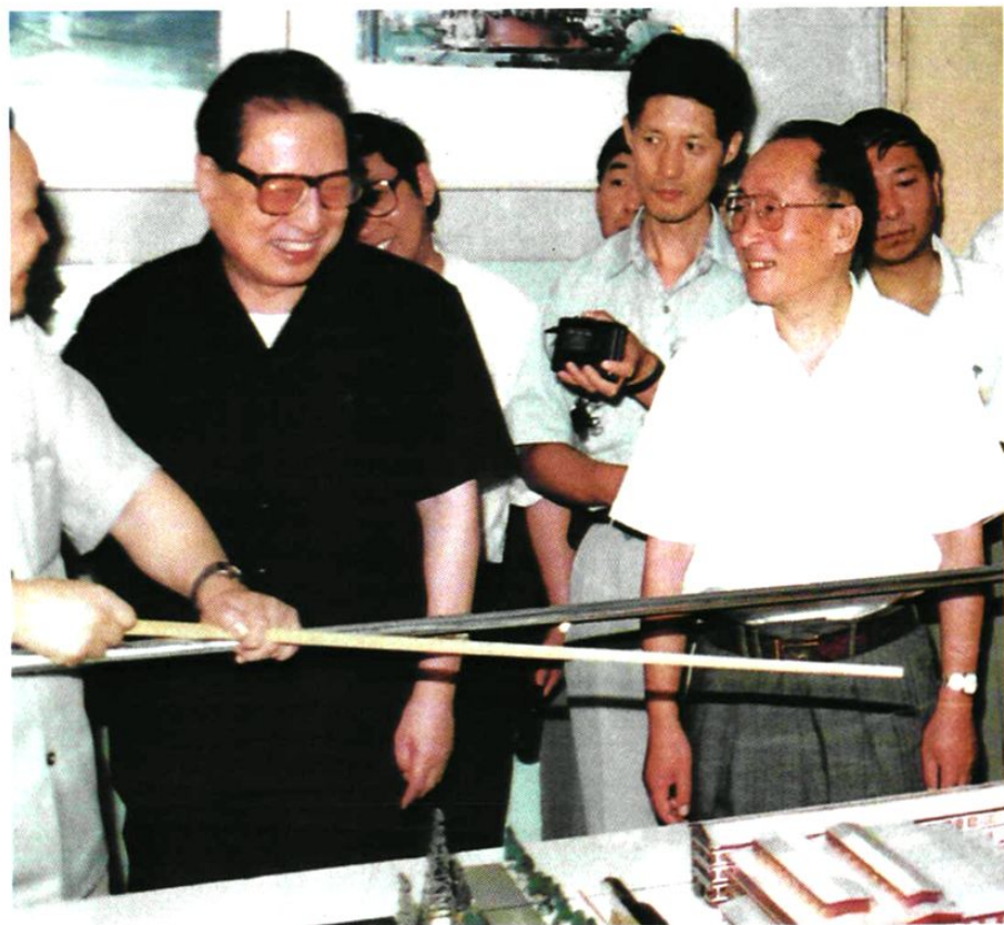
1996年7月20日，中共中央政治局常委、全国人大常委会委员长乔石视察沈阳重型机器厂