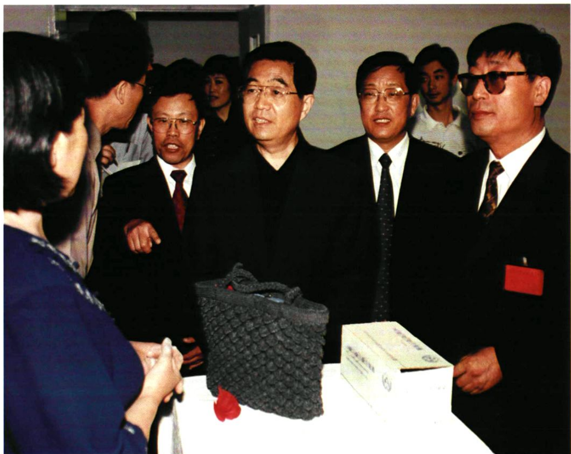
2002年6月16日,中共中央政治局常委、国家副主席胡锦涛视察沈阳市 大东区再就业培训中心