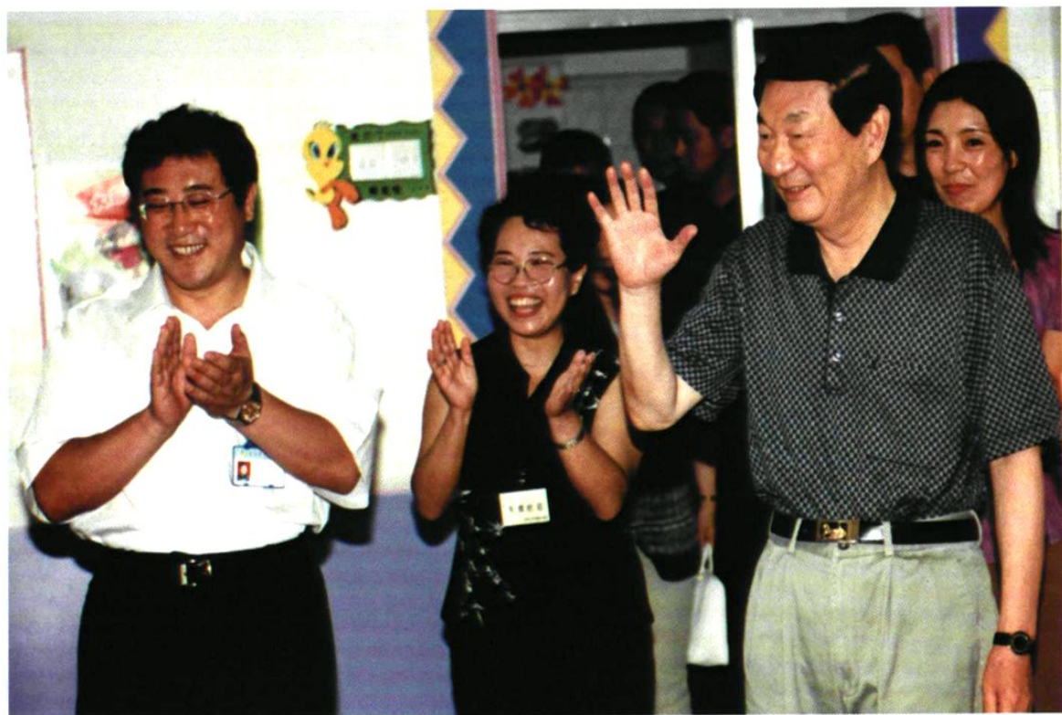
2002年7月22日，中共中央政治局常委、国务院总理朱镕基视察沈阳市沈河区永环社区