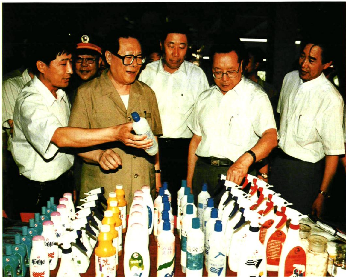
1995年6月17日,中共中央总书记、国家主席、中央军委主席江泽民 视察沈阳油脂化学厂