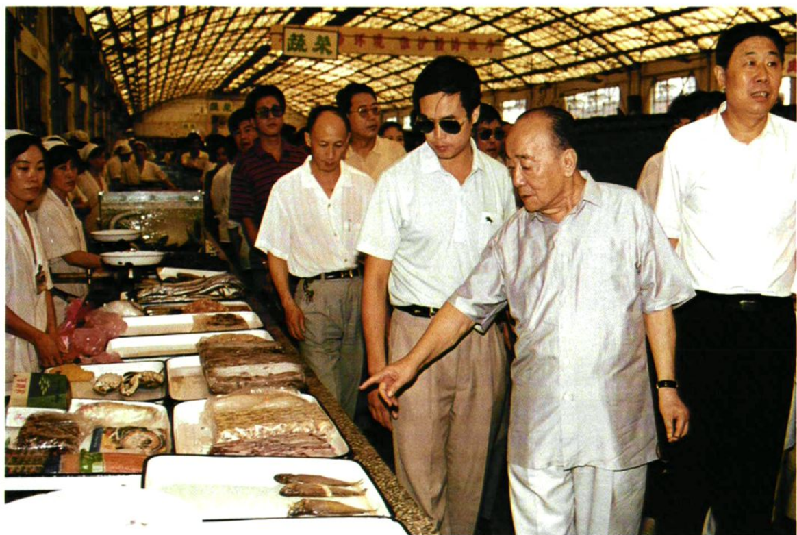
1994年7月20日，原国家主席杨尚昆视察沈阳市皇姑区北行农贸市场