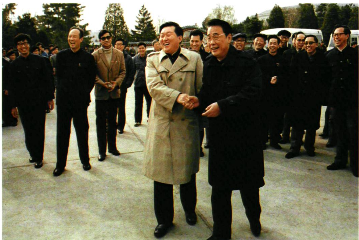
1986年11月6日，国务院副总理李鹏视察东北工学院