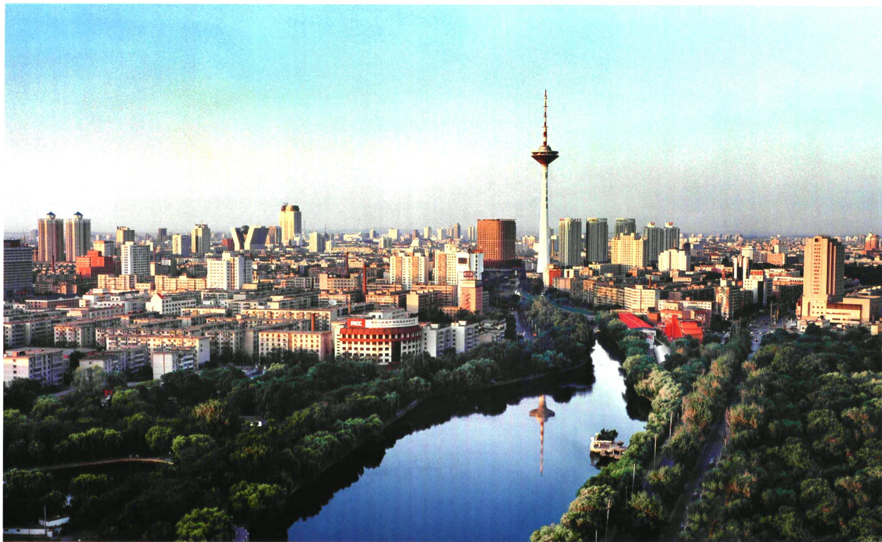
沈 阳 新 貌