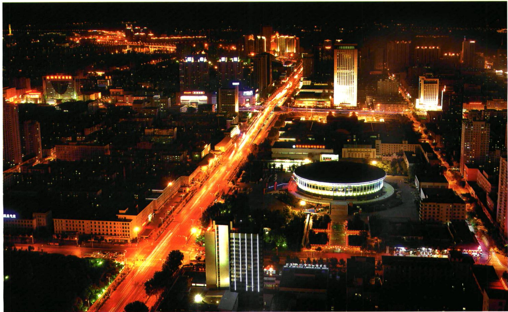
沈 阳 夜 景