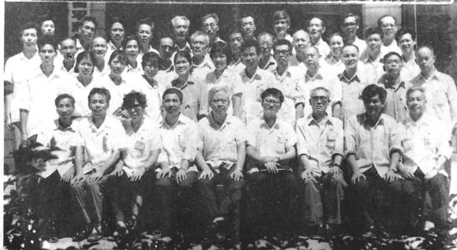
一九八五年八月六日至十日，隆重召开政协平潭县第二届委员会第一次会议。图为全体与会人员合影留念。