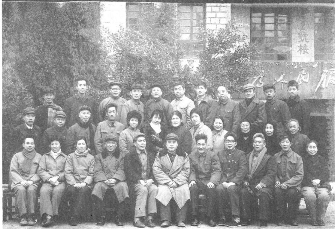
1984年2月12日，在平潭县工农兵招待所召开政协平潭县第一届委员会第七次会议。图为平潭县政协一届七次会议全体与会人员合影留念。