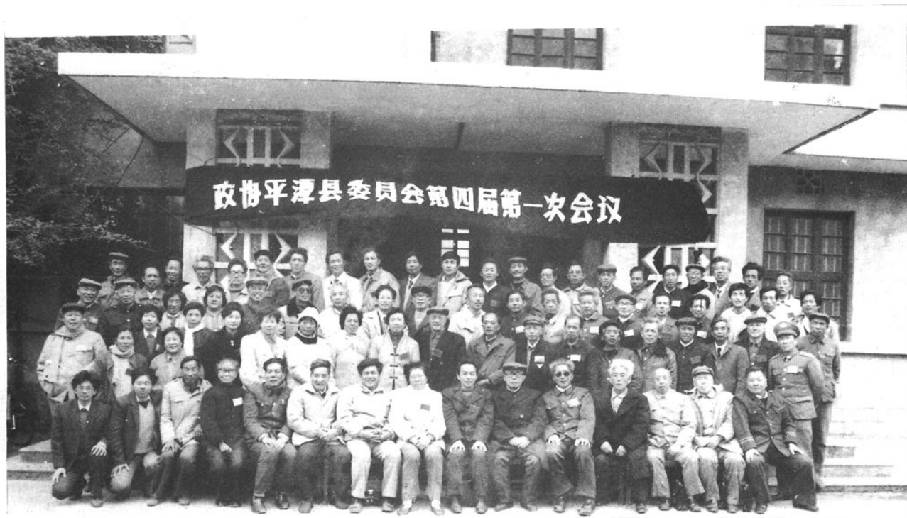
1990年1月27日至31日，在平潭县政府四楼会议室隆重召开政协平潭县第四届委员会第一次会议。图为全体与会人员合影留念。