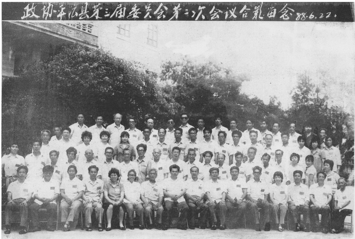
1988年6月22日至30日，在平潭县台胞接待站会议室召开政协平潭县第三届委员会第二次会议。图为全体与会人员合影留念。