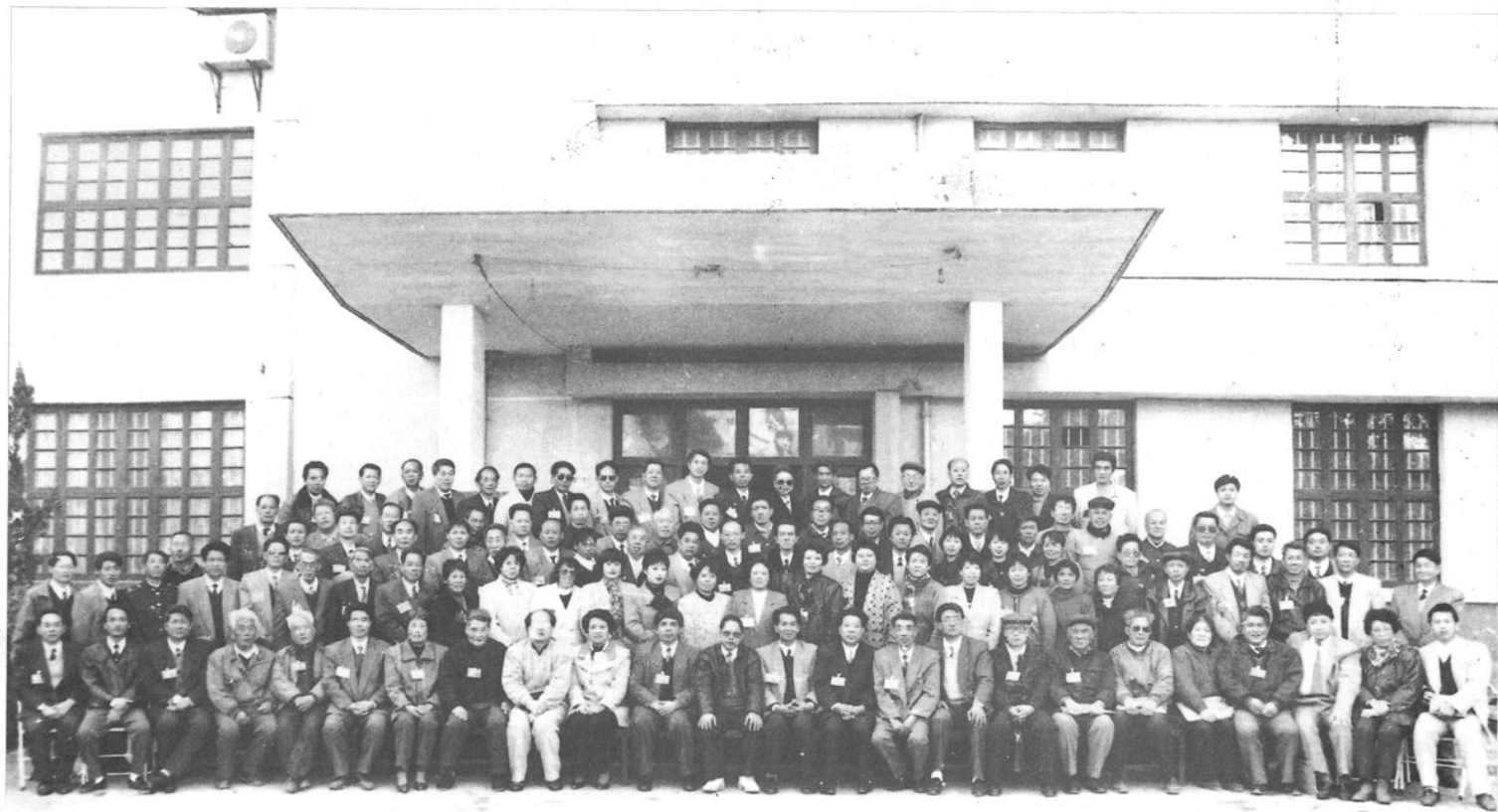
1995年2月8日至11日，在平潭县政府四楼会议室召开政协平潭县第五届委员会第三次会议。图为全体与会人员合影留念。