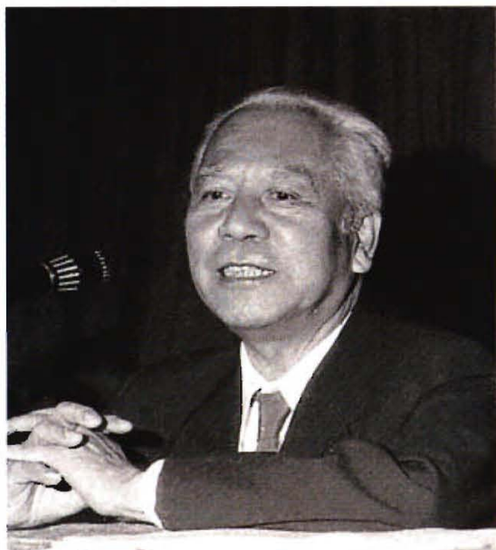
1985年10月，著名作家姚学垠 在我校讲学