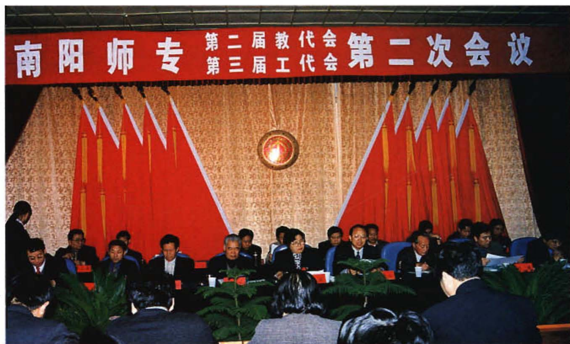
南阳师专第二届教代会、第三届工代会第二次会议