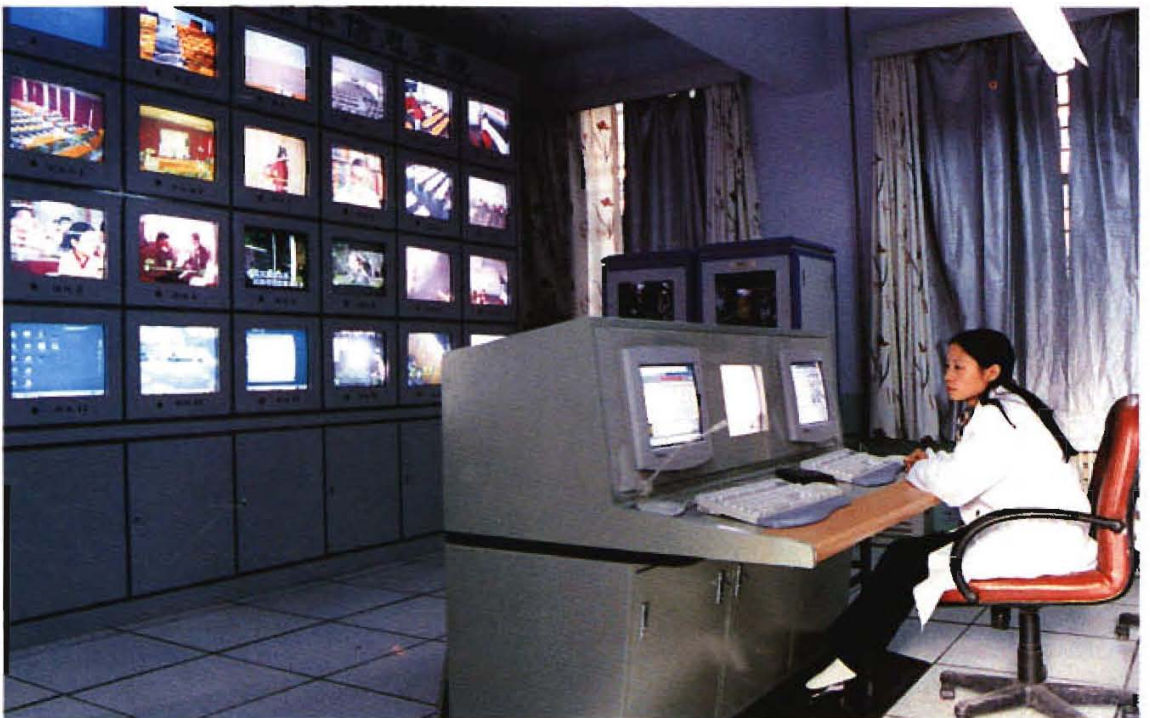
多媒体双向播控、监控教学系统