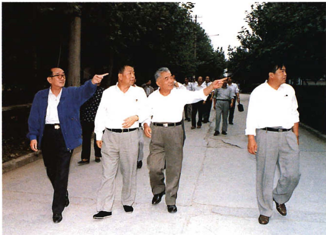
1996年9月21日，国家教委副主任张天保(左二)到我校视察工作