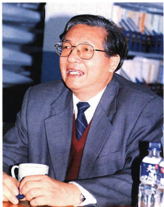
1999年10月，中科院院士、北 京大学校长、我校兼职教授许智宏 回校讲学