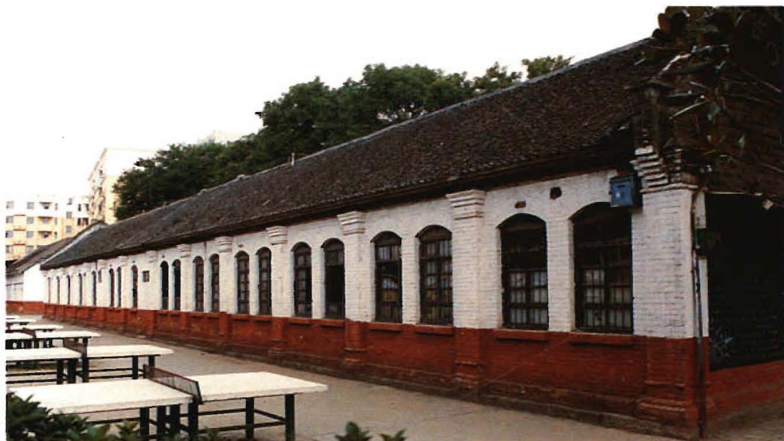
20 世纪 50 年代初期，河南省立南阳师范学校教学大楼和平房原貌