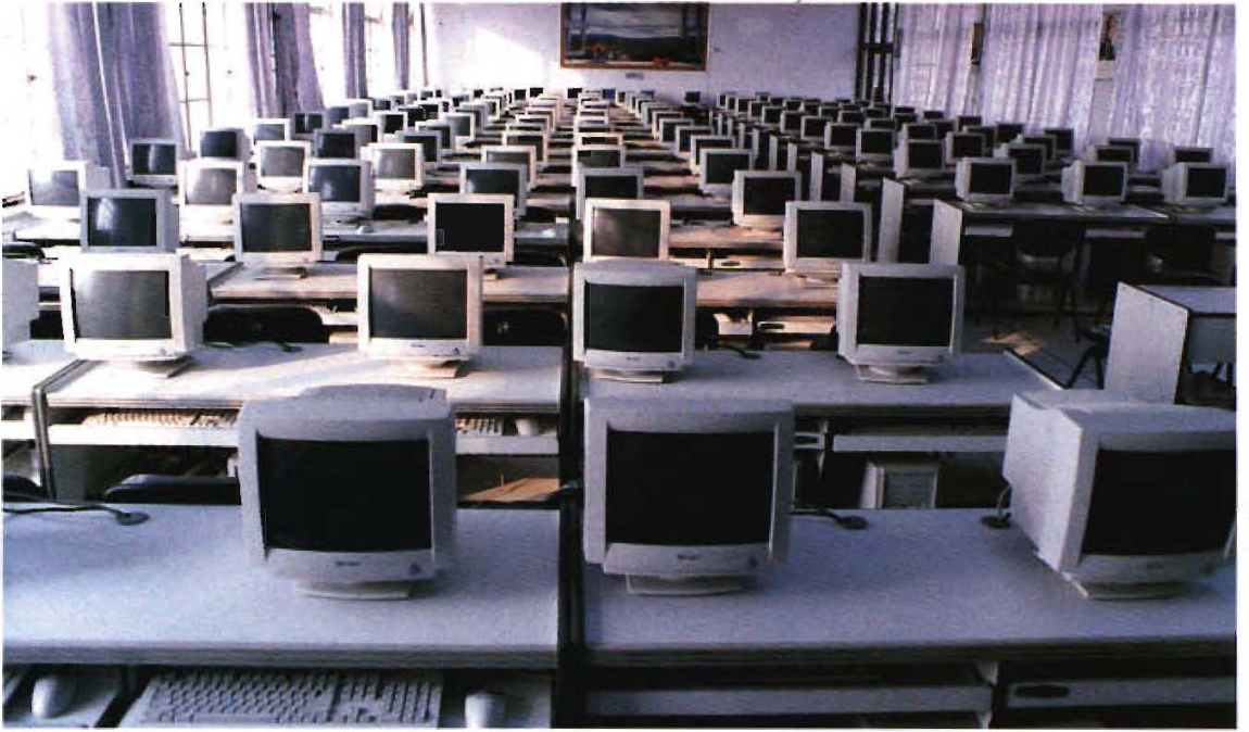
计算机开放实验室