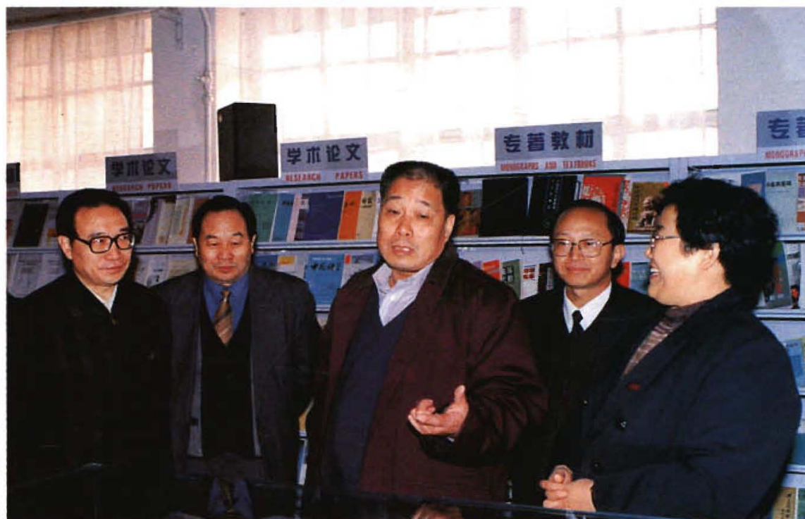
1999年11月22日，国家教育部副部长张保庆(右三)到我校视察工作