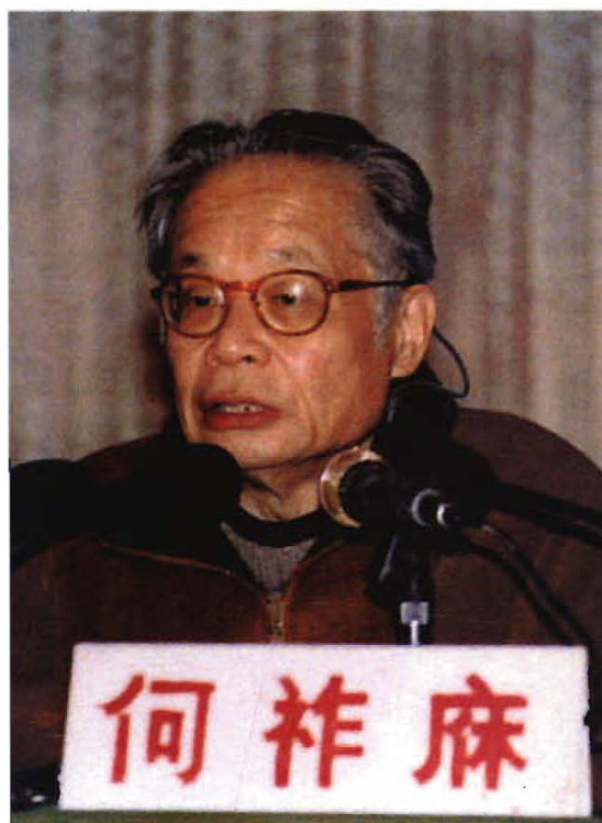
1999年11月，中科院院士何祚 麻到校讲学并受聘我校兼职教授