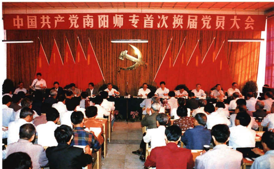
中国共产党南阳师专首次换届党员大会