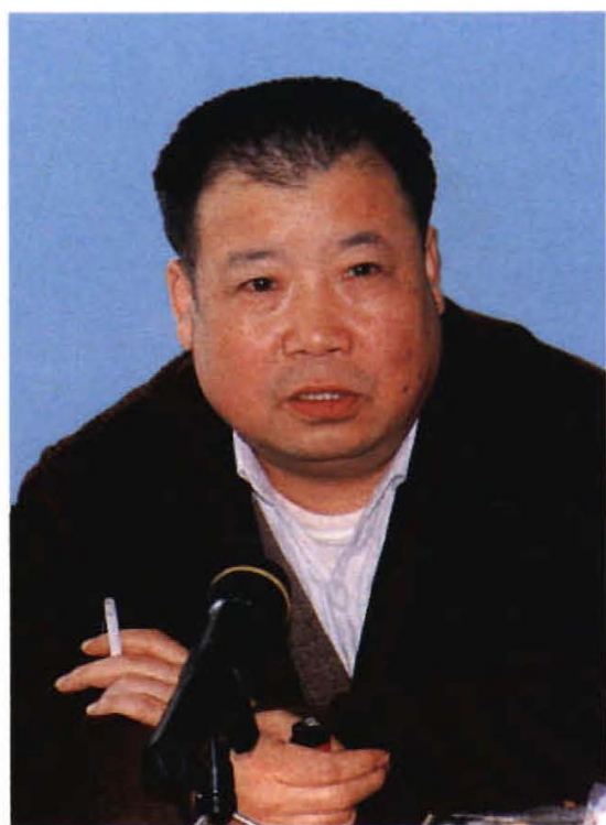
1989年11月，著名作家、我校 兼职教授二月河在校讲学