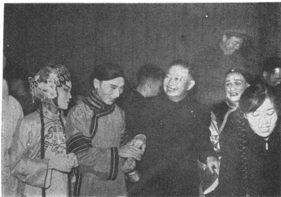
一九六〇年市五音剧团晋京演出著名京剧表演 艺术家梅兰芳先生接见邓洪山等合影