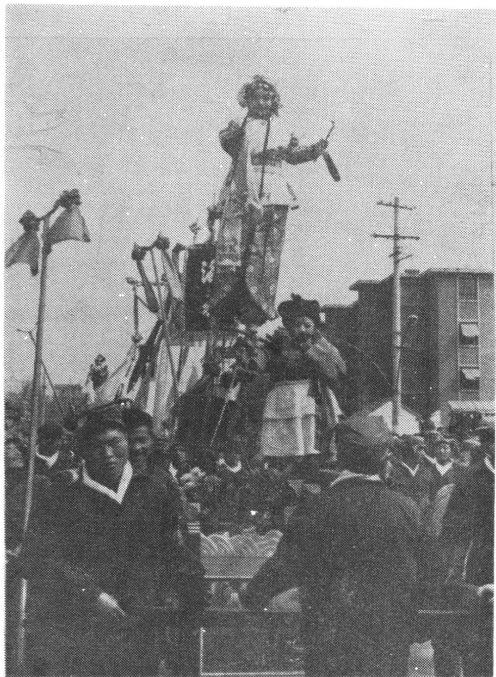
周村双人芯子（抬芯子）