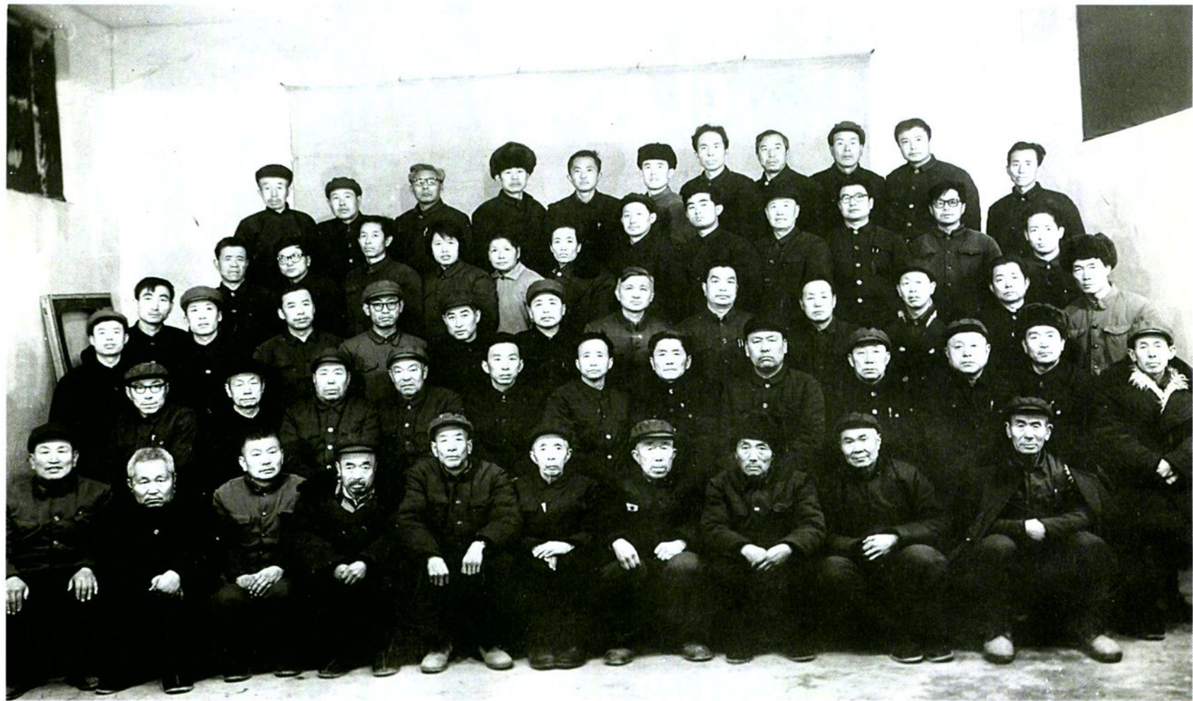
中国人民政治协商会议子洲县第一届委员会全体委员