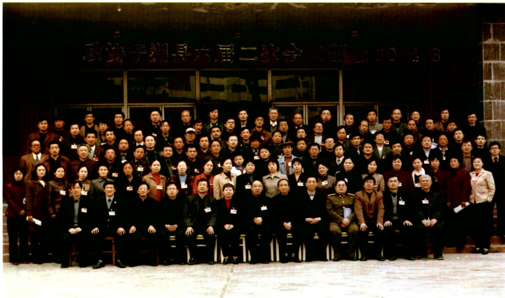
中国人民政治协商会议子洲县第六届委员会全体委员