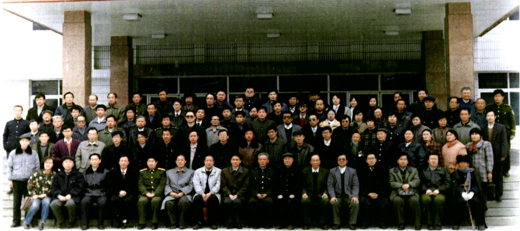
中国人民政治协商会议子洲县第五届委员会全体委员