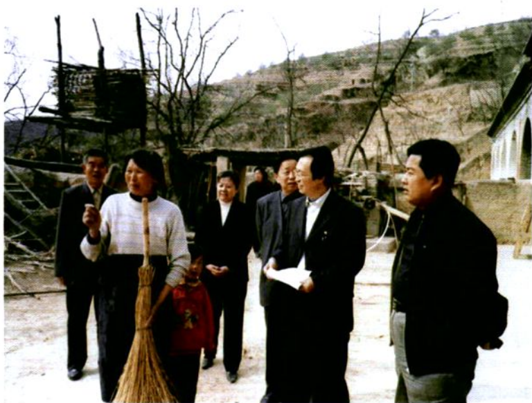
二〇〇四年四月，榆林市政协「三农问题」调研组在驼巷乡走访农户