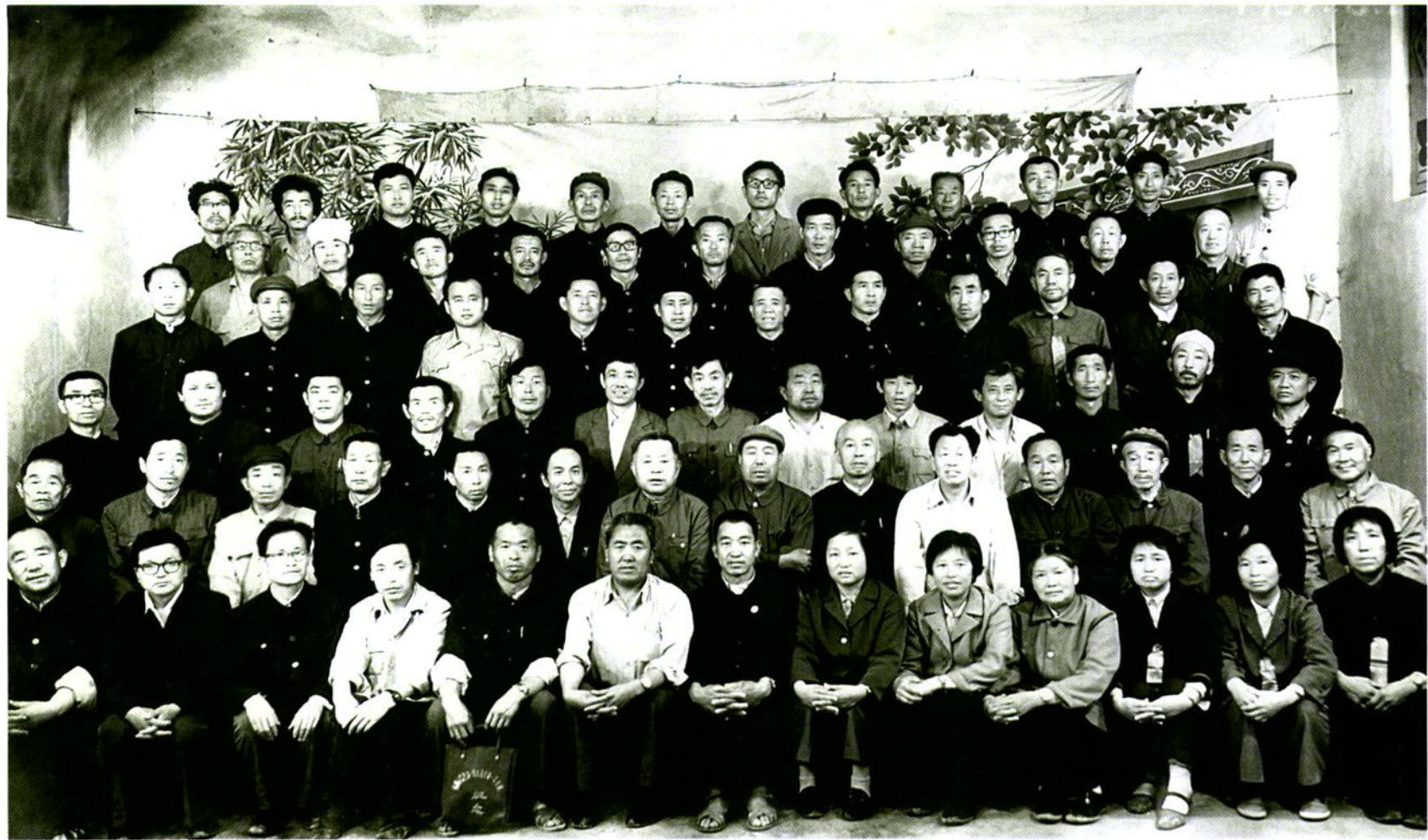
中国人民政治协商会议子洲县第二届委员会全体委员