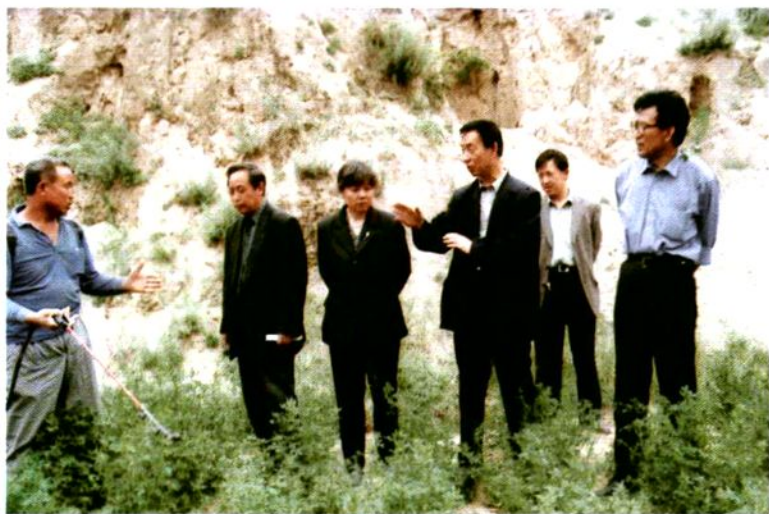
二〇〇二年五月，县政协委员在苗家坪镇前钟家沟村视察草业建设情况