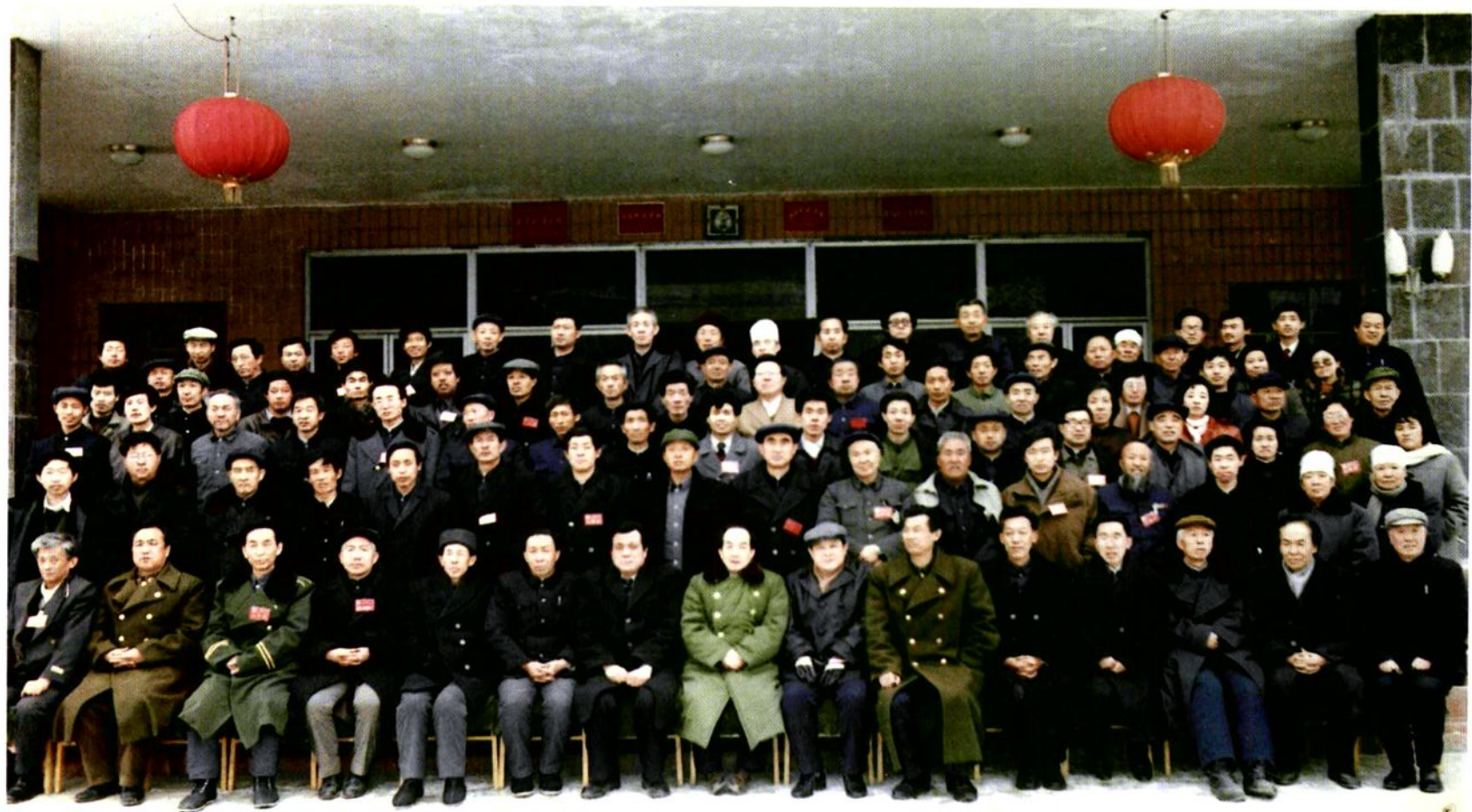
中国人民政治协商会议子洲县第四届委员会全体委员