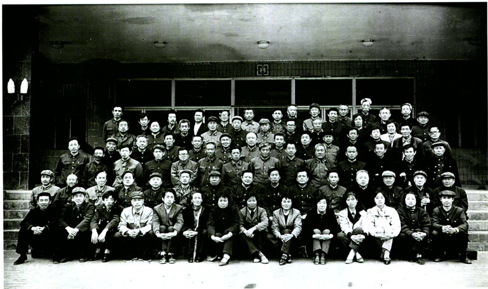
中国人民政治协商会议子洲县第三届委员会全体委员