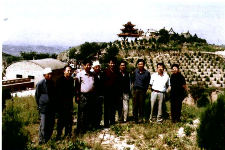
二〇〇四年九月，市、县政协调调研组在瓜园则湾乡兴隆寺