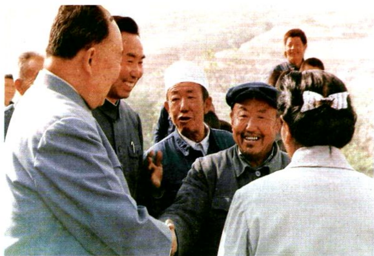
一九八八年，全国政协副主席马文瑞回 子洲视察