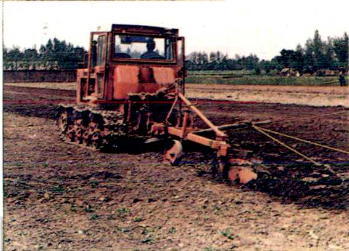
东方红—75 拖拉机深耕