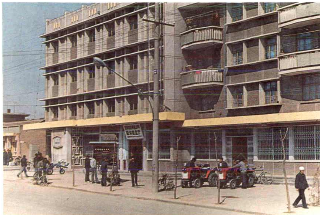
庆阳地区农业机械公司营业办公楼