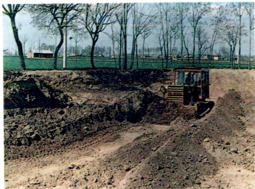
拉机平整农田 东方红—60拖