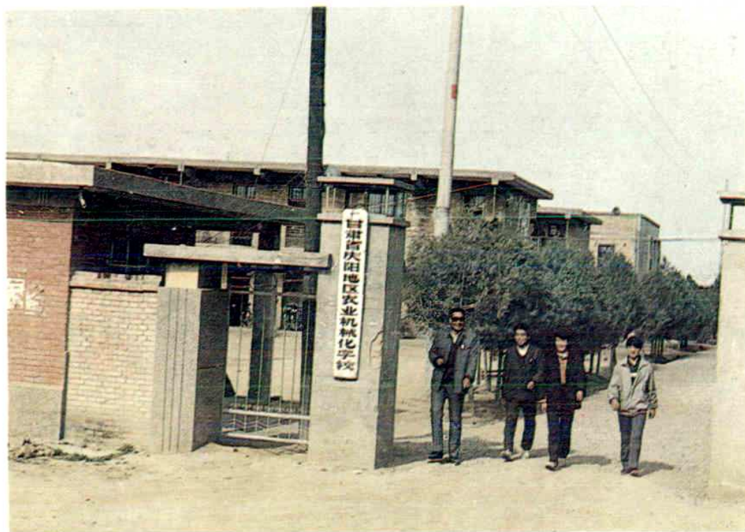
庆阳地区农业机械化学学校一角