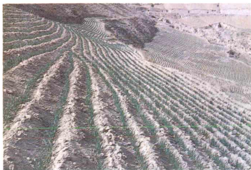
BFX—1 型水平沟施肥播种机播种的冬小麦