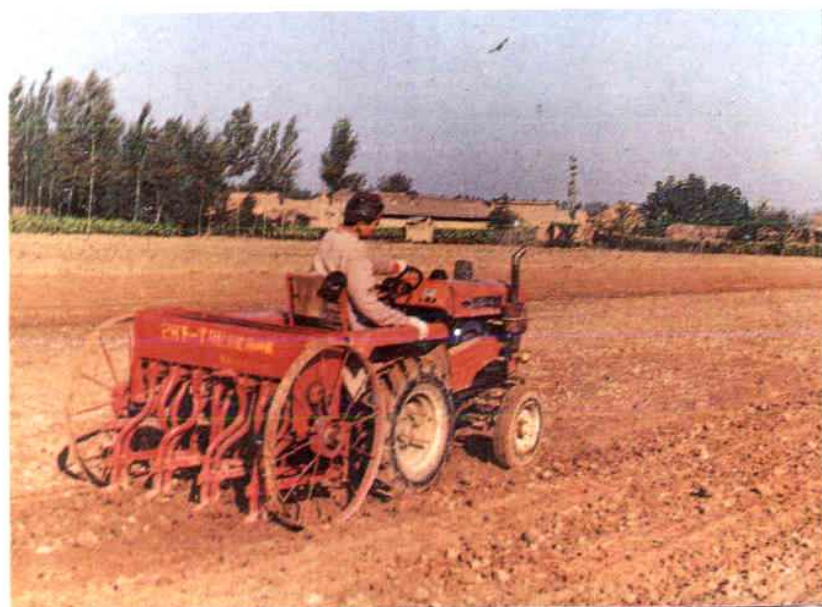
天水—150拖 拉机播种冬小麦