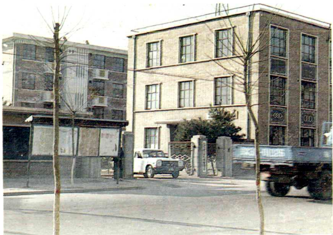
庆阳地区农业机械管理局办公楼