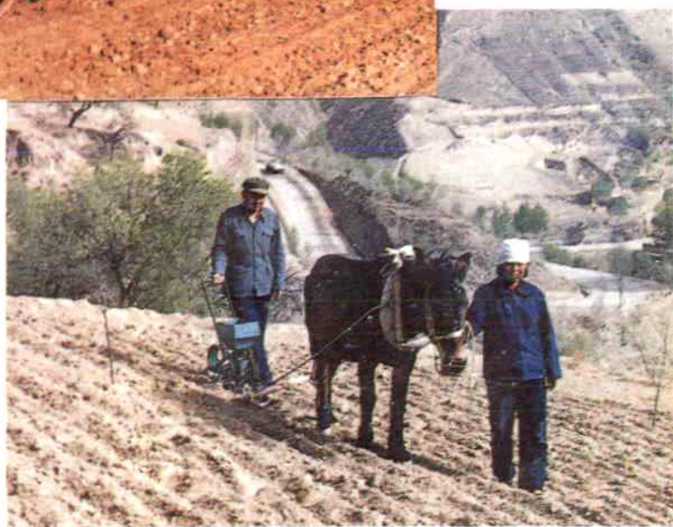
BFX—1 型水平沟施肥播种机播种