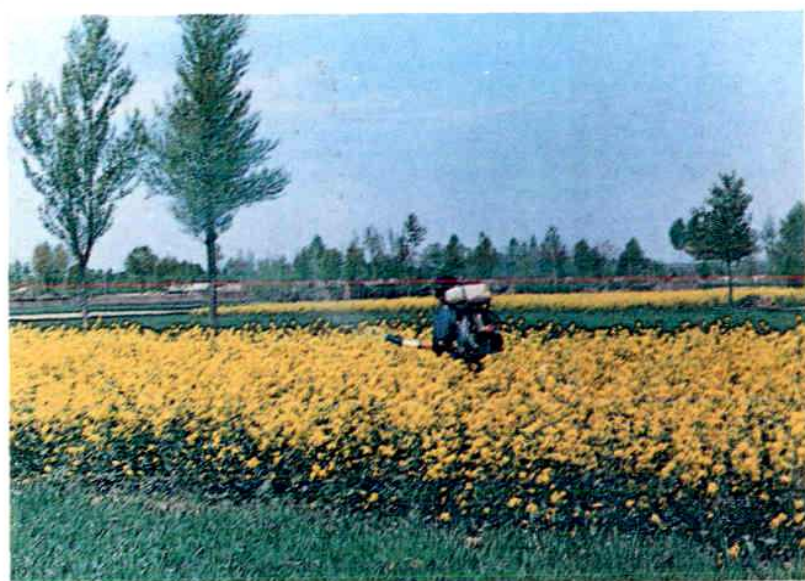
背负式机动喷雾器喷施药粉