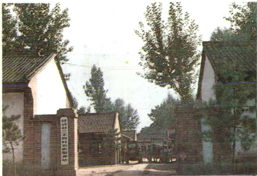
同村农机服务站 西峰市肖金镇三不