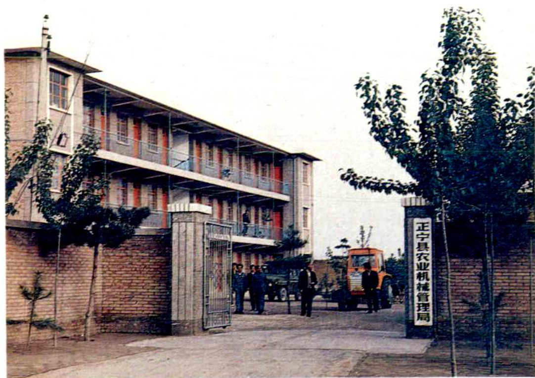
正宁县农业机械管理局