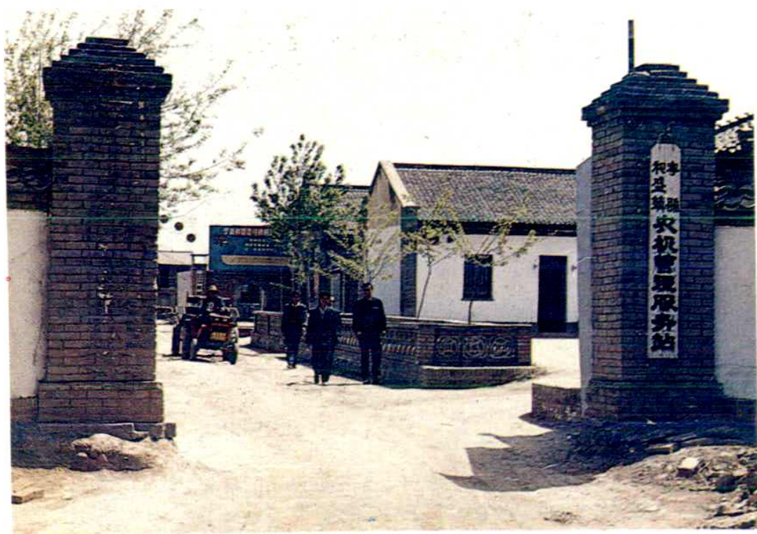
宁县和盛镇农机管理服务站