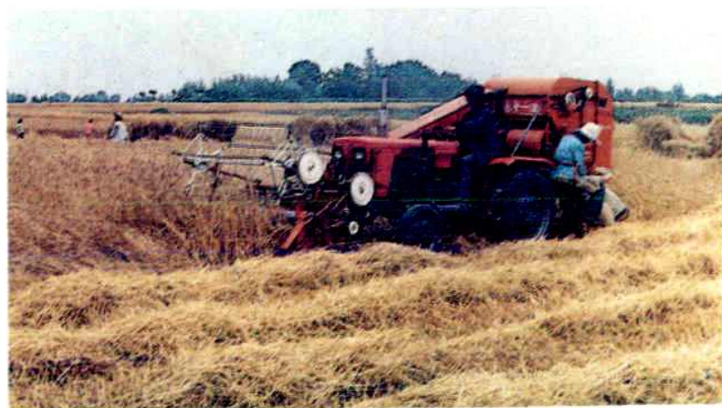
联合收割机收割冬小麦