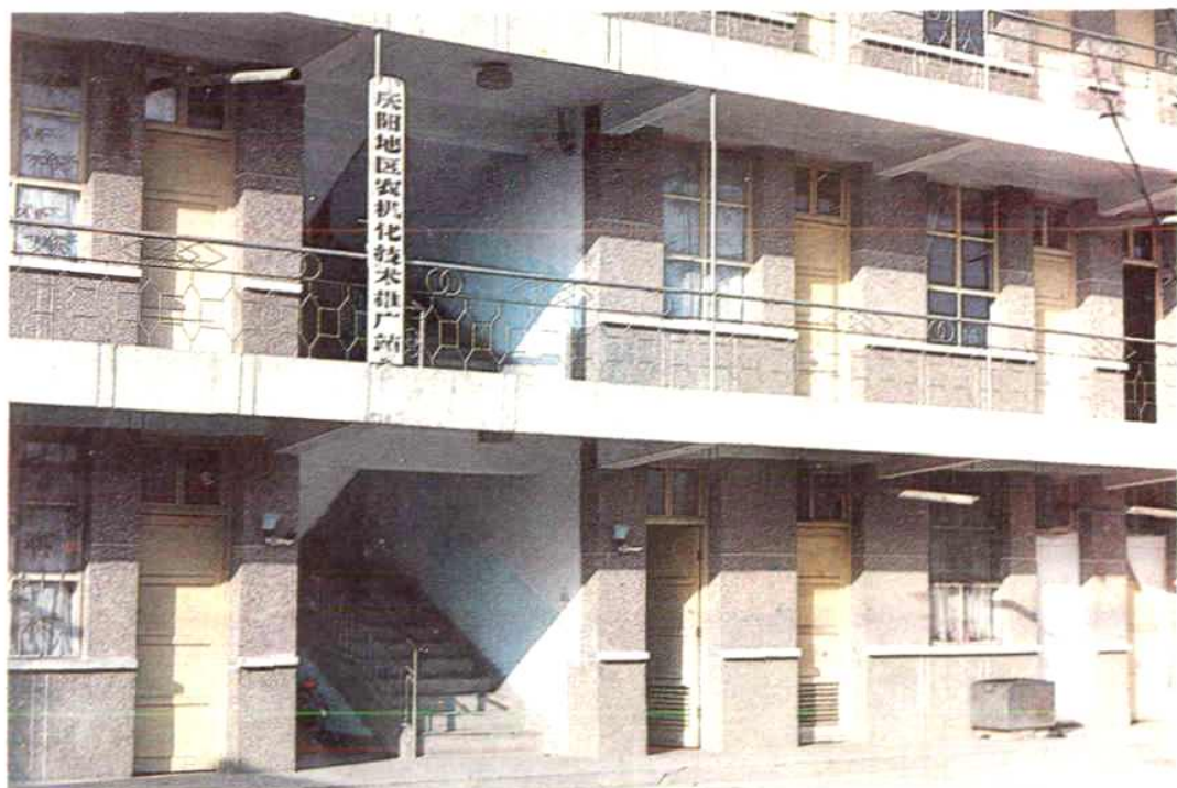
庆阳地区农业机械化技术推广站