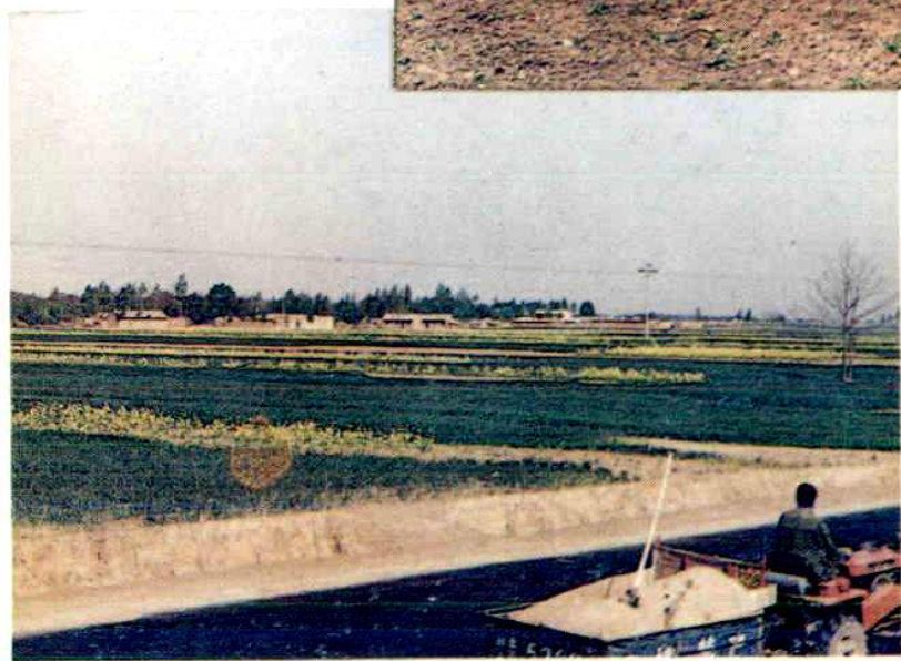
东方红—150拖 拉机运送肥料