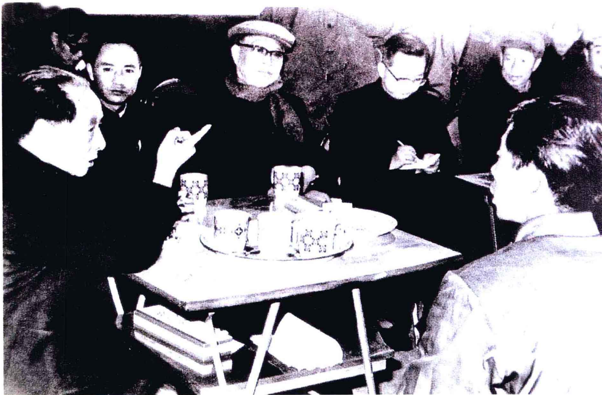
1985年2月12日，中共中央总书记胡耀邦（左一）视察鲁甸。