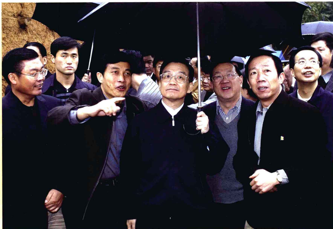
2004年10月5日，国务院总理温家宝（中）在财政部长金人庆（右三）省长徐荣凯（右一）、市委书记王建华（左三）、县委书记马吉林（右二）、县长尹贵友（左一）等陪同下，视察地震灾区。