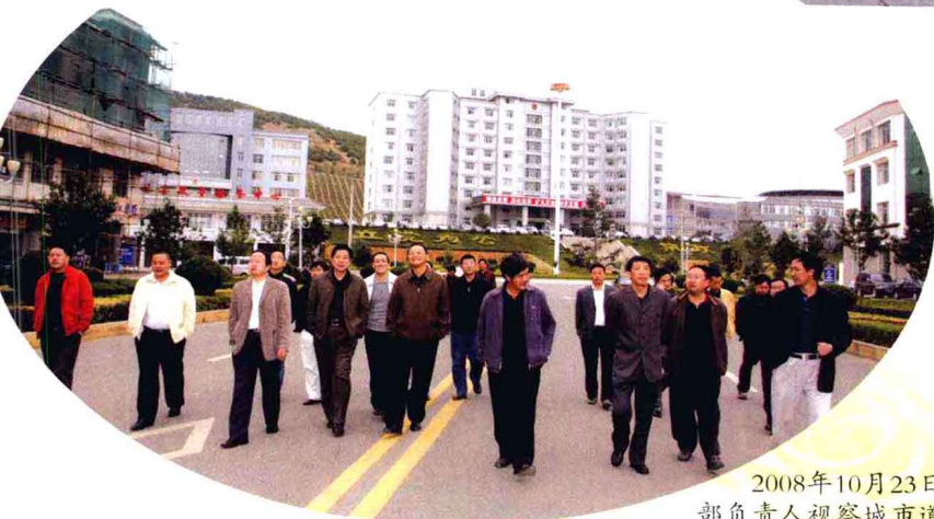
2008年10月23日，县四套班子领导带领相关部门负责人视察城市道路交通建设情况。