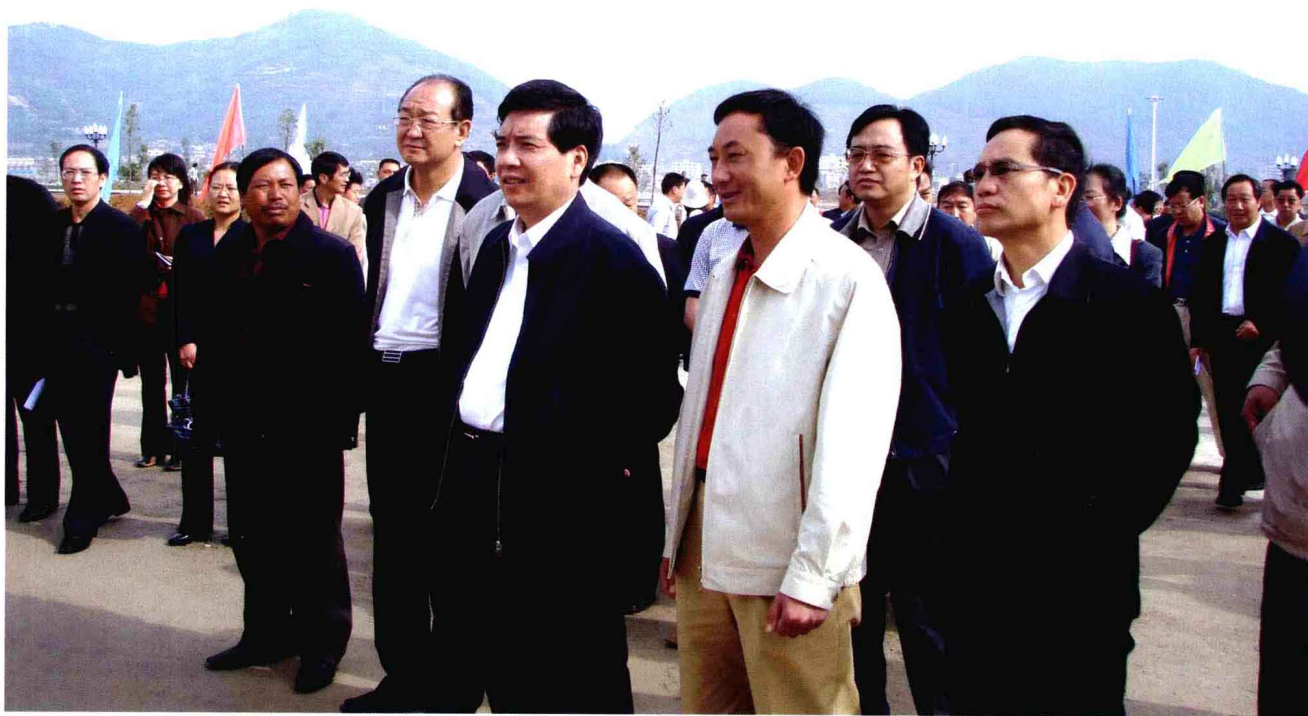
2008年5月12日，省长秦光荣、副省长孔垂柱带领全省民居地震安全工程现场会参会领导到鲁甸视察地震恢复重建工程。