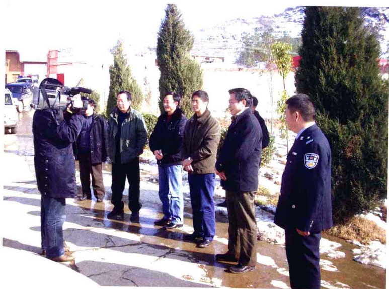
2008年2月，县委、县政府领导到交警大队慰问。