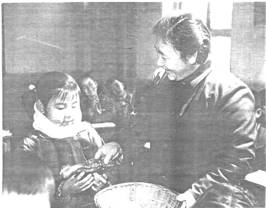
老师给学生分间食