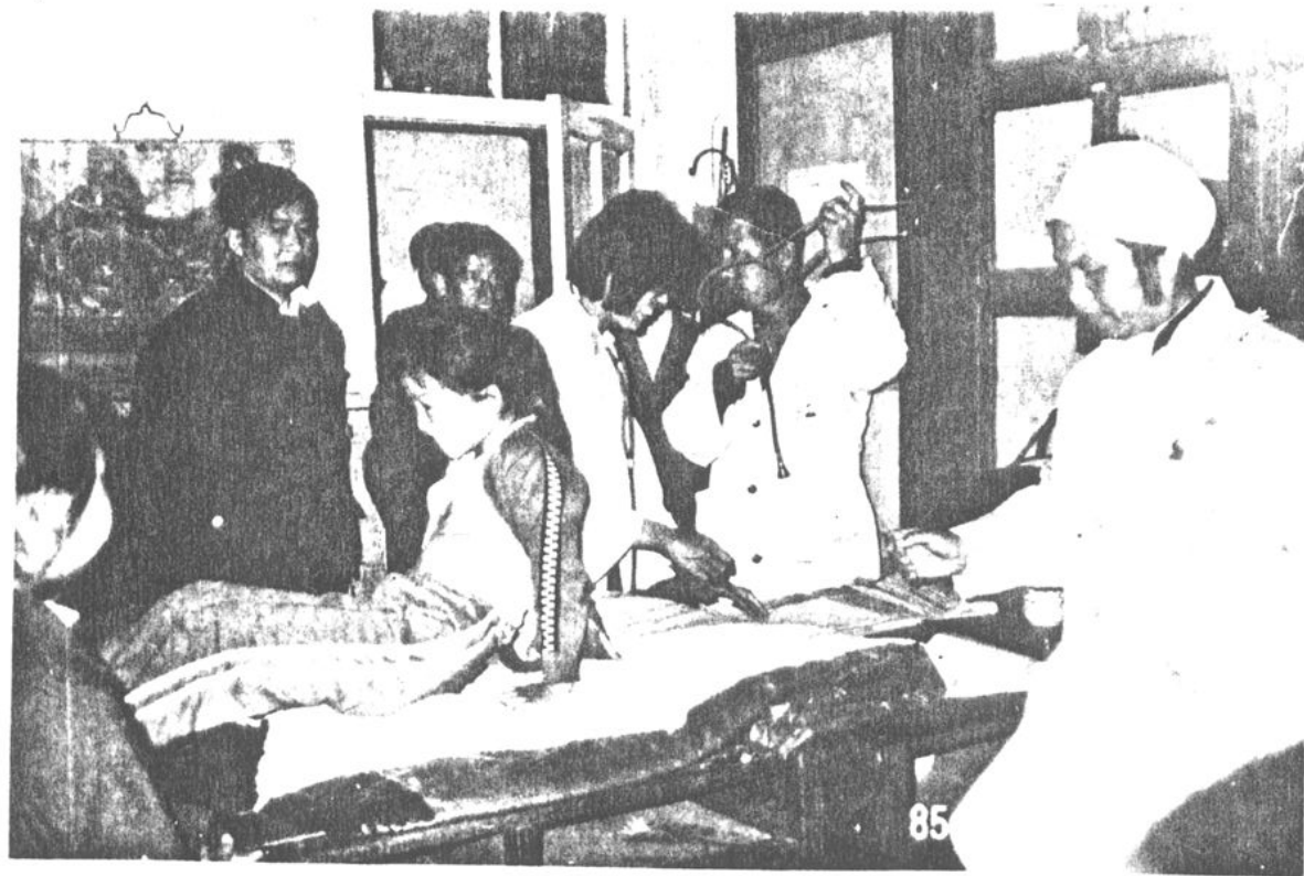
图为同学们在体检。