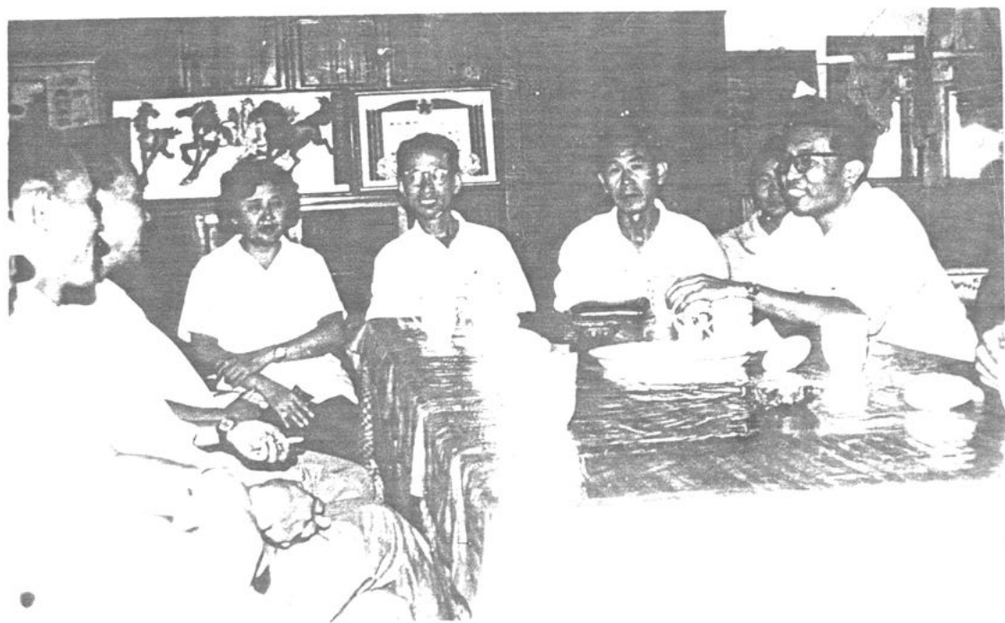
市委领导来校慰问