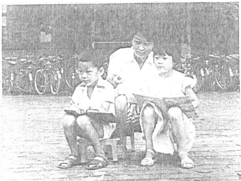
许老师指导学生写生。