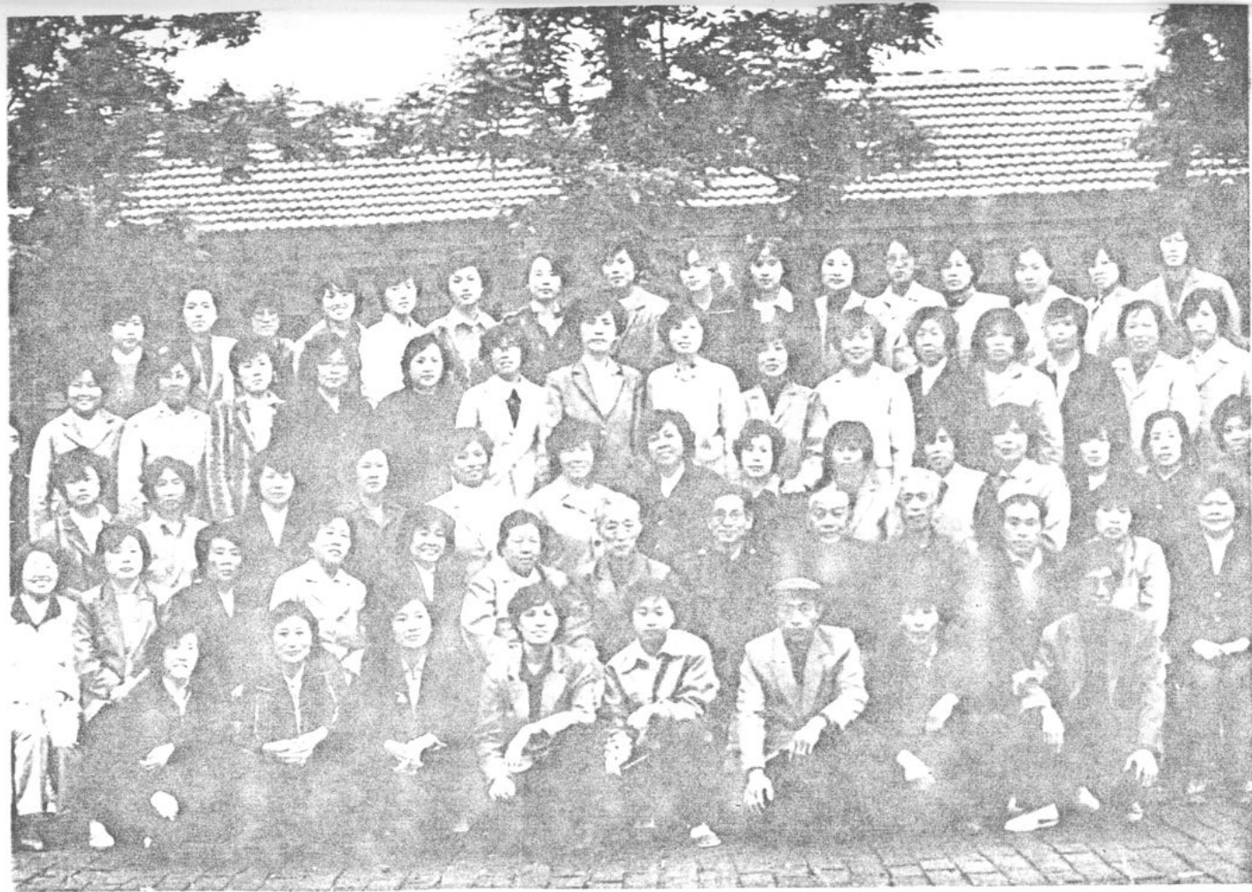
一九八七年五月 全体教职工合影留念