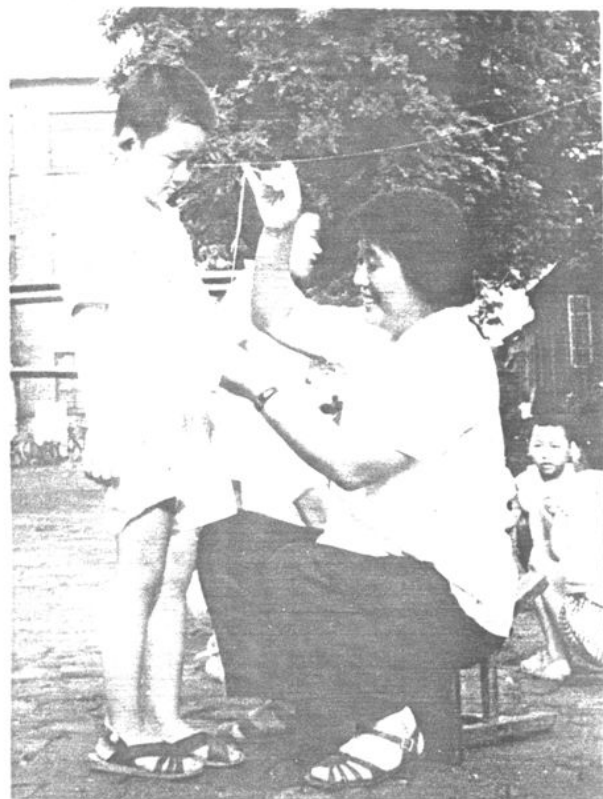
老师给学生缝扣子