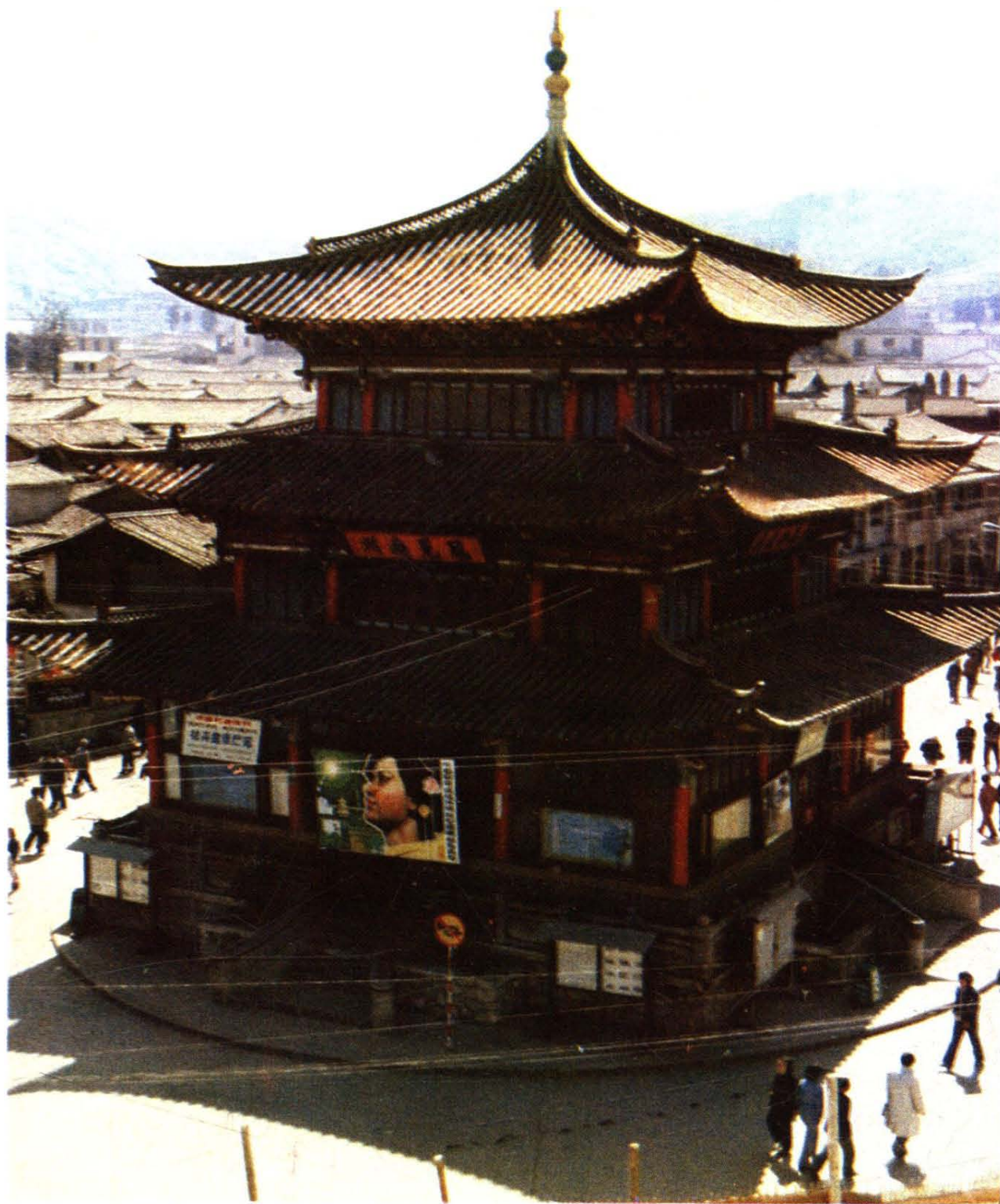
县城正中的聚奎阁