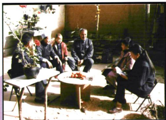
我站流行病科流调人员 在农村进行流行病学调查