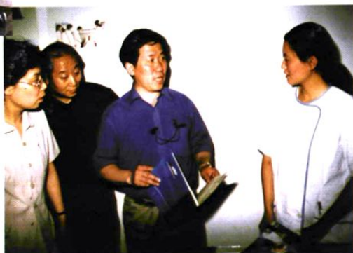
▲ 卫生部疾病控制司 副司长邵瑞太来我站 检查指导工作