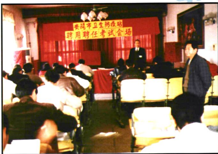
1999年中层干部聘用聘任考试会场