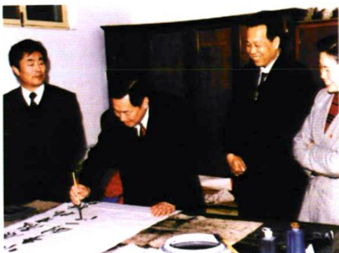
◀ 原卫生部副部长 孙隆椿视察我站并题词