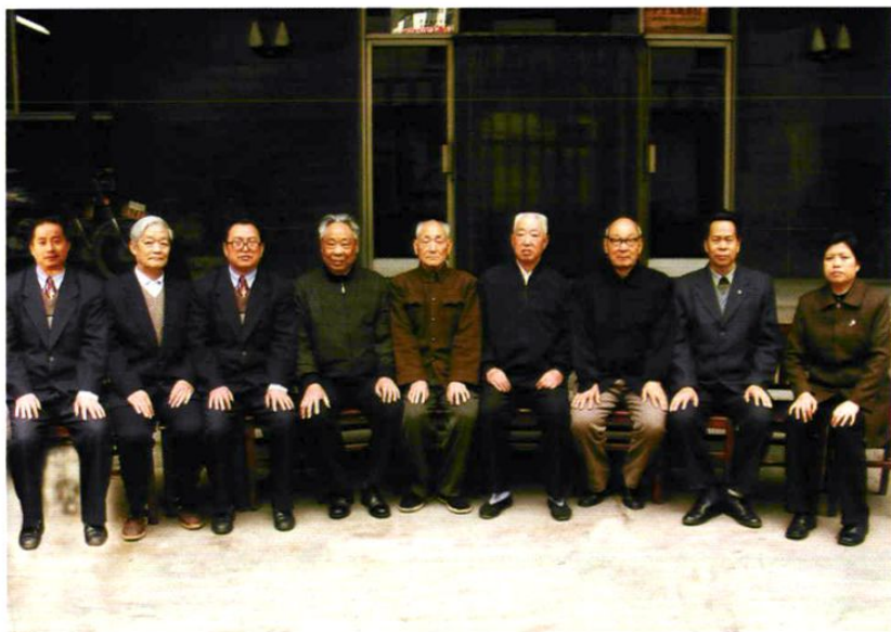
历届站领导合影（自左至右）