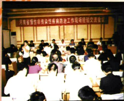
省慢病现场会在我市召开