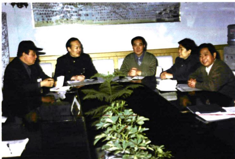
现任站领导（自左至右）