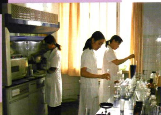
理化检验科工作人员在做检验