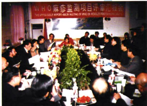
WHO/CDC专家在我站 对麻疹合作项目 进行中期评估