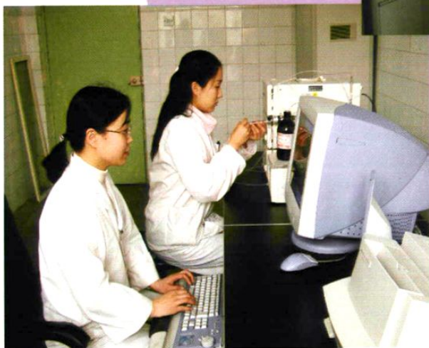
我站理化检验科工作人员 正在操作高效液相色谱仪