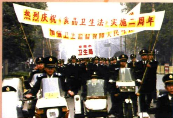
庆祝《食品卫生法》实施二周年宣传活动