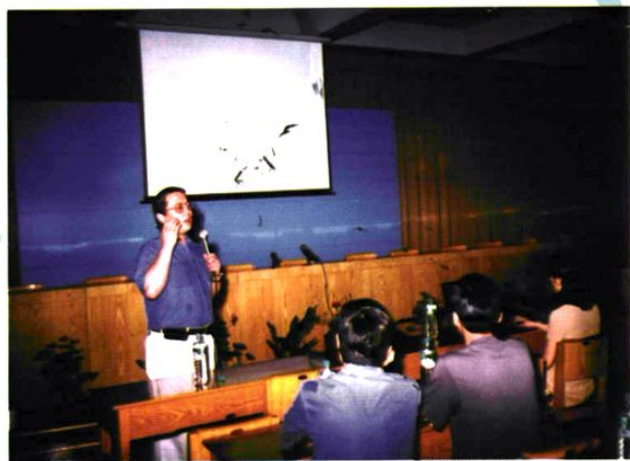
中国疾病预防控制中心 主任李立明 教授来我站讲学