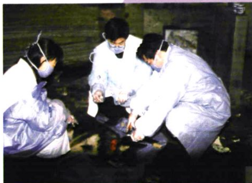
我站流病科人员 正在采集动物标本