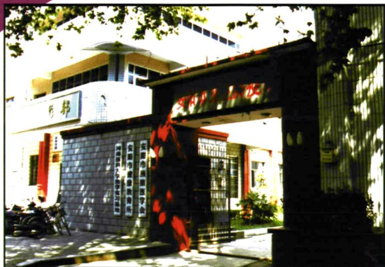
1964年以后 迁入现址— 自由路1号