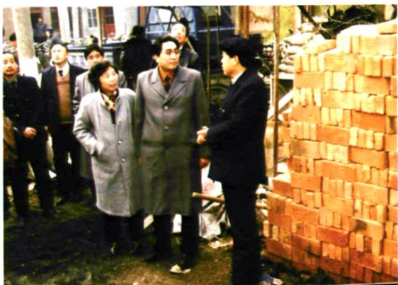
原省卫生厅副厅长 张泽书来我站检查指 导工作 ▶