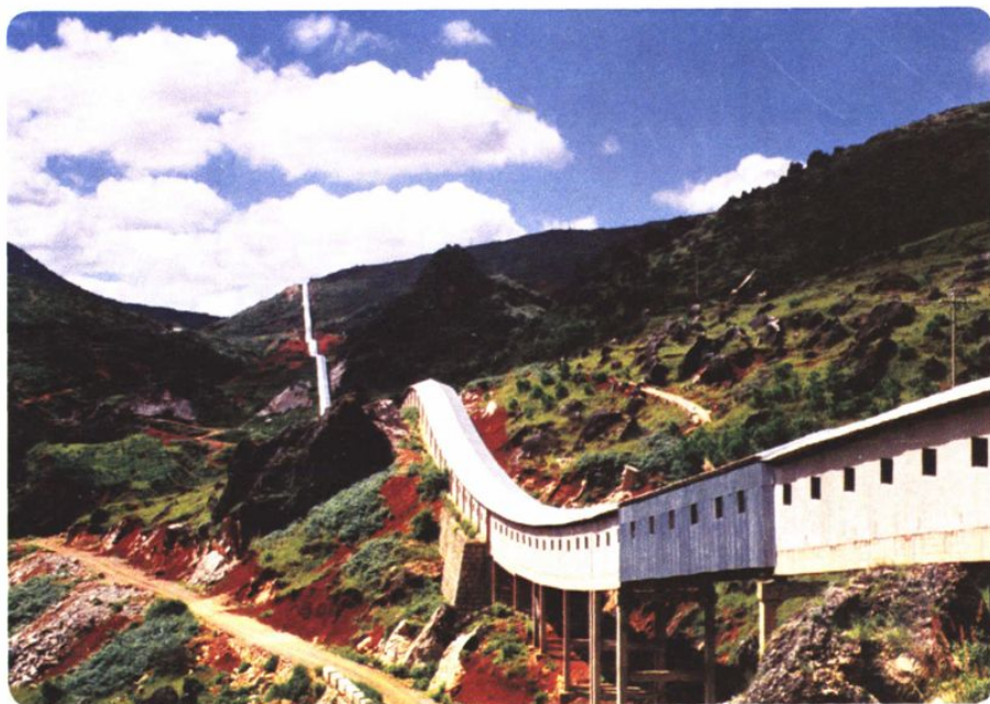
被誉为“南方小长城”的晋宁磷矿皮带运输系统