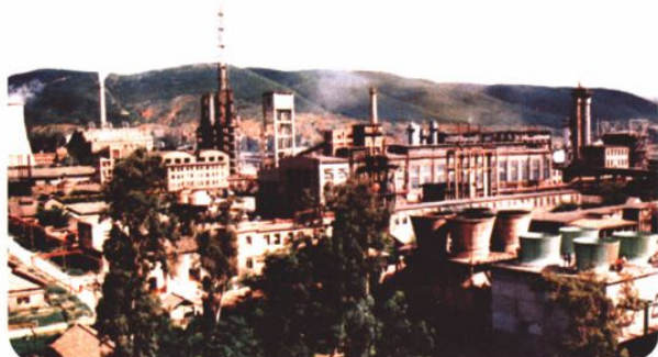
解化公司生产区一角