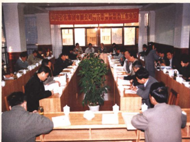
2000年12月7-8日，云南石化集团公司“十五”计划及2010年发展规划工作会议在昆阳磷肥厂召开