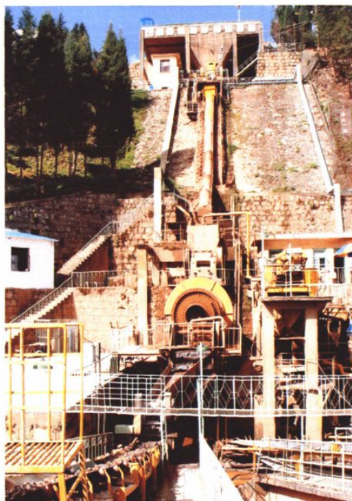
云南磷化集团海口磷 矿60万吨/年擦洗装置