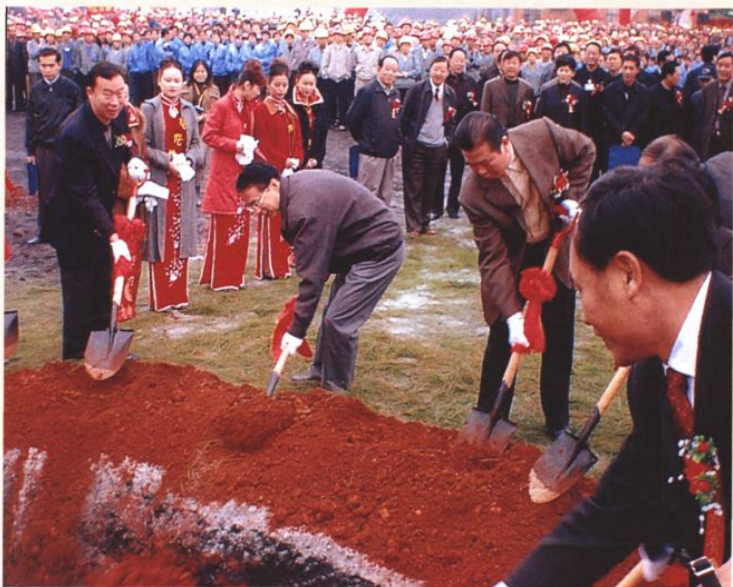
2003年10月23日，省长徐荣凯、副省长李新华等领导为沾化50万吨合成氨项目奠基