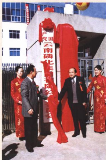
2001年12月26日，云南石化新老领导为云南磷化集团有限公司揭牌