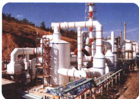
2003年12月建成投产的三环公司60万吨/年 硫磺制酸装置