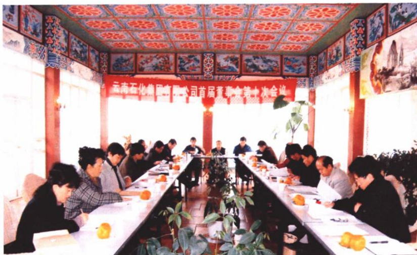
2004年12月30日，石化集团公司首届董事会召开第十次会议