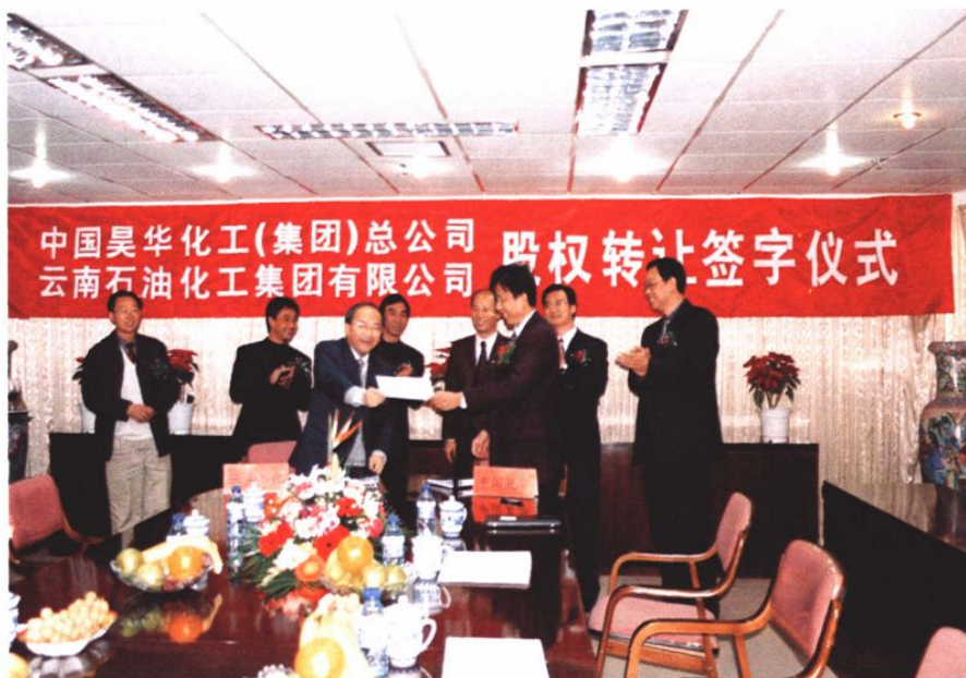
2003年12月26日，云南石化集团公司收购中国昊华集团总公司股权签字仪式在北京举行，由此拉开石化集团公司资本运营的序幕