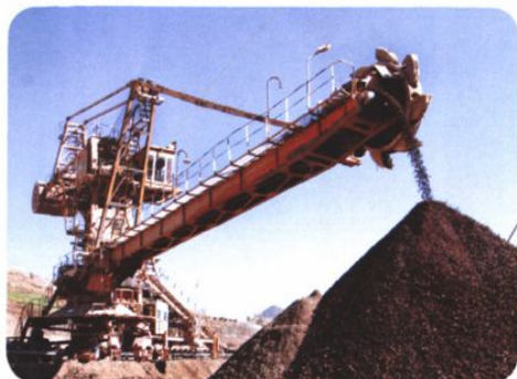
正在作业的云南磷化集团堆取料机