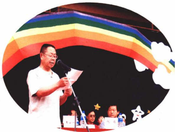
2004年7月15日，石化集团副总经理王安一在昆明市西山区国有企业移交学校签字仪式上发表讲话