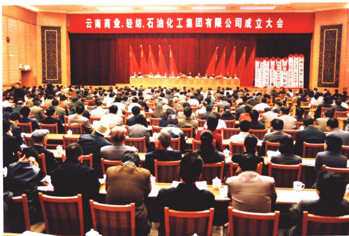
2000年8月18日省政府批准石化厅成建制转体改制；10月30日，云南石油化工集团有限公司在连云宾馆召开成立大会，由省政府正式授牌