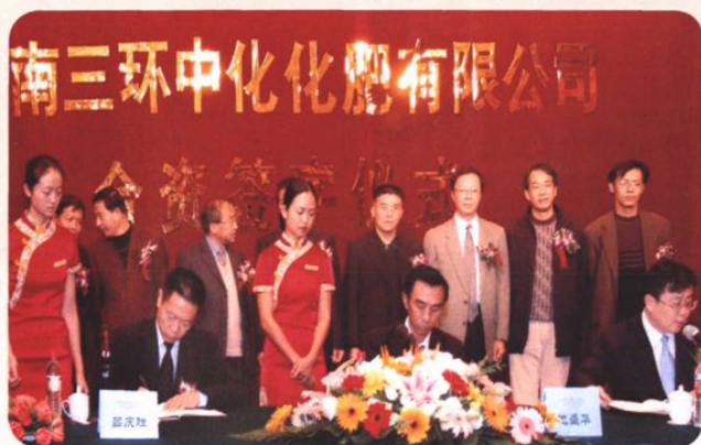
2004年11月18日，中化化肥公司、云南石化集团、三环公司举行合资建设120万吨磷铵项目签字仪式，标志云南磷复肥基地建设迈出重要一步