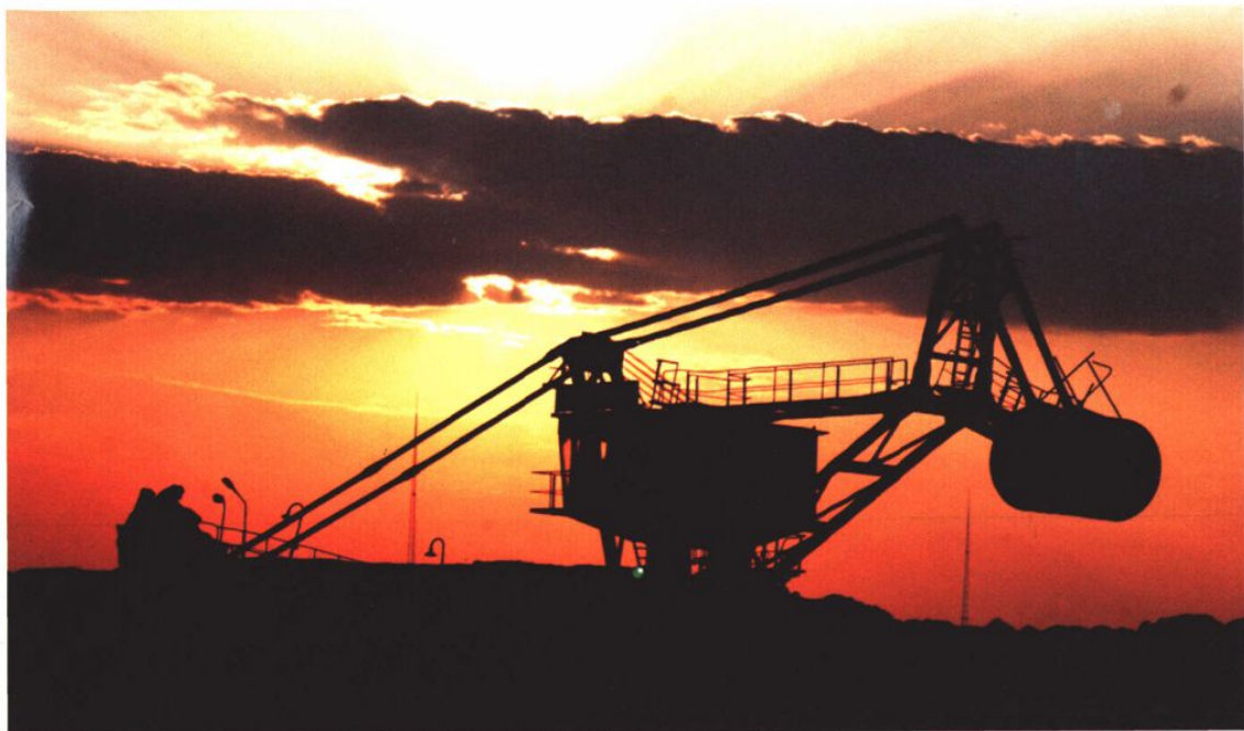
沐浴在晨光之中的云南磷化集团堆取料机