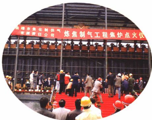
2003年10月23日，沾化公司举行70万吨焦化项目2号焦炉点火仪式