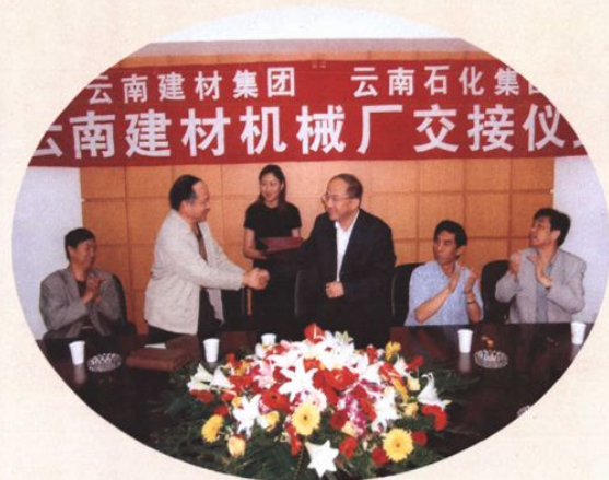
2004年8月17日，云南建材机械厂移交石化集团的交接仪式在公司举行