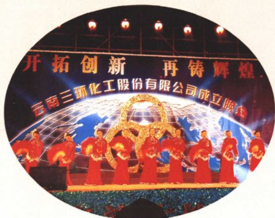
职工载歌载舞欢庆云南三环化工有限公司整体变更为股份公司