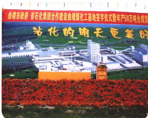
2003年10月23日，石化集团与曲靖市政府举行合作建设曲靖煤化工基地签字仪式；沾化50万吨合成氨项目动工建设