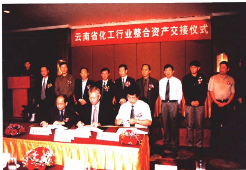
2005年6月，根据省政府批复云南化工行业实施整合重组，举行资产交接仪式