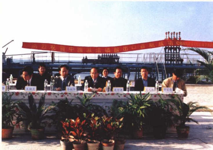
2001年1月19日，云南磷肥厂湿法磷酸出口首发式在广西北海港举行