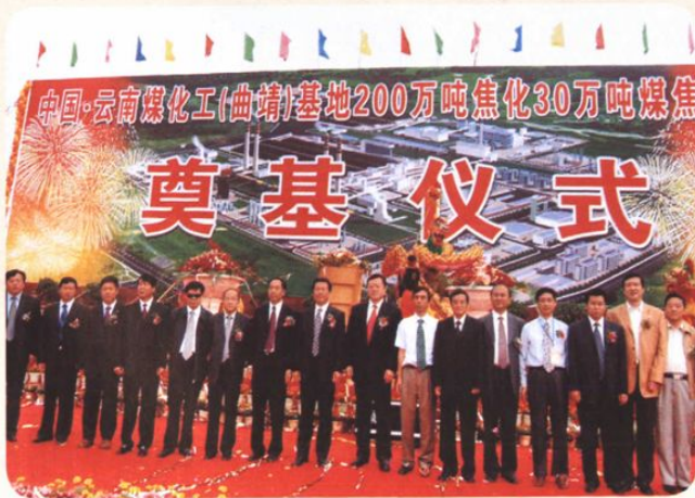
2005年6月30日，曲靖煤化工基地200万吨焦化、30万吨煤焦油加工项目举行开工奠基仪式