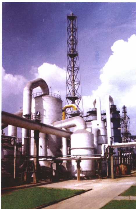
2003年8月建成投产的云峰公司20万吨 硫磺制酸装置