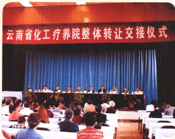
2003年7月22日，云南省化工疗养院整体转让给云南省国际人才交流协会的交接仪式在该院举行