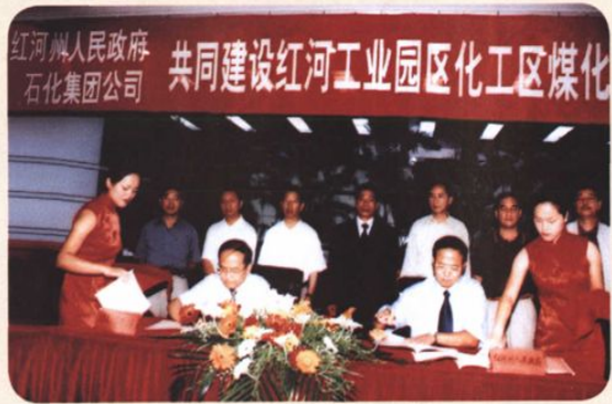
2004年8月19日，云南石化集团与红河州人民政府《共同建设红河工业园区化工区煤化工基地框架协议》签字