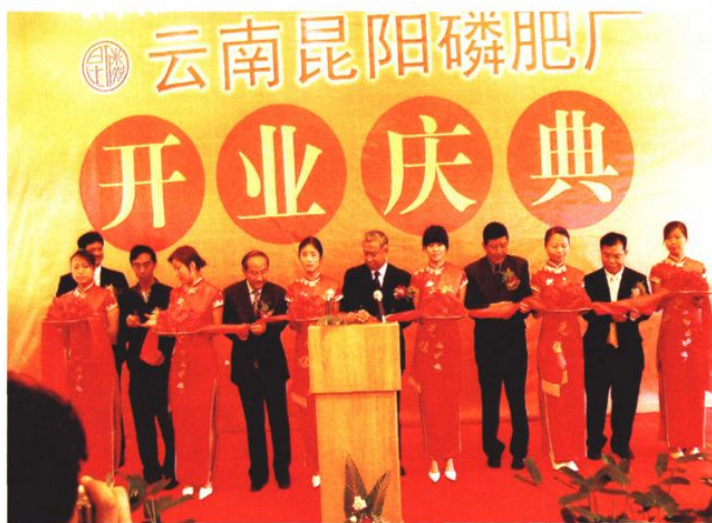
2004年7月23日，外商独资的云南昆阳磷肥厂举行开业庆典