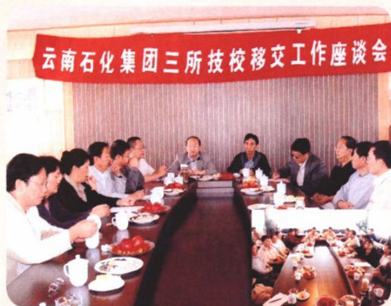
2004年7月21-22日，石化集团公司召开云南省化工高级技工学校、第三化工技工学校、化工机械技工学校移交工作座谈会