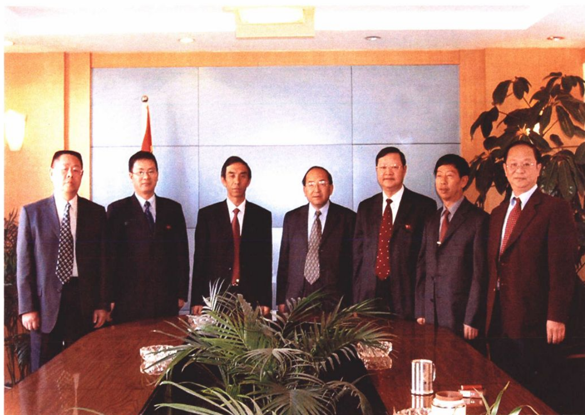
2003年7月，调整后的云南石化集团党政领导班子成员合影