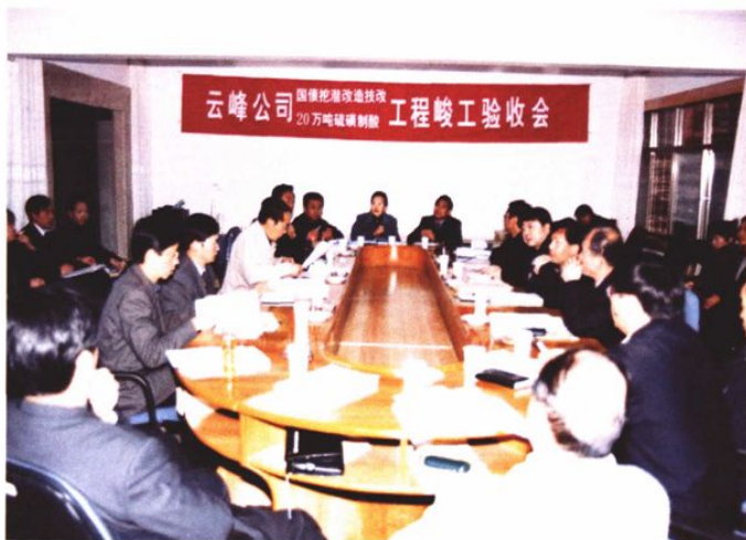
2003年12月16日，云峰公司国债挖潜技改项目和20万吨/年硫酸项目通过省经贸委组织的竣工验收