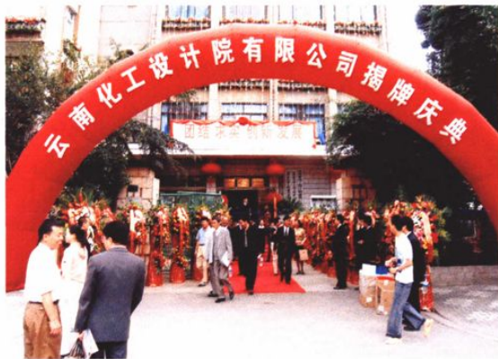
2004年7月18日，云南省化工设计院通过改制成立云南化工设计院有限公司