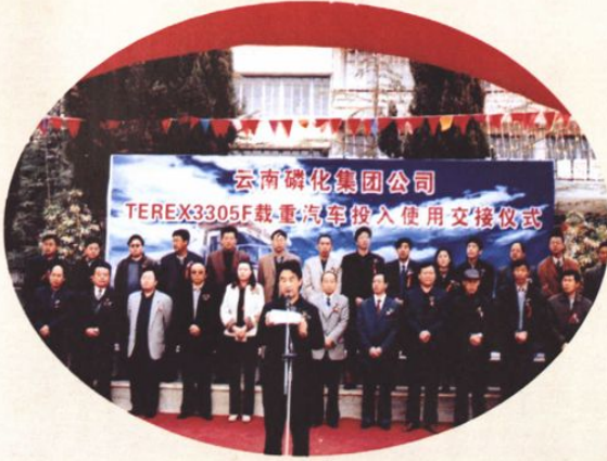
2004年2月4日，磷化集团公司购进8台载重30吨的大型矿车，启动矿山复能项目