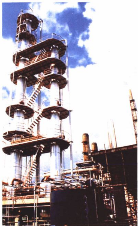
解化公司甲醇生产装置