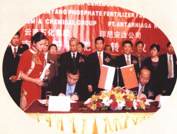
2004年5月9日，云南昆明磷肥厂转让给印尼安达公司的签字仪式举行