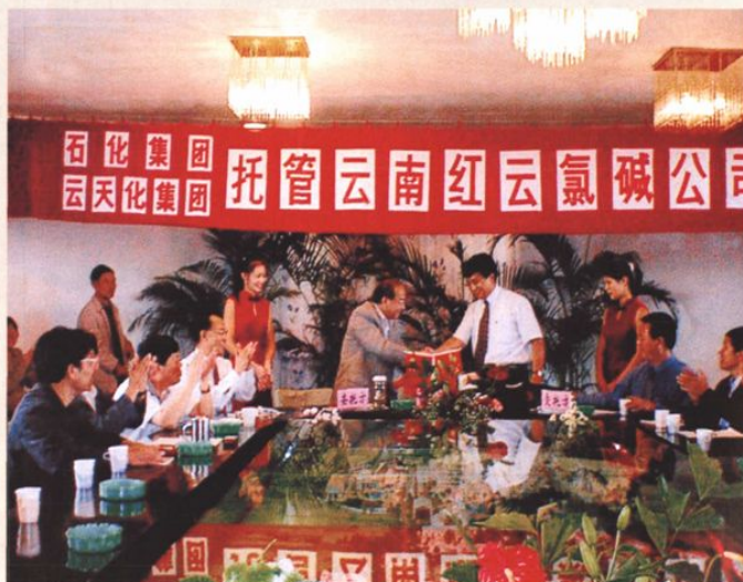
2003年7月1日，红云氯碱公司正式交由云天化集团公司托管