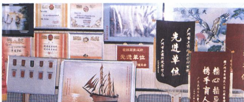
● 黄埔区 工商局历年 获奖的部分 奖状、奖旗