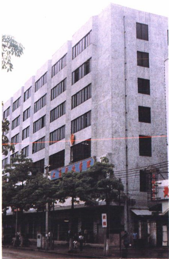
● 黄埔区工商行政管理局 办公大楼外景。