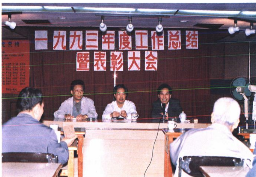
● 黄埔区工商局 新一届领导班子。