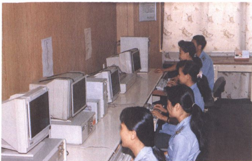
● 黄埔区工商局 计算机室一角。