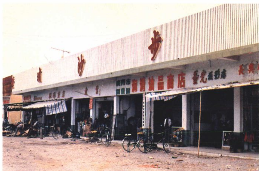
● 南岗新建的购物 中心。