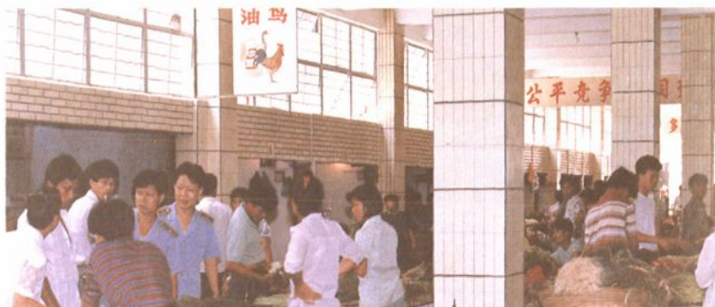
● ● 市场管理一瞥。