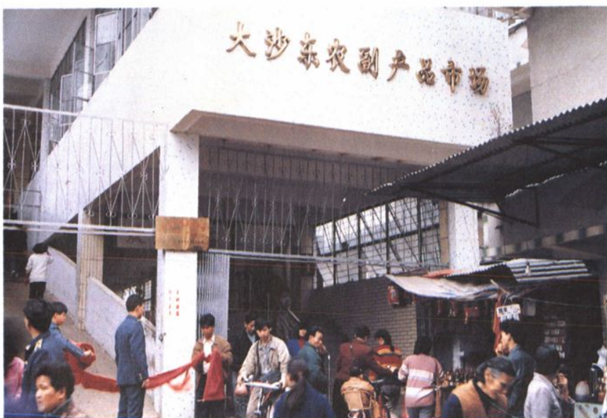
● 大沙东农副产品市 场连续四年被评为省市 四好文明市场。