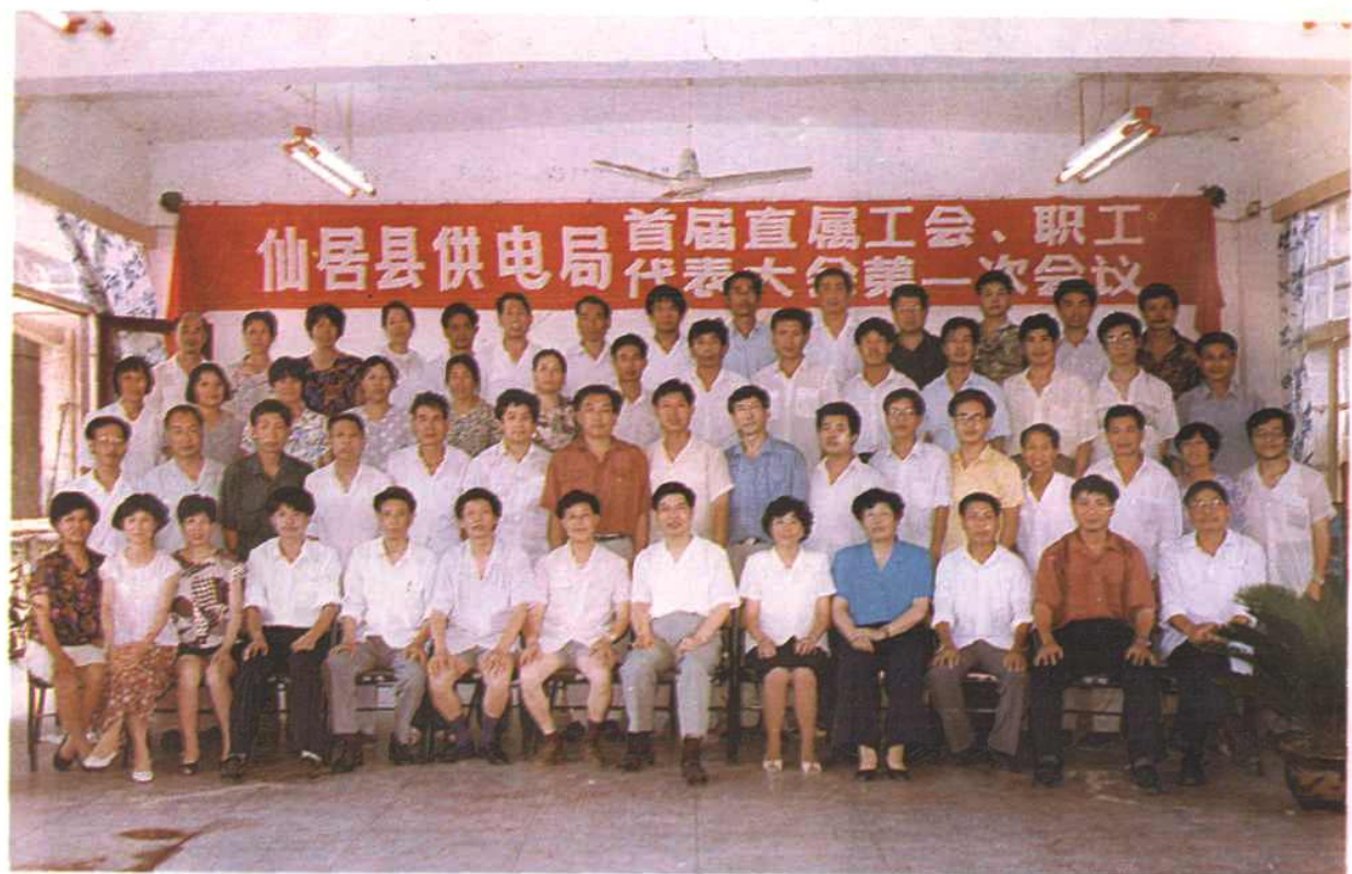
仙居县供电局直属工会、职工代表大会代表合影