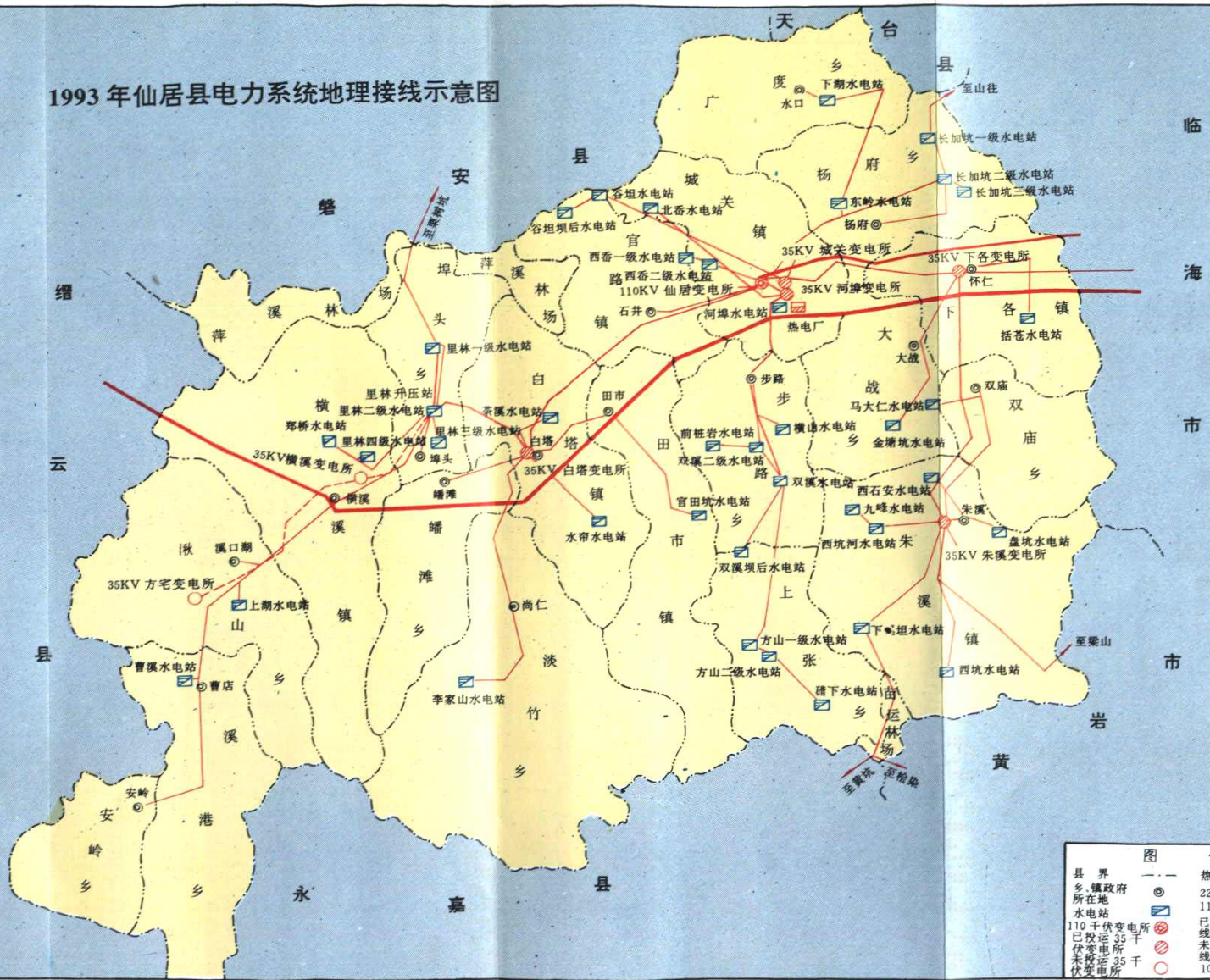
1993年仙居县电力系统地理接线示意图