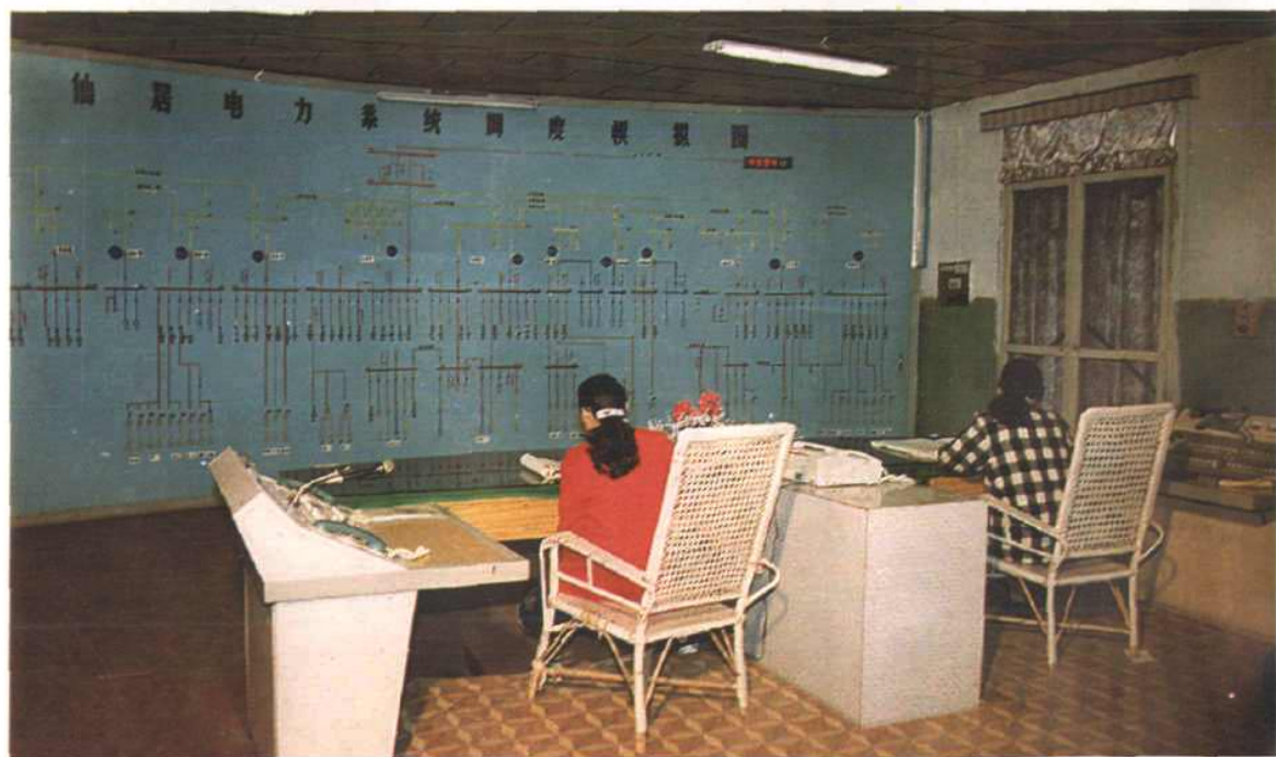
仙居县电力调度室