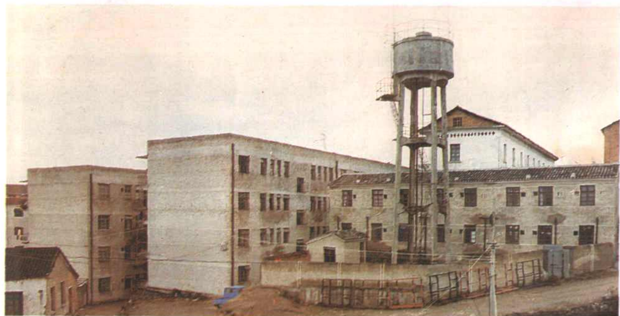
电力职工金家山宿舍区