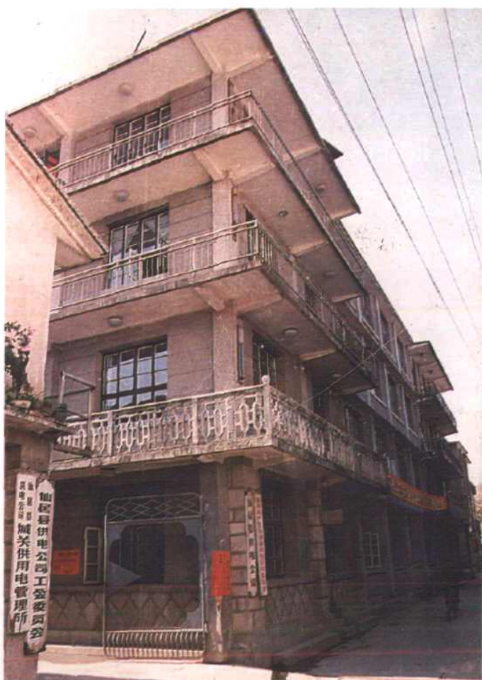
仙居县供电局办公楼