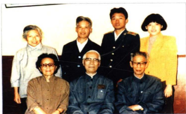
↑ 冯德培夫妇与五弟(前右)及二哥之子一家(后排)