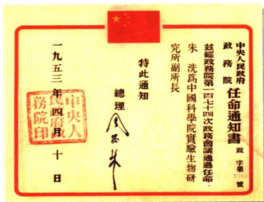
↓ 周恩来总理签发的朱洗任职通知书