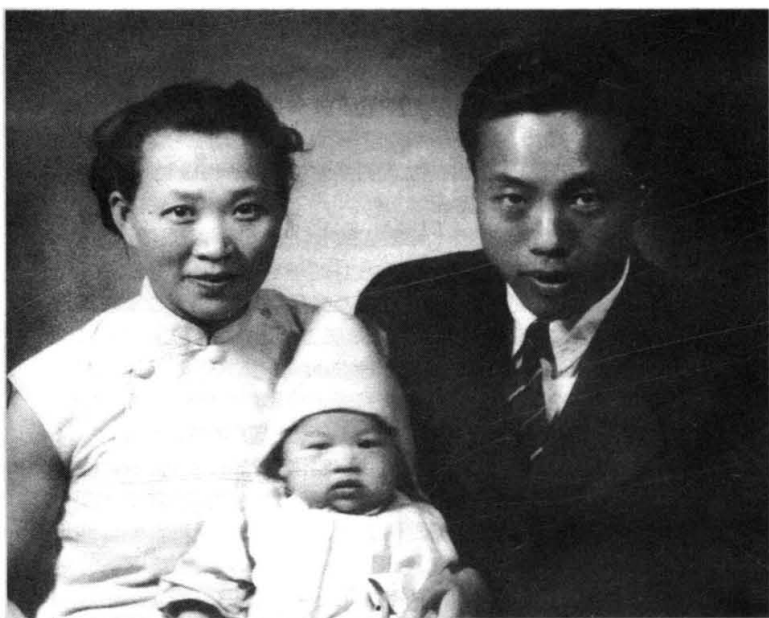
← 陈芳允与夫人、儿子