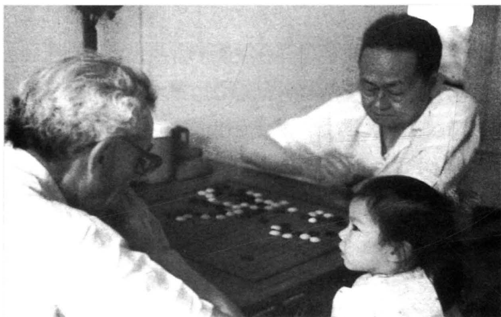
柯召与数学家Erdos对弈