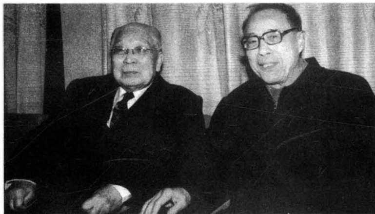
← 中国科技大学校长严济 慈与教授陈芳允