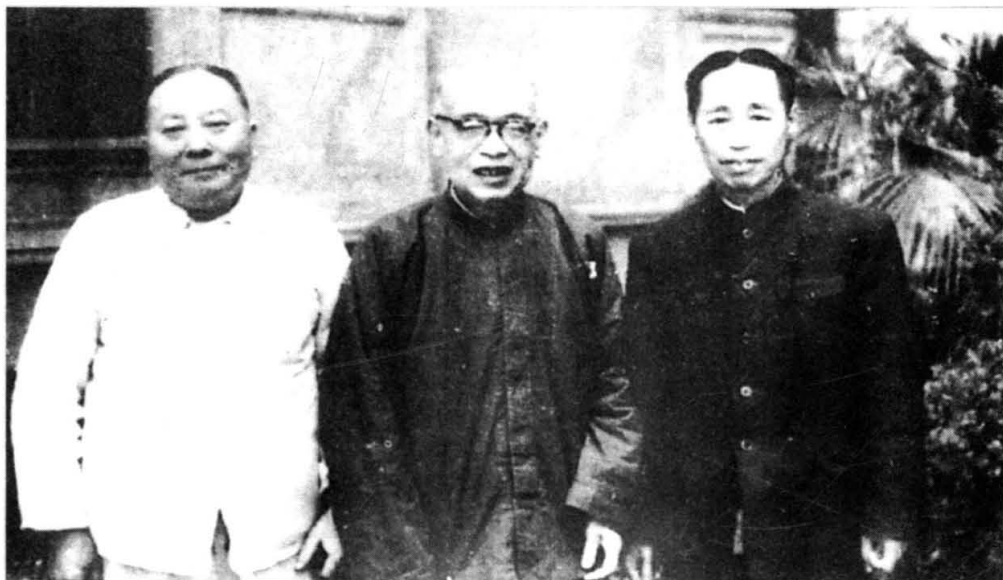
↑ 罗宗洛（中）、童第周（右）探望住院治疗的朱洗（1962年）