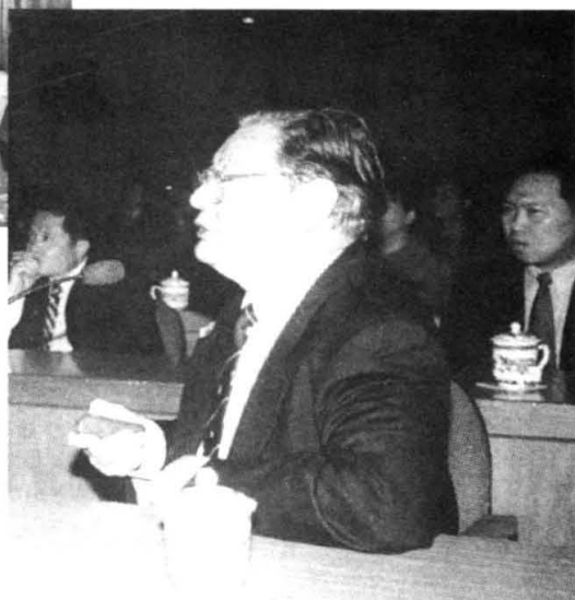
陈中伟教授为台州市骨 伤科医生作学术讲座