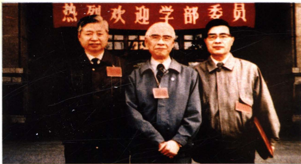
↑ 冯德培、洪孟民、蒋民华在第六次院士大会上（1992）