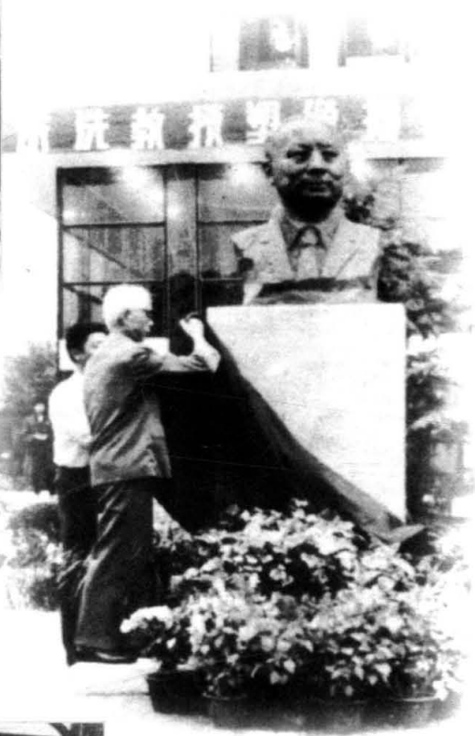
冯德培为朱洗铜像揭幕