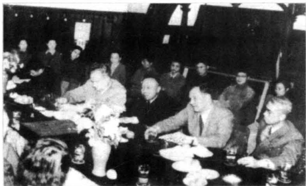
朱洗（右三）、冯德培（右一）在迎接苏联科学家的欢迎会上（1955年5月）