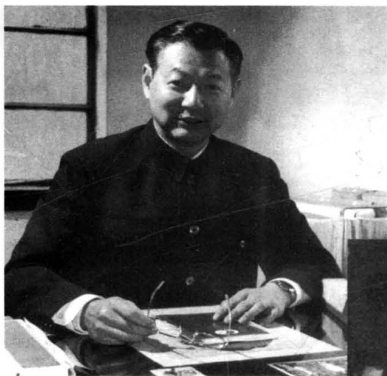
陈中伟教授