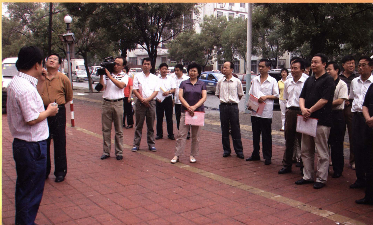
政协委员视察菜市场项目