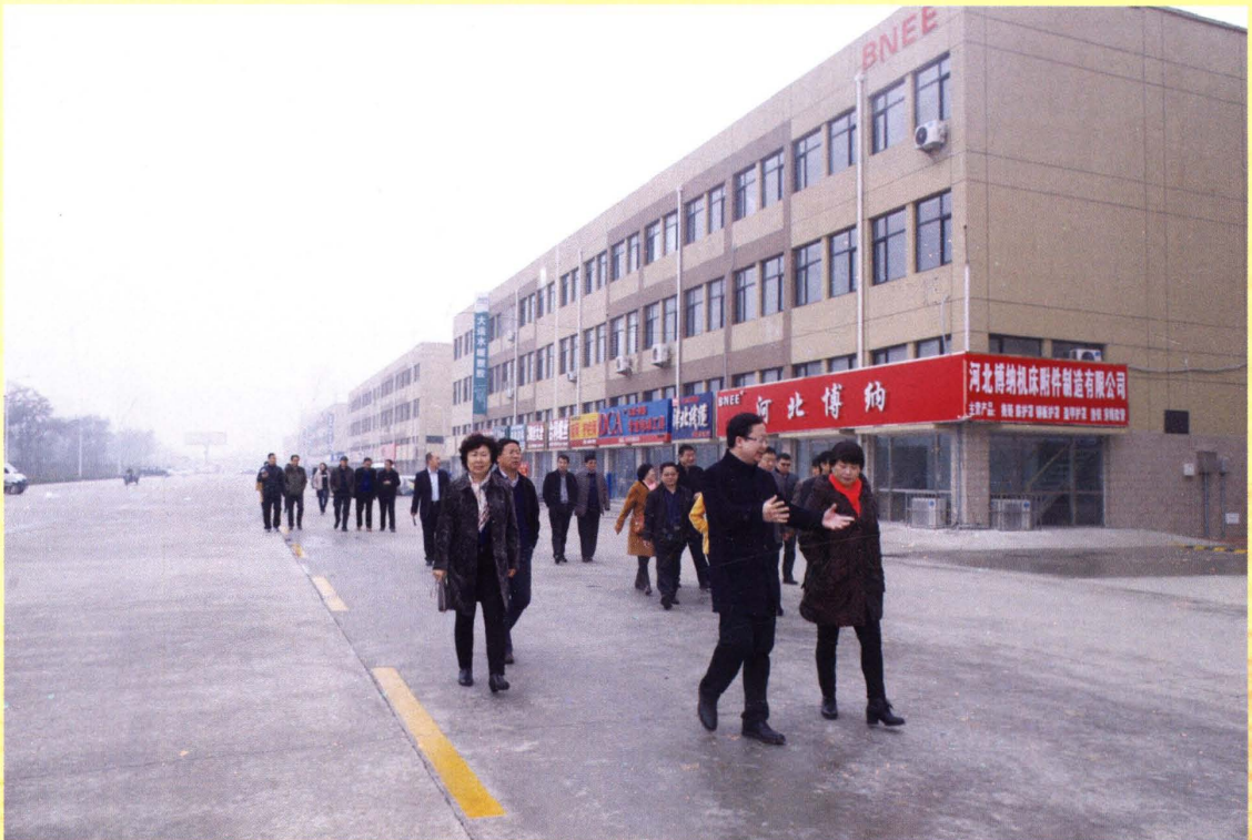
对物流配送、电子商务等现代流通方式开展专项视察