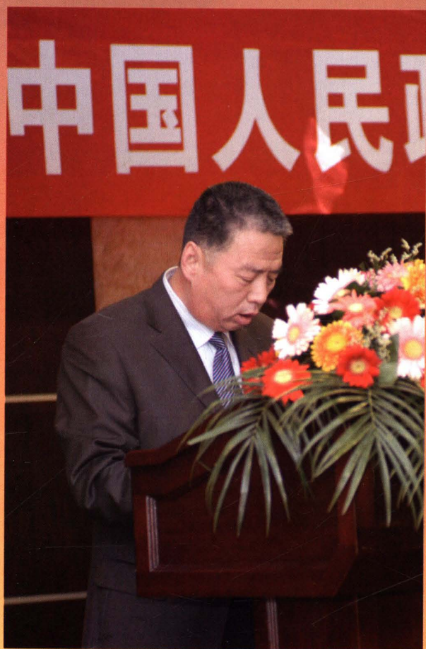
政协党组副书记、副主席徐光达同志在政协全会上作报告