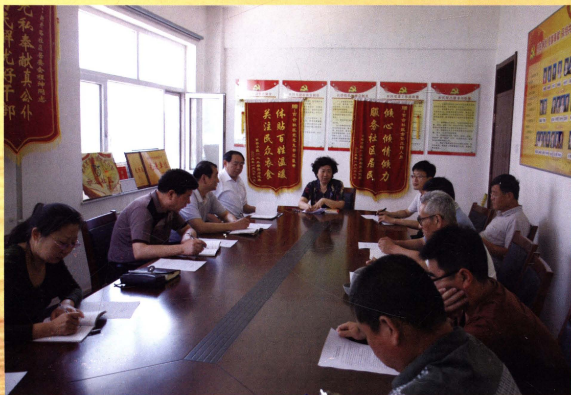
政协主席刘淑惠同志深入社区讲党课