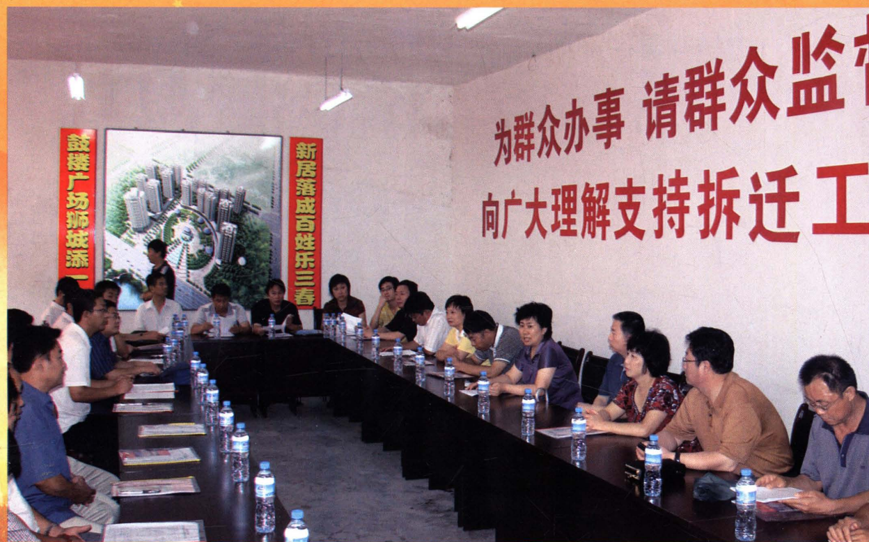
政协委员视察城建项目