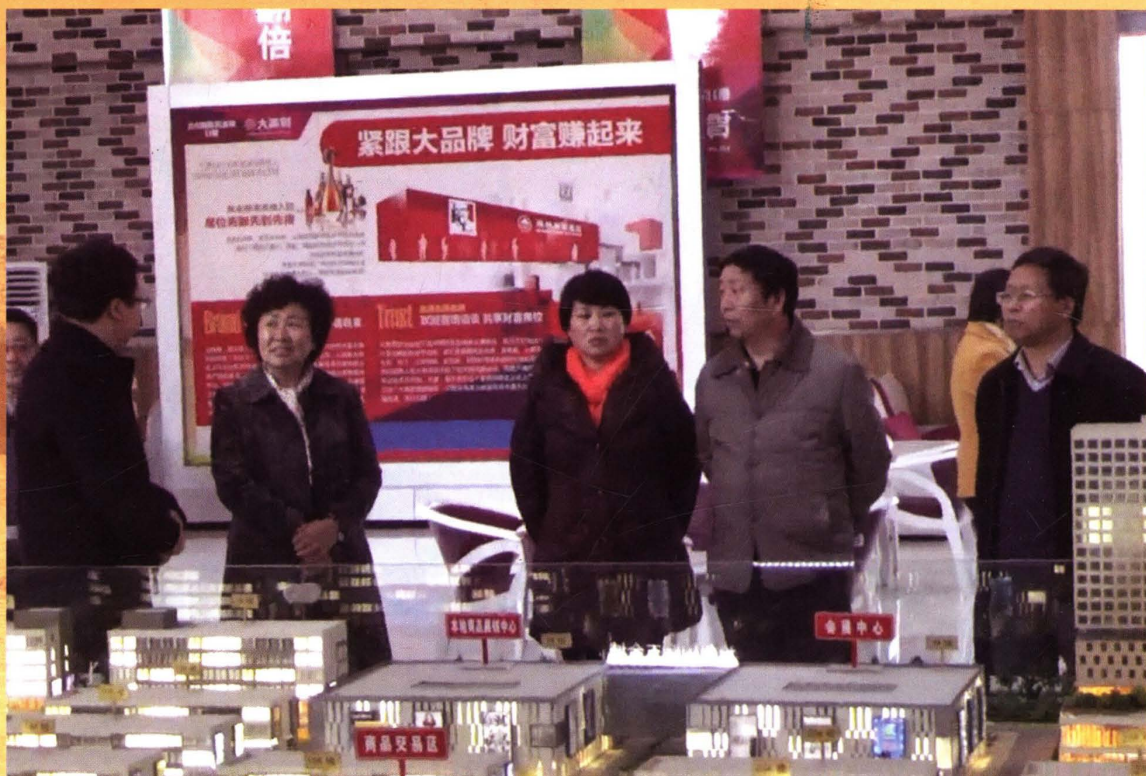
专项视察东部新城建设情况