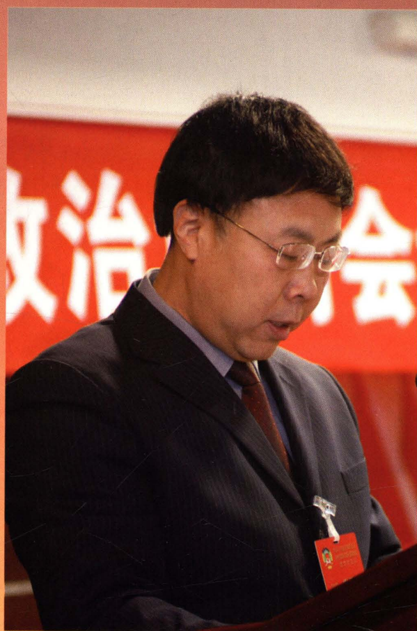
政协党组副书记、副主席柴志华同志在政协全会上作报告