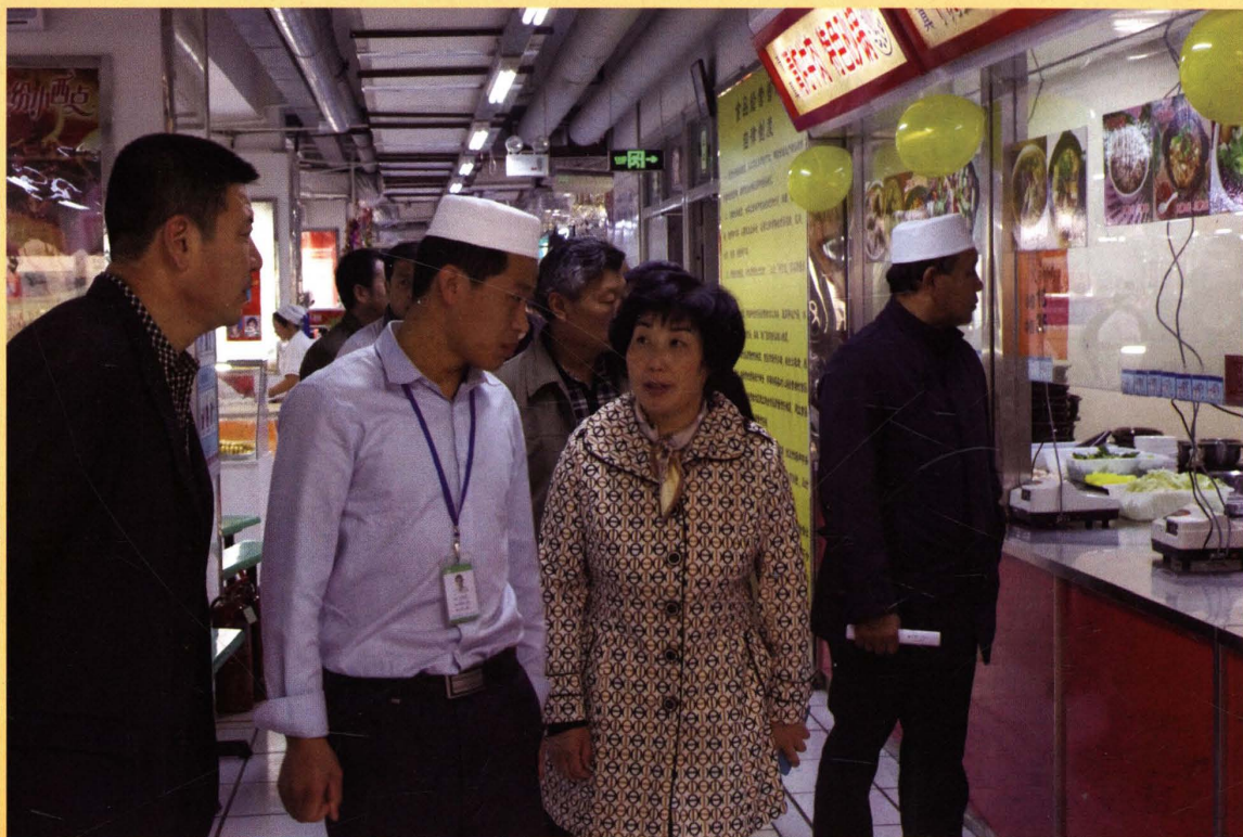
双节期间视察《河北省清真食品管理条例》落实情况