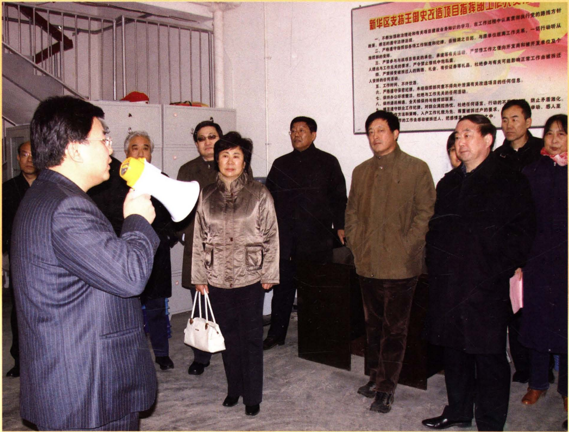
市政协委员视察城中村改造项目