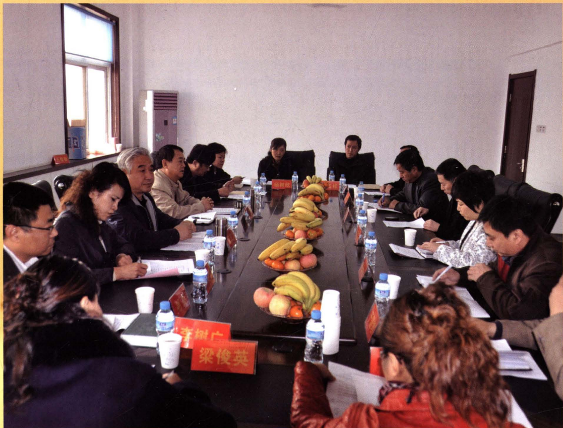
市、区政协委员深入社区调研