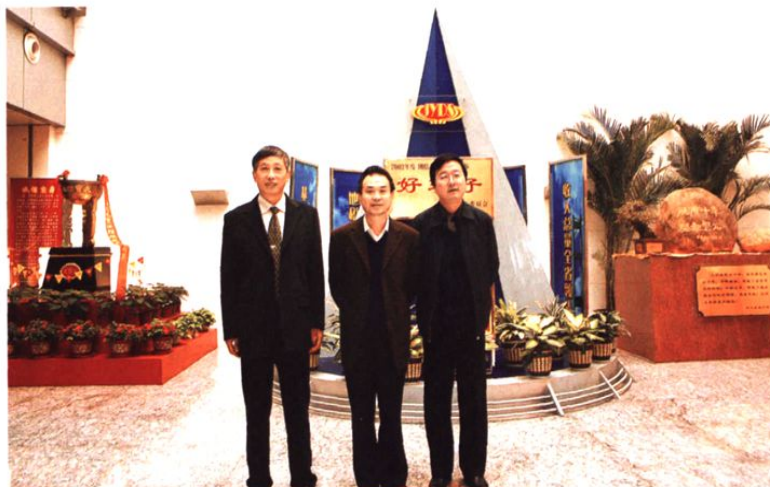
2004年12月1日,国家税务总局副局长王力(中)视察江阴市地方税务局。