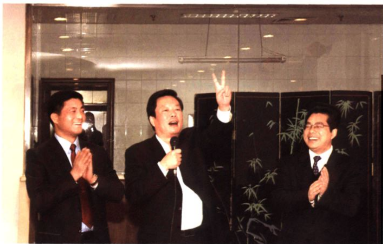
2009年12月31日,江阴市人民政府市长王锡南(中)专程到江阴市地方税务局慰问干部职工,祝贺江阴市地方税务局当年组织收入总量首次突破100亿元、税收收入超过60亿元。