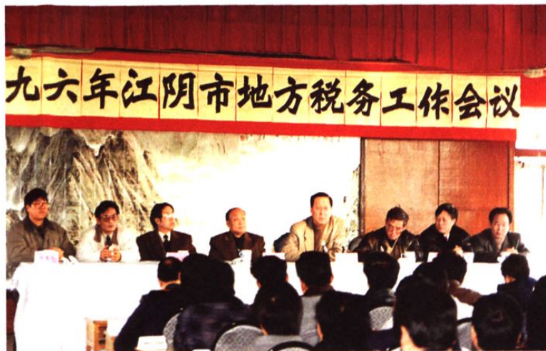
1996年2月2日,国家税务总局副局长卢仁法(左五)在江阴市地税工作会议上讲话。