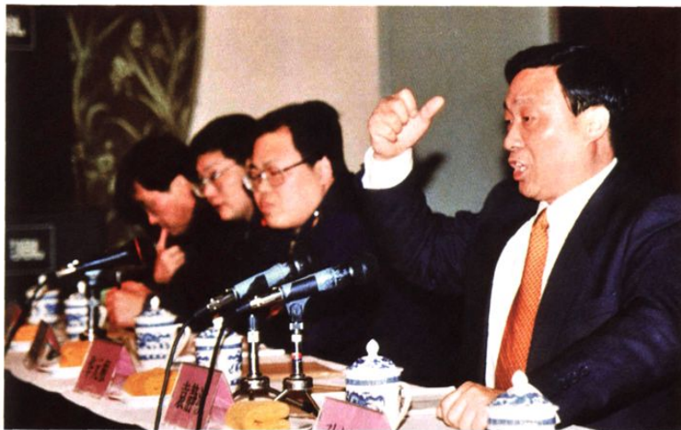
2000年2月24日,中共江阴市委书记袁静波(右)在江阴市地税工作会议上讲话。