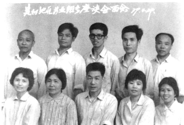
◀ 全区营业班组座谈会