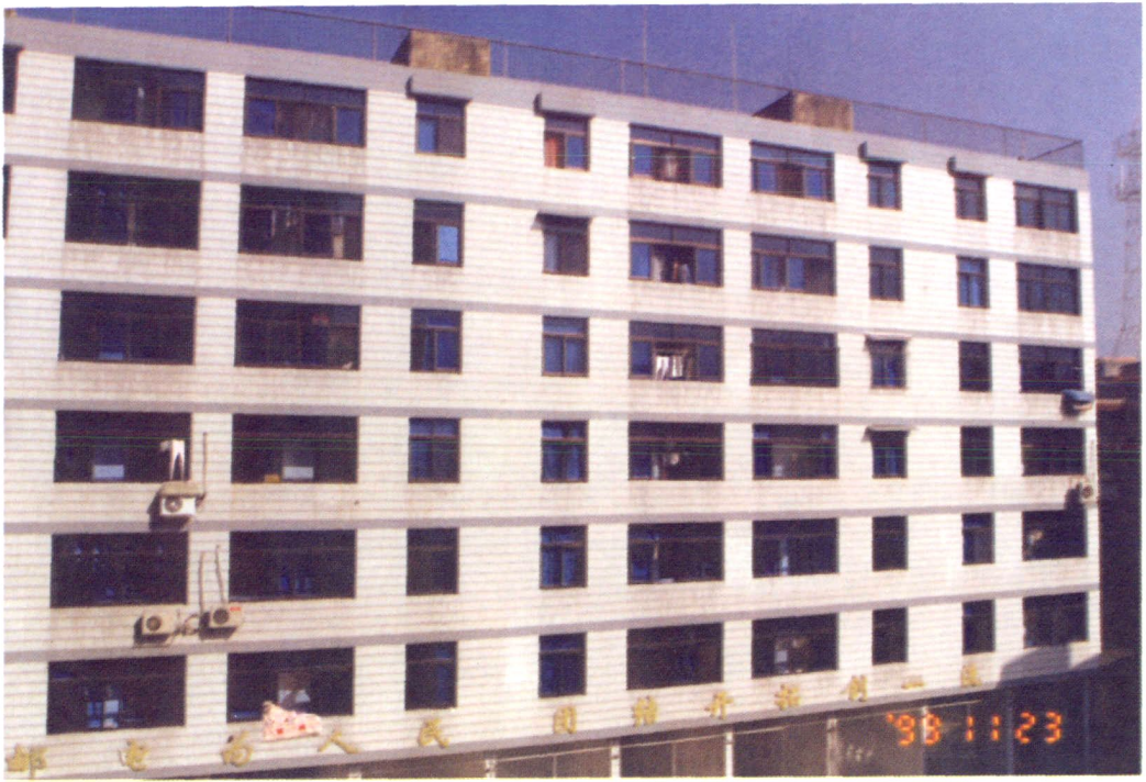
1994年冬建的文昌路邮电职工宿舍