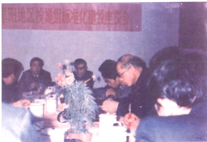
◀ 投递组标准化建设座谈会进行验收