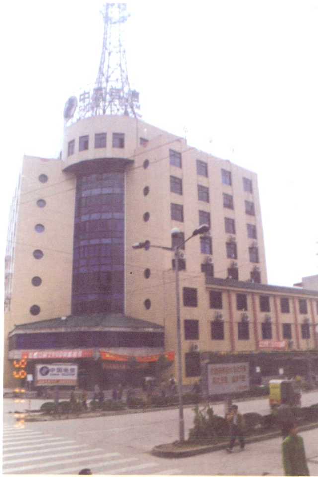
1994年落成的邮电大楼