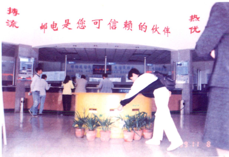
◀ 文明示范窗口之一