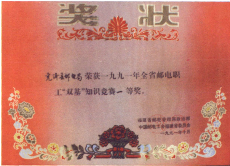
获全省邮电职工“双基”知识竞赛一等奖