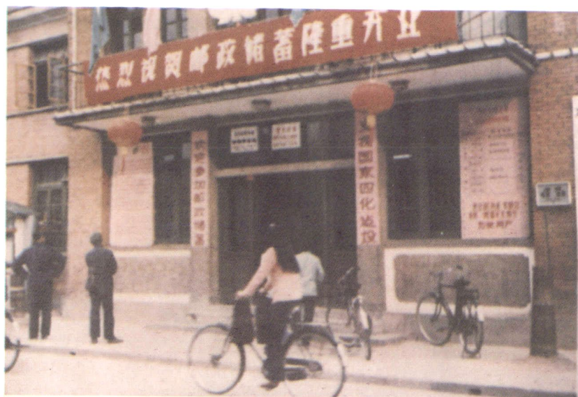
▲ 1968年的邮电营业及办公大楼