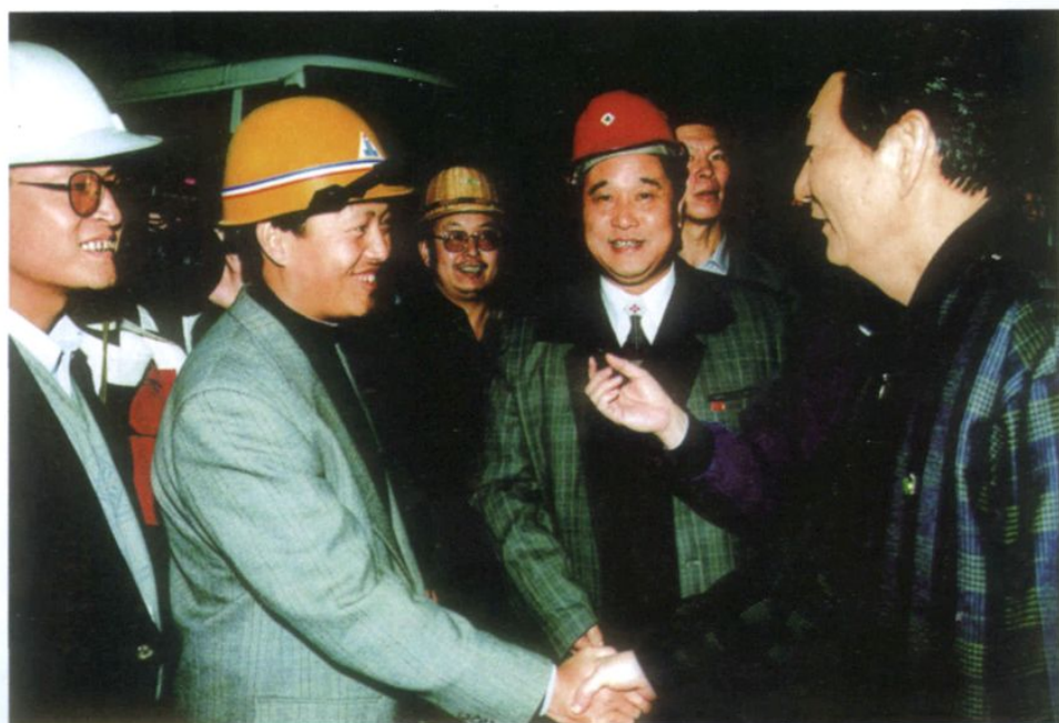
1998年12月28日，原国务院总理朱镕基（右一）在三峡工地接见水电四局领导。