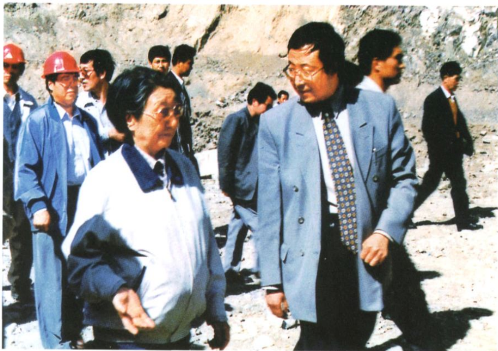
1998年5月，全国政协副主席钱正英视察黑泉水库工程。前排右一为时任水电四局局长、现任黄河上游水电建设有限公司总经理的夏忠。