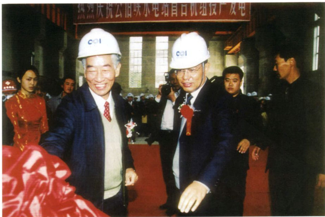
2004年9月26日，原水利部部长汪恕诚（左）、原青海省委书记、现任陕西省委书记赵乐际（右）在水电四局承建的公伯峡水电站首台机组发电仪式上。