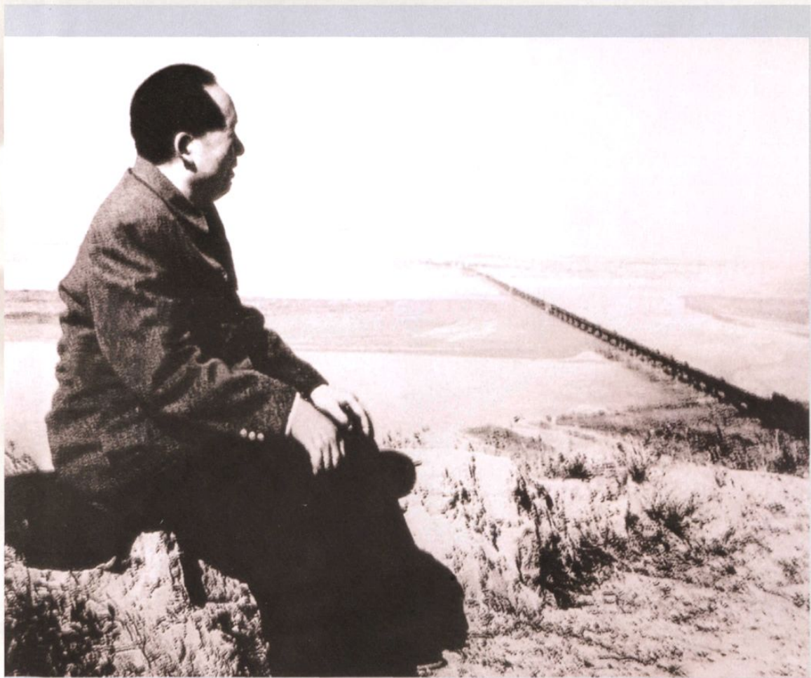
1952年10月，毛泽东视察黄河，发出了“要把黄河的事情办好”的号召。