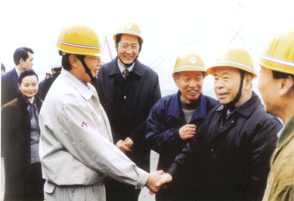
原中共中央政治局常委尉建行（右二）视察三峡工地时接见水电四局领导。