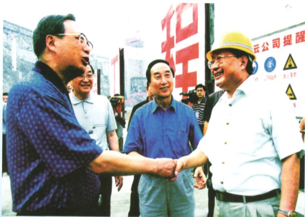
2003年6月，原国务院副总理曾培炎（左）视察三峡工地时接见水电四局领导。