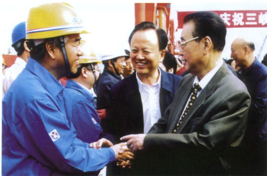
2006年10月26日，李鹏在三峡工地接见水电四局领导。左一为水电四局局长王维斌。