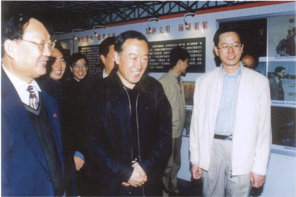
2003年6月11日，原青海省委书记、现任江西省委书记苏荣（中）在水电四局领导的陪同下到水电四局参观考察。