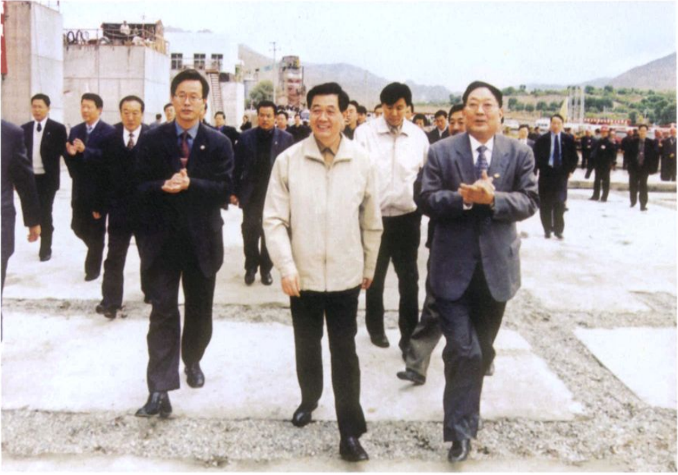
2002年5月24日，胡锦涛视察水电四局承建的青海省尼那水电站。左一为时任水电四局局长的郑征宇，右一为时任水电四局党委书记的王振南。