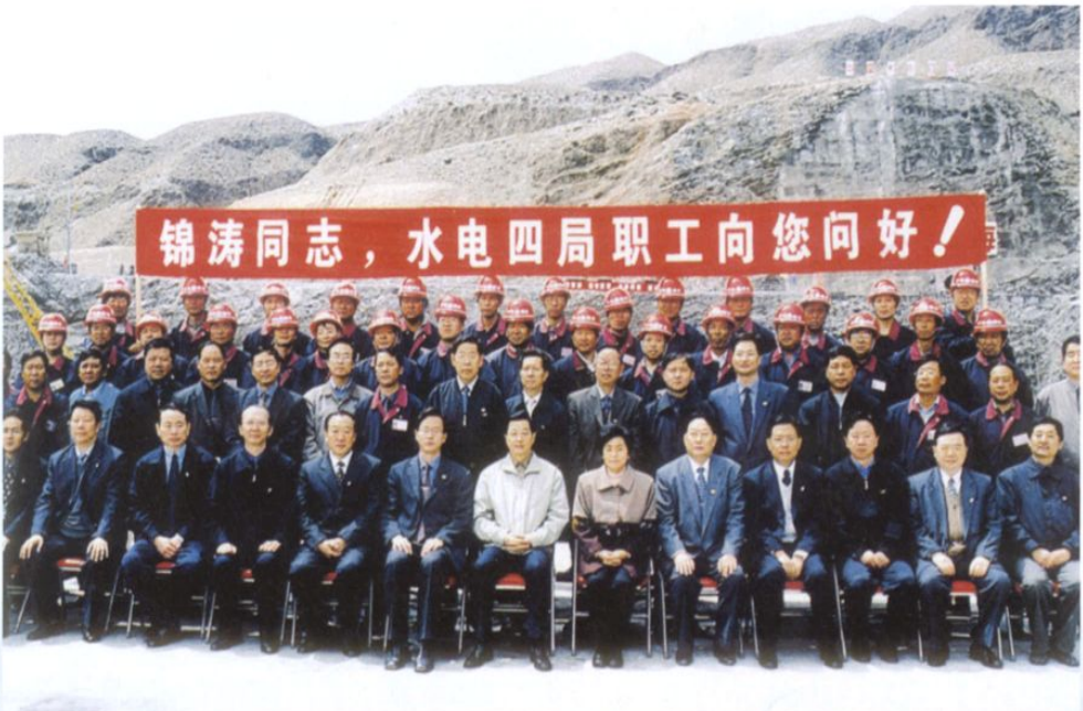
2002年5月24日，胡锦涛在尼那水电站工地与水电四局职工合影。