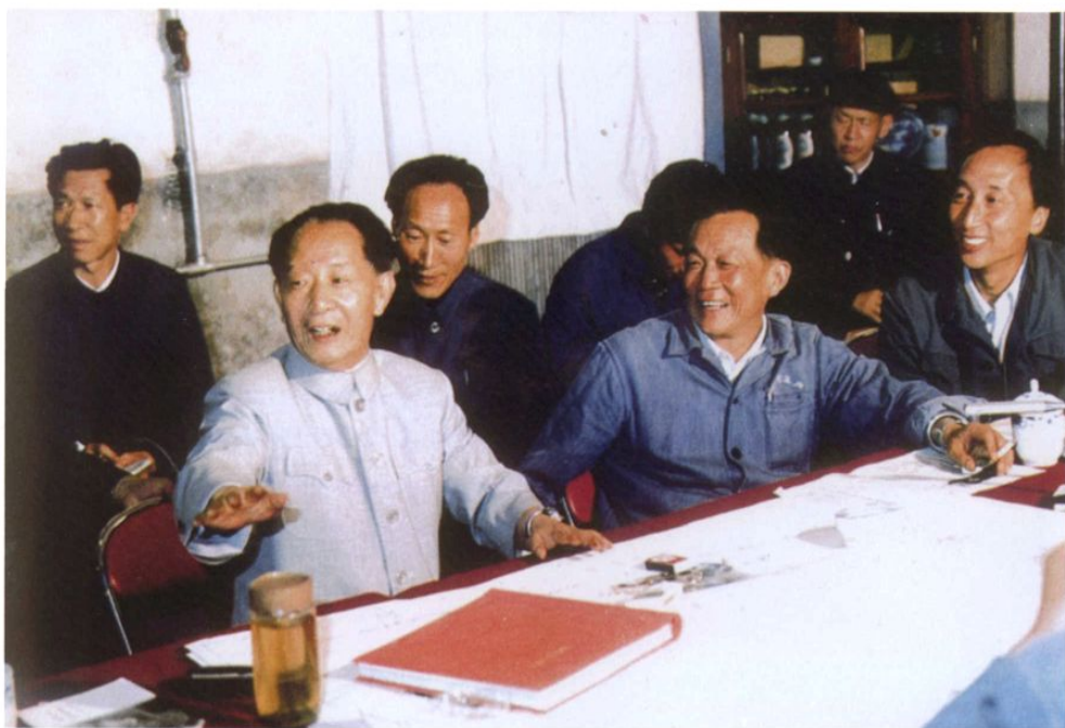
1983年7月23日，原中共中央总书记胡耀邦视察龙羊峡水电站。前排右一为时任水电四局局长、后任长江三峡工程总公司总经理的陆佑楣，右二为时任水电四局总工程师的张津生。