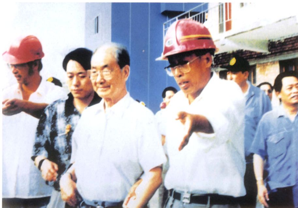
原中共中央政治局常委宋平在水电四局领导陪同下视察龙羊峡水电站。