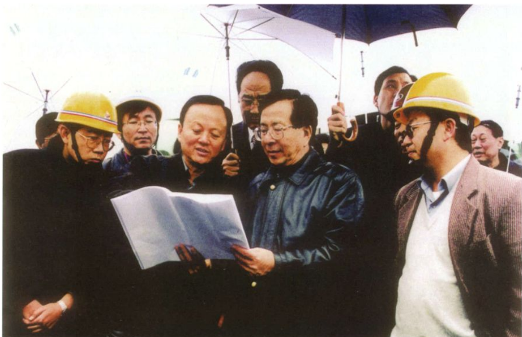
2002年2月，原中共中央政治局常委曾庆红视察三峡工地时与水电四局领导在一起。前排右一为水电四局现任党委书记王争鸣。