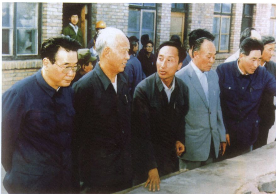
1984年6月，原国务院总理李鹏（左一）、原全国人大常委会委员长万里（左二）视察龙羊峡水电站。