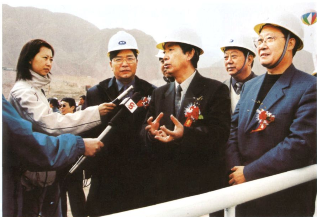
2002年3月20日，中国华电集团公司总经理贺恭（前排中）、国家电网公司顾问刘本粹（前排左）、原青海省副省长苏森（前排右）等领导参加水电四局承建的公伯峡水电站截流工程庆典仪式时接受记者采访。