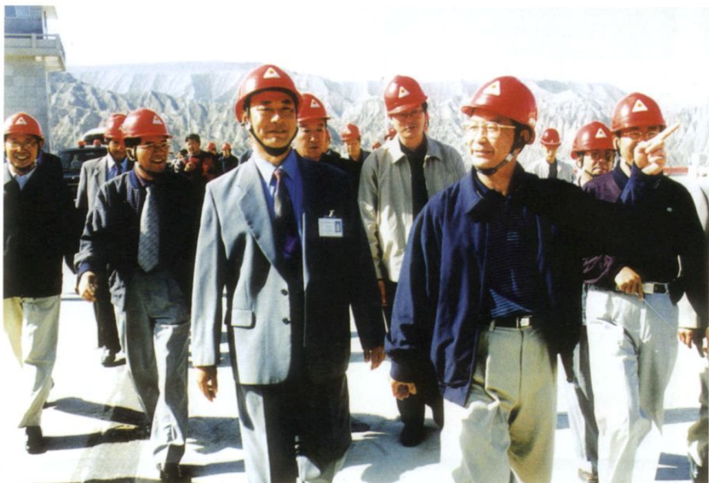
2002年8月30日，国务院总理温家宝视察龙羊峡水电站。