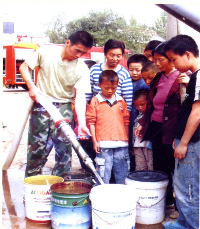
消防队员为受灾群众送水