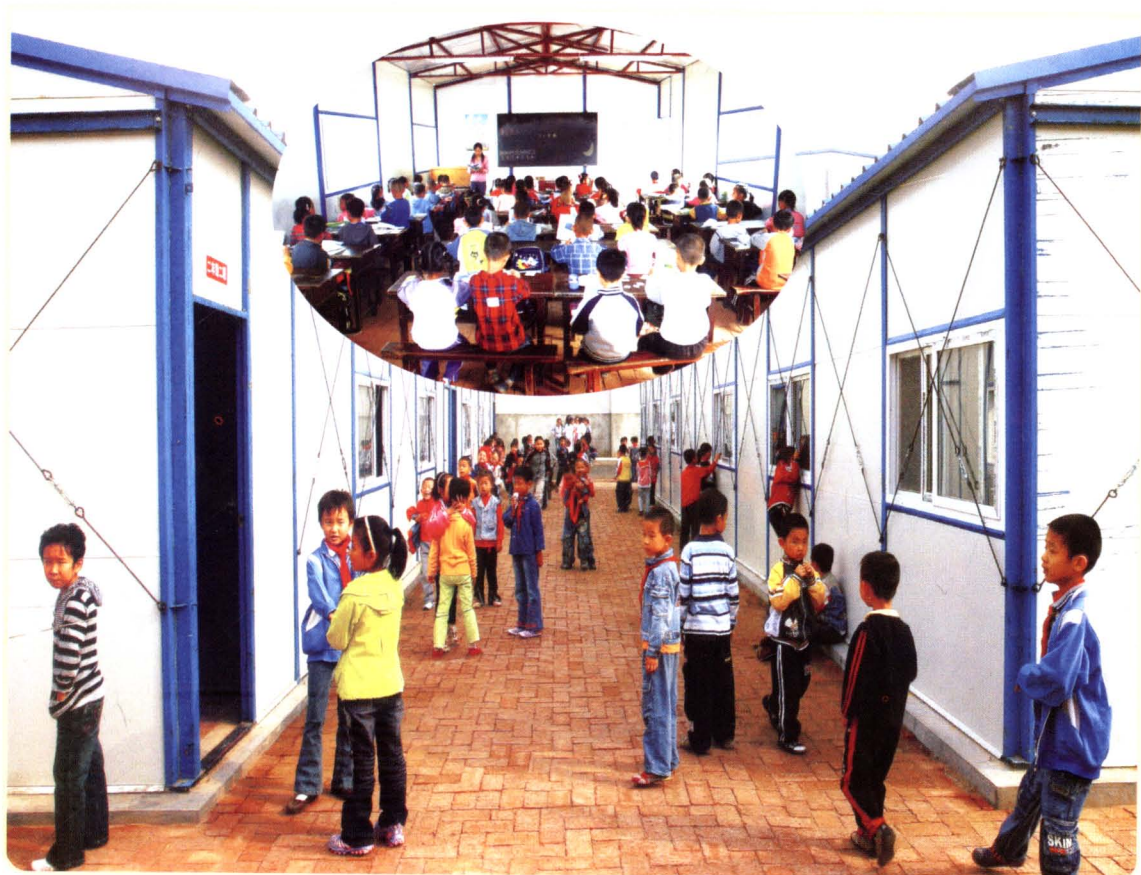
“5·12”地震发生后，搭建的临时板房教室