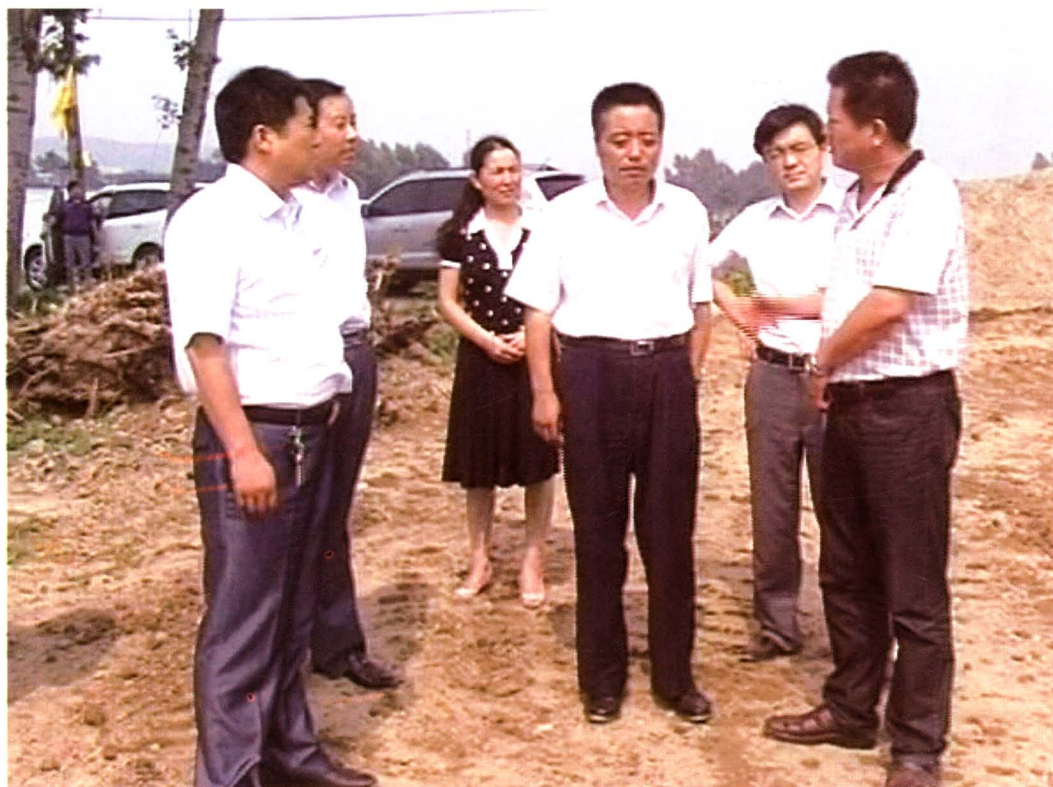
陈仓区人民政府区长苏国宝（右三）深入镇村检查灾后重建工作