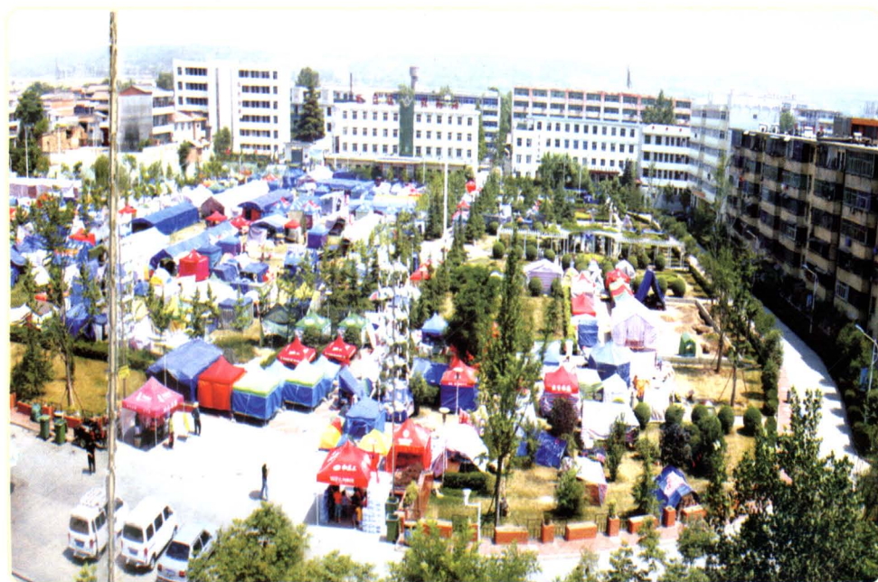
2008年“5·12”地震发生后，位于虢镇育才园紧急避难场所。