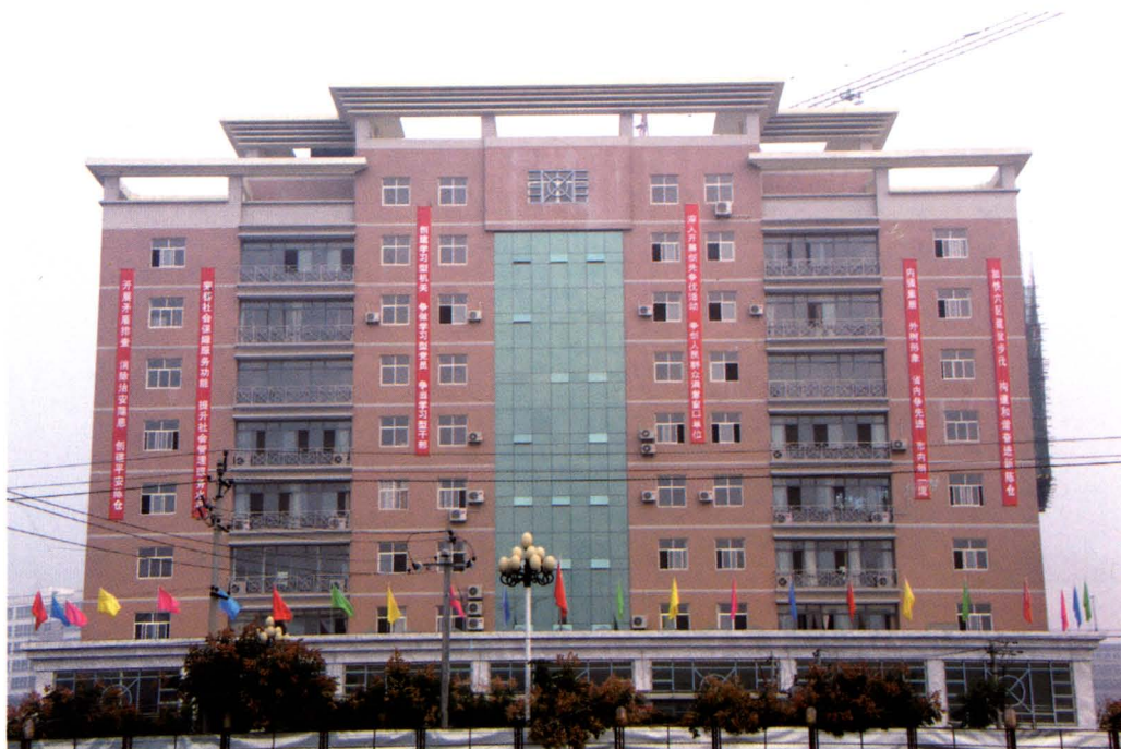
新落成的陈仓区民政大楼