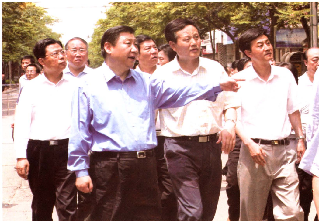
2008年5月21日中共中央政治局常委、中央书记处书记、国家副主席习近平（前排左二）带领中组部、国家发改委、中央政策研究室、民政部等有关部委负责人来陈仓区视察抗震救灾工作。