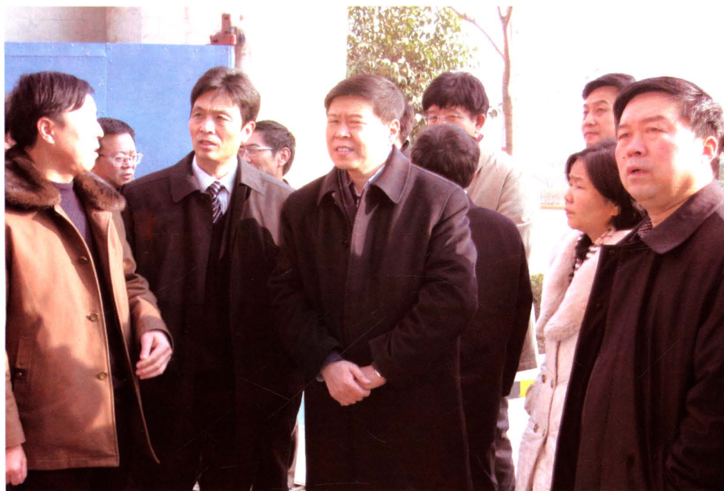
2009年1月17日，国家财政部副部长王军（前排左三），在省政府副省长姚引良（前排右一）、省财政厅纪检组长白君贤（前排右二）陪同下来陈仓区视察灾后重建工作。