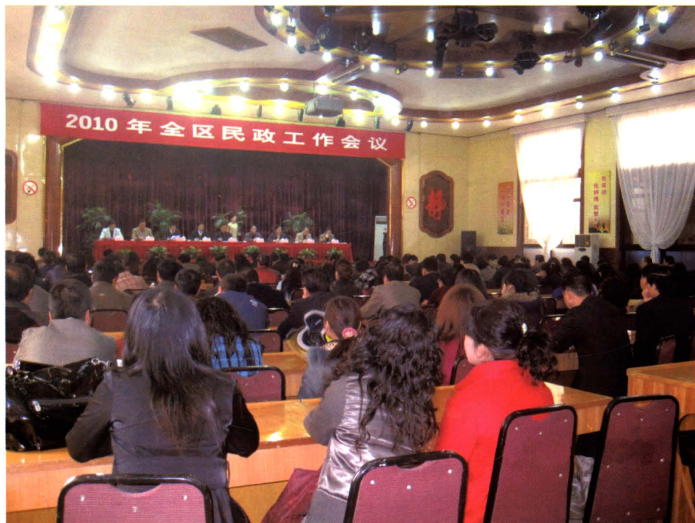
全区民政工作会议