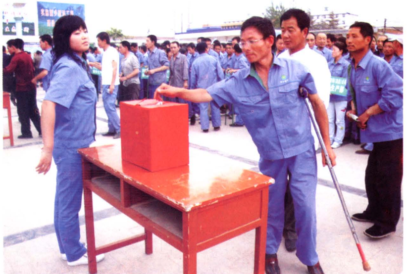
福利企业的职工为灾区捐款

2008年6月24日，省委常委、西安市委书记孙清云（左二）、市长陈宝根（左一）代表西安市捐赠1500万元人民币帮扶陈仓区灾后重建。