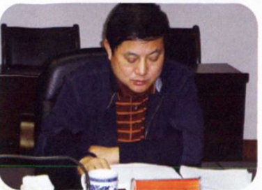
县长刘定青在国防工作会议上讲话