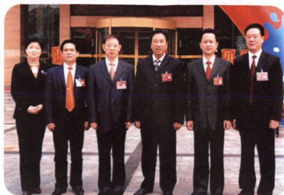
第十五届人大常委会正副主任合影