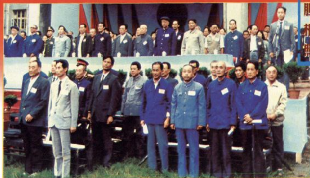
1990年10月1日,县五大班子领导与部分省市负责人和老领导在老区庆典大会上