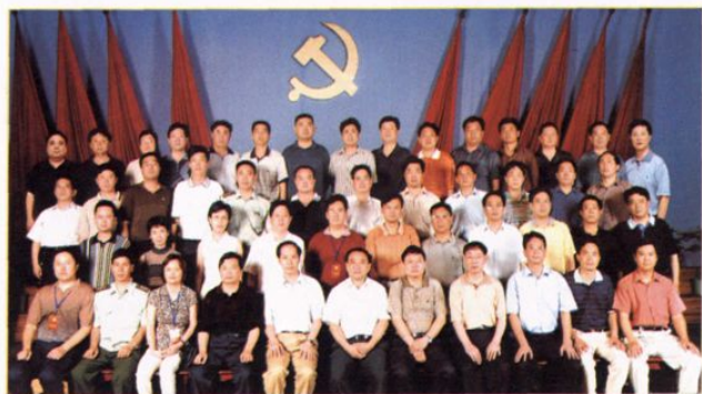
县委第十届委员、候补委员合影