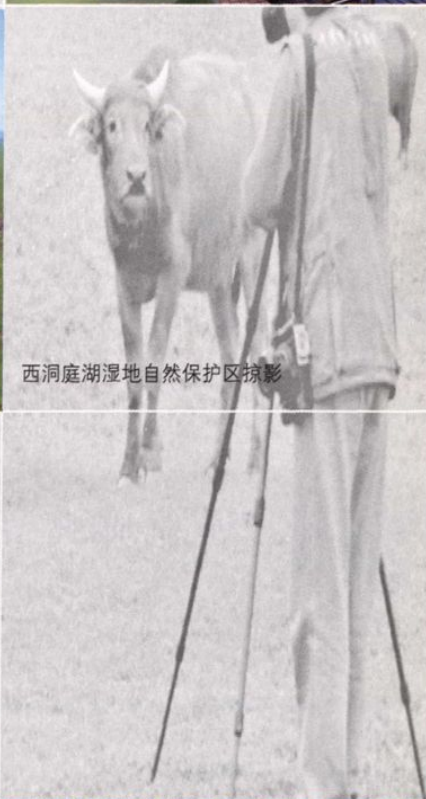
西洞庭湖湿地自然保护区掠影