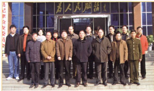
2007年4月,县委领导班子成员与人大、政协负责人合影