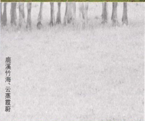
鹿溪竹海、云蒸霞蔚