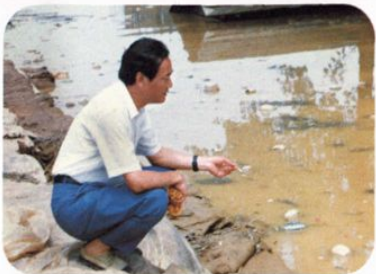
县长胡子达在抗洪抢险第一线