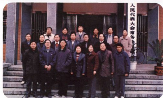
第十三届人大常委会组成人员合影