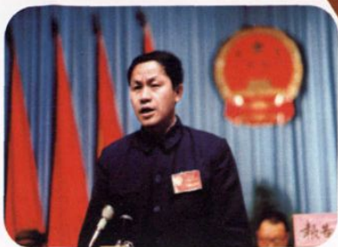
县长肖有志在第十一届人民代表大会上