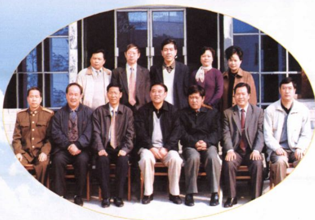
第九次代表大会前的县委常委合影