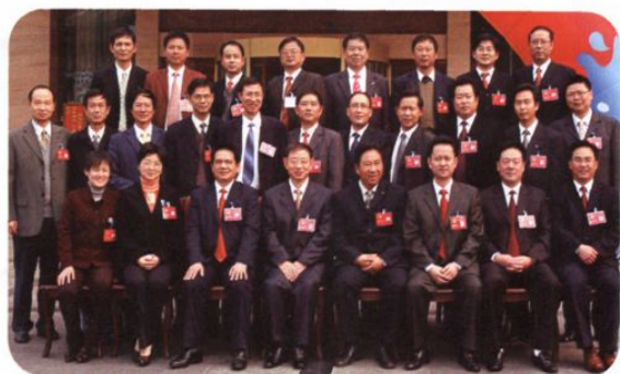
第十五届人大常委会组成人员合影