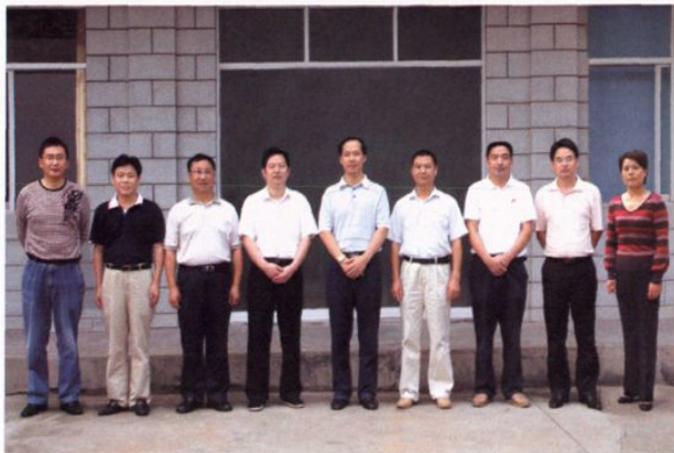
2007年4月换届后的县政府领导班子