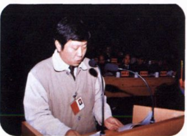
县长车德斌在县第十四届人民代表大会上