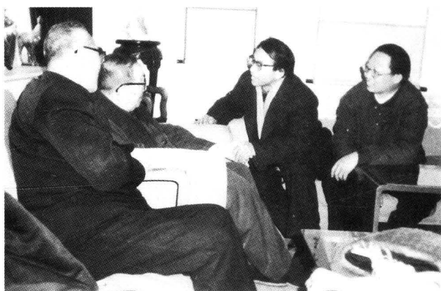
1986年12月，全国人大常委会副委员长、社中央主席许德珩在北京寓所接见九江市社员。