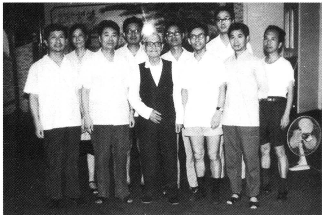
1985年8月，全国政协副主席、社中央副主席茅以升在九江接见部分社员。