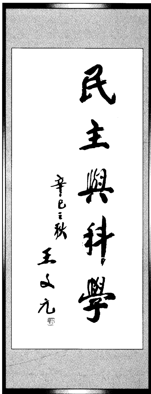
2001年9月，全国政协副主席、社中央常务副主席王文元题词。