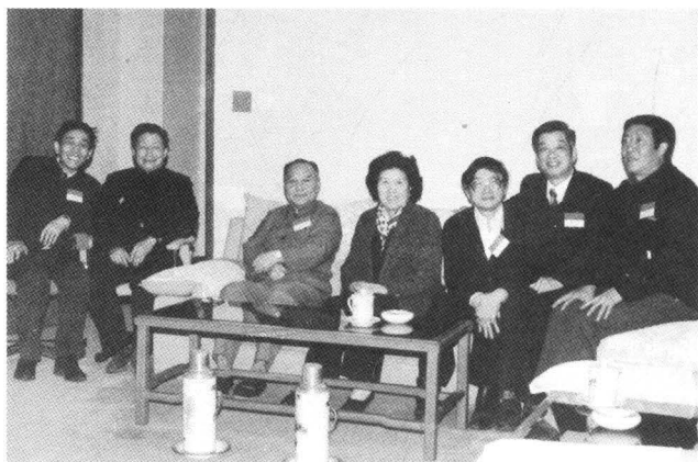
1989年1月，中央统战部副部长万绍芬在北京看望出席社全国五大的江西代表。