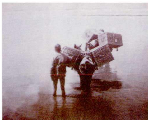
驮运邮件的马班涉渡汾河