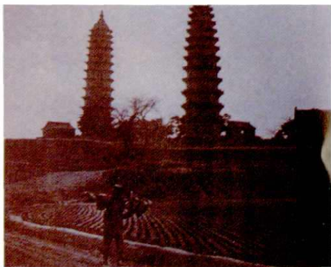
中华邮政时期邮差在出班途中 (1920年)