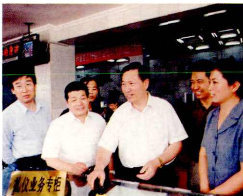
2000年国家邮政局谭小为副局长(中)视察太原邮政