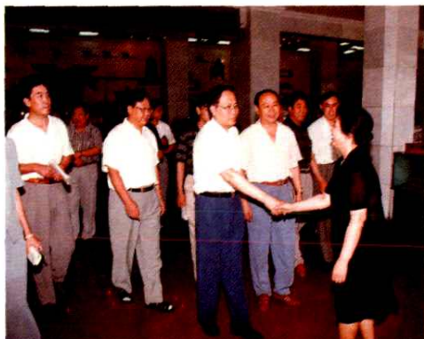
1997年周德强副部长(中)视察 车站支局三星级营业厅