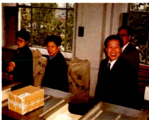
谢高觉副部长(左二) 1994年视察包刷分拣中心