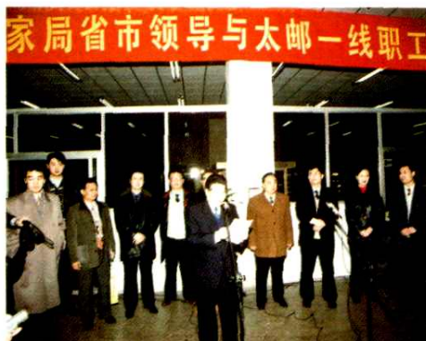
国家局、省、市领导与太邮一线职工共渡除夕