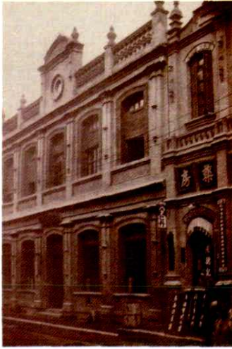
二十世纪二十年代山西邮务管理局 (现钟楼街支局旧址)