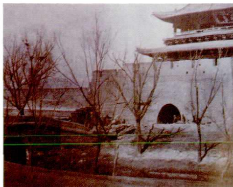
人民革命战争时期邮务局运邮马车 进入太原市大南门