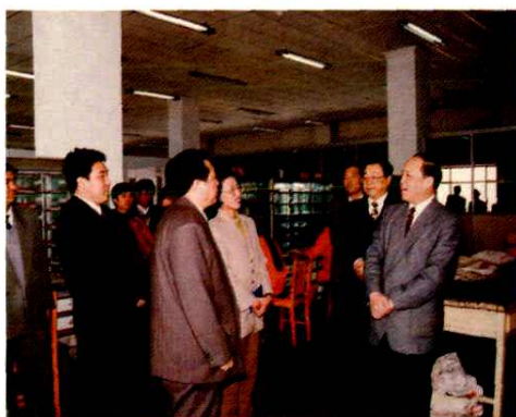
1996年林金泉副部长(右一) 视察函件分拣中心