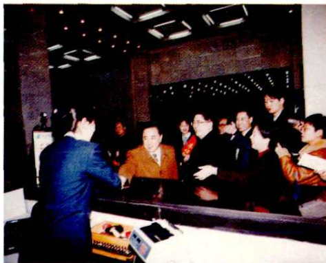
1999年春节刘立清局长(左三)与杨志明副省长(左二)在王子宪局长的陪同下看望太邮职工