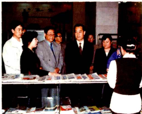
1997年杨贤足副部长(右二) 视察车站支局三星级营业厅