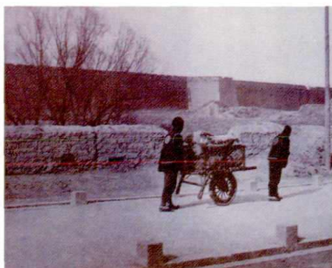
邮差使用独轮车运送邮件