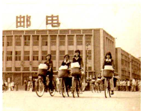
二十世纪七十年代太原邮政大楼 (五一广场)