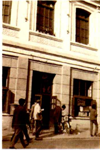
建国后更名为钟楼街支局的营业大厅大门