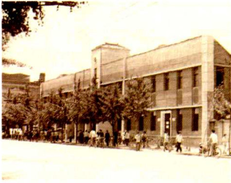
二十世纪四十年代山西邮政管理局 (现五一路邮政局)