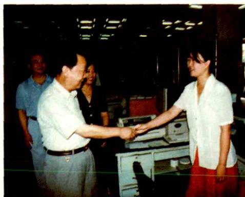
1997年国家邮政总局盛名环局长(左二)视察 车站支局三星级营业厅并与营业员亲切握手