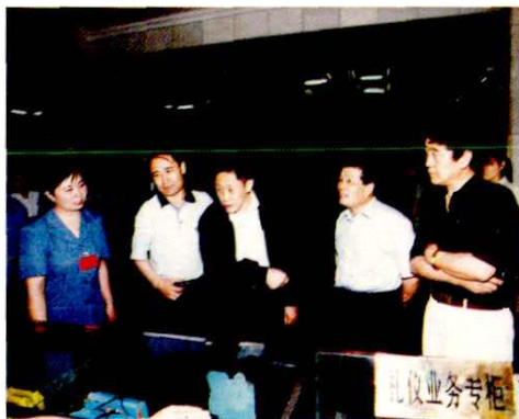
2000年国家邮政局刘安东副局长(中)视察太原邮政