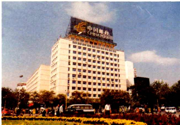
位于迎泽大街1号的太原邮政枢纽综合办公大楼