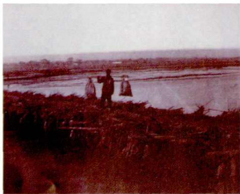
大清时期邮政当班邮差挑运邮件 途经汾河简易桥