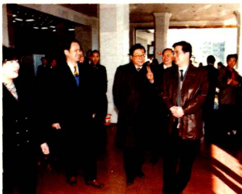
1996年刘立清副部长(右一) 视察车站支局三星级营业厅