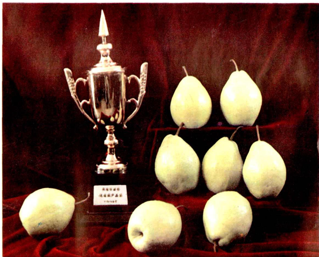
金花梨(又名北京梨)