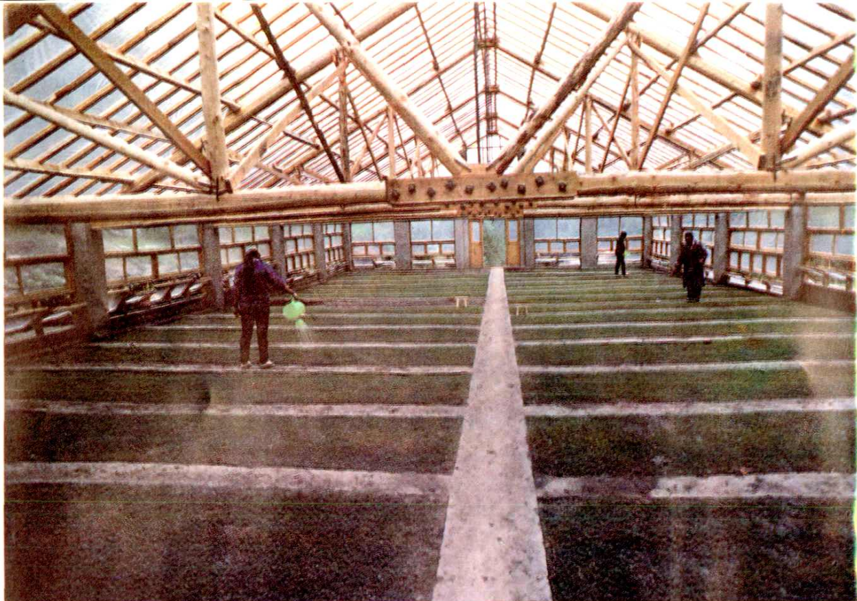
金川县色斯满林场育苗棚