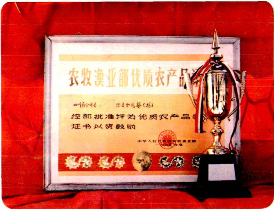
金花梨获中央农牧渔业部优质农产品奖