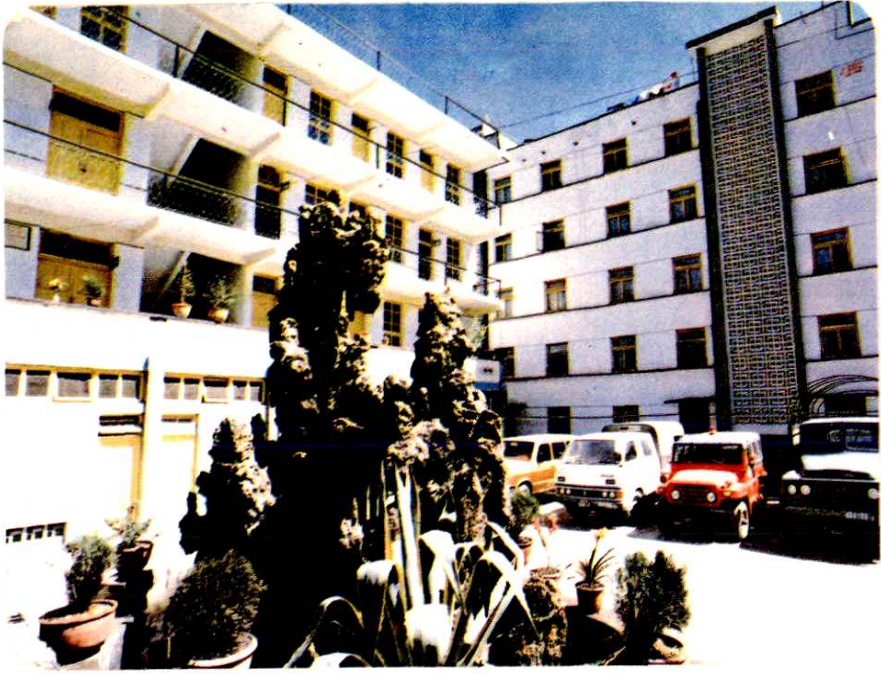
金川县林业局局机关