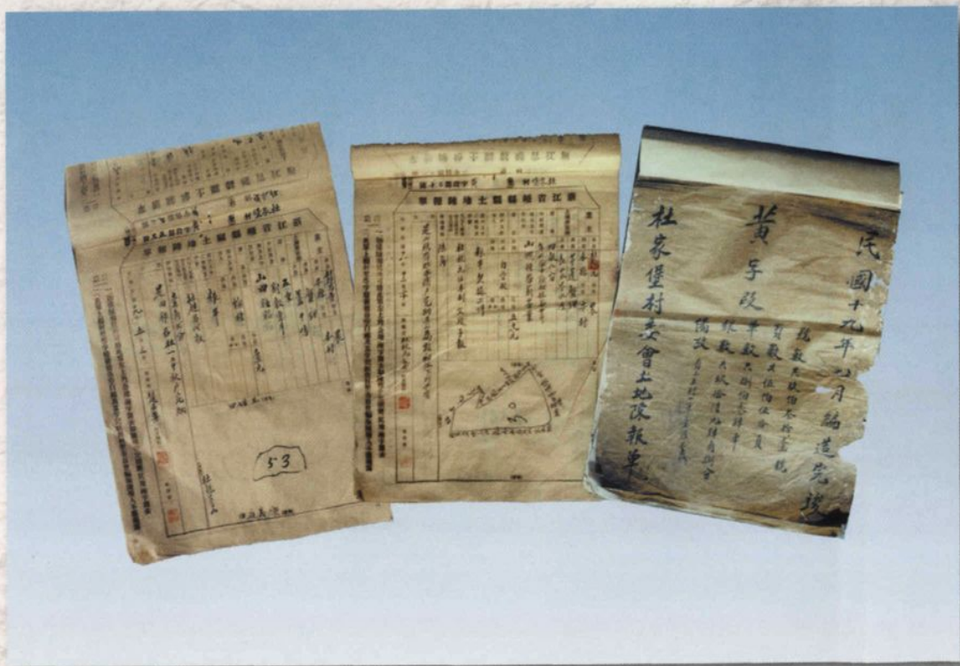
下图为：民国18年杜家堡村土地陈报单