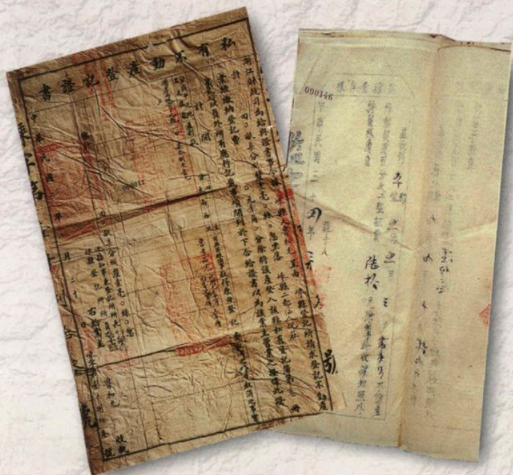
左图为：民国2年私有不动产登记证、不动产移动契价监证费收据。