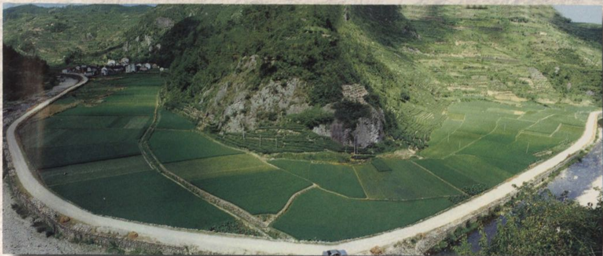
路堤结合节约耕地