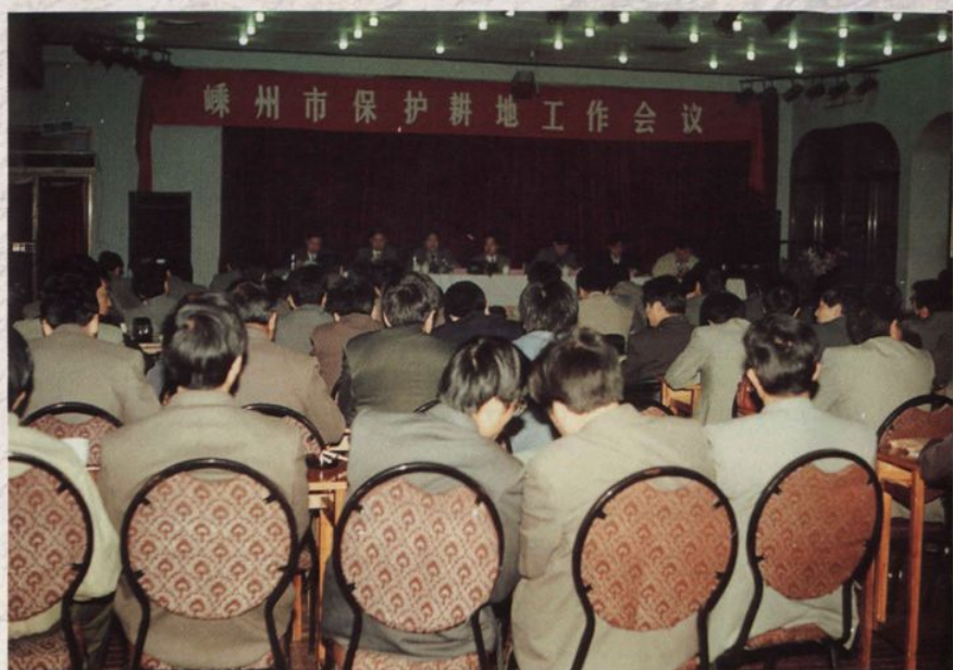
保护耕地工作会议