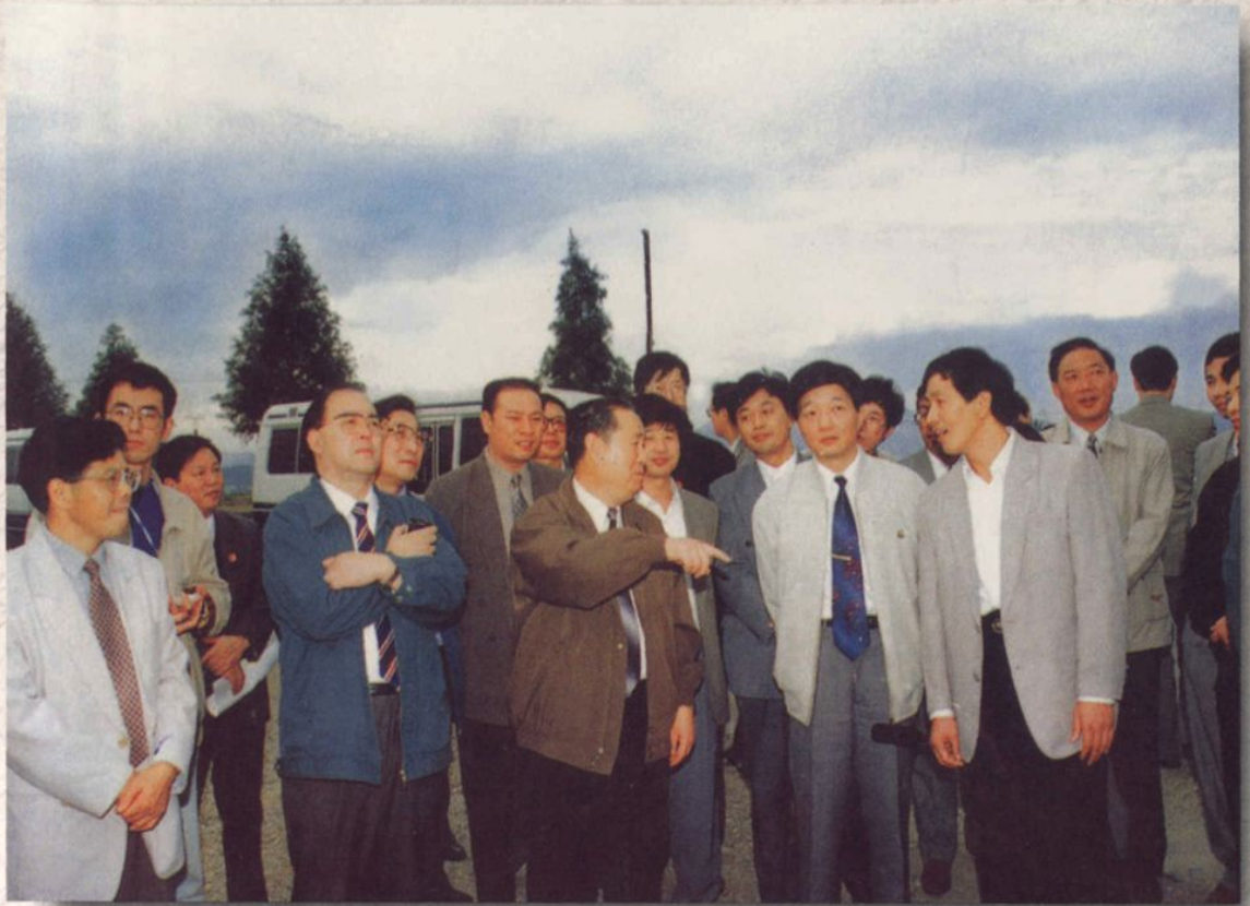
1996年11月3日，中共中央政治局委员、国务院副总理姜春云（上图前排左三）在省、市领导陪同下来嵊州考察中低产田改造工程。