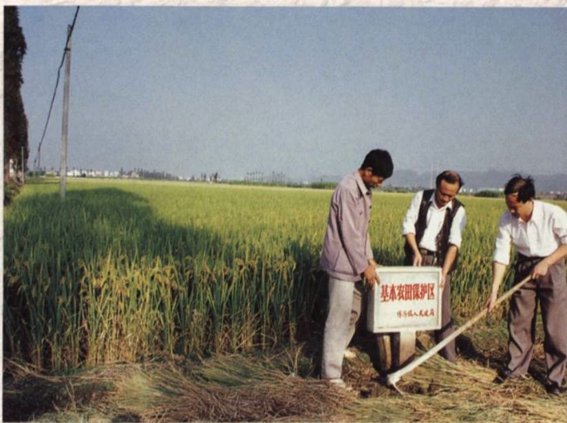
在基本农田保护区树标志