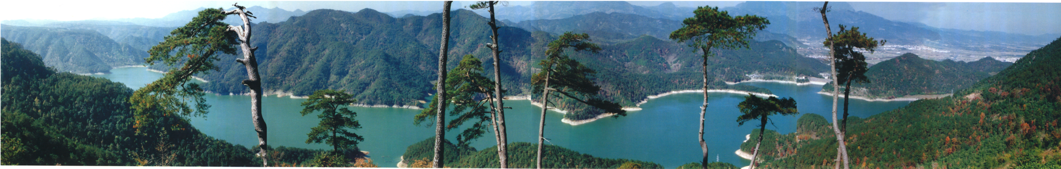
“东南山水越为最，越地风光刺领先”