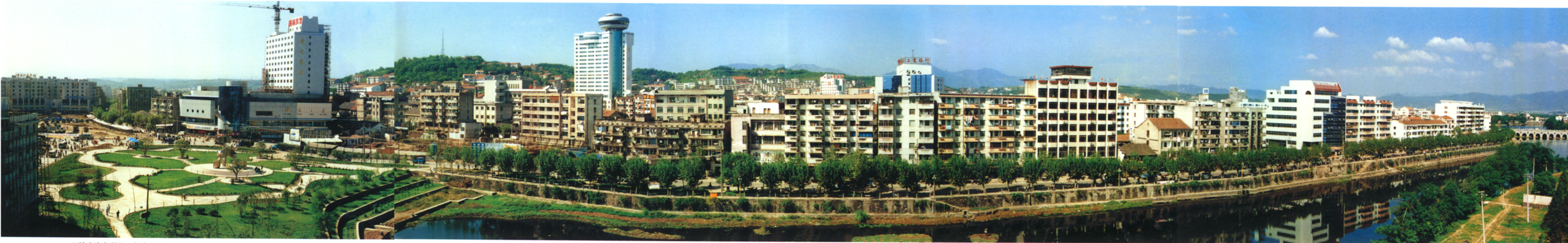
旧城改造中利用江岸滩涂建设的新江滨路一瞥