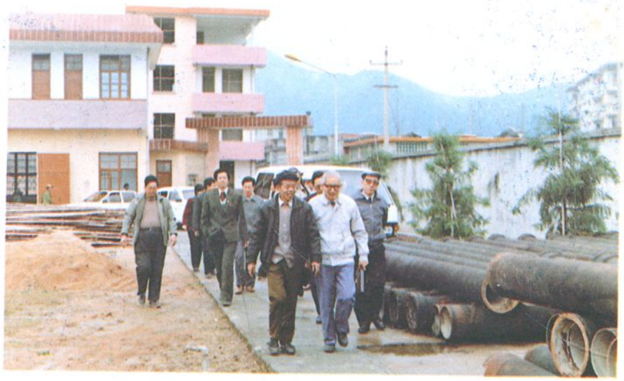
省、市领导检查将乐改水工作。这是检查水厂。