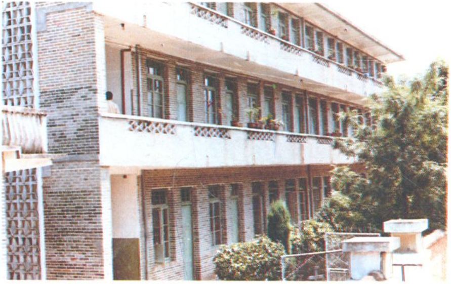
高唐中心卫生院门诊楼