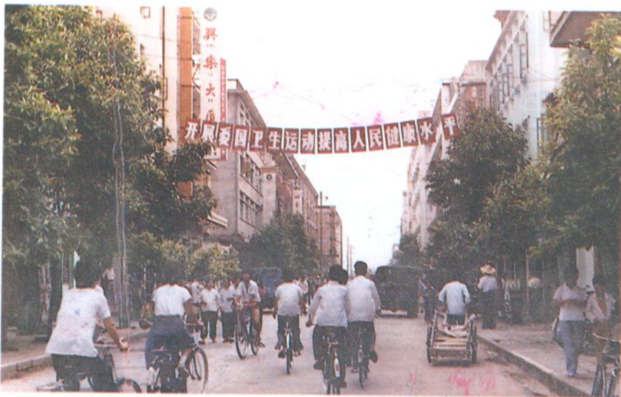
爱国卫生经常化、制度化，城区保持整洁。