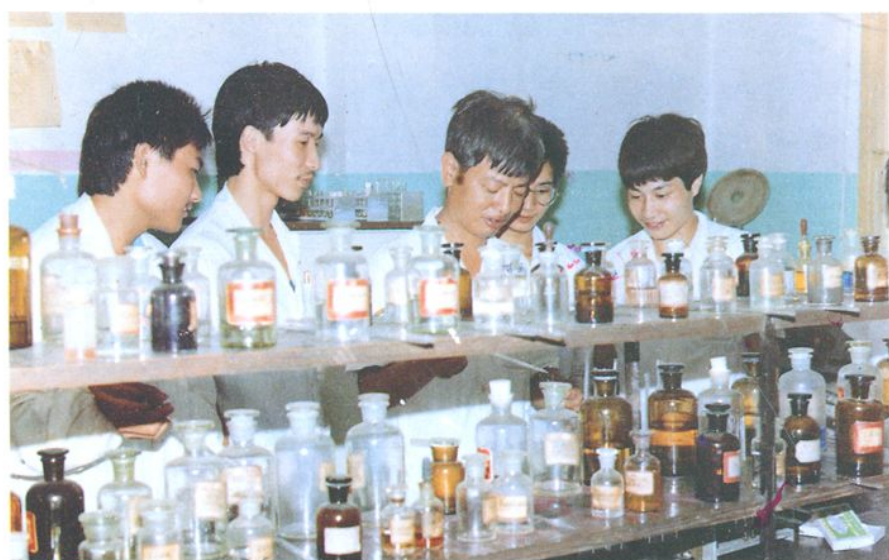
县医院为基层培训检验人员