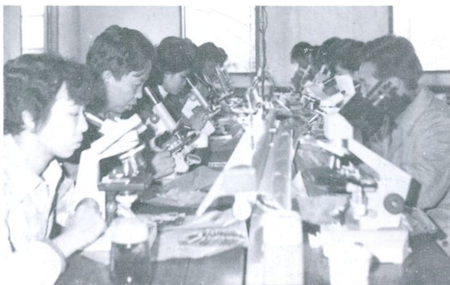
县防疫站培训丝虫病血检人员