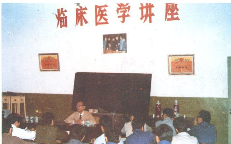
邀请上海教授来县举办讲座