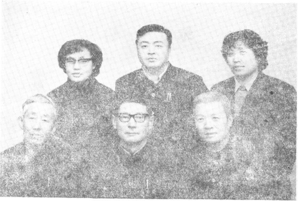
1983至1984年商业局领导成员