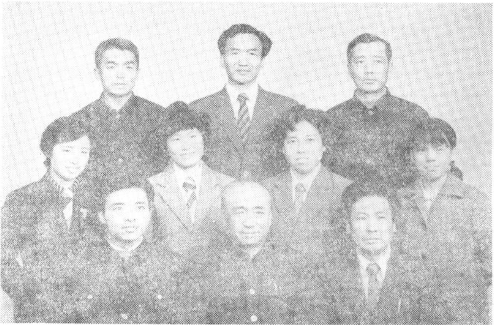
《商业志》编纂办公室全体成员