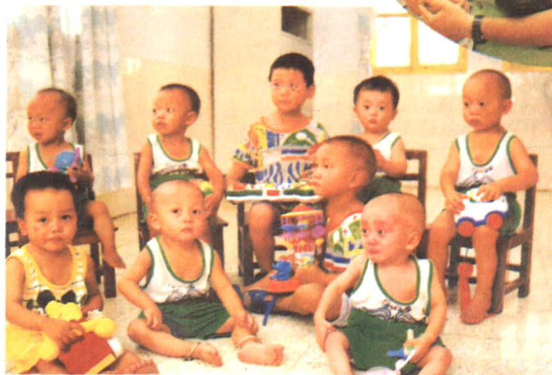
其中被拐獲救的9名兒童