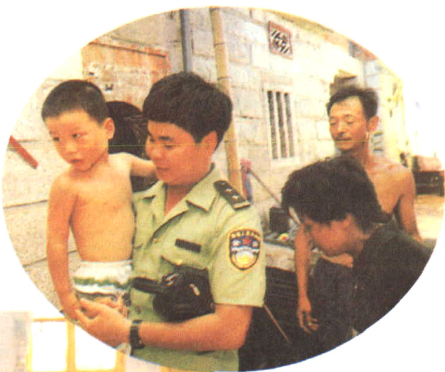
1999年1月，同安分局偵破一起特大拐賣兒童案，解救被拐男孩24名。