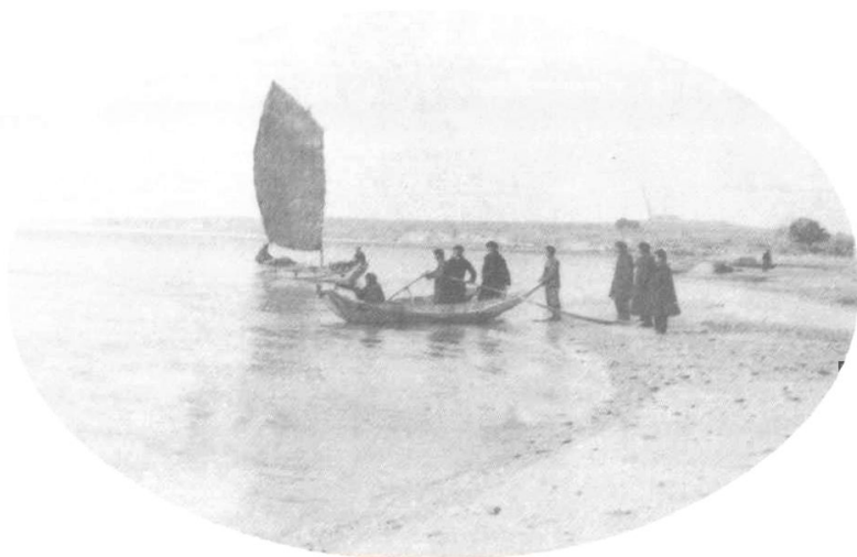
50年代, 警民 联防海上巡逻。