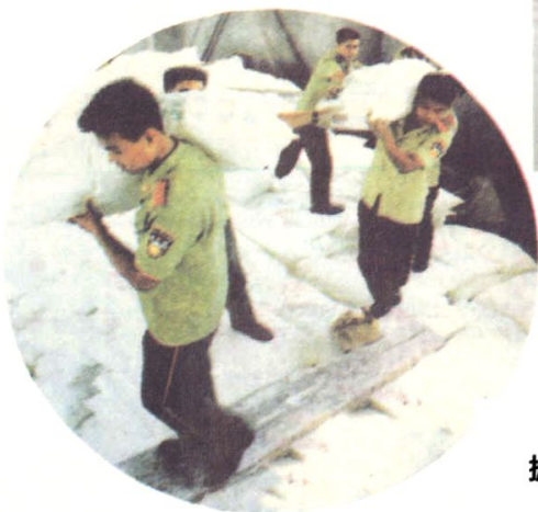
边防民警利用休息日帮助 搬运货物的情景。