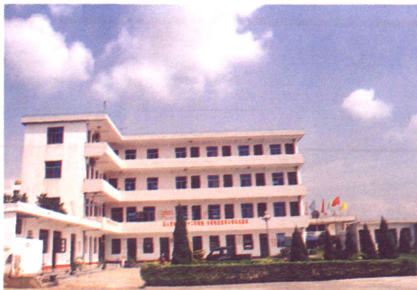
厦门市公安局洪塘派出所