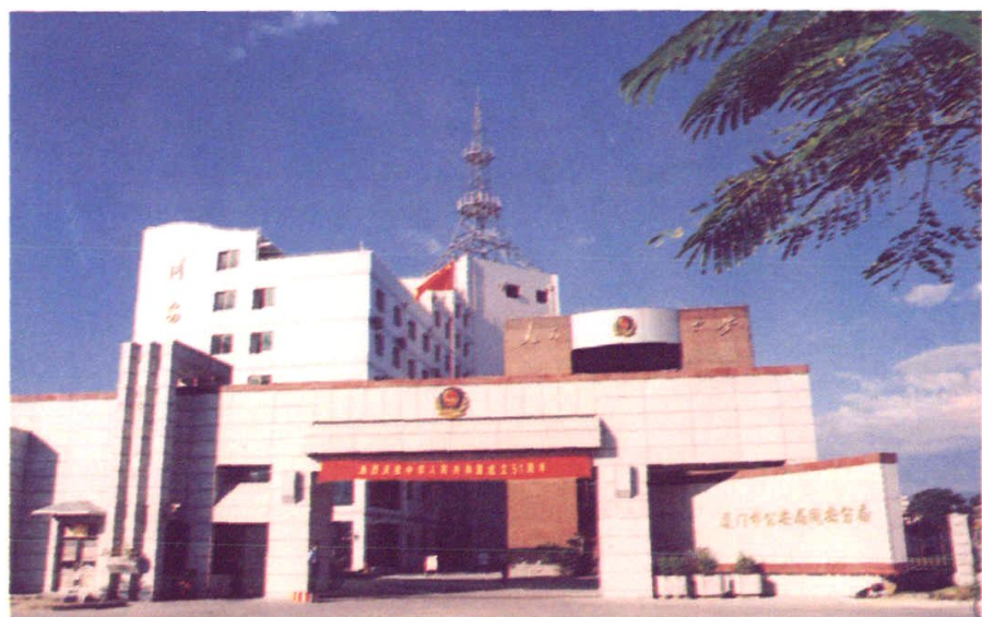
2000年5月1日,竣工的厦门市公安局同安分局新址(大同镇银湖路)