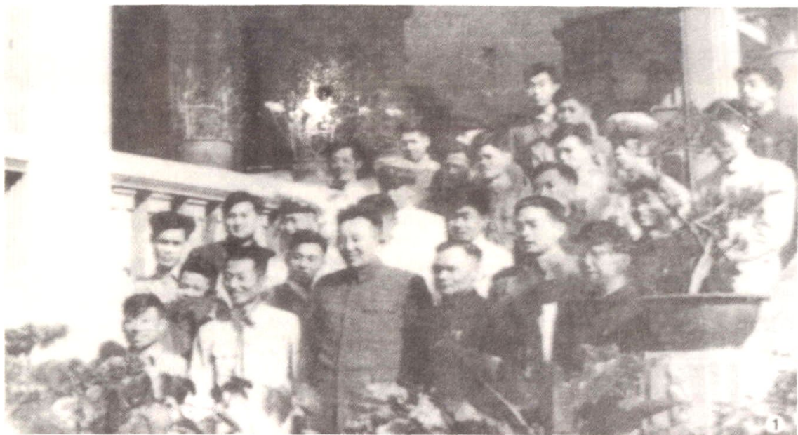
1958年4月，公安部部长罗瑞卿（前排左三）在省公安厅厅长郑从政（前排左四）的陪同下视察厦门和同安澳头沿海对敌斗争工作。