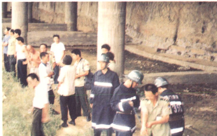
2000年9月30 日，巡警、消防战士 奋不顾身跳入西溪抢 救落水者。