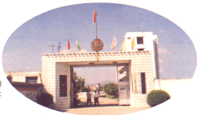
1993年11月搬 迁看守所的新址 (大同镇田洋村)