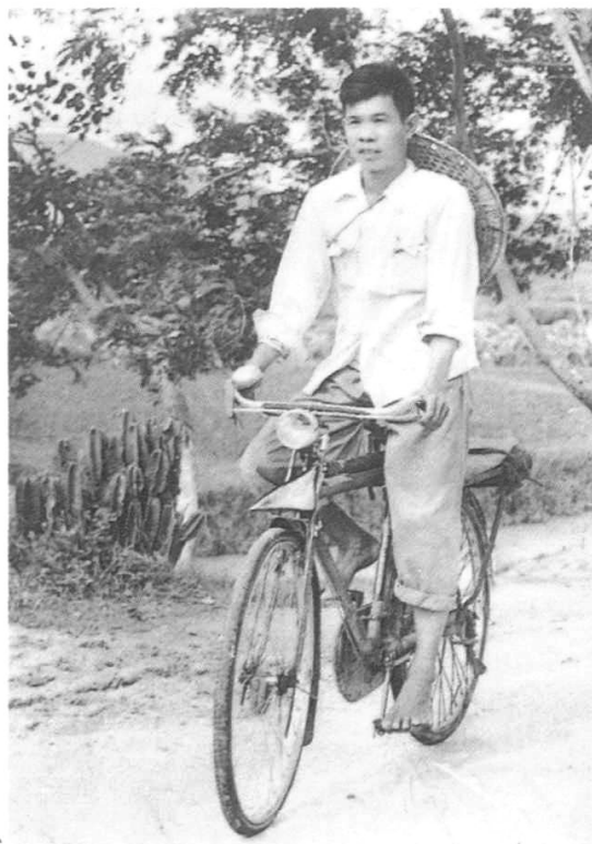
马巷自行车工人洪助愿于1957年7月27日智擒特务，其英勇事迹在全省广为传颂。