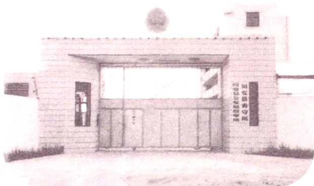
1980年9月，新建 成的看守所（址城郊大 轮山坳）