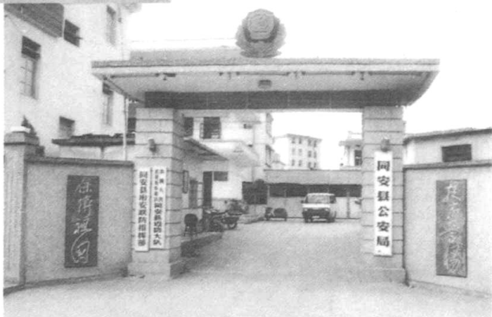
1981年改建后的新大门