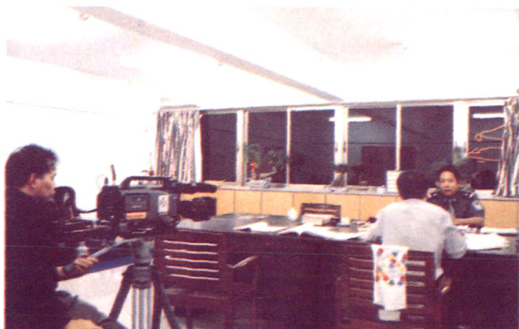
2000年10月29日，中央电视台记者前来同安分局采访一起特大诈骗案件侦破情况。