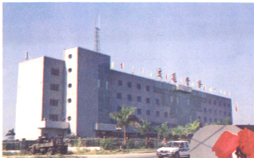
同安交通警察大队

1995年起先后成立刘五店、大嶝边防工作站（台轮停靠站）右图为省大嶝边防工作站举行挂牌仪式。