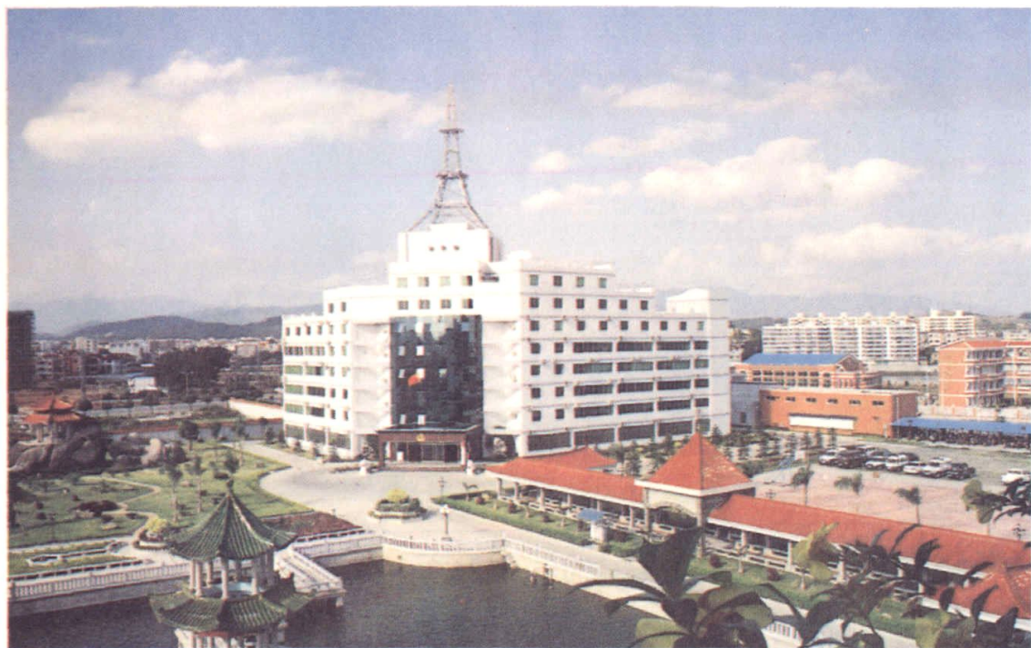
同安公安分局办公楼