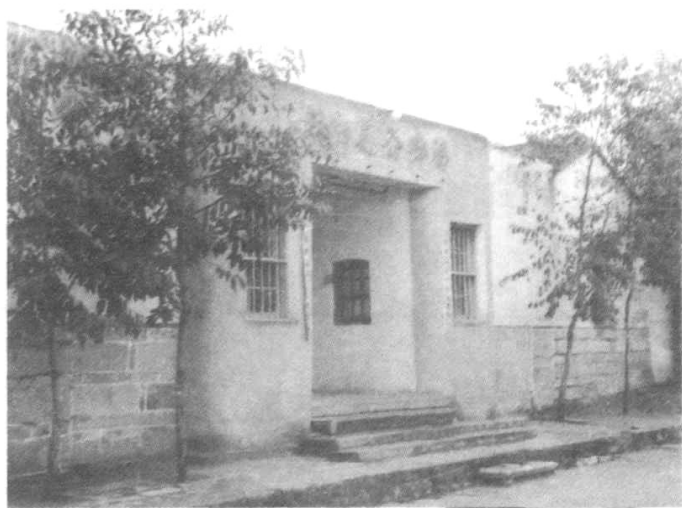
1951年起,同 安县公安局所在 地(三秀路155号)