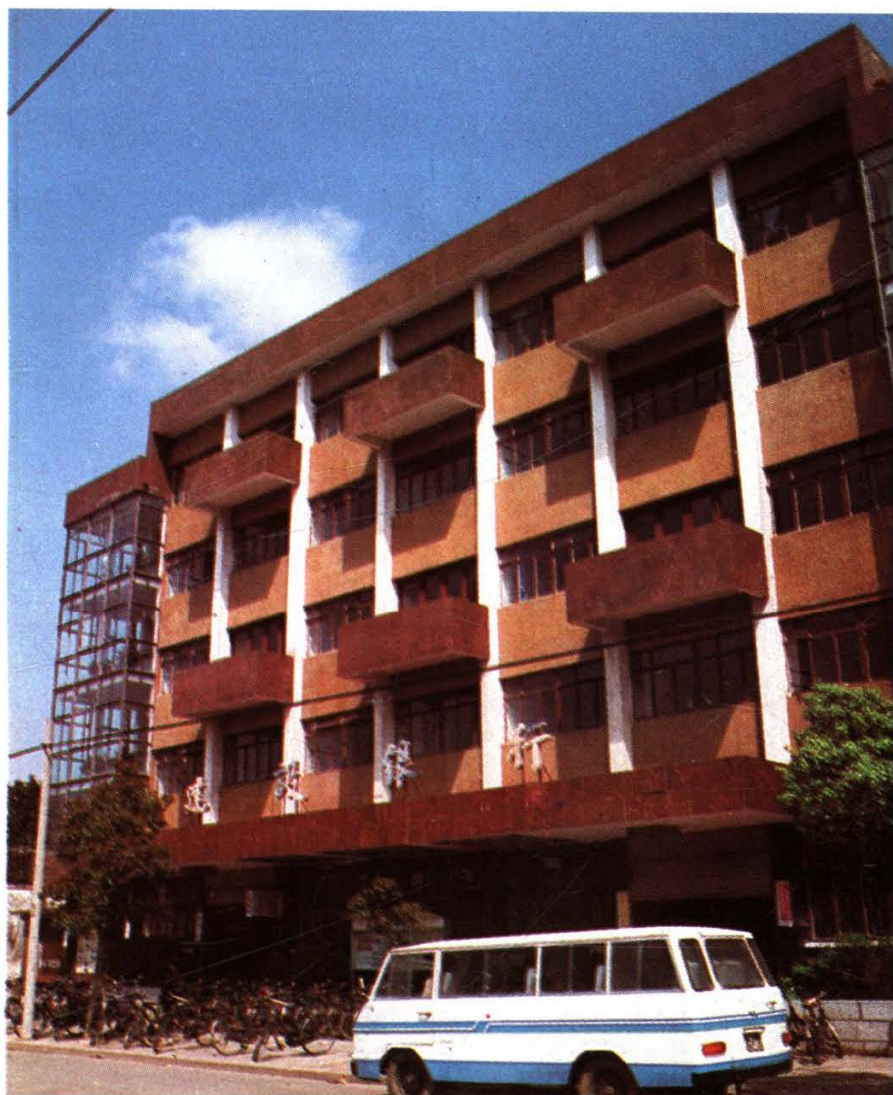
中国人民建设银行 舟山市支行大楼