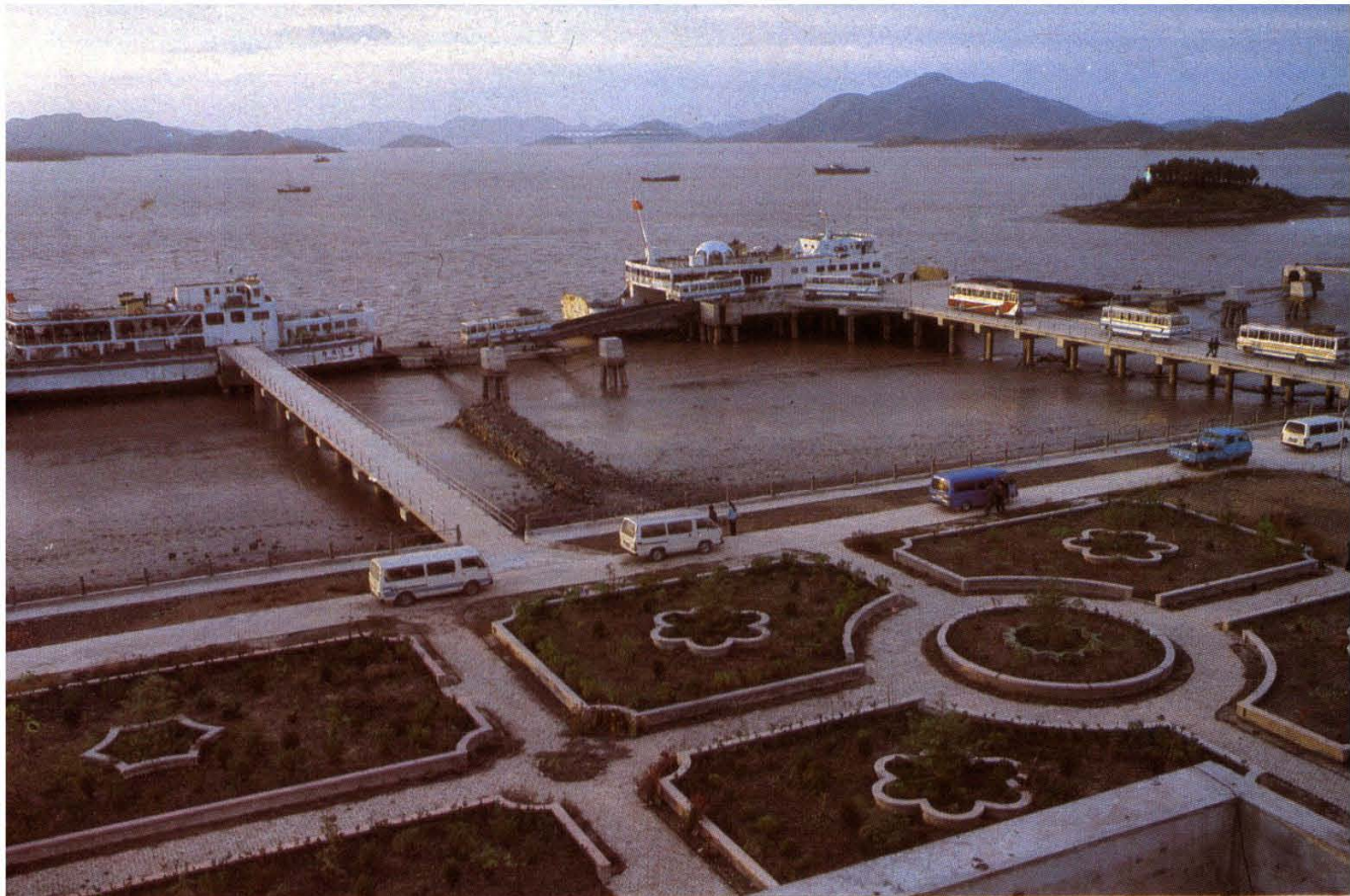
舟山海峡轮渡站 舟山师范专科学校