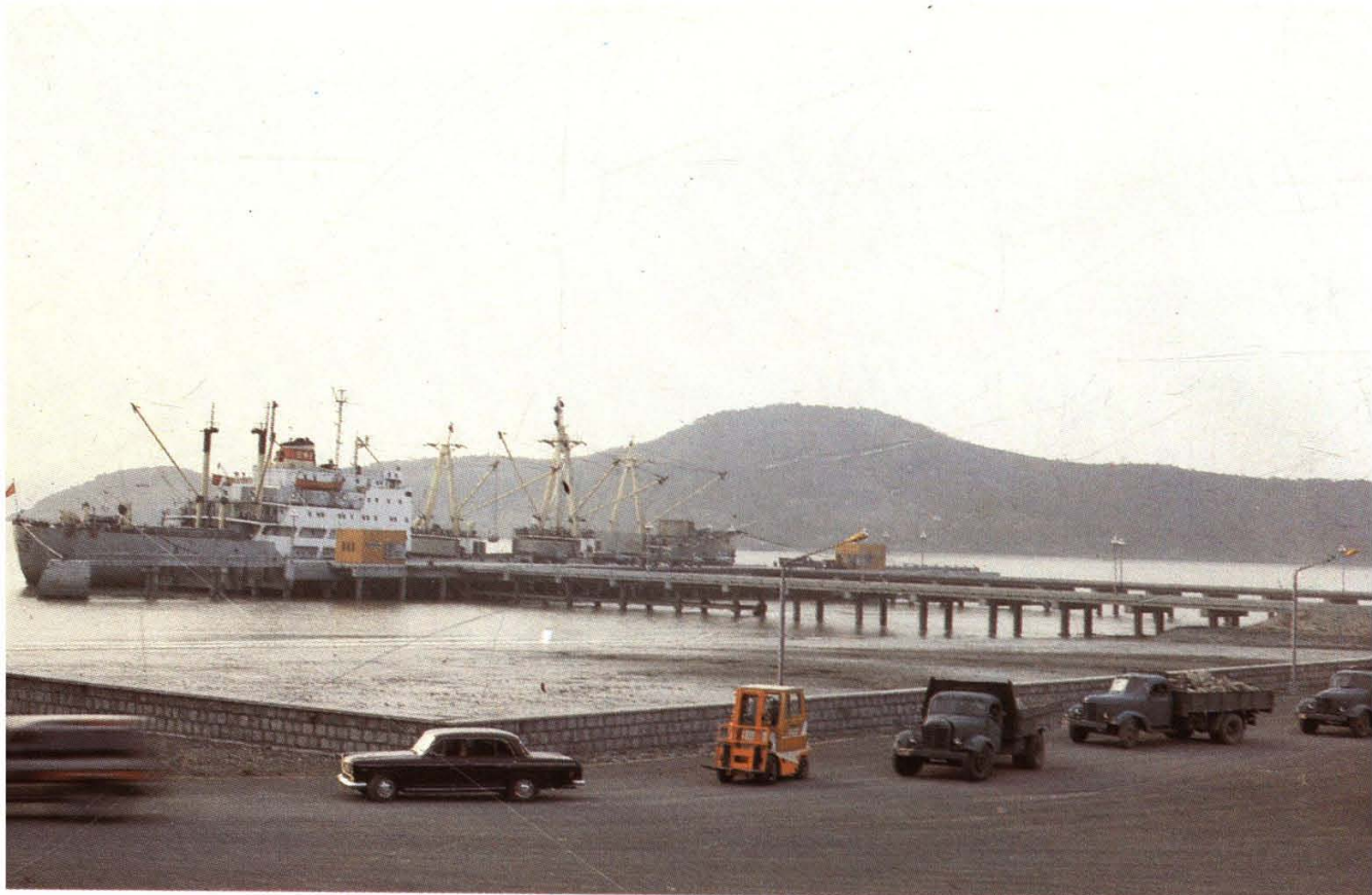
老塘山万吨级码头