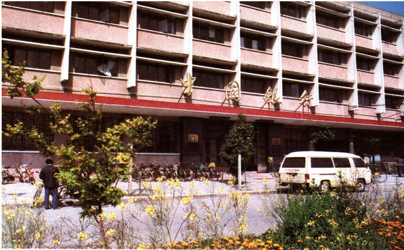
中国银行 舟山市支行大楼