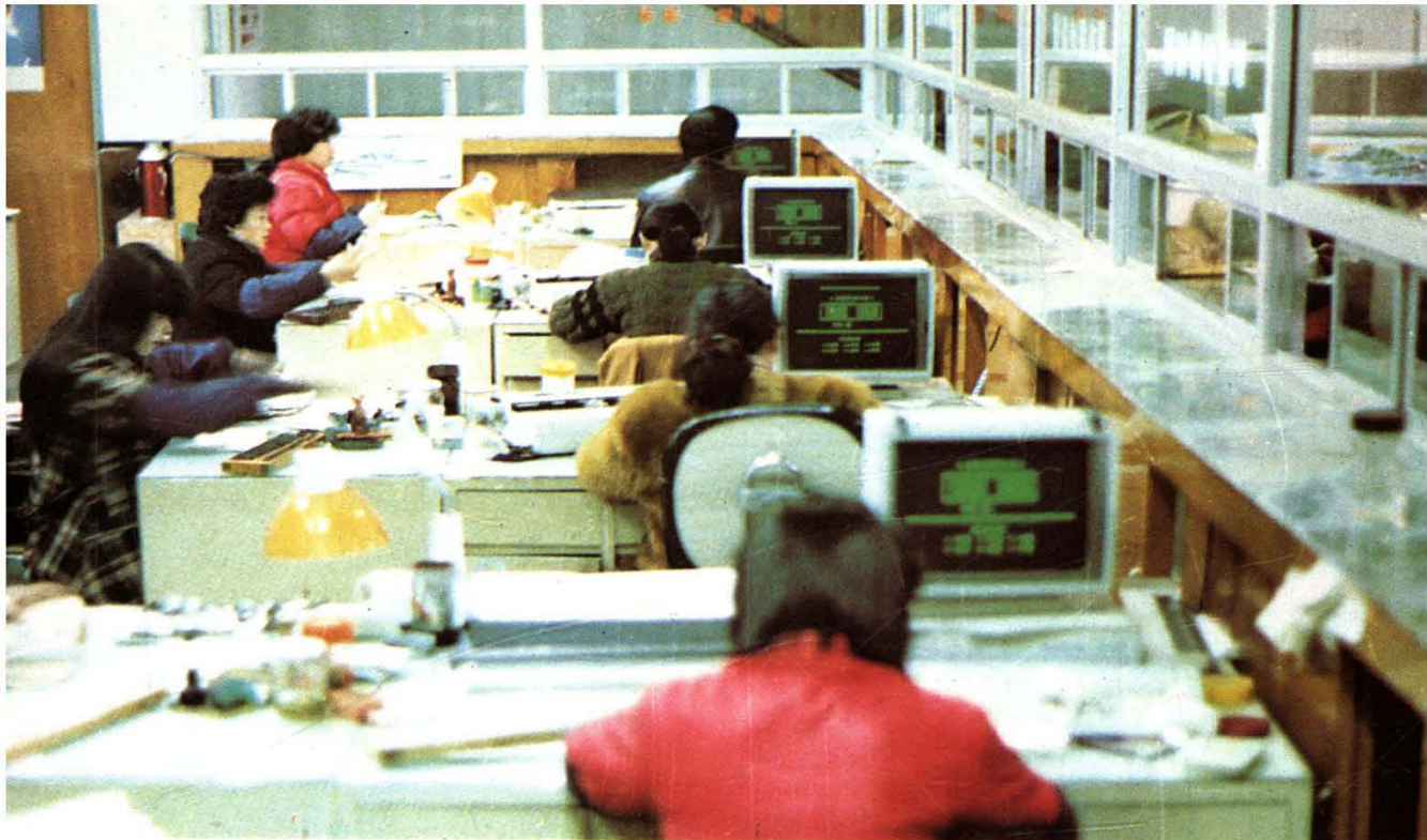
中国工商银行 舟山市支行 电子营业大厅