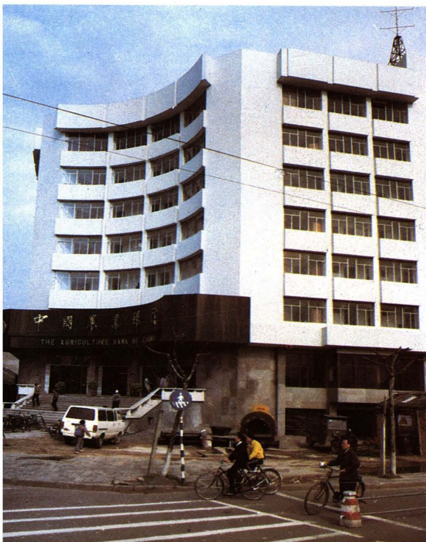
中国农业银行 舟山市支行大楼